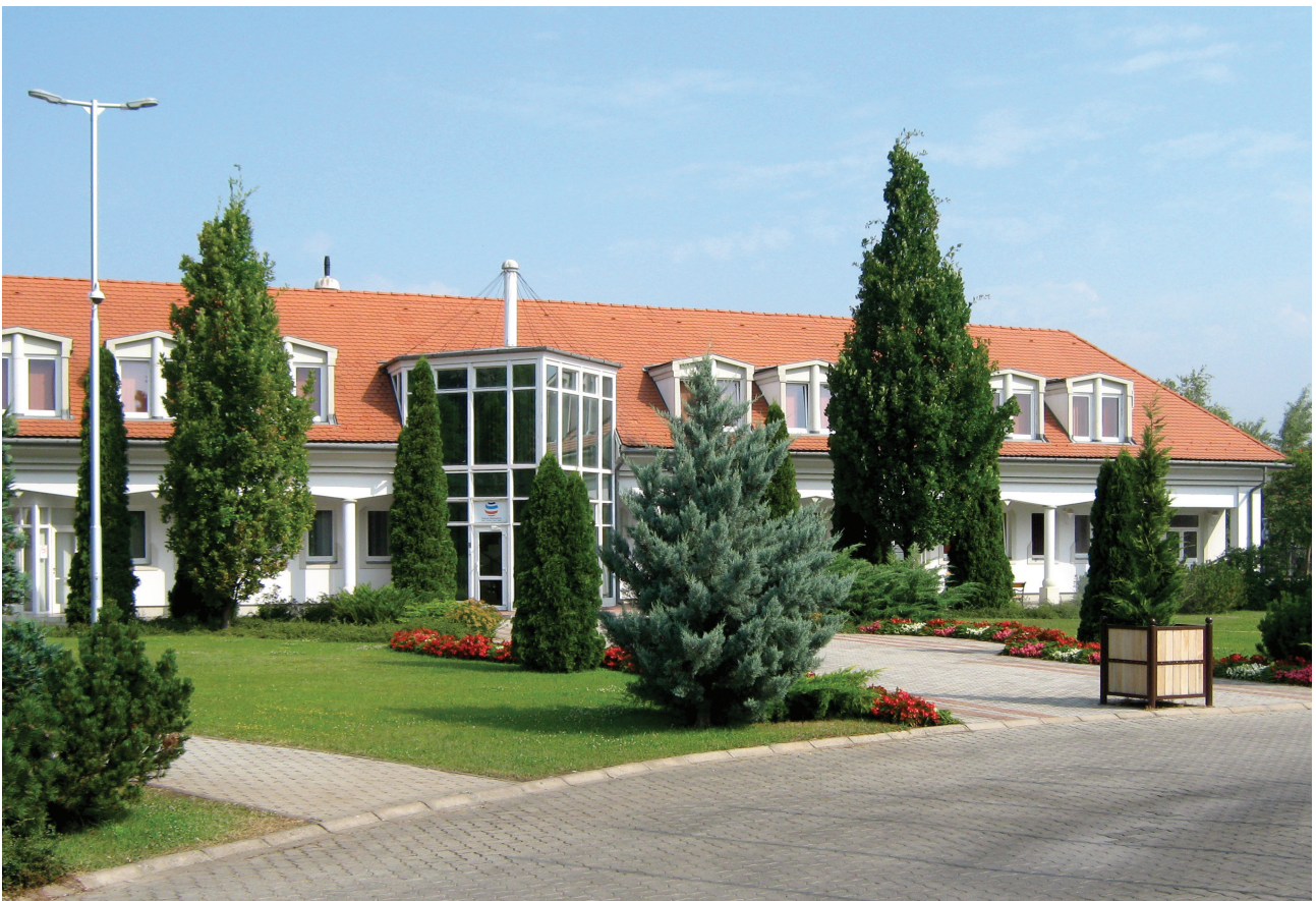
A Fehérvár Média Centrum szerkesztőségének épülete Székesfehérváron, a Szent Vendel utca 17/A alatt