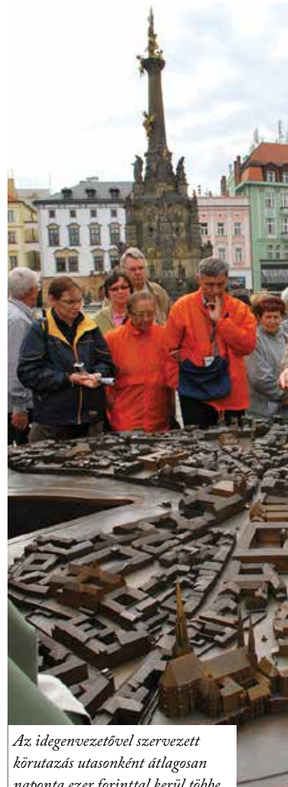
Az idegenvezetővel szervezett körutazás utasonként átlagosan naponta ezer forinttal kerül többé

Ezeknél a körutaknál a turistáknak nem kell utánanézni a nevezetességeknek vagy a szervezéssel bíbelődni. Csupán figyelniük, követniük kell az idegenvezetőt, és a legnagyobb kényelemben élvezni a látnivalókat.