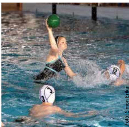
Lányok, fiúk, póló: nő a bázis

Ilyen vonzeró a magyar válogatott egy-egy meccse: a férfiak már többször játszottak a