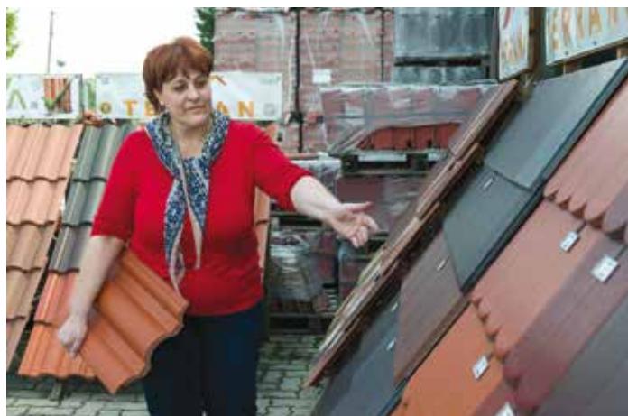
Széles színkálában készítik a cserepeket, sokszor a bőség zavara nehezíti a választást

A hetvenes, nyolcvanas években a magánépítkezések állandó anyaghiányban, nagyon lassan haladtak, mert a hetvenes években mindössze néhány szövetkezet foglalkozott családi ház építésével, így sok épület csak hétvégén épült. Ezek a házak mára renoválásra szorulnak, és