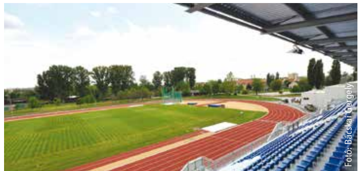
A lelátóról 830 ember drukkolhat egyszerre

cölöp alapokra helyezték, és vasalt talpgerendákkal lettek összekötve. Az összes bedolgozott betonacél 1090 tonna. A