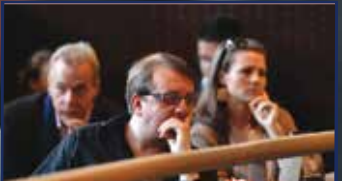
Új évad a közösség színházában 22. oldal