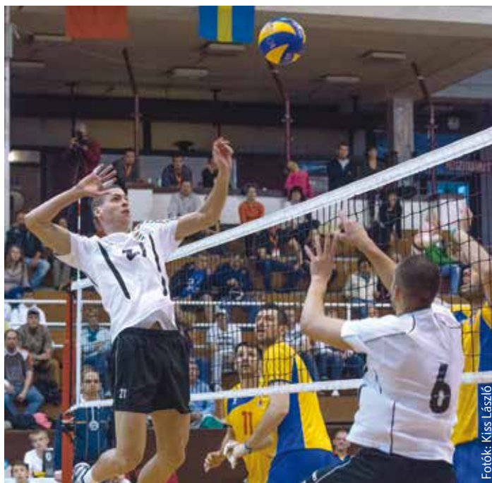
A fehér mezű magyar válogatott nagy csatát vívott a románokkal

A formálódó, rengeteg fiatal tehetséget felvonultató magyar együttes a nyitónapon a svédekkel találkozott. Az agresszívan nyitó és jól fogadó északiak szoros játszmák végén 3–0-ra nyertek. Az Izrael elleni találkozó előtt a sportág korábbi hazai klasszisaikat köszöntötték a Videoton Oktatási Központban. A meccsen aztán a mieink megnyerték az első játszmát, ám 1–2-nél már az egyenlítésért kellett küzdeniük. Ez végül sikerült is, de a döntő játszmát a vendégek bírták jobban, 3–2-re nyertek. A második nap éjszakája a sportág szerelmeseinek fesztiválját hozta. A röplabdások éjszakáján a kicsik és nagyok ütötték a labdát hajnalig. A torna záró napjának első meccsét a svédek nyerték Izrael ellen. A skandinávok ezzel megszerezték az Alba Regia Röplabda Gála második helyét. A magyar nemzeti együttes a két nap után hibátlan Románia ellen remekül kezdett. Sokáig vezettünk, ám az első szett hajráját megnyomták a vendégek, megszerezve ezzel a vezetést. A máso-