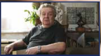
Törökkor Székesfehérváron 4-5. oldal