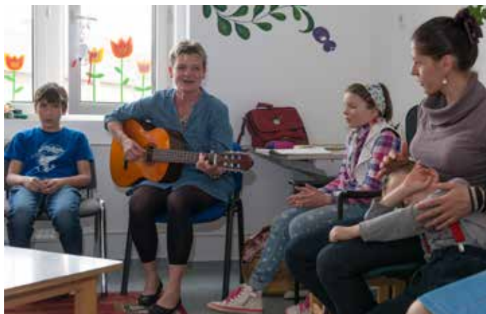
A mesékbe rejtett ősi kincsek olyan értéket képviselnek, amelyre minden embernek szüksége van, kortól, nemtől, vagyoni és társadalmi helyzetétől függetlenül

Hosszú éveken át tartó folyamatos képzés, gyakorlatszerzés és útkezesés után talákoztam a meseterápiával, és ebben találtam meg, amit mindig is kerestem. Az első meseterápiás csoportomat olyan óvodai nagycsoportosokból állítottam össze, akik nem mehettek iskolába. A gyerekek a szüleikkel