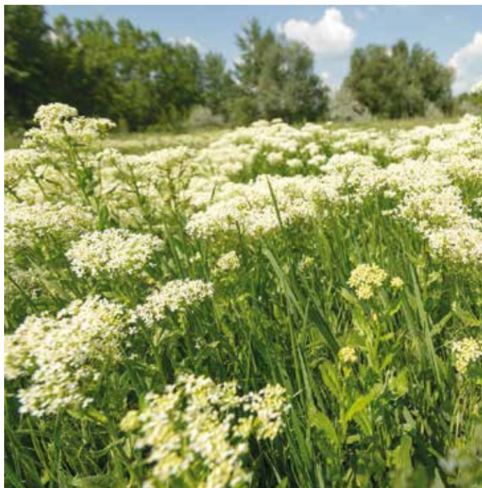
A következő hetekben fokozódik a pázsitfűfélék és a fenyőfélék pollenszórása