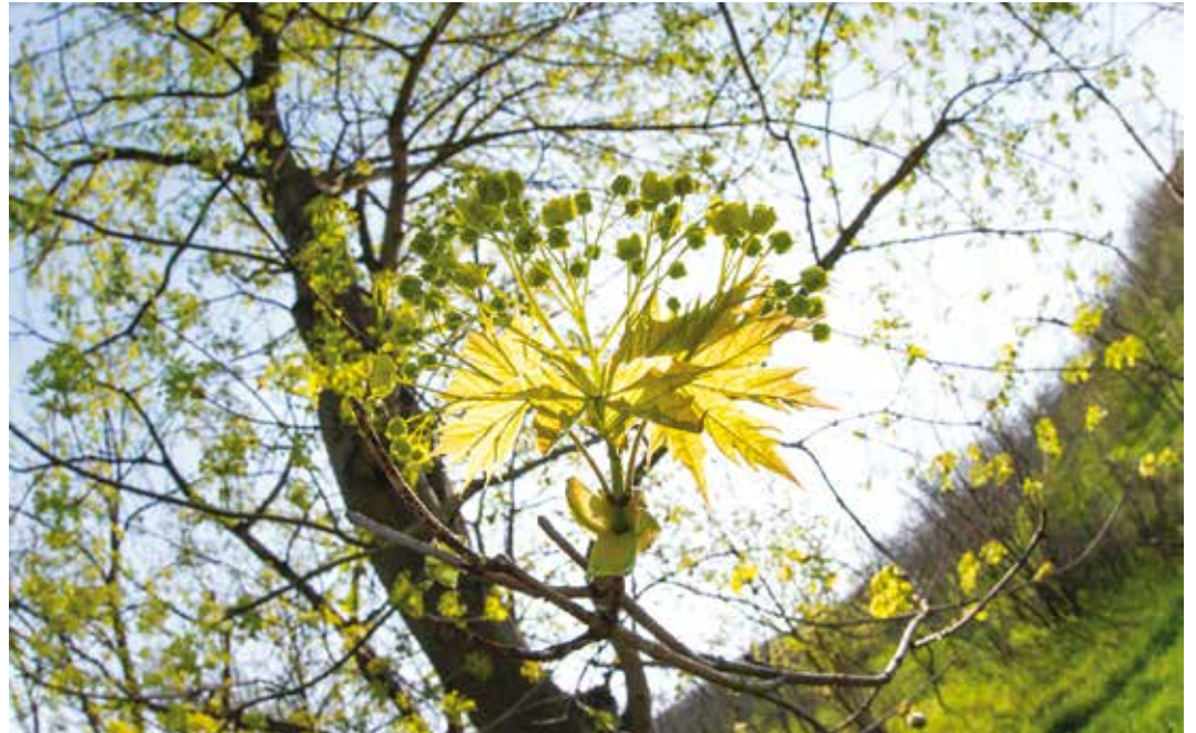
Bár a tavasz gyönyörű, sajnos a természet zöldbe borulásával sokak számára kezdetét veszi a kellemetlen allergiaszezon is

„Az allergia korai szakaszában antihisztamin kezelést szoktunk javasolni. Sokaknak elég ez a terápia. Ha valamelyik szerv allergiája súlyosodik, például kötőhártyagyulladás kíséri a tüneteket, akkor ki kell egészíteni a kezelést, és lokális szemcseppet vagy súlyosabb orrdugulás esetén orrsprayt, nazális szteroidot szoktunk alkalmazni.