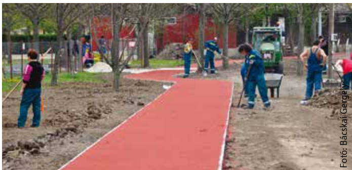
Az építkezéskor a környezetvédelemre is nagy hangsúlyt fektettek, minden meglévő fát megóvtak

A hobbisportolók a külső futópályát egész nap használhatják, kivéve, ha nagy versenyek zajlanak. A négy-száz-as versenypályát délután kettőtől este hétig használhatják az amatőrök. A minőség hosszútávú megőrzésének érdekében kihelyezett táblákon kéri a futókat, hogy ne lépjenek a versenypályára sáros cipővel. Azok a sportolók, akik belépnek az ARÁK tagjai közé, mindent használhatnak. A feltételek részleteiről bővebb információ a sportcentrumban kapható.