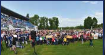
Idén is teljes volt a paletta a sportmajálison 26-28. oldal

„Lehetne szebb, lehetne jobb, de álmodni csak itt tudok!”