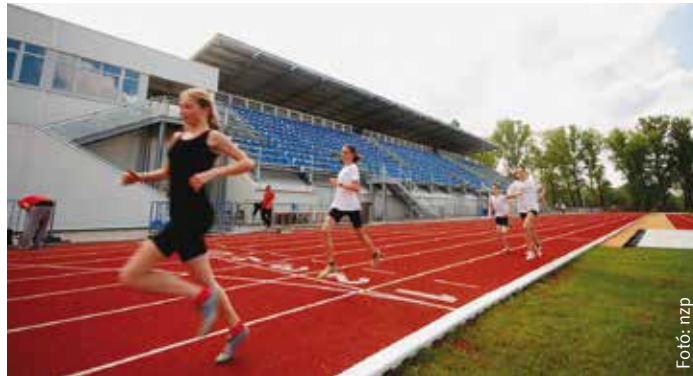
A futás szerelmesei birtokba vették a futópályákat

Május elsején közel ezeröt-száz sportoló sétált, kerékpározott vagy görkorcsolyázott a Bregyóba, ahol ünnepélyes keretek között adták át a külső futópályát. A beruházáshoz az Emberi Erőforrások Minisztériuma 740 millió forintos támogatást nyújtott, a város további 210 millió forintot biztosított. Ahhoz, hogy ez a terület elnyerje mostani formáját, két éven keresztül dolgoztak a szakemberek. Tizenkét hónapot vett igénybe a kivitelezés, amelyet úgy kellett végrehajtani, hogy a környezetben ne tegyenek kárt. A meglévő fákat megóvták, az amatőr futópálya a fák lombjai alatt halad, két méter szélesen és hatszáz méter hosszán. Azok, akik kicsit a természetbe vágynak, választhatják a szomszédos erdő felé vezető utat, ahol táblákkal jelölik, milyen hosszú pálya áll rendelkezésre azon a szakaszon. Összesen 4250 köbméter földet kellett megmozgatni a munkálatok során (ezt a földmennyiséget 17.963.705 bögrébe tudnánk elhelyezni).