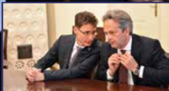
Honvédelmi Minisztérium Fehérváron 3. oldal