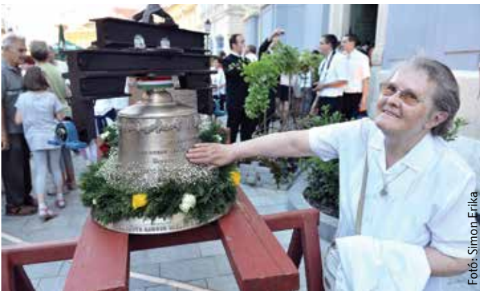
A megszentelt legkisebb harang, amelyet Szent Tamás nevére kereszteltek, várja az emelkedést