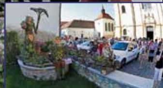
Nyitva van az aranykapu 6. oldal