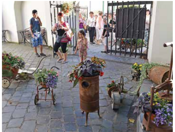
Idén kapukat és udvarokat díszítettek a virágkötők

Ebben az évben már tizedik alkalommal rendezték meg a programsorozatot a városban. Pénteken öt óraker a megyés püspök és a polgármester nyitotta meg ünnepélyesen a rendezvényt. Az idei év mottója a „Nyitva van az aranykapu”. Ennek megfelelően kapukat és belső