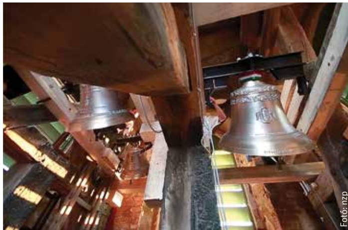
A Szentháromság, Szent István és Szent Tamás harangok péntek este együtt zúgtak a templom tornyában

Nem mindennapi látványnak lehettek tanúi, akik a pénteki alkonyatkor a Fő utcán várták a