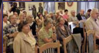
Értékek mentén a magyar irodalomért 5. oldal