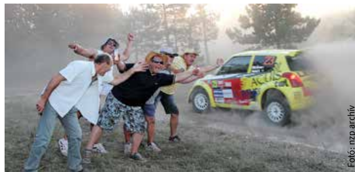
A drukkereken nem múlik a siker