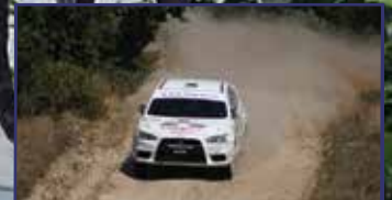
Péntektől ismét Rallye Székesfehérváron 13. oldal