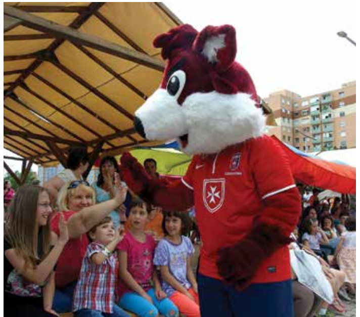
Igazi közösségépítő programot szervezett a LISZI