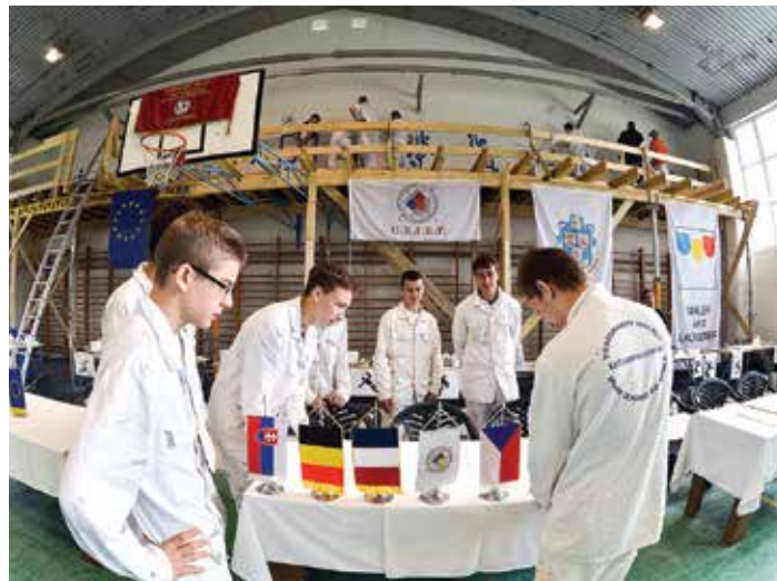
Hét ország diákjai, oktató és szakmai szervezetei képviselték magukat a fehérvári táborban

A hét ország diákjainak, tanárainak és szakmai szervezeteinek részvételével zajló nemzetközi festőtáborba a Fehérvár magazin stábjja is ellátogatott. Asztalok, állványok, mész- és festékszag, szorgoskodó fiatalok, könynyed hangulat. Ez a látvány tárult elénk a Vörösmarty iskola