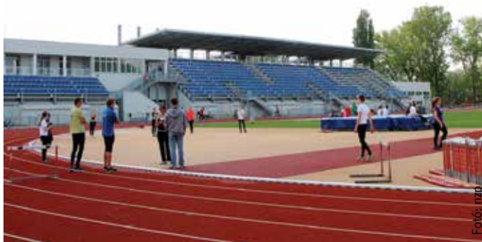
Július 10-től 15-ig az öttusázóké lesz a pálya