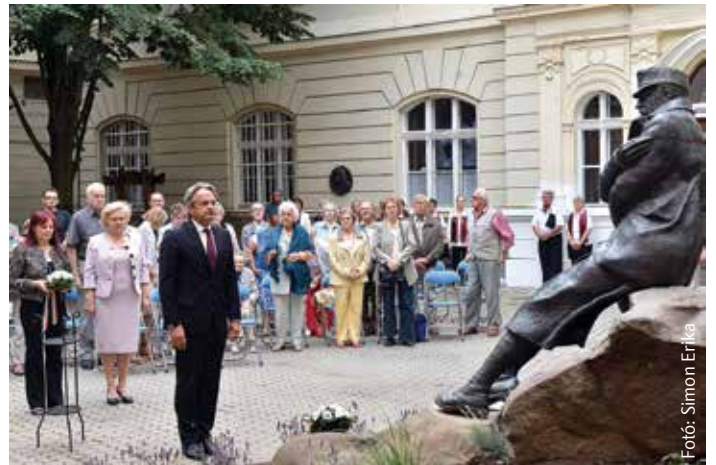
Tisztelet Gyóni Gézának és a hősöknek

Vargha Tamás kiemelte, hogy a krisztusi korban, 33 esztendősen elhunyt hős máig példakép. Az első nagy világháborús áldozatának versei, írásai máig kísértenek bennünket. Tűnődő, töprengő gondolatai prózában és versben is megmutatják, milyen lehetett a lengyelországi Przemysl városában védeni a hazát. A tábortűz mellett született verseket 1915 márciusában adta ki az Országos Hadsegélyező Bizottság. A fronton harcoló magyar honvédek nevében Rákosi Jenő így írt a kötetéről: „Az északi harctér ágyúdörgése közt, tűzeben és füstfelhőiben szállt fel egy relatív ismeretlenségéből egyszerre Gyóni Géza neve és költészete országos hírnévre.”