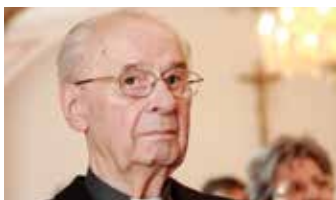
Takács Nándor, akit 1989. február 11-én szenteltek püspökké, 1991-től 2003-ig vezette a Székesfehérvári Egyházmegyét

Az egykori karmelita rendházat 1732 és 1735 között építették. Szemináriumában, Székesfehérvár első felsőoktatási intézményében a papok képzése folyt. Az egyházakkal való, háború utáni leszámolás miatt a papi oktatás megszűnt Fehérváron, de Sztálin halálával, Rákosi első bukásával némiképp enyhült a fojtás. A papi otthon alapítása-