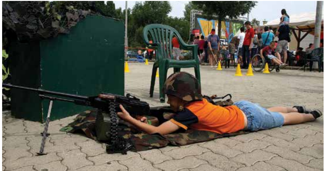
A fegyveres testületek világába is bepillanthattak a gyerekek

A legkisebbek az ugrálóváron dolgozták fel fölösleges energiáikat, de a nagyobb gyermekek is jól érezték magukat a Vízivárosi Kölyök Juniálison. Az esélyegyenlőség jegyében több program várta az érdeklődőket. A vállalkozó kedvű gyermekek saját bőrükön tapasztalhatták meg, milyen a mozgássérült vagy a látássérült emberek élete,