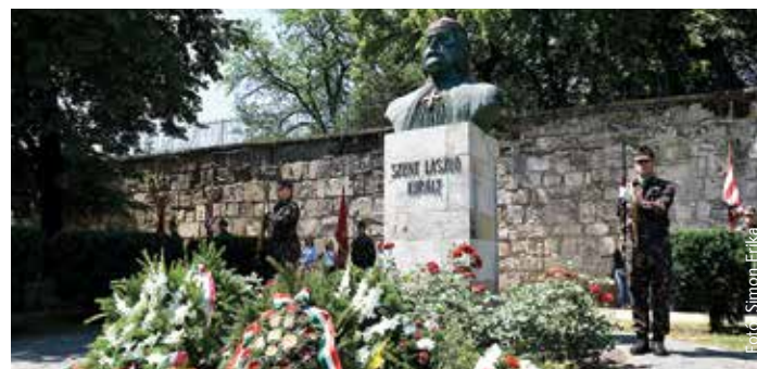
Szent Lászlót a magyar katonaság védőszentjeként tiszteli