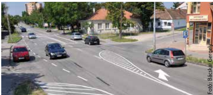
Biztonságosabb az út a lekanyarodó sávok és a közép-szigetes gyalogos átkelőhely miatt

tes gyalogátkelőhelyet alakítottak ki burkolattal festéssel, továbbá balra kanyarodó sáv van a Csutora utca felé. A változtatással egyrészt egységesebb lett a forgalmi rend, ami a már felújított szakaszon is kialakult, másrészt pedig jóval biztonságosabb az út a lekanyarodó sávok és a közép-szigetes gyalogos átkelőhely miatt. Székesfehérvár Város-gondnoksága ezúton is felhívja a figyelmét az autósoknak, hogy körültekintően közlekedjenek a megváltozott forgalmi rend szerint!