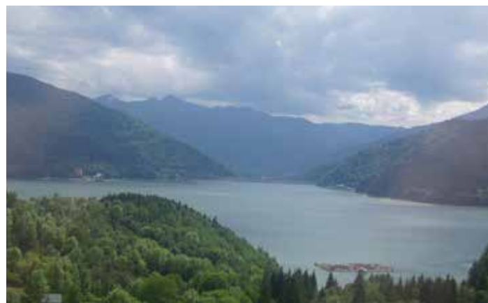
Békás-tó madártávlatból, háttérben a duzzasztógát