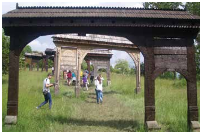
Szejkefürdői székelypark „alagút”

Másnap reggel megcsodáltuk Marosvásárhely virágos főterét. Egy belvárosi séta után indulunk következő állomásunk-