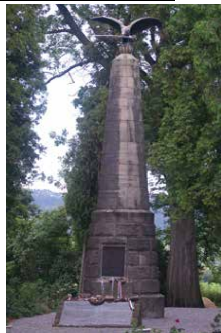
Obeliszk Petőfi Sándor és a segesvári csatában elesett névtelen hősök emlékére Fehéregyházán

Az utolsó napot Hunyadi Mátyás és Bocskai István szülőhelyén, Kolozsváron töltöttük. Az utolsó csoportkép a főtéren készült, Mátyás király szobra alatt. Belekóstolva a magyar történelem e fejezetébe, új barátokat szerezve, élményekben, ismeretekben gazdagon tértünk haza Székesfehérvárra. A „Határtalanul” program elérte célját.