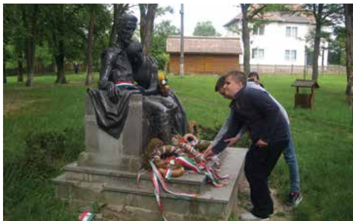
Koszorúzás Koltón a Petőfi Sándor–Szendrey Júlia szobornál

ahol Petőfi Sándor töltötte „mézes heteit” feleségével Szendrey Júliával – ami jelenleg múzeum. A kastély kertjében áll Petőfi és Szendrey Júlia egyetlen teljes alakos közös szobra, ami egyedülálló a világon. A parkban található az a somfa, amely alatt lévő kőasztalnál írta Petőfi a verseit, köztük a magyar irodalom egyik legszebb szerelmes versét, a Szeptember végén címűt. Nagybányán átsétálva a Zazar folyó hídján, a Főtérré érkezünk, innen ellátogattunk a skanzenbe. Nyagybányáról indulva, érintve Besztercét, megérkeztünk Gyergyószentmiklósról. Az itt eltöltött három nap eseményekben gazdagon telt. A gyergyó-