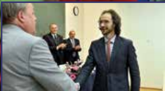
Megalakult az Alba Regia Műszaki Kar 2. oldal