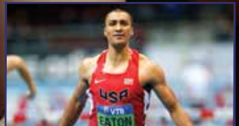
Gyulai Memorial: parádés mezőny 13. oldal