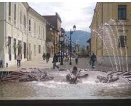
Nagybánya főterén a város hatszögletű pecsétjének mintájára készült szökőkút

Koltón megtekintettük a Teleki Sándor birtokán álló kastélyt, –