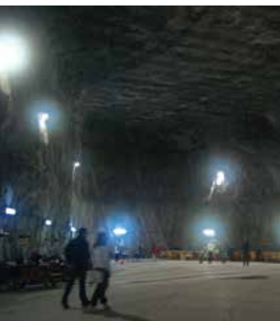
A parajdi sóbánya hatalmas termében törpéknek tűnnek az emberek

Küküllő és a Korond-patak völgyében található. Lenyűgöző volt a parajdi sóbánya hatalmas csarnokaiban sétálni. Délután megérkeztünk a fazekasság „fellegvárába” Korondra. Itt megcsodáltuk a kézműves alkotásokat és szert tettünk egy-egy ajándéktárgyra. Szejkefürdő, Székelykeresztúr és Fehéregyháza érintésével estére értünk Marosvásárhelyre.