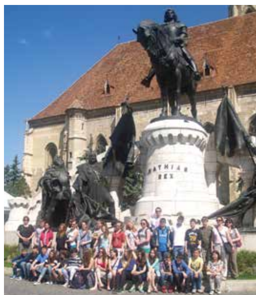
Csoportkép Mátyás király lovasszobránál Kolozsváron