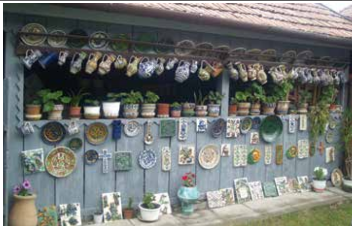
A korondi fazekas Páll család házábanak kerámiákkal díszített udvara