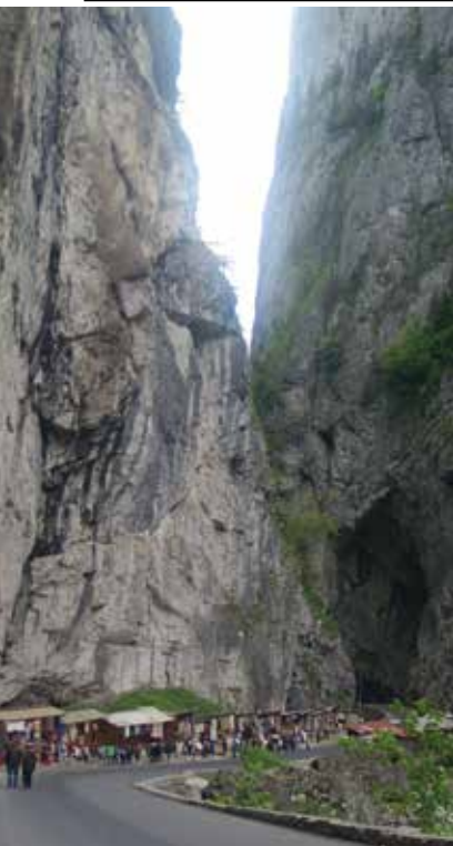
Békás-szoros helyenként függőleges sziklafalakkal

Küküllő és a Korond-patak völgyében található. Lenyűgöző volt a parajdi sóbánya hatalmas csarnokaiban sétálni. Délután megérkeztünk a fazekasság „fellegvárába” Korondra. Itt megcsodáltuk a kézműves alkotásokat és szert tettünk egy-egy ajándéktárgyra. Szejkefürdő, Székelykeresztúr és Fehéregyháza érintésével estére értünk Marosvásárhelyre.