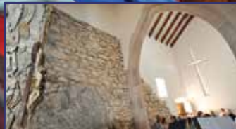
Különleges várkapolna Csókán 12. oldal