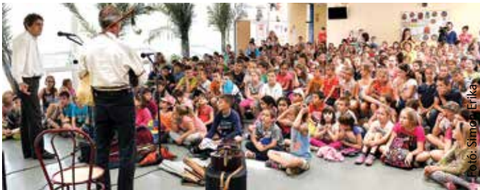
A táborozóknak egy fő feladatuk lesz: érezzék jól magukat!

zenés műsorok lesznek, az első turnusban, július 2-án a Kákics Együttes készült zenés népművel. Rajtuk kívül még számtalan szervezet ajánlotta fel segítségét, például lesz rendőrségi, mentős és tűzoltó bemutató is. A lurkók mehetnek majd a városi strandra, a Hetedhét Játékmúzeumba és a Városi Képtárba is. A tábor költsége megegyezik a mindenkori napközis díjjal, de a nagycsaládok felárán, a szociálisan rászorulóknak pedig akár térítésmentesen is táborozhatnak. Jelentkezni legalább 72 órával a táborozás megkezdése előtt, személyesen a Bregyó-közportáján vagy e-mailben lehet.