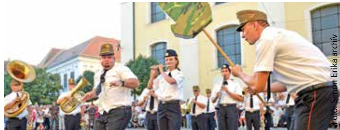
Gyepszhow a tavalyi katonazenekari fesztiválon. Idén is lesznek ehhez hasonló látványos elemek.

Részletes programok: www.szekesfehervar.hu