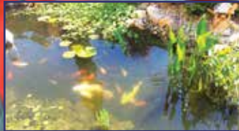
Egy tó a kert gyönyörű éke 10. oldal