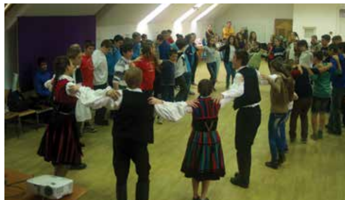
A gyergyószentmiklósi és a székesfehérvári gyerekek közös tánc

ahol Petőfi Sándor töltötte „mézes heteit” feleségével Szendrey Júliával – ami jelenleg múzeum. A kastély kertjében áll Petőfi és Szendrey Júlia egyetlen teljes alakos közös szobra, ami egyedülálló a világon. A parkban található az a somfa, amely alatt lévő kőasztalnál írta Petőfi a verseit, köztük a magyar irodalom egyik legszebb szerelmes versét, a Szeptember végén címűt. Nagybányán átsétálva a Zazar folyó hídján, a Főtérré érkezünk, innen ellátogattunk a skanzenbe. Nyagybányáról indulva, érintve Besztercét, megérkeztünk Gyergyószentmiklósról. Az itt eltöltött három nap eseményekben gazdagon telt. A gyergyó-