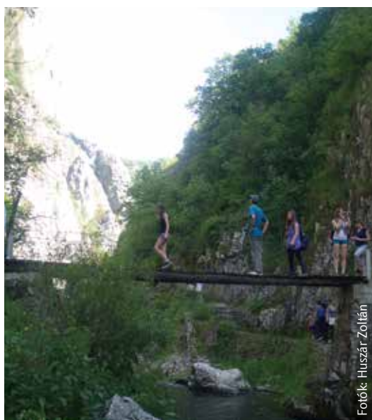
Függőhíd a tordai-hasadékban, alatta a Hesdát patak kanyarog

hoz, a Tordai-hasadékhoz, mely lélegzetelállító geológiai képződmény, gazdag növény- és lepkevilággal.