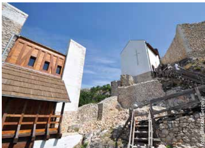
A különleges kápolna mostantól már a nagyközönség számára is látogatható