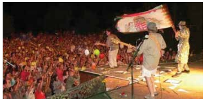
Az R-GO együttes idén is fergeteges koncertre készül

nyaranta a különleges hangulatú koncerteken. Magyarország legmagasabb állandó színpada 2014-ben is várja a szórakozni vágyókat. Minden zenei stílus kedvelője megtalálja majd számításait a Popstrandon. Július 12-én a Neoton együttes és Janicsák Veca, 19-én az Irigy Hónaljmirigy és a Keresztes Ildikó Band, 26-án Demjén Ferenc és Radics Gigi lép a színpadra. Augusztus 2-án az R-GO és a By The Way gondoskodik a felhőtlen kikapcsolódásról Agárdon.