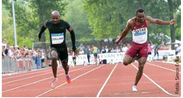
Kim Collins (balra) 38 éves és villámgyors: megvédte címét 100 méteren