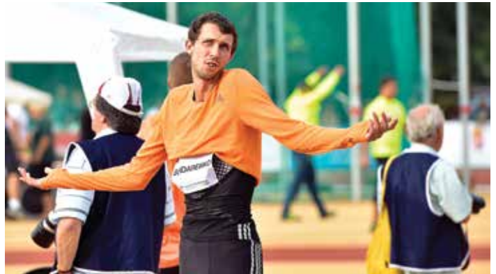
Nem kell mentetgetőzni: Bohdan Bondarenko olyan magasra ugrott (238 cm), mint Magyarországon még senki