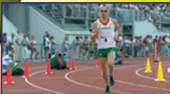
Egy eb az EB negatív hőse, de a férfiak bearanyozták a hétvégét 15. oldal