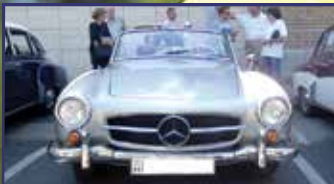
Időutazás veteránok volánjánál 8. oldal