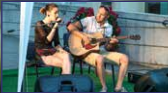
„KultúrKorzózzunk” együtt! 4. oldal