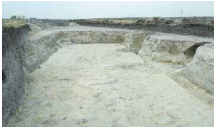
A korszakban teljesen egyedülállónak mondható és méretében teljesen kirívó Árpád-kori épület maradványai kerültek elő

Fehérvár város területén belül a királyi várost leszámítva, ez a második ilyen kora Árpád-kori településnyom. „Mintegy harminc darab félig földbe mélyített kora Árpád-kori épület maradványait tártuk fel a kollégákkal. Feltártunk egy tizenegy és fél méterszer