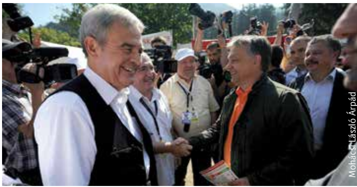
Tökés László és Orbán Viktor látogatására az idén is számíthatnak a táborozók

Átmenet a diktatúrából a demokráciába – ezzel a címmel