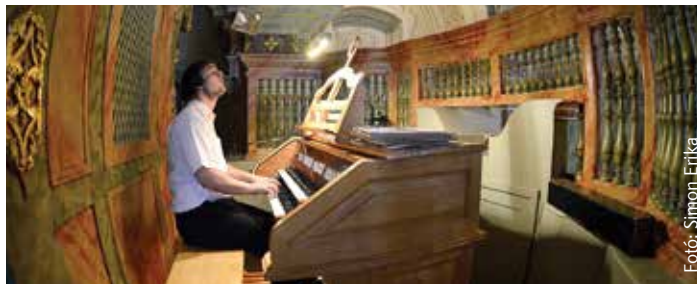
A lélek hangjai szólaltak meg a Szent Imre templomban

egyedülálló csoda, amit csak akkor élhetünk meg, ha elsőként és először odaadjuk magunkat a csendnek, hogy aztán boldogságimát rebejjünk lehajtott fővel, némán.