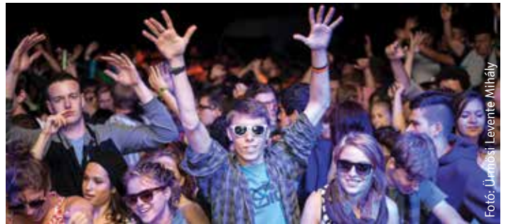
A komoly és tartalmas nappalokat a legnevesebb zenekarok fellépései követik a történelmi Magyarország területéről. A koncertek után indul a buli a Csűrben, ami általában csak reggel hat körül kezd kifulladásra.

nyújt tartalmas és igényes nyári szórakozást immár negyedszázada, komoly politikai események helyszíne is: évről-évre megfordulnak itt a vezető román és magyar politikusok, utóbbiak a határ mindkét oldaláról.