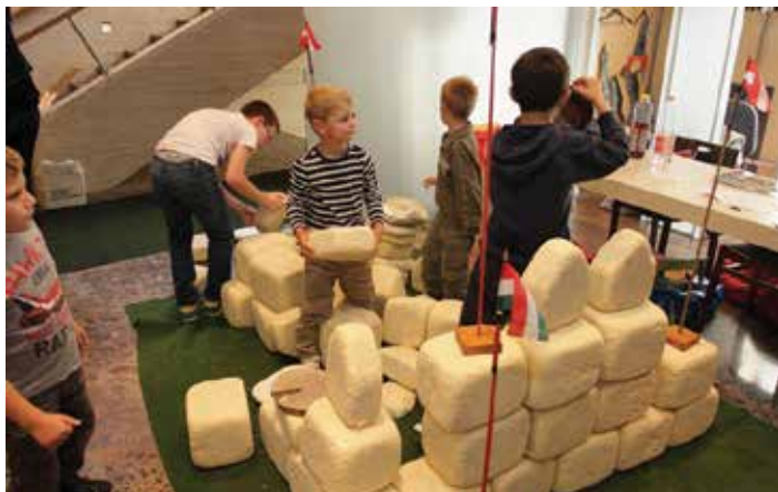
A Vörösmarty Színház falai között várak épültek, ahol a legifjabb építészek nemcsak a falrakást, de a harcos történiákat is megismerhették