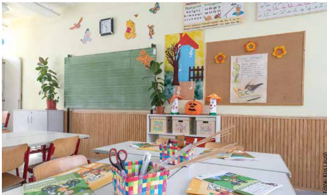
Néhány napig még üresek a padok, de hamarosan beindul az élet az iskolákban

Kis odafigyeléssel és rákészüléssel azonban enyhíthető az iskolakezdés traumája. Bár a nyári szünet az iskolásoknak a pihenésről, lazításról szól leginkább, érdemes a gyerekeket a szünidő végén felkészíteni az új körülményekre, legyen szó elsős vagy akár nagyobb tanulókról. Még a tanévkezdés előtt be lehet csempészni a napirendbe olyan trükköket, melyekkel észrevétlenül készíthetjük fel a gyerekeket a tanulási időszakban rájuk váró feladatokra. Érdemes ilyenkor szakértők tanácsát