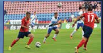
Kiütéssel robogott tovább a Vidi-expressz 31. oldal

facebook Fehérvár Média centrum – minden, ami Fehérvár! • Keresz minket a facebookon is!