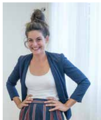
Dér Adrienn színes egyéniség, aki mindenképp felettébb tiszteli a követeket, mert hogy a kő marad

kegyelmi állapotából kitekintve fontos, hogy más, ahhoz illeszkedő programba is betekintést nyerjünk. Ennek tükrében köszönhetjük meg Joseph Longoriának, hogy eljött közénk. Alkotásai a rendezőknek köszönhetően nem bánatfalakon lógnak, sokkal inkább körülvesznek bennünket. Ennek köszönhetően, miközben