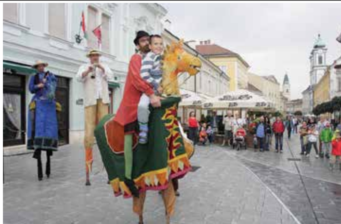
Alakoskodók, muzikusok, pantomimesek térültek-fordultak a Belváros új kövezetén, melyen a többség jót mulatott, bár olyan is akadt, aki félt tőlük