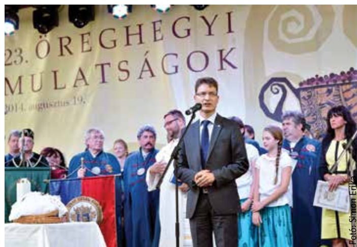
Városunk polgármestere nem hagyott kétséget afelől, hogy 2015-ben a 24. születésnapját ünneplheti az Öreghegyi Mulatságok rendezvénye