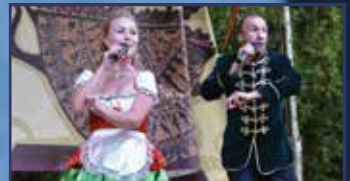
Öreghegyi multságok 2014 20-21. oldal