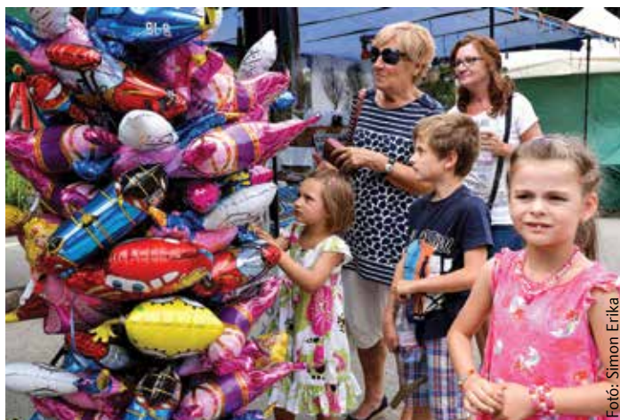
A legkisebb korosztály is megtalálta a kedvére valót

A hétköznapokon üres Borytér augusztus 19-én megtelt étellel. A mestert megidéző szobor környékén megannyi székesfehérvári polgár és látogató tette tiszteletét az Öreghegyi Mulatságokon. A környező utcák is megteltek étellel, és az igényes programok közül minden korosztály talált kedvére valót. Megcsodálhattuk a borrendek