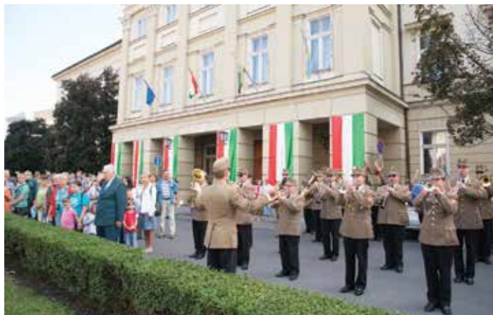
Miközben felbolydult a város, ünnepi koszorúzáson emlékeztek meg a megyeháza előtti téren államalapító királyunkról