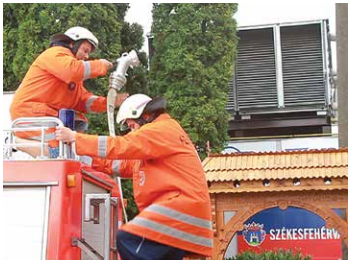
A tűzoltók ezúttal nem tüzet, hanem jégkorongozót „oltottak”

Az Ice Bucket Challenge-akcióval az ALS-ben (amiotrófiás laterálszklerózis – az idegek elsorvadásával járó súlyos és egyelőre gyógyíthatatlan betegség) szenvedőkre kívánják felhívni a figyelmet úgy, hogy a vállalkozó személy leönti magát egy teli vödör jeges vízzel. A feladathoz tartozik, hogy a végén meg kell nevezni további három személyt, valamint tíz dollárral hozzá kell járulni a betegség elleni küzdelemhez. A megbízást 24 órán belül teljesíteni kell. Amennyiben valaki a kihívásnak