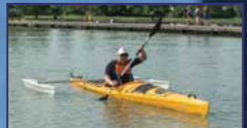
Példás tanuló az élet iskolájában 10-11. oldal