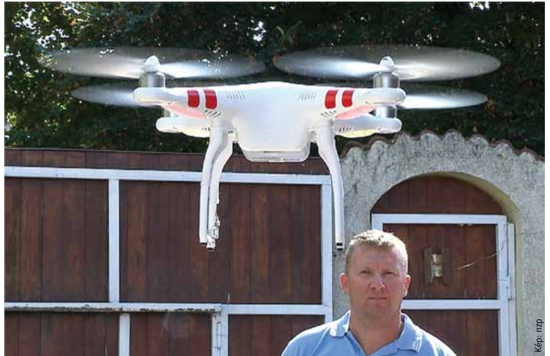
A drón, ami szállítja a fagylaltot, és a fejlesztő, aki autodidakta módon tanulta meg ezt a mesterséget

Hetente két alkalommal két órát evezek, persze ha az időjárás engedi. Másik két nap úszom, ezért jövök csak ennyit ide. Arról nem is beszélve, hogy a munkával is kell foglalkozni.