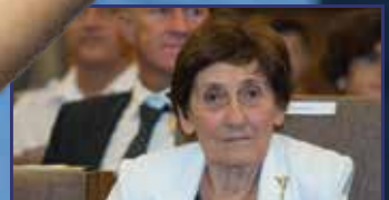
Székesfehérvár díjazottjai 7-9. oldal