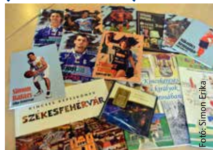
Fehérvári füzetek és ajándék kiadványok iskolásoknak és óvodásoknak

Fehérvári sportolók szerepelnek azoknak a füzeteknek a borítóján, melyekből minden alsó tagozatos diák két darabot kap iskolakezdéskor. A város több más kiadvánnyal is kedveskedik a fehérvári gyerekeknek, fiataloknak. Ezek mind erősítik a gyermekek Székesfehérvárhoz való kötődését.