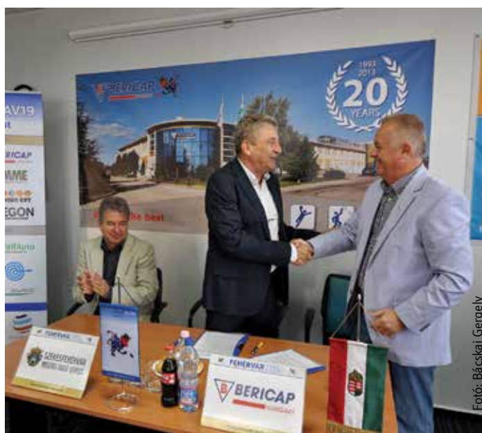
Az együttműködés folytatódik

A csapat pedig újabb két edzőmeccsel hangolt, a Volán csütörtökön és pénteken is öt gólt ütve verte a szlovák Gyetva együttesét, előbb egyet, majd hármat kapva.