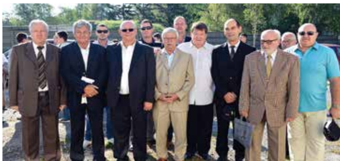
Íme az egykor csúcson lévő kézilabda csapat