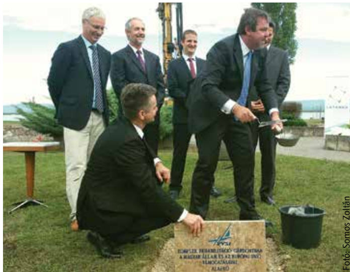
Államtitkári kézben a kőműves szerszámok: alapkövetétel Agárdon

Az elmúlt negyven esztendő fotóit és a jelenlegi telep helyszínrajzát zárták be abba az időkapuszulába, amely az új épület alapköve mellett kapott helyet. Az ünnepélyes mozzanatot a bontás végét és az építés kezdetét jelenti a Velencei-tavi Vízi Sportiskolában. A felújításnak köszönhetően a létesítmény sportközponti funkciója rehabilitációs tevékenységgel bővül. Soltész Miklós, az Emberi Erőforrások Minisztériumának államtitkára ennek kapcsán azt mondta, egyedülálló lehetőséghez, európai színvonalú szolgál-