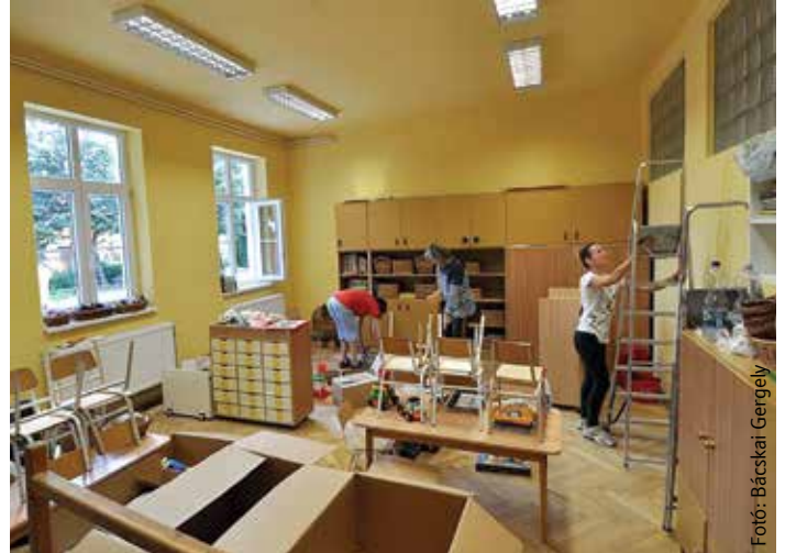
Az óvodai dolgozók a felújítás utáni takarításban, pakolásban segítettek, de az ovis gyerekek szülei is kivették a részüket a munkából