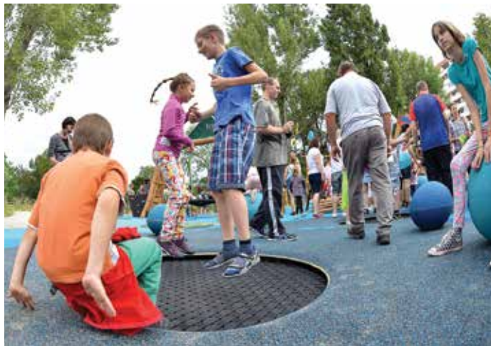
Az ugrálóból rugalmas felülete kíméli az ízületeket

A ritmusérzék fejlesztésének célja az érzékelési készség megalapozása, a spontán mozgásöttonök koordinálása, a mozgások harmonikussá tétele. A mérleghinta és az ugrálóeszközök kiválóan alkalmasak ennek fejlesztésére, ami később, iskolás korban az olvasásnál fontos szerepet játszik. A téli időszakban, amikor nem jutunk el a játszótérre, mondóák, versek memorizálásával akár otthon is elősegíthetjük a részképességek fejlődését.