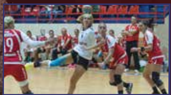
A tizenegyedik győztes rajt 31. oldal