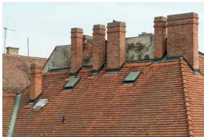
A kémények ellenőrzését minden évben, még a fűtőszézon előtt el kell végeztetni. A lakók érdeke, hogy a kéményseprő elvégezhesse a munkáját.

kell eljárnia. Minden esetben meg kell vizsgáltatni a gáz- és szilárd tüzelésű készülékeket és a kéményeket. A falak, ajtók, ablakok jó szigetelése segít megőrizni az otthon melegét, de azokban a lakásokban, ahol nyílt égésterű kazánok biztosítják a fűtést, az ellenőrzésre fokozott figyelmet kell fordítani. A gravitációs elven működő kémények átjárhatóságát a kéményseprők ellenőrzik, a gázkészülékeket az első begyújtás előtt szakemberrel kell tisztíttatni, beszügyeltetni és bevizsgáltatni. Egy gondos