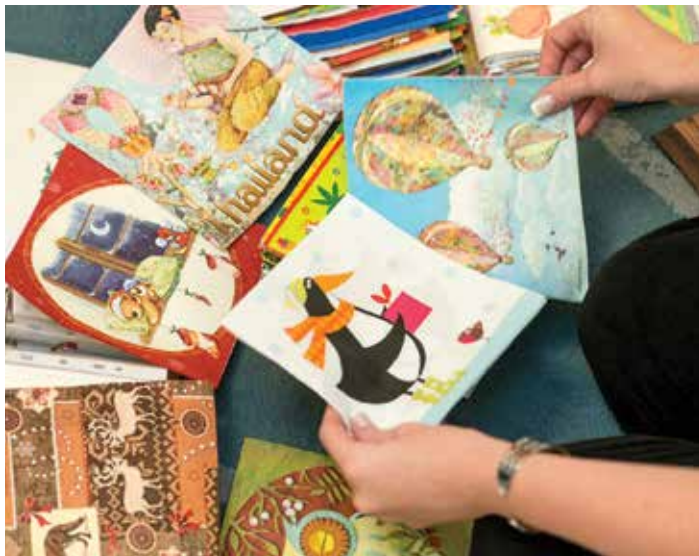
A különlegességek talán egy múzeumot díszítenek a közeljövőben

Régi vágyam, hogy egy olyan kiállításon is megmutathassam gyűjteményemet, ami aztán vándorolhatna az országban. Ehhez kapcsolódik a másik vágyam. Jó lenne létrehozni az országban egy szalvétamúzeumot is.