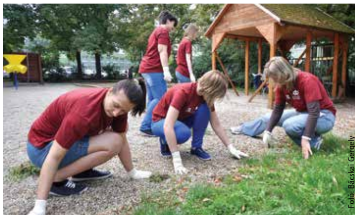
Az óvoda udvarát az önkéntesek gyomlálták a szombati napon

Szombaton reggel a Rákóczi Utcai Óvodában találkoztak az önkéntes nap résztvevői, hogy munkájukkal hozzájáruljanak a gyerekek környezetének szebbé és tisztábbá tételéhez. A résztvevőket köszöntő Cser-Palkovics András polgármester elmondta, hogy idén már húsz cég csatlakozott a KÉPES programhoz,