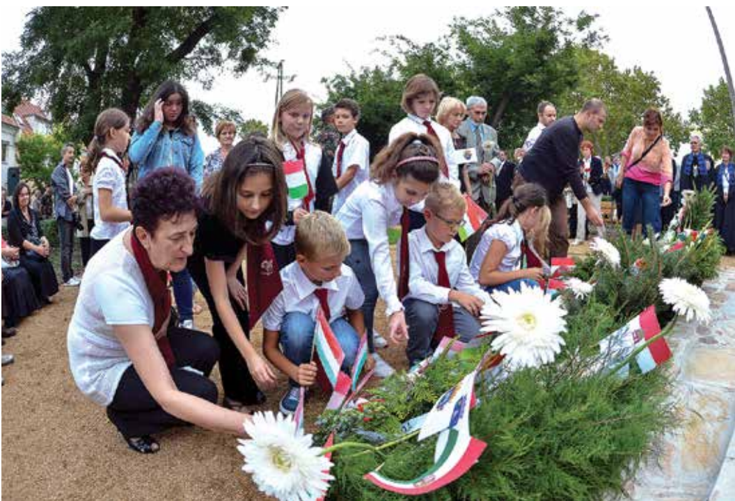
Három generáció emlékezik tisztességgel

Gyógyír márpedig nem létezik. A Gyergyószentmiklósi Gac-hegy oldalában táborozó 159 magyar honvédet kíméletlenül lemészárolták a Vörös hadsereg orosz, kazah és ukrán katonái. Hetven esztendeje történt. 1944. szeptember 7-én a magyar királyi 3. gyalog tábori pótezred megszűnt létezni. A hetven évvel ezelőtti esemény pontos története máig ismeretlen. Szerencsére azonban él a gyergyószentmiklósi emberek emlékeztetésében, akik minden időszakban megemlékeztek a székesfehérvári kadétokról. 2008 óta a Honvédség és Társadalom Baráti Kör székesfehérvári szervezete egy olyan emlékművet avatott, amely a két város polgárai és civil szervezetei között is példaértékű.