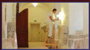
Seuso-kiállítás: készülnek a kincsek fogadására 20. oldal