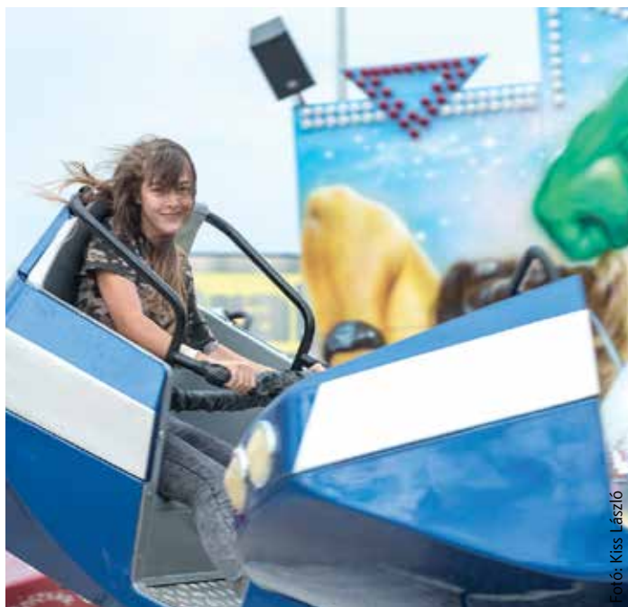
A szédület lett úrrá a maroshegyieken

„Akik itt élnek, pontosan tudják, hogy 2006 után milyen nagy változást hozott Maroshegyen az, hogy a Premium Centerrel közösen ezt a beruházást megvalósíthattuk. Nagyon megváltozott a városrész képe, és egy olyan új bevásárlási lehetőség