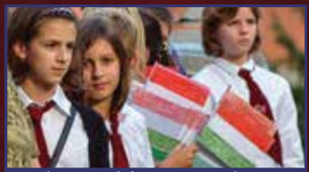
Otthonról hazajöttek 6. oldal