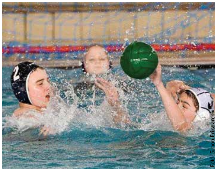
Hamar megszeretik a gyerekek a vízilabdát

bajnokságban, van két OB II-es csapatunk és három korosztály a regionális bajnokságokban szerepel. Idén azt a célt tűztük ki eléjük, hogy lehetőleg javítsanak tavalyi helyezéseiken. Az elvégzett munkának az eredményekben is meg kell látszódnuk.”