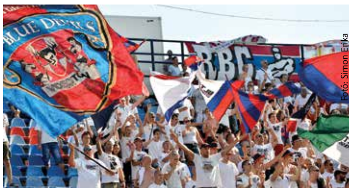
Sóstón idén még nem lesz szükség a klubkártyára, idegenben viszont már kérni fogják a Vidi szurkolóitól is

Az MLSZ szeptember 15-i dátumot jelölt meg határidőként, az élvonalbeli együtteseknek ekkorra kellett volna bevezetniük kötelező jelleggel a klubkártyát. A feltételes mód indokolt, ugyanis több klub kért és kapott halasztást a szövetségtől. A Videoton FC is e klubok sorába tartozik, a fehérváriak mellett a DVSC és az FTC kapott felmentést, legutóbb pedig a DVTK is kérte a kártya bevezetésének elhalasztását. Ezen egyesületek 2014. december 31-ig