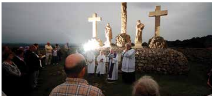
A zarándoklati megtisztulás végső állomása a Krisztus-kereszt

A Vértes és a Bakony ölelésében található települést már a IX. században szakrális tisztelet övezte szent kútja miatt. Szent István a Szűzanya tiszteletére kápolnát építtetett a Kálváriahegy tövébe, ahová fiával, Szent Imrével rendszeresen jártak.