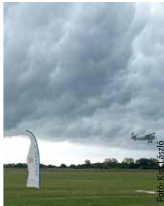
Repülő gépcsodák földön és égen