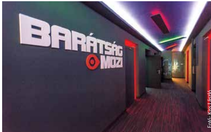
A megújult belső tér

A Fejér Megyei Művelődési Központ – Művészetek Háza ad otthont Székesfehérvár egyetlen hagyományos mozijának immár 31 éve. A Barátság Mozi az országos Art-mozi Egyesület tagja, így a repertoár igényes művészfilmekből, dokumentumfilmekből és magyar alkotásokból áll. Az elmúlt években a mozik teljesen átalakultak, a celluloidszalagot vetítő gépek elavultak. 2013-tól teljesen be is szüntették ezen eszközök használatát,