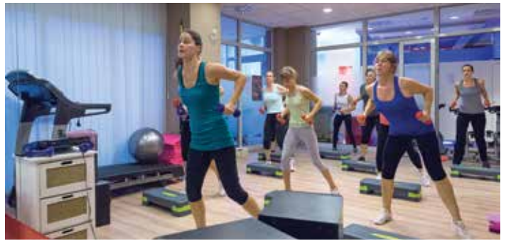
Ha nem vagyunk biztosak a mozgásforma vagy étrend megválasztásában, kérjük szakember segítségét!

A testsúly kontrollálása nem időszakos, hanem állandó odafigyelést igényel, de annak, aki hozzászokik, már természet-