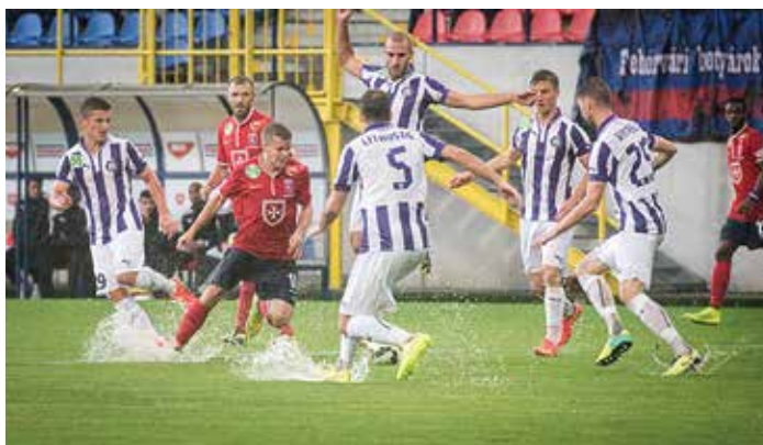
Kokonak a víz még jól is jött, mert a technikája érvényesült

Az időközben a felhők közül kikandikáló napsütés már csak hab volt a tortára, a Vidi 2-0-ra nyert, és hét győzelemmel, 21 ponttal fölényesen vezeti a tabellát.