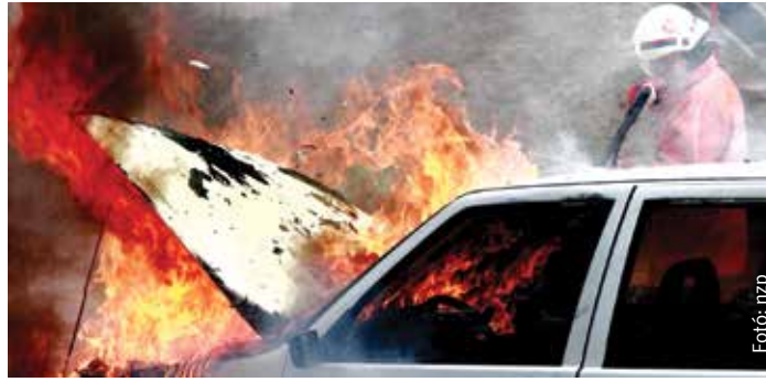
A közvetlen riasztással forintmilliók és emberi életek menthetők meg nem várt helyzetekben