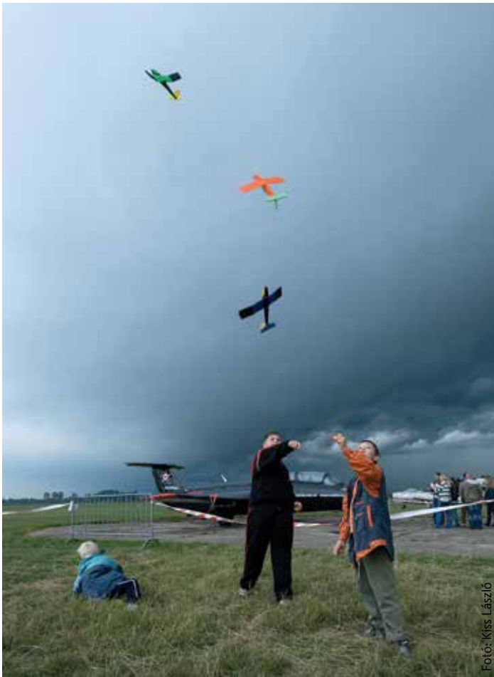
Játék a felbők között