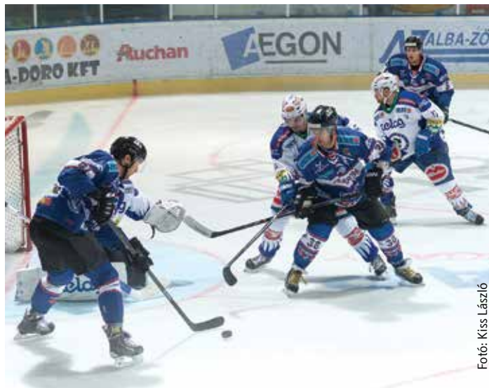
A Villach ellen jobban ment a játék, mint Bécsben