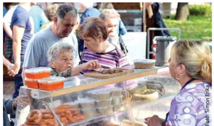
Idén sem voltak olcsóbbak a mangalicafalatok, ezért a kispénzűek csak kis harapásban gondolkozhattak

attól vehették meg a terméket, aki maga állította elő. Szigorú szabály, hogy csak a Mangalicatenyésztők Országos Egyesülete által ellenőrzött állományból kikerült végtermék lehetett jelen a rendezvényen, mely szakmai felügyeletét az egyesület garantálta. A felhozatal az ellenőrzés mellett is jelentős volt, és megállapítható bárki, a mangalica ízben valóban verhetetlen.