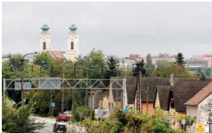
Ahogy a juhásztemplom tornyai köszöntik az észak-nyugat felől érkezőket, úgy fogadja a Felsőváros Fehérvár lecsófőzőit