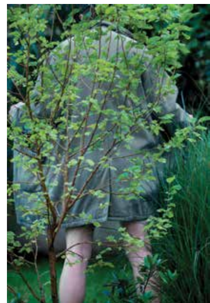
A szexuális bűnelkövetők fele gyermekkorában maga is áldozat volt (A kép illusztráció.)