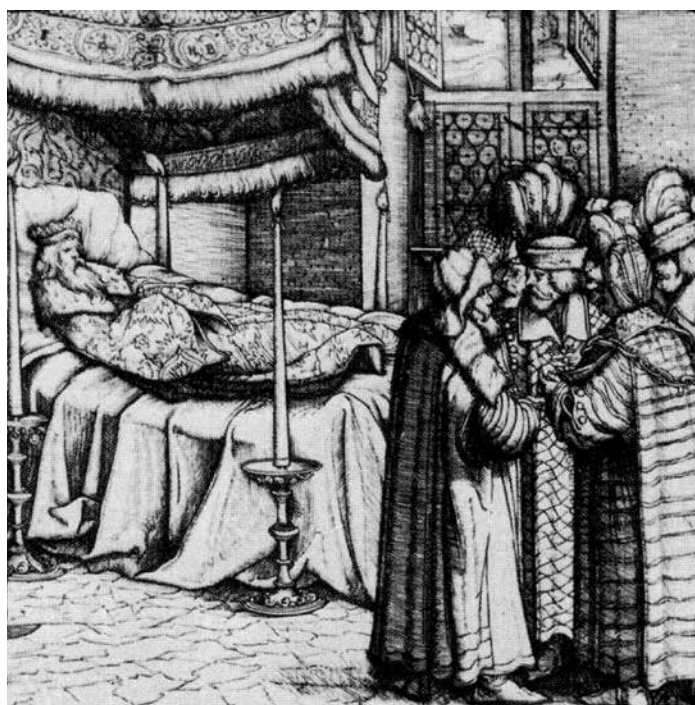
Hans Bruckmayr 1515-ben készített fametszetén a halott, a szakállas, aggastyán király nem hiteles, de az urak már valóban a királyság elosztásán tanakodtak

Özvegye, Beatrix a kísérettel számos hajóval elindult a Dunán. Pozsonyban a királyné és a királyi herceg két napot időzött. A város vezetői gyászruhában jöttek eléjük. A húsvét utáni pénteken továbbhajóztak. Komáromból bocsátotta ki Beatrix az országnagyoktól ellenjegyzett rendeletet, amelyben a királyválasztó országgyűlést összehívta. A menet Budára érkezett. Buda várának Mátyás által kijelölt parancsnoka, Ráskai Balázs megnyitotta a kapukat az özvegy királyné és János herceg előtt, és a rábízott várat átadta. Beatrix Budáig kísérte el a koporsót, de itt már magára zárta