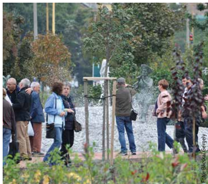
A szökőkutat körülvevő zöld alaposan megváltoztatta a környezet hangulatát