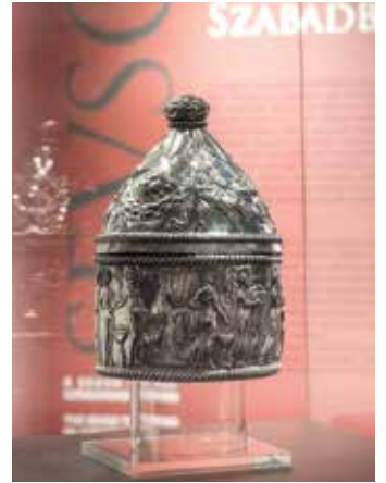
Egyszerre harmincan lehetnek a kiállító teremben, így a csoportok számára előzetes regisztráció szükséges