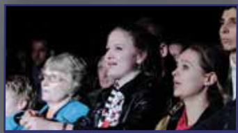
Kegyessé idősödtek, több száz ember 11. oldal