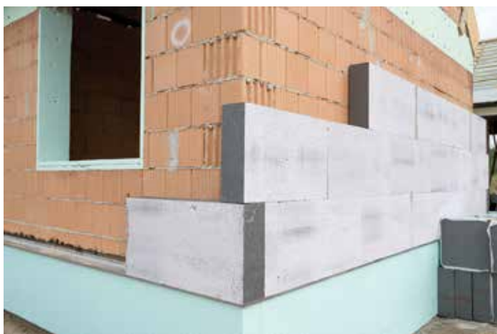
A legnagyobb energiamegtakarítás a falak szigetelésével érhető el

Néhány éve a narancsos színek mentek leginkább, most inkább a homokszínek kerültek előtérbe. Ennek egyik oka, hogy a narancsos színek hamarabb kifakulnak a napsugárzás hatására, míg a homokszínek tartósabbak.