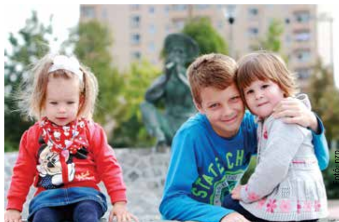
A terület legújabb gazdái – csak az édesanyák félnek a bronzjuboktól