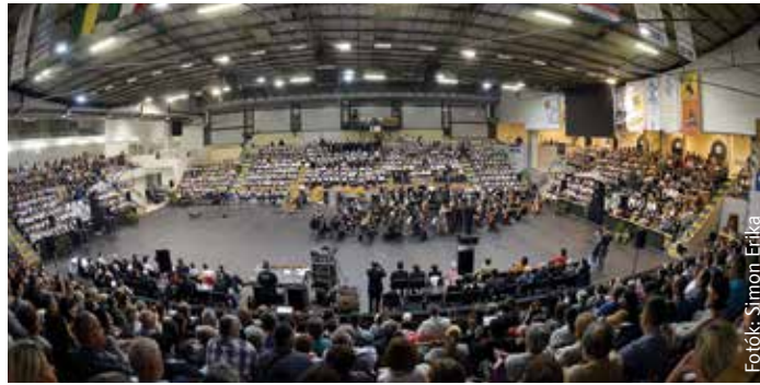
Rengetegen ünnepelték együtt a zenét Székesfehérváron is október elsején

Október elseje a zene világnapja, ebből az alkalomból ország-szerte több koncertet, hangversenyt és más zenei programot is rendeznek. A világnap célja, hogy a társadalom széles rétegei számára népszerűsítse a zeneművészetet, és – az UNESCO elveinek megfelelően – szorgalmazza a népek közti barátságot és megbékélést. A zene világnapját 1975 óta Yehudi Menuhin hegedűművész és az UNESCO zenei tanácsának a felhívására ünneplik október 1-jén.