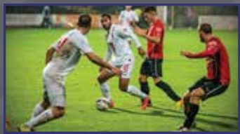
Megállíthatatlanok? 31. oldal