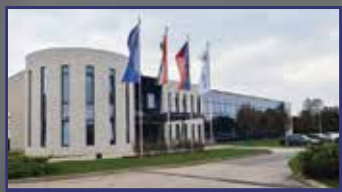
Tiszta Amerika – egy garázsban kezdték 6. oldal