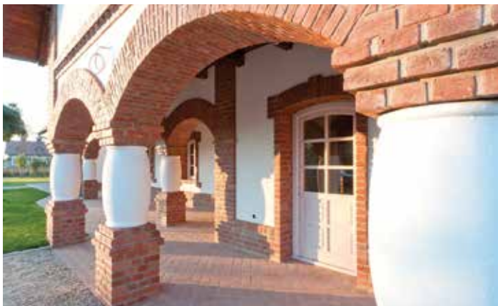
Nem csupán az udvarnak, de a terasznak is díszre lehet a jól kiválasztott térkő