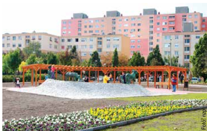
A lakótelep és a már hozzá tartozó nyáj