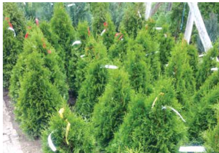
A kertészek szerint az őszi ültetés a legideálisabb