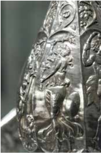
Aprólékos kidolgozás, tökéletes munka