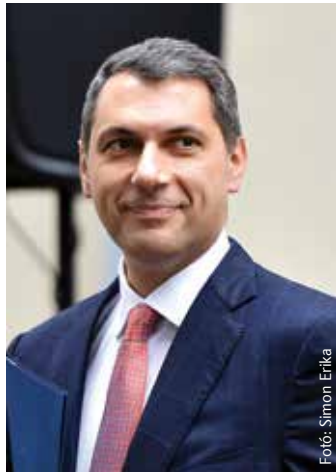
Lázár János szerint a Seuso-kincsek is bizonyítják, hogy Magyarország-nak van helye Európában

Székesfehérváron kerül első alkalommal múzeumi körülmények között bemutatásra a Seuso-kincs hat