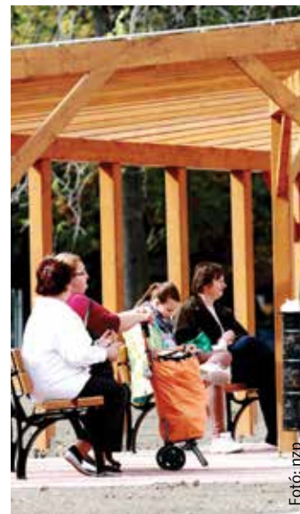
A kút szomszédságában felállított lugas pihenést nyújt