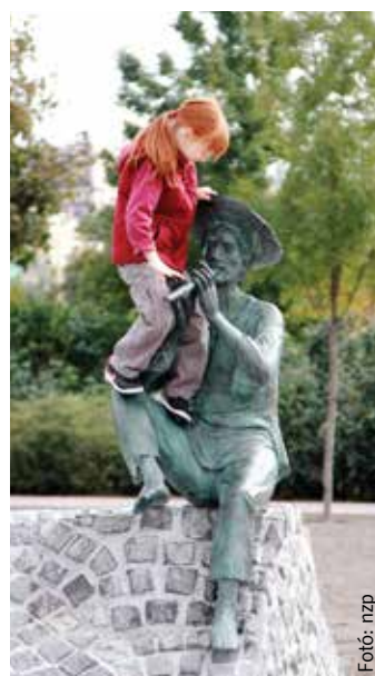
Lehet, hogy Iluska is megjött?