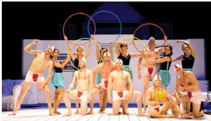
Fordulatokban gazdag, kalandos történet elevenedik meg a színpadon