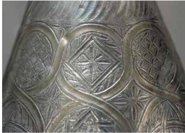
A kincs látványa rabul ejti a szemlélődőt