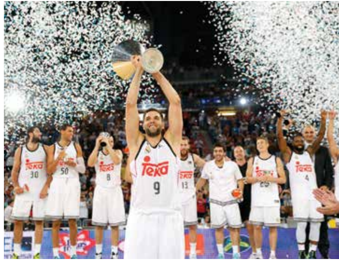
A spanyol Szuperkupa megnyerésével kezdte a szezont a Real

Az előkészítő munka a végéhez ért, de nyugodt majd akkor lehet a Real Madrid vendégjátékát szervező csapat, ha a királyi gárda a gálameccs után haza is utazott. Az nem állítható, hogy monstre programot bonyolítanak a madridiak, hiszen szerdán fél napot (sem) töltenek hazánkban, de ebbe azért befér ez-az. Délután fél egykor landolnak Ferihegyen, ahonnan Felcsútra buszoznak, a Real magyar ikonja előtt tisztelegve nézik meg a Puskás-kiállítást. Ez idő alatt a fehérvári kosárcsarnokban már pattog a labda, az U-14-es korosztályban a Dá-