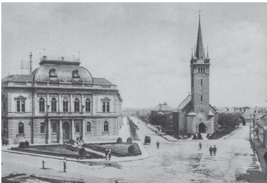
A Várkörút egykor...

Az „Új Belváros – Várkörút rehabilitációja” című pályázat keretein belül ötrészes tudományos sorozat indult el csütörtök délután a levéltárban. Az előadások különböző témában mutatják be a városvédő és városszépítő tevékenységet a dualizmus korában és a XX. század elején. Az egyes villaépületek és tulajdonosaik bemutatására is sor kerül majd. Érintik