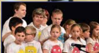
III. Integrált Regionális Kulturális Fesztivál 5. oldal