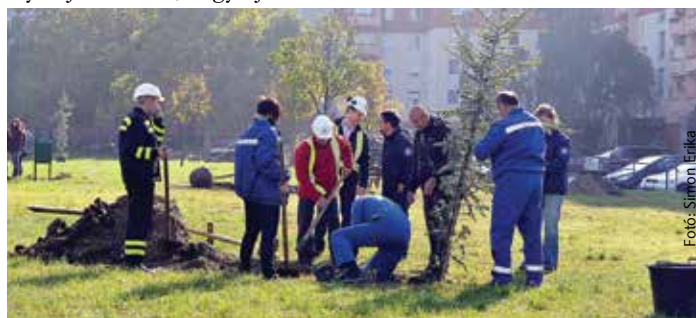
A faültetésben a Polgármesteri Hivatal dolgozói, az Alcoa és a Városgondnokság munkatársai valamint civil szervezetek is részt vettek

tűztek ki: 2020-ig tízmillió fát szeretnének elültetni – mondta Forgó Béla, az Alcoa-Köfém Kft. vezérigazgatója a Családok Ligetében. Fontos üzenetük van az ehhez hasonló programoknak – tette hozzá a város polgármestere. Egyrészt azért, mert az ipar fehérvári szereplői példát mutatnak a környezetvédelem és a társadalmi felelősségvállalás tekintetében, másrészt újabb közösségi tereket használhatnak a fehérváriak – hangsúlyozta Cser-Palkovics András.