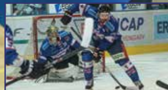
Tökéletes ötös 13. oldal