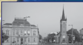
A Várkörút egykor és most 9. oldal