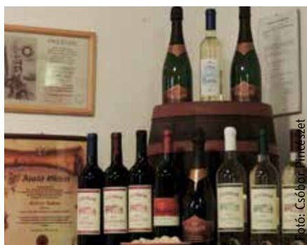
Új szín a Csóbor pincészet életében a pezsgő, melynek ízvilága vetekszik a komolyabb kategóriájú pezsgőkével

Nem így volt ez hajdanában, az ezredforduló környékén, amikor elkezdtek a családi gazdaság kiépítését. Akkor még jellemző volt, hogy az étterem-tulajdonosok bementek a helyi hipermarketbe és megvették a legolcsóbb bort. Azóta sokat fordult a világ, köszönhető ez a helyi borászoknak is, akik bebizonyították,