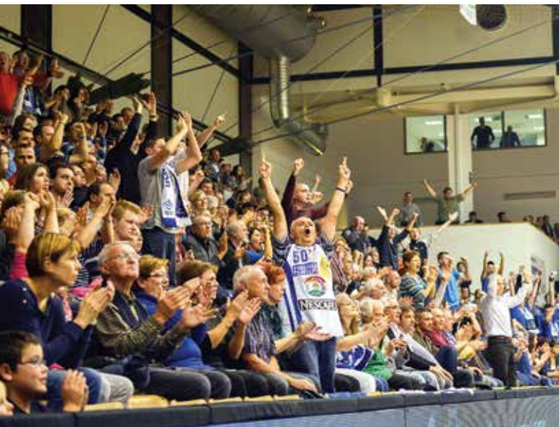
Győztes rangadón mindig kiváló a hangulat

Álmodtam. Álmomban vízparton heverészttem, 30 fokos hőségben, lángost majszolgatva. A hűs vízben bikinis lányok röplabdáztak, anyukák és apukák adtak úszóleckeiket csemetéiknek, a háttérben vitorlások küzdöttek a centiméterekkel a szélcsendes kánikulában. Jó volt, élveztem. Aztán felébredtem. Bár ne tettem volna, bárcsak még aludtam volna, álmomban a lángost egy hűsítő sörrel leöblítve! De nincs mese, felébredtem, és rájöttem: a nyár bizony messze szállt. Nincs hőség, nincsenek bikinis lányok, csak köd, hideg, szürkeség. Kávét kavargatva számba vettem a hétfő feladatait, és rögtön tudtam, lesz türelmem kivárni a következő nyarat. Lesz itt még hőség, lesz vízpart, lángos és bikinis lányok is. Én pedig addig sem unatkozom, mert ez a város nem hagyja, hogy a sportot szerető közönsége unatkozzon, tétlenkedjen. Péntek este az FKC és az Alba meccse (de miért újra egy időben?), vasárnap Vidi-Honvéd. Van mit nézni akkor is, amikor bikinis lányokból épp hiánycikk van a ködös őszi-téli napokon. Kedves fehérváriak, kedves nyárimádó sorstársaim! Ne hagyjuk, hogy elnyomjon minket a szürkeség! Menjünk, szurkoljunk, élvezzük a városi sportélet adta lehetőségeket! Kezdjünk barátkozni a tél kínálatával, élvezessük meg a korcsolyákat, készítsük elő a túrabakancsokat, vessük bele magunkat ebben a nyálkás, nyúlós időben is a sport örömeibe aktív és szemlélődő résztvevőként egyaránt! Nyár lesz jövőre is. Én kívárom. Így már ki tudom várni!