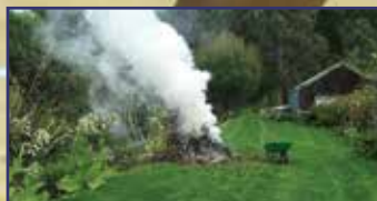
Avarégetési időszak 2. oldal