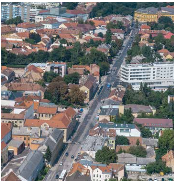
... és most

a középkori Székesfehérvárt az egyik épen maradt várfal