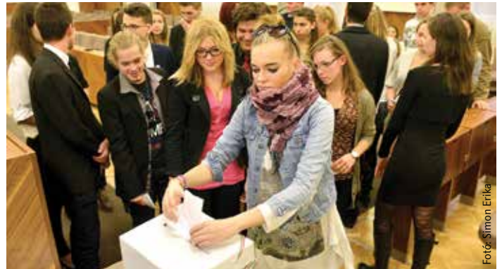
A Diáktanács tagsága titkos szavazással döntött az új elnökség tagjairól