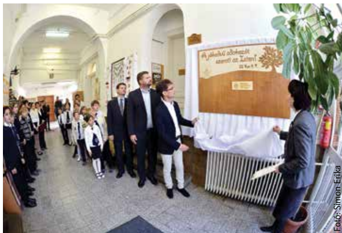
A táblát a város polgármestere és az iskola igazgatója leplezte le

kezdeményezéshez közel kétfélmillió forintos támogatással, amit az intézmény az informatikai géppark bővítésére fordít majd: projektorokat, notebookokat és a vetítéshez szükséges vásznakat vásárol az iskola. Az ünnepélyre az iskola diákjai műsorral készültek. A hallgatóság soraiban ott volt Cser-Palkovics