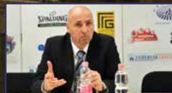
A vereség és a lemondás sokkja