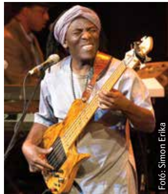
Richard Bona a basszusgitár virtuóza, humorista és showman – ezért hagyott maradandó nyomot Fehérváron

Az afrikai származású világzenész a koncerten zenei tehetségét és humorát egyaránt megcsillogtatta, és kiváló zenészi együttjátéknak lehettek részesei a nézők. Bona gyakorlott showmanként kommunikált a közönséggel: a koncert végén az egész színház – a huszonéves diák, a középkorú üzletember magáról megfélekedve – egy emberként táncolt. Richard Bona négy évvel ezelőtt járt utoljára Magyarországon, szerencsére a magyar alapkezelésekről nem feledkezett el. Székesfehérvárról panaszkodva jegyezte meg, hogy lehetetlen kimondani a nevét. Nem Afrika ez vagy Kína, hogy ilyen bonyolult városnevek legyenek! –