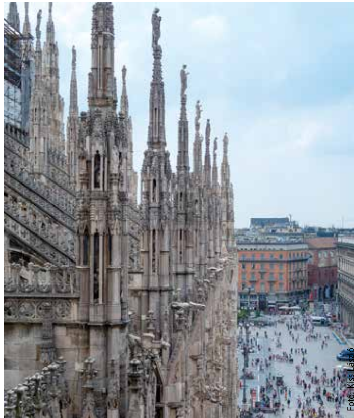
Őszel és télen az egzotikus helyek mellett az európai nagyvárosokba is szívesen látogatnak a turisták

Egyre inkább a repülő felé billen a mérleg, hiszen rengeteg időt meg lehet spórolni, akár egy napot is. Kényelmesebb Párizsba vagy Rómába repülővel menni, még akkor is, ha a