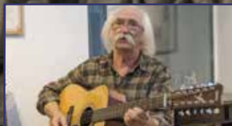
A 68-as úton