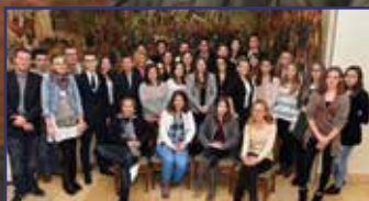
Új elnök a Diák Tanácsban