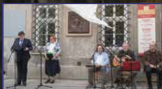
A szélleplezte tábla