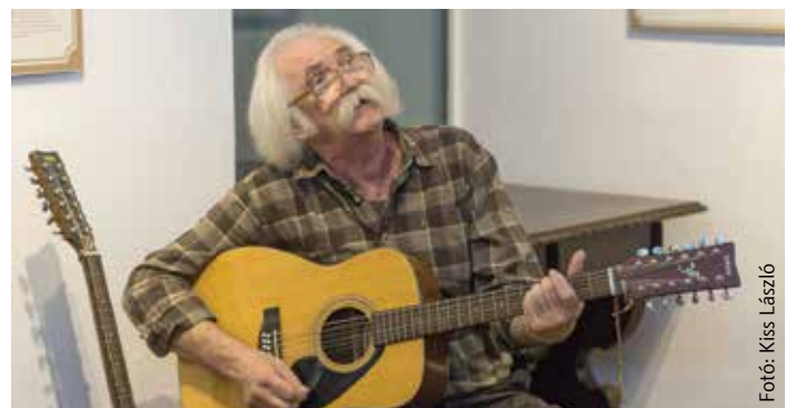
Csak egy kék színű virág, ennyi a jelünk – Tolcsvay Béla 68 éves

dallamokkal, amelyek elkísérték hallgatóit mindmáig. November 5-én, a 68. születésnapjának előestéjén a Királykút Emlékházban találkoztunk. Tolcsvay Béla mosolygott, és a hozzá hasonló alkotókhoz méltóan azt mondta: „Nem révedezem a múltban, nem gondolom, hogy a pázmándi házamból kell megmentenem a világot. Ugyanakkor hiszek abban, hogy az én gondolataim és dalaim segítenek abban, hogy újra felfedezzük magunkat.” Boldog születésnapot!