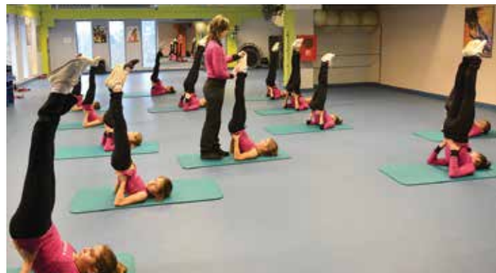
A sportág alapja a megfelelő bemelegítés. A mozdulatok tökéletessége csak az izmok megfelelő állapotba hozásával érhető el. Az igazi munka csak a mintegy húszperces nyújtás után kezdődik.