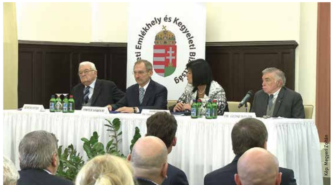
Hőseink emléke sose halványulhat el, hogy tetteik mindig példaként állhassanak az utókor előtt – mondta Pintér Sándor belügyminiszter

Cser-Palkovics András polgármester beszédében felhívta a figyelmet arra, hogy míg négy évvel ezelőtt a megkérdőjezték tíz százaléka, addig a legfrissebb felmérés szerint már harminc százaléka tartja fontosnak a fehérvári Nemzeti Emlékhely kérdését. „A székesfehérvári Nemzeti Emlékhely