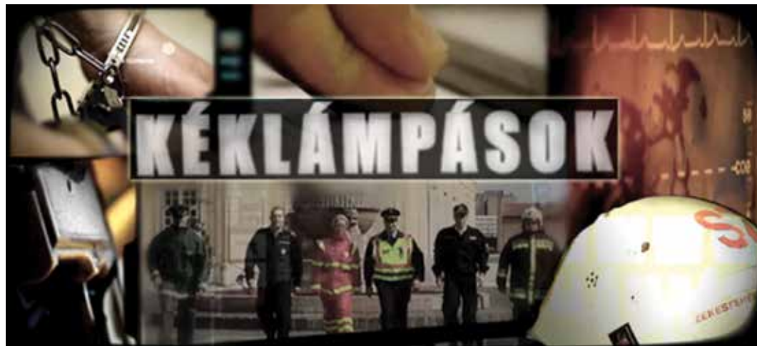
Az első műsor december 6-án lesz látható a Fehérvár Televízióban

A 2010-ben útjára indított műsor az aktuális bűn-, tűz- és balesetek feldolgozása mellett a szenzációhajhászás helyett a valóságágra és a szakmai elhivatottságra helyezi a fő hangsúlyt. Arra szeretnénk rávilágítani, hogy az itt dolgozó egyenruhások nemcsak a helyszíni bírságok kiszabásában jeleskednek, hanem tesznek is értünk, mégpedig nem is keveset. A Kéklámpásokban tanúi lehetünk például annak, hogyan érti meg egymást szavak nélkül a mentő, a tűzoltó és a rendőr egy baleset helyszínén, ahol mindenki az autóra szorult sérült megmentésén dolgozik. Vagy választ kaphatunk arra is, mit csinálnak a rendőrök, mielőtt a szomszédunk által bejelentett betörés helyszínére érnek. A magazin nézői elé tárul Székesfehérvár ismeretlen oldala, hiszen nem megrendezett jeleneteket mutatunk be, hanem