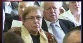
Kegyelet és Árpádház- program 4. oldal