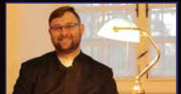
Egyedül, de nem magányosan 16–17. oldal