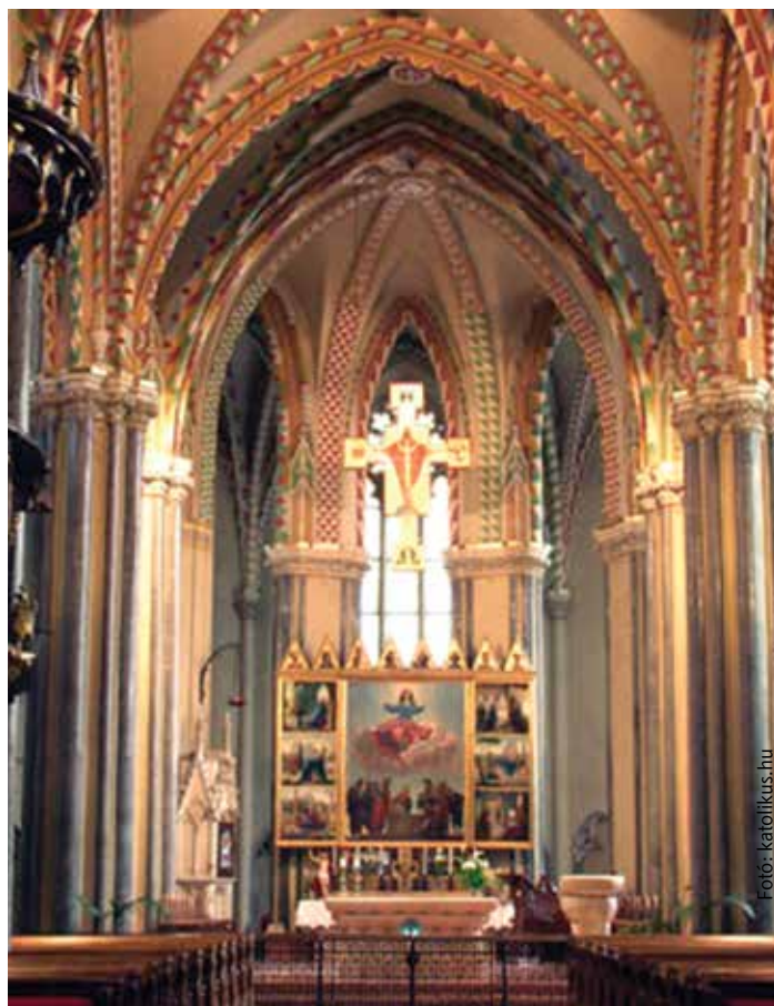
Ilyen lehetett a Mátyás király által kibővített fehérvári templom oltára, mint a pesti Belvárosi Nagyboldogasszony Főplébánia-templomé

milyen feltételekkel érdemelheti ki a magyar koronát. Afféle országgyűlést ültek itt. Aztán Nagylucei Orbán püspök vezetése alatt innen vonultak ki Rákos mezejére, hogy a köznemesség jelenlétében meghallgassák a trónkövetelők követit. Mindaddig, amíg nem parkoltam le az Erzsébet híd pesti hídfőjénél, nem tudtam beazonosítani ezt a történelmi helyet. Aztán elem táruult a frissen felújított Belvárosi