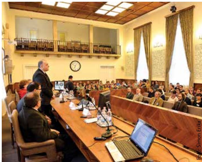
A műszaki tudás elengedhetetlen a székesfehérvári cégeknek