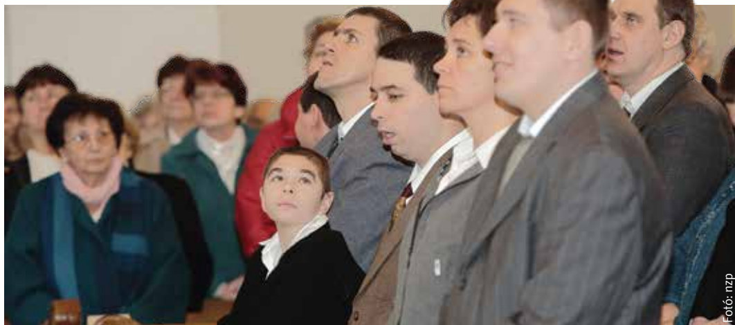
A dunaalmási gondozottak szeretetükkel felérték a felérhetlent a fehérvári református templomban