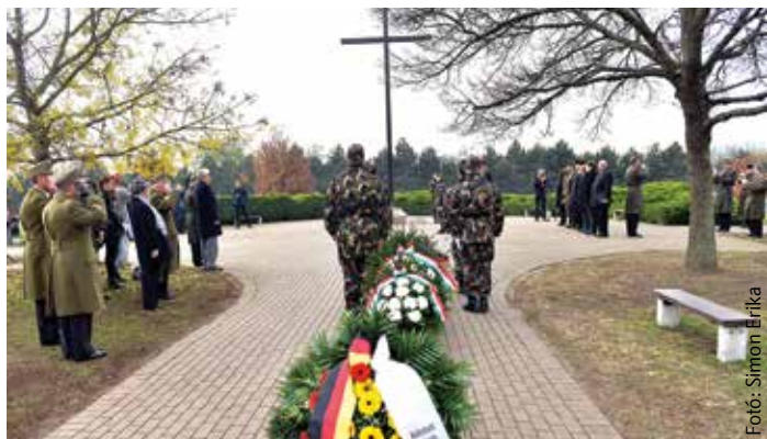
Katonai tiszteletadással avatták fel a hősi halottak emlékét vigyázó keresztet