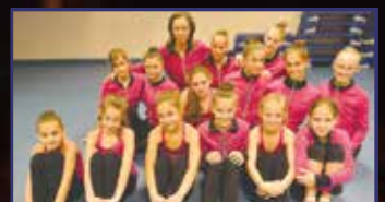
Tökéletes gyakorlat – csúcson a Futura SE 28. oldal

facebook Fehérvár Média centrum – minden, ami Fehérvár! • Keresz minket a facebookon is!