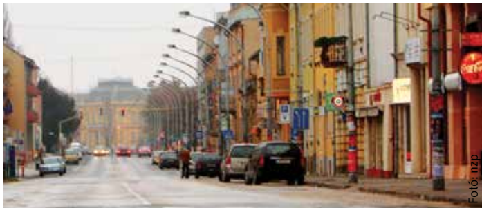
Várhatóan 2015 nyarára elkészül az új Várkörút, amit ilyennek többé már nem látunk

A városban működő nonprofit jellegű szervezetek részére pályázatot írt ki az önkormányzat úgynevezett miniprojektek megvalósítására, amit négymillió forintos keretből, vissza nem térítendő támogatásként juttat a szervezeteknek. A pályázatokat november 24-től nyújthatják be január 9-ig. A pályázattal kapcsolatos kérdéseket a 06-22-537-609-es telefonszámon vagy a balogh.agnes@pmhiv.szekesfehervar.hu e-mail címen tehetik fel.