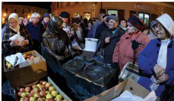
Kati néni népszerű

Nem tébláboltak céltalanul, tudták, hogy a család boldogulása részben vagy egészben rajtuk múlik. Kocsis Balázs szobra egyébként az alapja a felsővárosi fertályos asszonyok dicsőítésének. Határozott elképzelései voltak, milyen kompozícióban lehet megmutatni a piacos asszonyokat, akik a Szent Sebestyén templom árnyékában éltek a maguk sajátos életét, de a jeles napokon felkerekedtek,