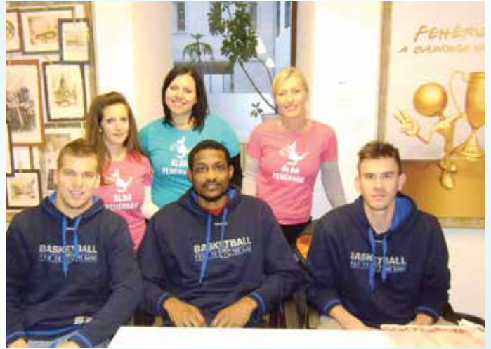
Idén is lesz dedikálás az Ajándékboltban december 7-én, 16 órától

az üzletben, és ide várják a szurkolókat is. A TLI Alba Fehérvár sportolói december 7-én vasárnap délután 4 és 5 óra között dedikálnak, és idei utolsó hazai mérkőzésük előtt igencsak számítanak a szurkolókra. És nem csak a nézőtéren, hanem az ilyen alkalmakkor is. Ugyanakkor azt is tudják, hogy az ő példájuk inspirálja a fiatal sportolókat a kemény munkára, ami a csúcsra vezet. A sportoló gyerekek most új relikviákat szerezhetnek be kedvenceikről,