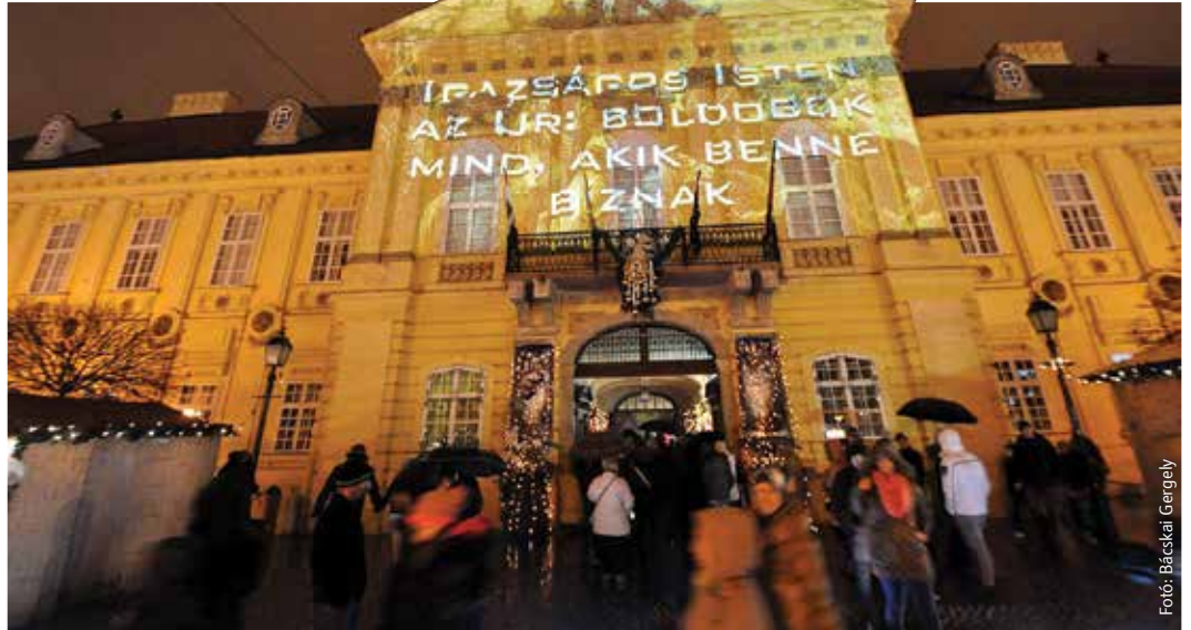
„Igazságos Isten az Úr: boldogok mind, akik benne bíznak” hirdeti a püspöki palotán megjelenő adventi fényfestés, mert az elkövetkezendő négy hétben a püspökség is fénnel köszönti a várakozókat

A adventet ma már nemcsak a vallásos emberek ünneplik. Az adventi koszorú nemcsak a keresztény emberek lakásait díszíti. A gyermekek adventi naptárat bontogatnak, levelet