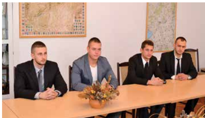
A fiatalok bátorságát oklevéllel és márkás karórával ismerte el a rendőrség

A fiatalok tettükért főkapitányi dicséretet kaptak. Az elismerést a megyei rendőrség főkapitányhelyettese adta át. Vörös Ferenc szerint határozott fellépésükkel rendkívüli bátorságról és önfeláldozásról tettek tanúbizonyságot. Az ezredes hozzátette, munkájukban a civil segítségnek óriási jelentősége van. A fiataloknak hála a rabló a közeljövőben biztosan nem látogat trafikokat.