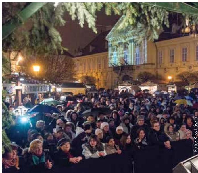
Eső ide, eső oda, a Nikolas-koncerten a zenekedvelők megtöltötték a színpad előtti teret

A magyar emberek közül sokan beletörődnek abba, ami van. Megbékélnék vele, azt mondják, „majd lesz valahogy, nem tudok mit csinálni.” Ebből az állapotból szeretném kihozni őket a koncertek alkalmával, és szerencsére érkeznek visszajelzések, hogy „belekezdtem,