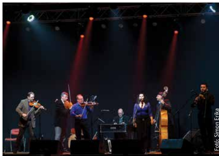
A Csík zenekar kortárs, populáris zenévé teszi a régi muzsikáját