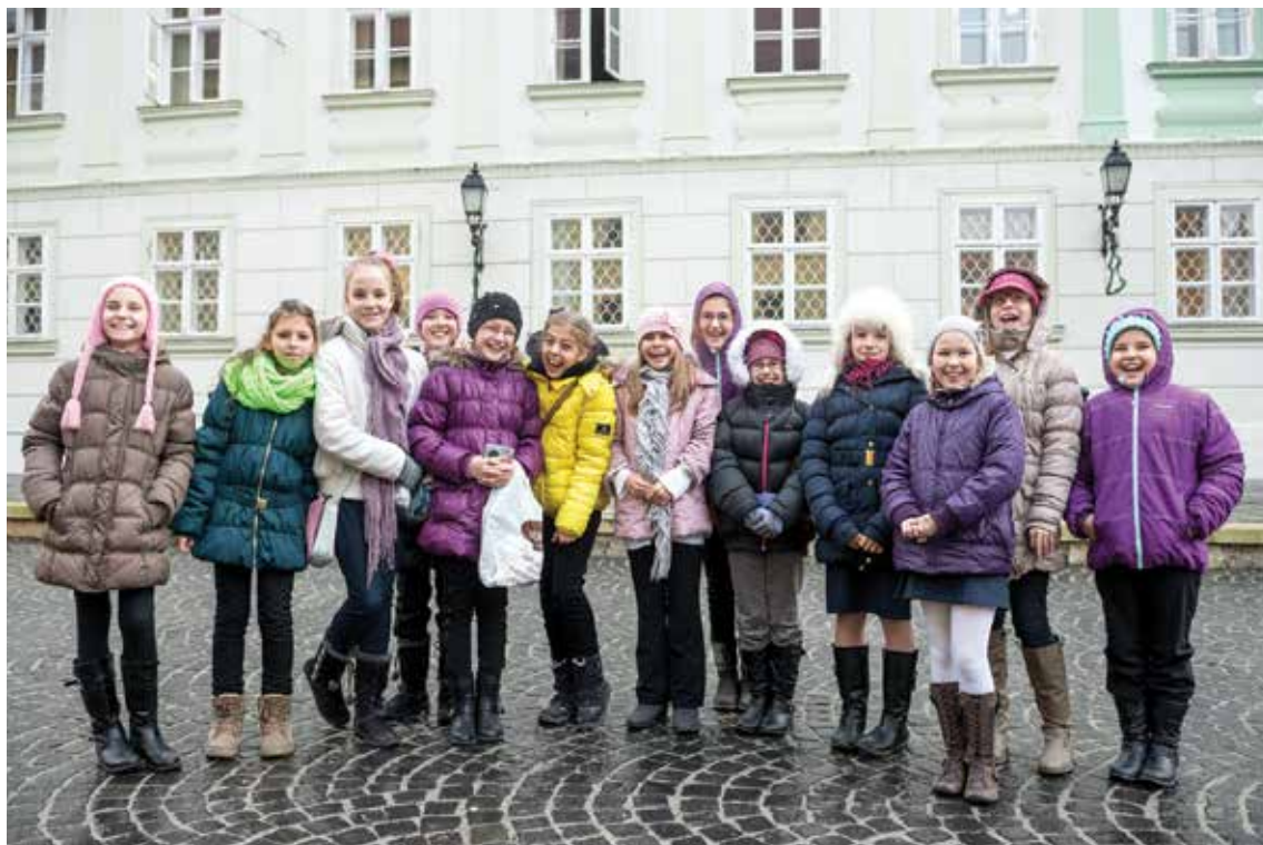
A lányok a Ciszterci Szent István Gimnázium 5. b. osztályába járnak

Karácsonykor Jézus születését ünnepeljük. A legfontosabb, hogy öt ajándékozzuk meg, hiszen ez az ő születésnapja. Az ő élete a szeretetről szól. Ha másokkal jók vagyunk, az neki is ajándék. Azt üzenjük az embereknek, hogy ne csak azt nézzék, kapnak-e ajándékot, hanem azt, hogy mit adnak. A legfontosabb, hogy együtt legyen a család, és örüljenek egymásnak.