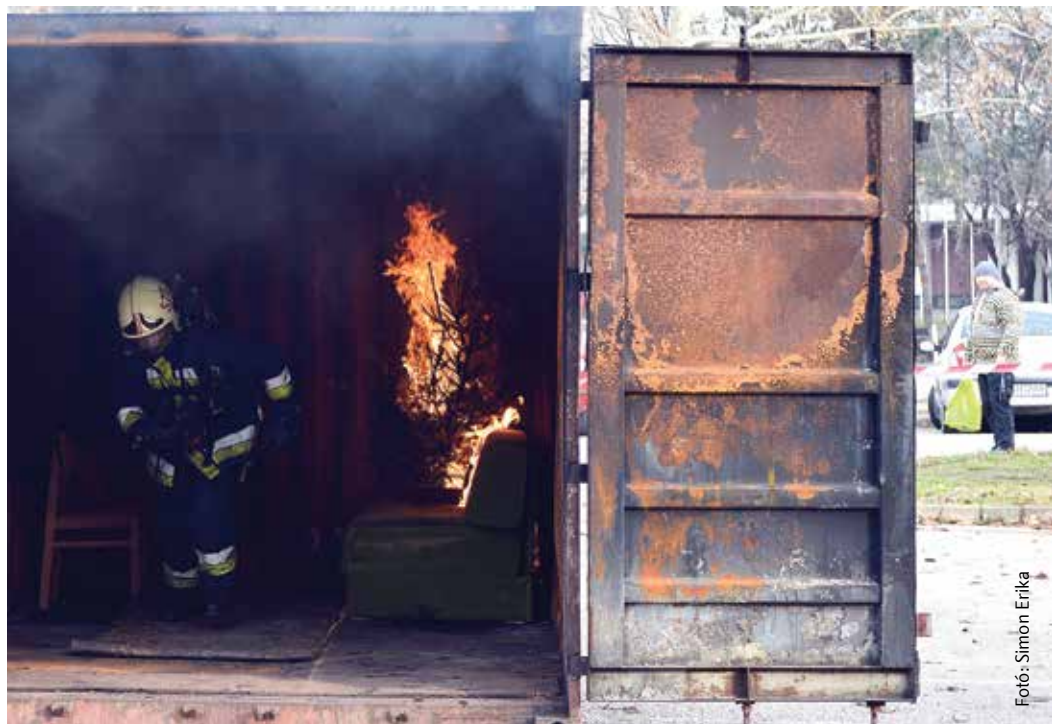
A katasztrófavédelem munkatársai a belvárosban látványos bemutatóval illusztrálták, hová vezethet az emberi gondatlanság

De más veszély is leselkedik ránk. Szinte alig van olyan háztartás, ahol még ne fordult volna elő, hogy lángra kapott a serpenyőben a zsiradék. A legtöbbször a hirtelen keletkezett tüzet vízzel szeretnék eloltani, ezzel még nagyobb bajt okozva. Mi lehet a megoldás? Konyharuhát kell rádobni, vagy egy fedőt gyorsan rátenni – mondják a szakemberek.