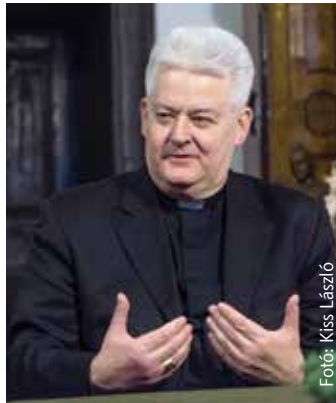
„Ne szabjátok magatokat ehhez a világhoz!”