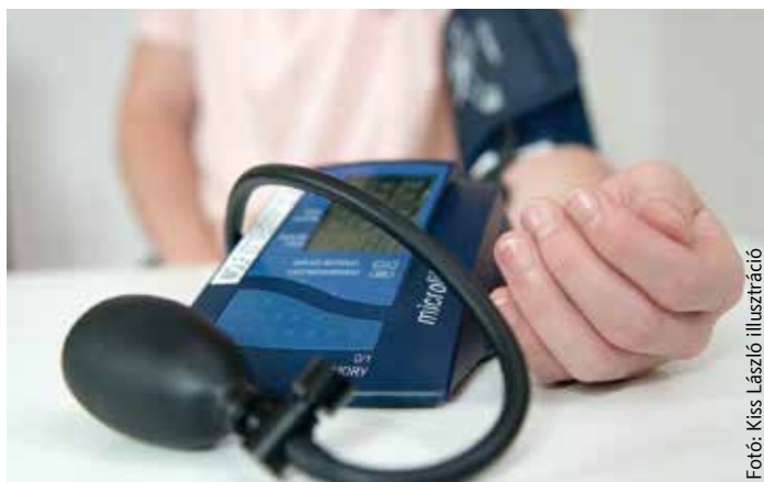
Fotó: Kiss László illusztráció

„Szeretnénk kibaszni a futballtorna adta lehetőséget arra, hogy népszerűsítsük a tömegsportot és az egészséges életmódot. Reméljük, hogy a karácsonyi ünnepek alatt felszedett plusz kilók miatt sokan kapnak kedvet a mozgásra. Erre remek lehetőségeket biztosítunk majd a tornán, ahol a foci mellett a család apraja-nagyja találhat kedvére való elfoglalt-