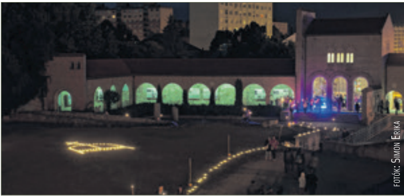
Éjszakai fényben a Nemzeti Emlékhely

A nagyszabású, országos programsorozat történetében ismét egyedülálló volt Székesfehérvár és környéke kulturális intézményeinek összefogása. Az év legrövidebb napjának éjszakáján huszonhét helyszínen hetvenöt program várta a látogatókat.