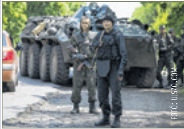
Már a kárpátaljai magyarokat is behívták katonának