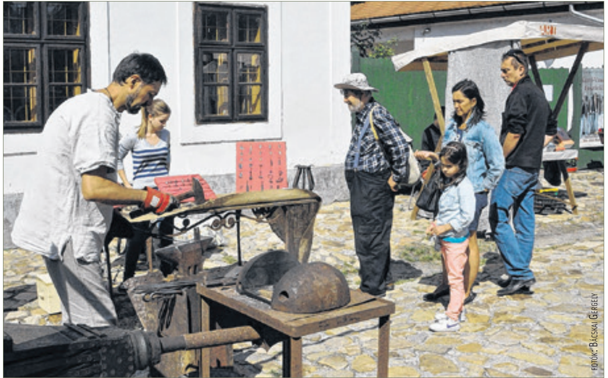
Míves kések, biccskák, kovácsolási bemutatók és népi mesterségek – felébredt a Rác utca