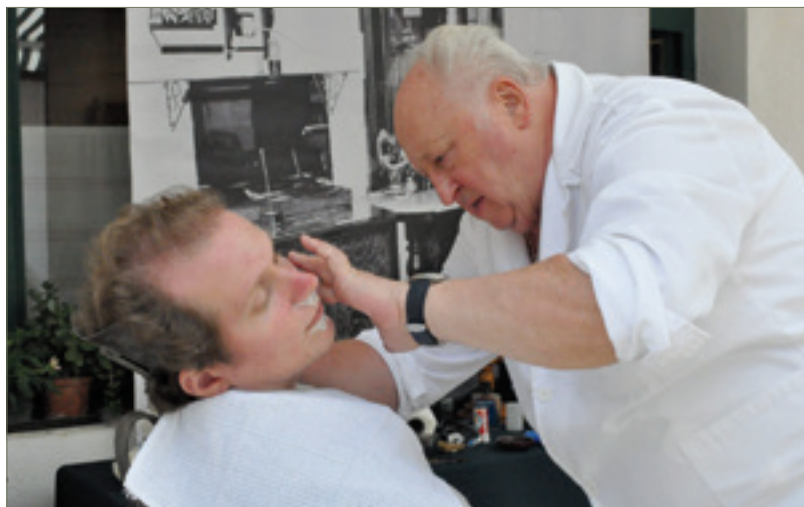
Korabeli borbélyműhely várta a vállalkozó kedvéket, ahol a beretválás fortélyait is bemutatták

tunk, emellett a fehérvári kézművesek is kínálták portékáikat. A fiatalokat lovagi próba várta Könyves Kálmán jegyében. A hagyományokhoz híuen tüzugrás zárta a fesztivált.