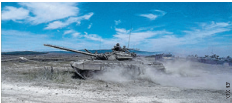
A látványos bemutatót Áder János köztársasági elnök is megtekintette

tot vezényelnek várhatóan ősszel a Baltikumra. Sajtóértesülések szerint éppen ebben a térségben kíván egy kisebb település ellen úgynevezett próbatámadást intézni az orosz hadsereg. Ezt az információt határozottan cáfolta Hende Csaba honvédelmi miniszter, aki a sikeres hadgyakorlat után kijelentette: a Magyar Honvédség elkötelezett tagja a NATO-nak, és feladatait hiánytalanul ellátja. A miniszter hozzátette: ezt a gyakorlatot jóval azelőtt kezdték szervezni, hogy kirobbant az ukrán válság. A nagyszabású gyakorlat