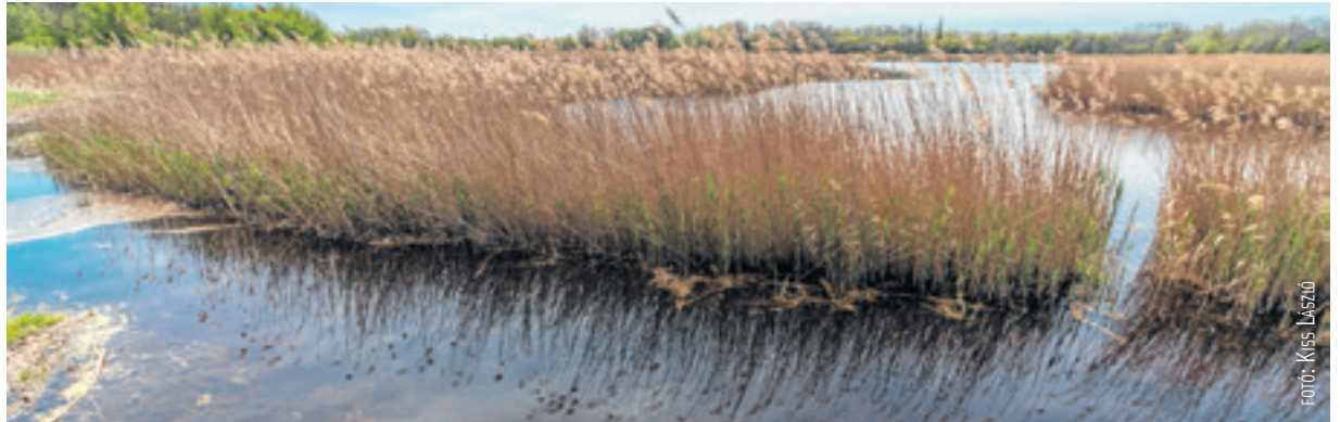
Magyarország jelentős szerepet vállal a klímaváltozás ellen vívott harcban. Vizeink védelme és optimális hasznosítása kulcskérdéssé vált.

A Megyei Jogú Városok Szövetsége egyhangú döntéssel csatlakozott Ader János köztársasági elnök klímavédelmi kezdeményezéséhez, amelynek során kampány indul annak érdekében, hogy a párizsi klímacsúcs résztvevőit az éghajlatváltozást okozó környezet-szennyezés elleni ambíciózusabb, elkötelezettebb, nagyobb felelősségről tanúskodó megállapodás megkötésére ösztönözzék. Kőrösi Csaba, a Köztársasági Elnöki Hivatal környezeti fenntarthatósági