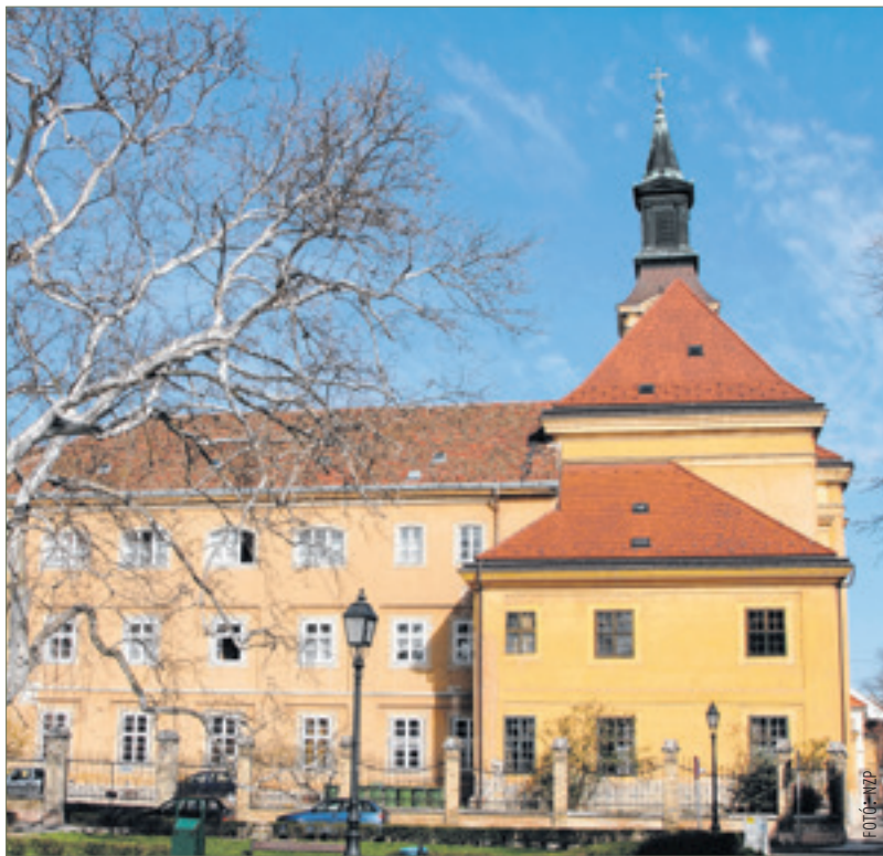
A karmeliták egykori épülete az utóbbi háromszáz év alatt otthona volt szerzeteseknek, kispapoknak, az Egyházmegyei Múzeumnak, de időnként katonai kaszárnya szerepét is betöltötte. Ma idős papok laknak itt.

Kezdetben a fehérvári a karmeliták Bajorországot, Ausztriát, Csehországot és Magyarországot magába foglaló provinciájának egyik legkeletibb, örökös anyagi gondokkal küzdő helye. 1731-ben azonban változik a helyzet: a Felsőnémet Provincia Habsburg-érdekeltségű területekre eső fele Osztrák Provinciaként önállósul, és 1755-ben