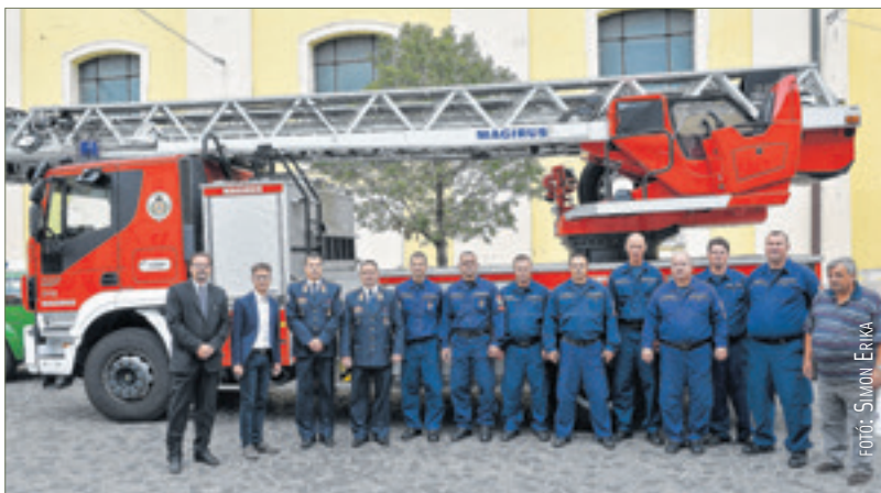
A katasztrófavédelem új tűzoltólétrája előtt a fehérvári csapat, ennek segítségével oltották el a szárazréti tüzet

mentő létra segítségével vízágyúval küzdöttek a lángokkal. A polgármester szerint a tűzoltók kiváló munkát végeztek a katasztrófa elhárításának érdekében. Cser-Palkovics András szerint a tűzoltók minden nap megérdemlik a köszönetet, de most különösen, mert ez az esemény sok ezer fehérvárit érintett. A tűzoltók négyes, kiemelt fokozatban siettek