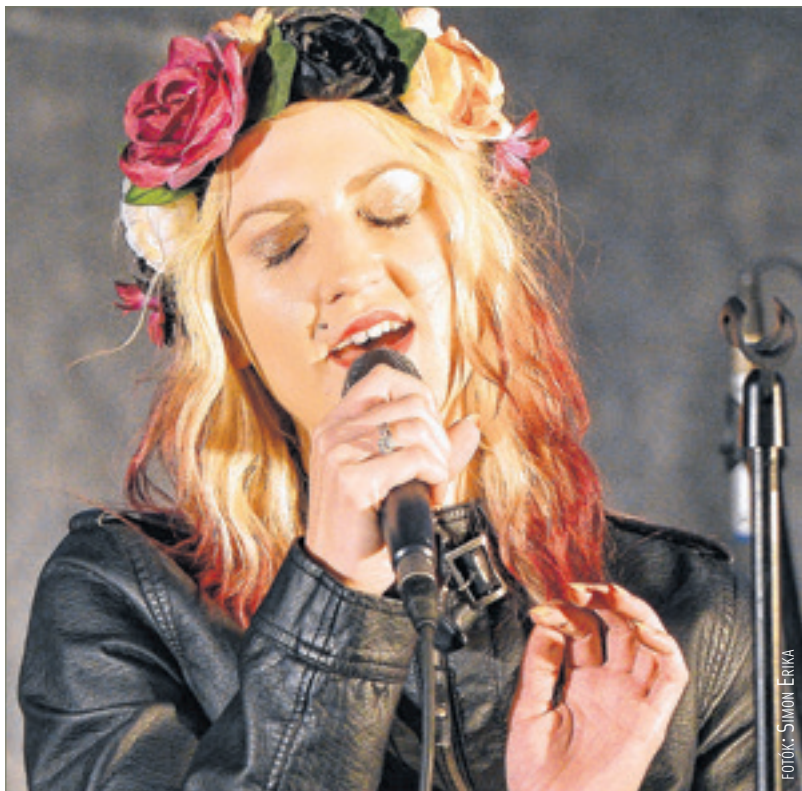
Rendhagyó pillanat: megismerhettük Mrs. Columbot

A három helyszínen minden pénteken és szombaton 19, 20, és 21 órakor a magyar és székesfehérvári könnyűzenei élet reprezentánsai várják a zenerajongókat. A népszerű előadók, helyi formációk, iskolai együttesek, az igazi utcazenei produkciók hangulata,