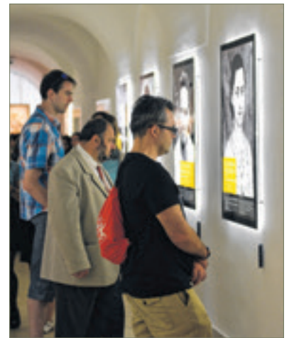
Nagy érdeklődés volt az Egyházmegyei Múzeum kiállításai iránt is

A helyszínek között szerepelt a Fekete Sas Patikamúzeum, a Nemzeti Emlékhely, a Városi Képtár – Deák-gyűjtemény, a Budenz-ház, az Egyházmegyei Múzeum, a Hetedhét Játékmúzeum és a Bory-vár is. A Fehérvári Programszervező Kft. által koordinált eseménysorozaton mindenki az izlésének és érdeklődési körének megfelelő programot választhatott. Ez évben rekord létszámú, 5561 látogató fordult meg a Múzeumok éjszakája helyszínein. A belépésre jogosító karszalagok árából befolyt összeg jótékony célokat szolgál.