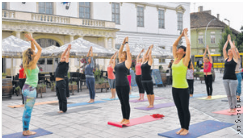
Táncos flashmobot tartottak a joga világnapja alkalmából a Magyar Király Hotel előtti téren