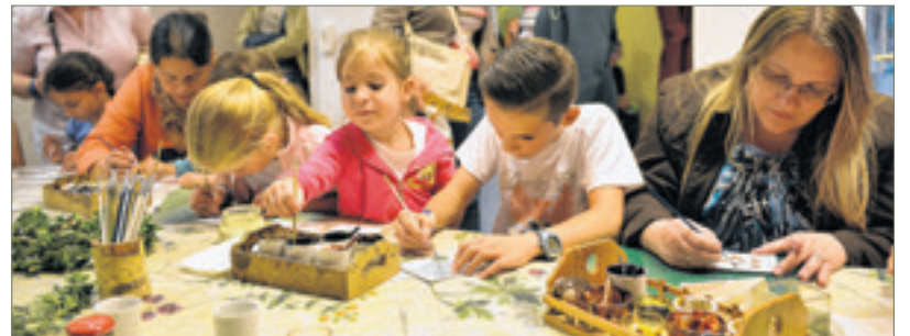
Színes tintákról álmodunk – interaktív játék gyermekeknek a Fekete Sas Patikamúzeumban