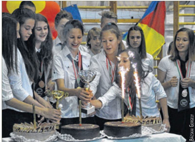
Kupák, torták, tűzijáték: megérdemelt elismerés

noki szereplést, több játékos is ott van. A mostani kislányok közül pedig háromra már szintén felfigyelt a szövetségi kapitány, amikor látta a csapatot. Néhány év múlva belőlük is válogatott lehet.” A mai lányok a diákolimpián az idősebbek között versenyezve