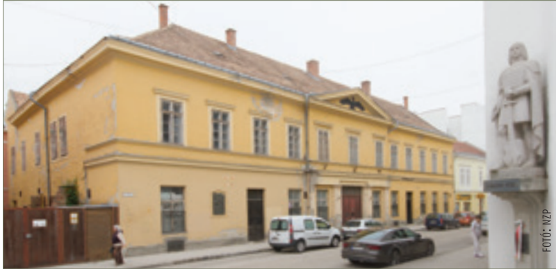
Az Ady Endre utcai Fekete Sas Szálló már évtizedek óta méltatlan állapotban várja a megújulást

a következő közgyűlésen előterjesztést fogadhat el a képviselő-testület. Két tervet is készítené a város, így elképzelhető, hogy a földfelszín alatt meg majd az autós forgalom, de az is lehet, hogy a forgalom átrendezése is megoldható lesz. A munka a multifunkcionális csarnok tervezésére kiírt közbeszerzési eljárással folytatódhat még ezen a nyáron. Mint a város országgyű-