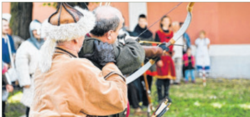
A család apraja, nagyja is jól érezte magát