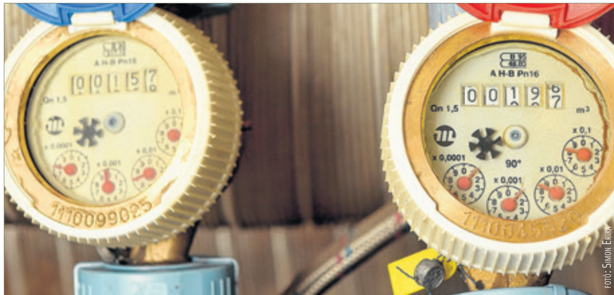
A mellékvizmérők hitelesítése nyolc év után lejár. Cseréjükért a lakástulajdonosoknak kell fizetni, de a társasházak, lakásszövetkezetek sokat tehetnek a terhek csökkentéséért. Csak nem mindegyik akar...

távadót is felszerelnek, így a jövőben a leolvasóknak nem kell bejut-