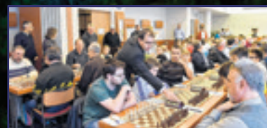
Böllhof-kupa, sakknagyüzem 15. oldal