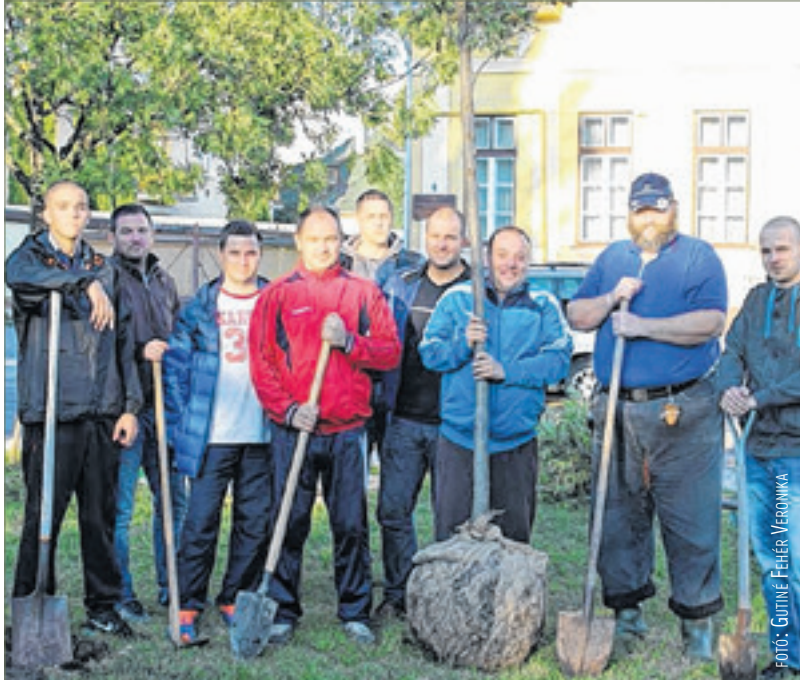
Két kőrisfát ültetett el a VÁLASZ a Prohászka-templom melletti téren