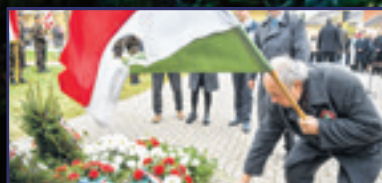
Ötvenkilenc éve ragadtak fegyvert 7. oldal