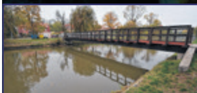
Újra lehet majd csónakázni 3. oldal