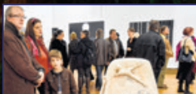
Fejér Megyei Őszi Tárlat 5. oldal