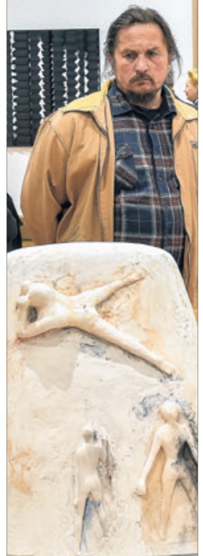
Az alkotói szabadság tárgyiasult formákban is megmutatkozott

vány a kiállító alkotók közül Nemes Ferencet találta a legjobbnak.