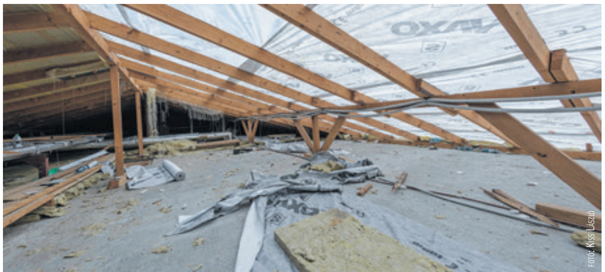
Ilyen volt a Gánts Pál utcai társasház teteje a vihart követő napokban

biztosító, pedig van olyan lakó, akinek kettő autója is összetört, amikor a szél által leszakított tető ráesett. A közös képviselő szavai szerint ezzel kapcsolatban folyamatosan tárgyal a biztosítóval.