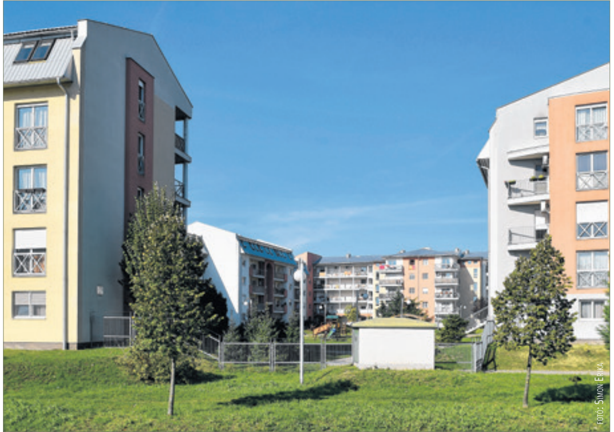
A tetőhéjazat helyreállítása ezen a héten befejeződhet