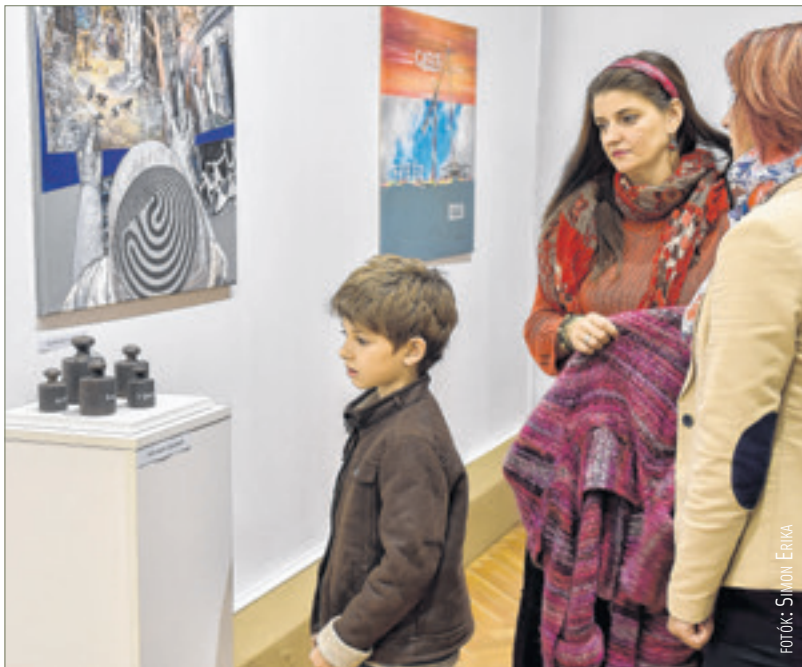
A kiállítóhoz hasonlóan a látogatók is több generációt képviseltek

A tárlat december 13-ig tekinthető meg a Szent István Király Múzeum Csók István Galériájában.