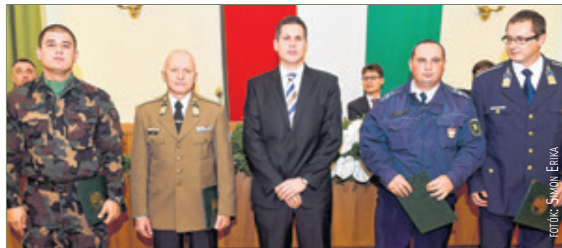
Négyen részesültek a Fejér Megyei Közgyűlés elnökének dícséretében

szabad megfosztani. Ezt követően Martin Luther King szavait idézte: „Abban a percben, abban a másodpercben, amikor elkötelezed magad a szabadságnak, függetlenségnek és igazságnak, akár meg is ölhetik a tested, a lelked akkor is győzni fog.” – majd így folytatta: „'56 – bár gyorsan ellobbant – mégsem mondható szalmalángnak. Inkább volt egy hatalmas hőtől fellobbanó keményfa hasáb, amit ugyan elolt a rázúduló vihar, de a felszín alatt izzik, parázslék tovább.