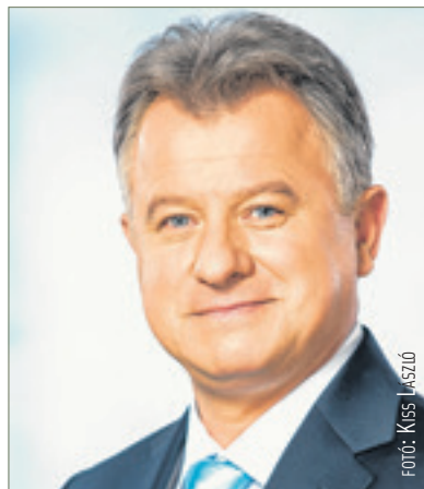
Törő Gábor országgyűlési képviselő

Szó sincs róla! Polgárdiban az évtizedeken át elhanyagolt Fejér Megyei Integrált Szociális Intézmény megújult, január-