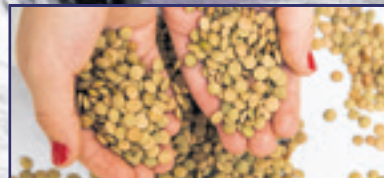
Újévi babonák: egész évre szerencsét hoznak 10. oldal