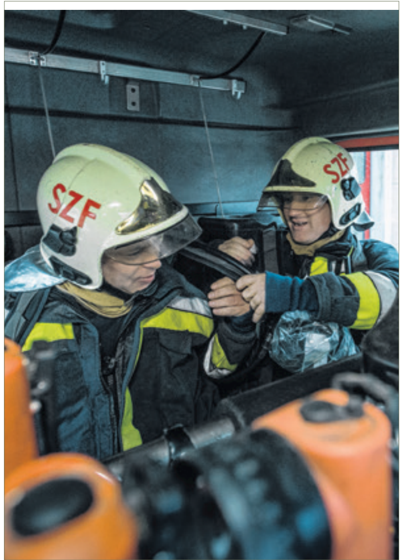
Hétköznap és ünnepnap a tűzoltók állandó készségben állnak, hogy ha szükséges, percek alatt menteni tudjanak

élmény marad számunkra, amikor egy égő tető oltása közben ért bennünket az éjféli, csak onnan vettük észre, hogy eljött az újév, hogy bármerre néztünk, körülöttünk mindenhol a tűzijátékok fénye látszott. Voltak olyan évek is, amikor nem sok helyre riasztottak minket és a laktanyában virslit főztünk magunknak, éjfélkor pedig szírenázással búcsúztunk az óévtől, családi hangulatban. Máskor egyetlen éjszaka alatt három ház teteje borult lángba, az egyik tüzet a szilveszteri tűzijátékból kipattanó szikra okozta. Az egyik legemlékezetesebb állatmentésünk