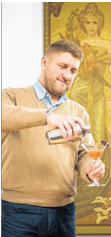
Férfiak, figyelmelem! A koktél nemcsak finom, de hölgyek számára igen csábító ital!

azoknak a vendégeknek a torkát, akik betértek a bárba, ahol Andor is dolgozott. De nemcsak a whiskeyt szeretik az írek, hanem a sört is, sőt – számomra meglepő módon – nagy mennyiségben fogyasztanak bort is. Főleg a napsütötte francia