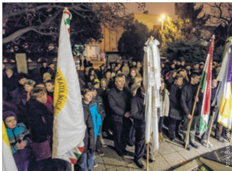
Kaszap István halálának nyolcvanadik évfordulóján fiatalok sokasága zárandokolt a példakép sírjához

Szükség van tehát példákra, irányokra, hogy értelmet nyerjenek a mindennapok, és ez nem csak a fiatalok számára, hanem az érettebb korosztálynak is fontos üzenet. Erre hívta fel a figyelmet a Kaszap-év, amelynek programjai a jövőben is folytatódnak. Kaszap István tisztelete és boldoggá avatásának vágya pedig tovább él a Székesfehérvári Egyházmegyében, a ciszterci rendben és a jezsuiták között is.