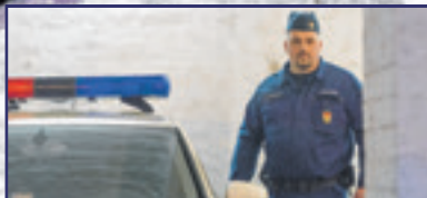
Ünnepi élményszikrák 4-5. oldal