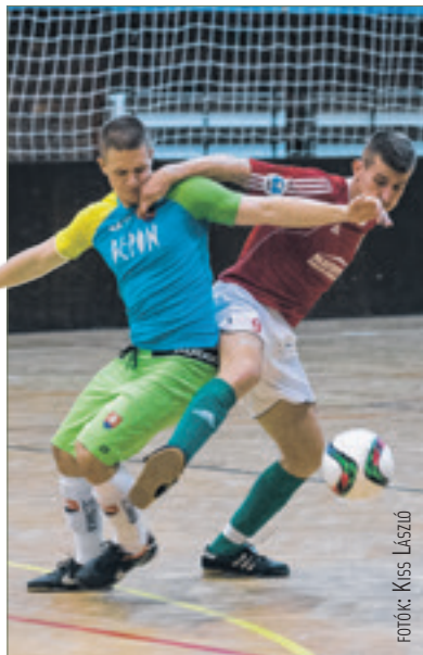
A küzdelem nagy volt, de a magyar kispályás-válogatott végül magabiztosan nyerte az első karácsonyi kupát

A magyar válogatott sikerével zárult a kispályás nemzeti együttesek számára kiírt I. Christmas Cup Hungary, a tornán a magyar válogatott Szlovákiát és Szlovéniát előzte meg a Videoton Oktatási Központban. A Videoton Baráti Kör Egyesület hagyományos évzáró futballfesztiváljának nyitónapján a pengés öregfiúk is pályára léptek. A torna december 30-án zárul.