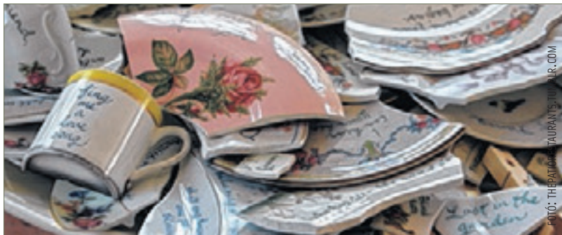
Dániában a törött edények szerencsét hoznak

A dánok sem ünnepelnek visszafogottan. Régi edényeket, tálakat törnek a barátaik ajtajában. Minél nagyobb a lárma és a cseréphalom, annál nagyobb lesz a házigazda szerencséje, hiszen ez azt jelenti, sok ember van, akire számíthat.