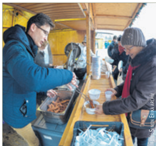
Mintegy ezer adag lencsefőzelék fogyott el 2015. első napján

A Gárdonyi Géza Művelődési Ház és Könyvtár Egyesület hetedik alkalommal hirdeti meg nemzetközi meseíró-pályázatát. A pályázatra a világ bármely országában élő 8–15 éves gyermekek magyar nyelven írott meséit várják e-mail-ben, csatolt Word dokumentumban vagy postai úton négy példányban 2016. február 29-ig. A pályázatra a 2001. január 1-je és 2007. december 31-e között született gyermekek meséit fogadják. A mese mellé feltétlenül csatolják 1.) a meseíró nevét, 2.) születési idejét (év, hónap, nap), 3.) postacímét (ország, település, utca, házsám, irányítószám) és 4.) szülei egyikének lehetőleg e-mail-címét vagy telefonszámát. A pályaművek terjedelme legfeljebb hatezer karakter (három nyomtatott oldal) lehet. Témájukkal, irodalmi formájukkal kapcsolatban nincs semmiféle megkötés. Egy pályázó csak egy mesét küldhet be. A pályázó a mese elküldésével hozzájárul műve bármilyen formában történő, külön ellenszolgáltatás nélküli, későbbi nyilvánosságra hozásához. A pályázat szellemi mecénása Lezsák Sándor költő, a Magyar Országgyűlés alelnöke. A bírálóbizottság neves írókból áll. A díjnyerteseket oklevéllel és egyedi művészeti alkotással jutalmazza. A döntést követő ünnepélyes eredményhirdetés 2016. június elején lesz Székesfehérváron. A díjazottakat május 10-ig telefonon vagy e-mail-ben értesítik, illetve névsorukat a www.ggmuhaz.hu honlapon közzéteszik. A legjobb írásokat az egyesület egy későbbi időpontban megjelenteti.