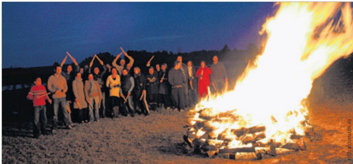
Vannak helyek, ahol szilveszterkor tüzet is gyújtanak

először feljött a víz felszínére, elárulta a leendő férj nevét. Ha az üres volt az első, akkor a lányok elkeseredtek, hiszen az évben nem számíthattak komolyabb kérére. A disznókat is segítségül hívták a még pártában lévők. Hajnalban kiosontak az ólhoz. Jól megrugdosták az oldalát, és ha az állatok elkezdtek röfögni, akkor már szinte készülhettek is az esküvőjükre. Újévkor a vénlányok sem aludhattak nyugodtan, ugyanis a falubeli legények ilyenkor csúfot üttek belőlük: a ház tetejére egy szalmabábút állítottak. Azonban ha a lány apja figyelmes volt, akkor elvitte a létrát, így a szemtelen fiúk kénytelenek voltak a tetőn tölteni az éjszakát.