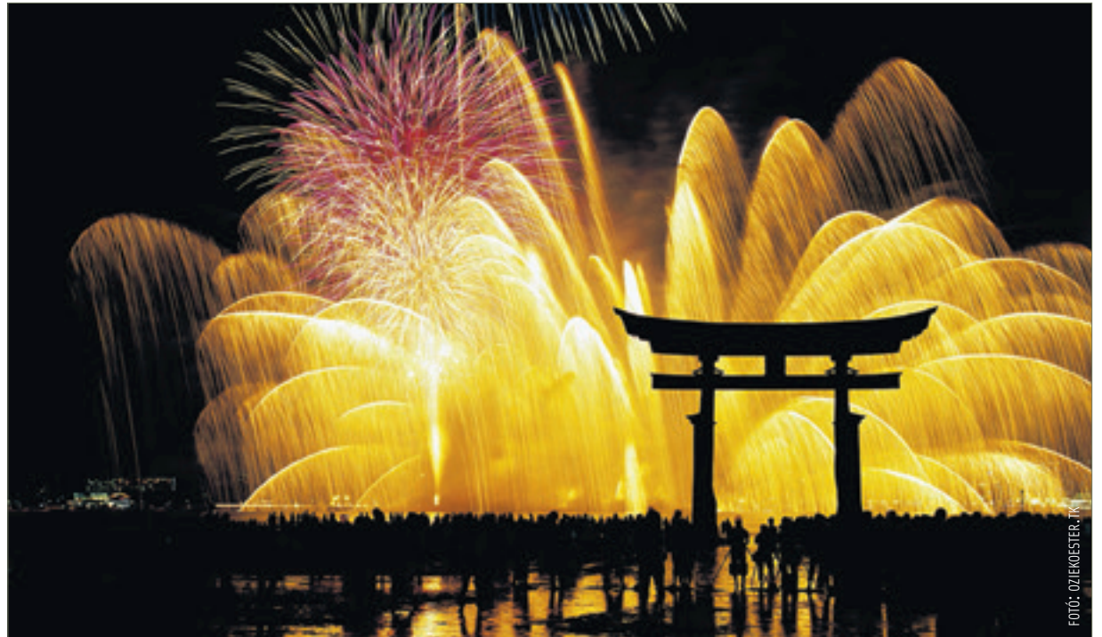
Japánban a tűzijáték mellett a harangokat száznolcszor ütik meg

lanság, az irigység és a butaság. Azonban minden egyes bűnnek tizennyolc különféle árnyalata van, ezért van szükség a száznolc harangütésre. Újévkor az emberek