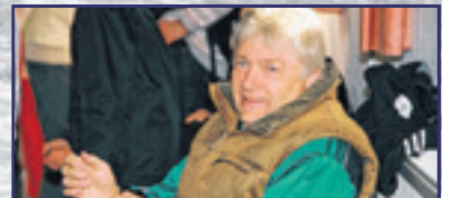
Elment a mester 14. oldal