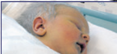
Különleges baba karácsonyra 3. oldal