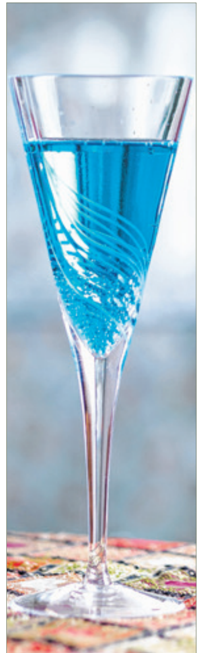
Feketeszeder-likőr helyett használhatunk Blue Curaçao-szirupot is, attól lett ilyen szép óceánkék színe a mi Kir Royalunknak

Tetszőleges pohárba egy-két jégkockát teszünk, rátöltjük a whiskeyt, felöntjük a gyömbérral, beleejtjük a citromot, és szívószállal kínáljuk. Ügyesebbek citromspirált is készíthetnek hozzá, és azt tehetik a pohárba.