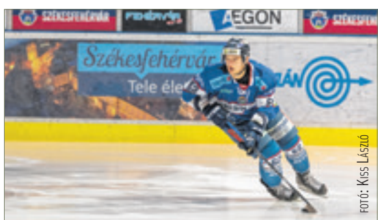
Az új év sem telhet sport nélkül

Fehérvár AV 19 – Dornbirner Eishockey Club Január 10. 17.30, Ifj. Ocskay Gábor Jégcsarnok