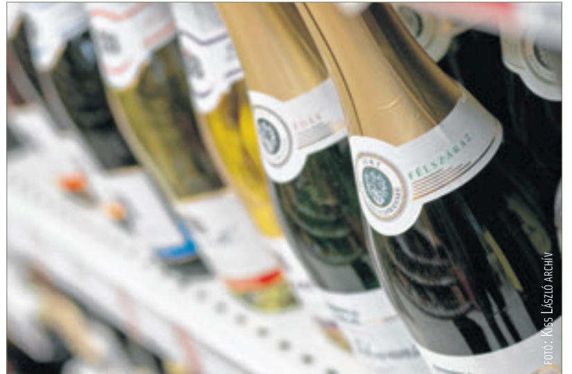
A pezsgő sokáig a gazdagok italának számított, ezért aki szilveszterkor pezsgőt iszik, az év többi napján sem fog szűkölködni

A ház körül végezhető munkák is pontosan meg voltak szabva: tilos volt mosni, varrni, fonni, de még inkább teregetni, ha valaki el akarta kerülni valamelyik közeli