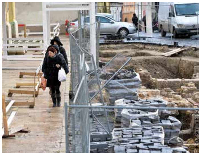
Kidöntötték a Bazilika kerítését – az ittas fiatalokat perceken belül elfogták