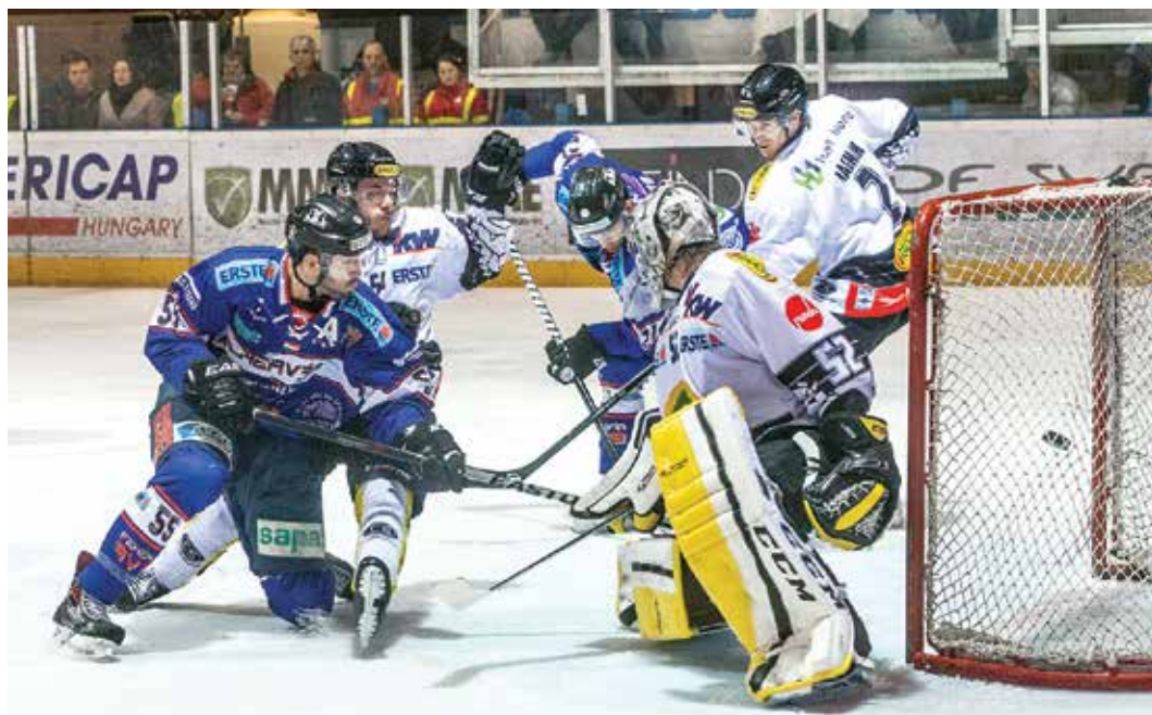
A Dornbirn csapatával kétszer játszottak Kovácsék, vereség után győztek