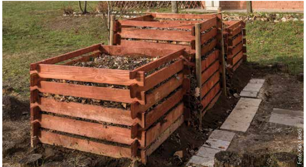
Ezekbe a komposztáló ládába bárki beleszállhatja háztartási szerves hulladékát

élőknek abban, hogy Palotaváros eme szegletén megvalósulhasson a komposztálás. A ládák előnyeit egyelőre három társasház használja ki, de van, aki a Bátky Zsigmond utcából hozza ide konyhai és kerti hulladékát.