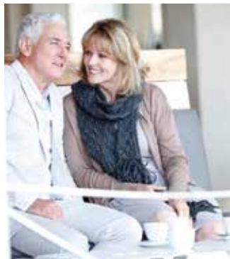
Ha túl sokat várunk, akkor lehet, hogy már késő lesz

Hallásunk csökkenése komoly akadályt jelentheti annak, hogy teljes életet éljünk. „Tapasztalatom szerint azok a hallásvesztéssel élő emberek, akik nem kezelték problémájukat, idővel befelé fordulóvá válnak. Ennek oka, hogy nem értik meg pontosan, hogy mit mondanak nekik, és kényelmetlennek érzik,