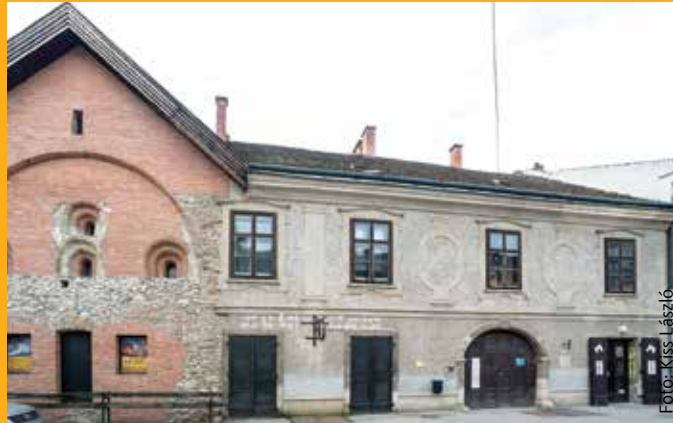
Az Oskola utca 6. szám alatti épület is a SZÉPHŐ kezelése alatt áll, ezért itt is érvényes a megújult elektronikus dokumentumkezelés, ahol a tulajdonosok bármikor online betekintheznek társasházuk hivatalos irataiba

Az osztályvezető a legfontosabb célként fogalmazta meg az ügyfelek elégedettségének elérését. Ennek érdekében elsőként fel kellett mérni Székesfehérvár lakóinak az igényeit. A változó piaci környezethez való alkalmazkodás mellett a működés hatékonyságát, minőségét javító in-