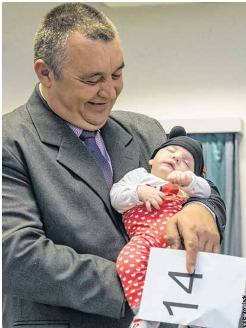
A legkisebbek is részt vettek a programon

farsangi fánk is került az asztalra. A programot tánczással zárták, ahol a gyerekek együtt szórakozhattak a szülőikkel. A programon közel harminc család vett részt. Többen is lehettek volna, de a tomboló influenzaszézonban sokan megbetegedtek, így nem tudtak farsangolni. Az intézményben nevelkedő kamaszok is kedvet kaptak a közös mulatozáshoz: ők szombaton veszik birtokba a Viktória Központot.