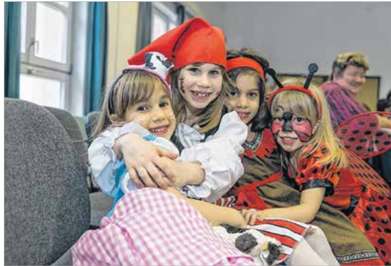
Szeretettel és jó hangulatban telt a farsangi mulatság

A kiszámíthatatlan időjárás következtében az ember néha már azt hiheti, itt a tavasz. A farsangi időszak és a farsangi mulatságok valójában télbúcsúztató programok. A Székesfehérvári Gyermekvédelmi Központban évekként kezdődött el a hagyomány, hogy a nevelőszülőknél élő gyermekek közös farsangi mulatságon vehetnek részt családjukkal. A régi hagyományt négy évvel ezelőtt felelevenítették, és a mókát azóta is minden évben megszervezik. A farsangi mulatság sikerét mi sem bizonyítja jobban, mint hogy a családok évről évre részt vesznek benne, és a gyerekek lelkesen várják. Éppen ezért pénteken jelmezes kislurkókkal és annál nagyobb hangjukkal telt meg a Viktória Központ. A folyosón és a konferenciateremben még az utolsó percekben is lázasan készülődtek a gyerekek. Még egy kis igazítás a jelmezen, utasítás a szülőknél, hogy jobb is lehetne a smink, javítsanak rajta.