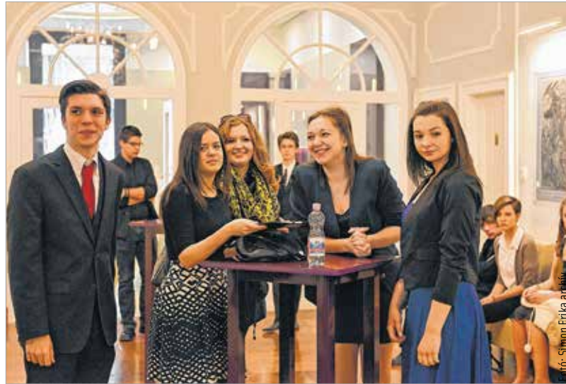
A várakozás pillanatai a 2014-es döntőben

A Fehérvár Média centrum a Székesfehérvári Egyházmegyével, Székesfehérvár önkormányzatával, a Szent István Művelődési Házzal és a Vörösmarty Színházzal együttműködve ismét Fehérvári Versünnepet szervez. A programsorozat fővédnöke Spányi Antal megyés püspök valamint Cser-Palkovics András polgármester. A nagy múltú verseny a város és a térség egyik jelentős tehetséggondozó, értékközvetítő programja. Idén is sok jelentkezőre számítanak a szer-