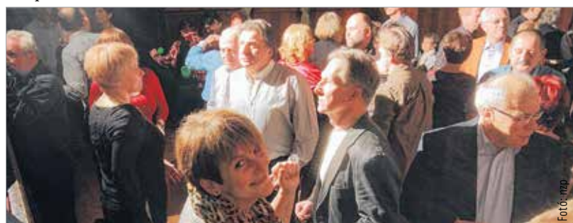
Ezeket a pillanatokat az első számok elhangzásakor rögzítettük, később nem volt ennyi hely

akárcsak negyvenöt esztendeje. Az örökzöld Bikini-slágereket együtt énekelte az egész művelődési ház. Bár én csak fotózni mentem, de megtanultam, egy év múlva vinnem kell a fiamat és a lányomat is, hogy megláthassák, mi is hiányzik nekik! A negyvenöt éves fehérvári rockbanda, a Gorsium éjszakát betöltő bulival ajándékozta meg a bátrakat.