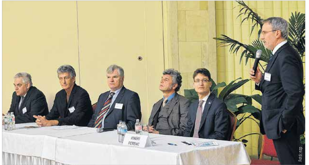
A világ fejlődésében a nők és gyermekek alapvető és különleges szerepet játszanak, ezért kitüntetett jelentőségű az őket érintő egészségügyi ellátás is – vallják a IV. Fehérvári Orvosnapok szervezői