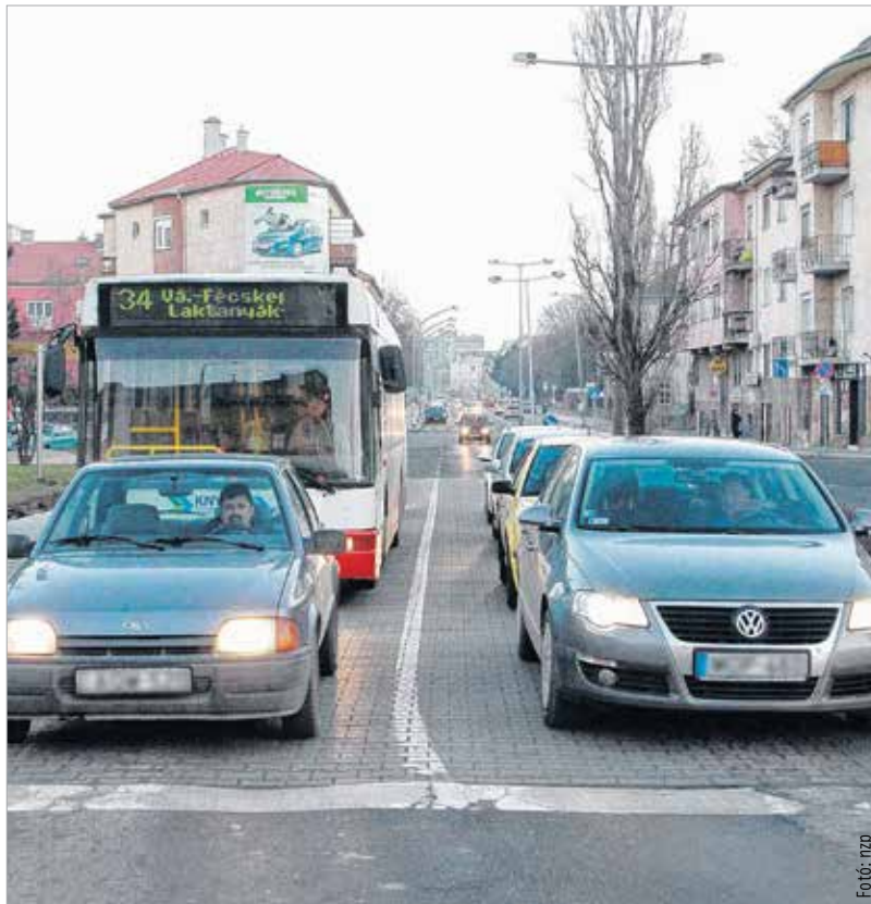
Ezen az útszakaszon hétfőtől munkagépek dolgoznak majd, és járművel csak az ingatlanokhoz közlekedők mehetnek be

Minden érintettet figyelmeztetnek, hogy a Várkörút hétfő reggeltől munkaterületnek tekintendő, ami annyit jelent, hogy a területen út- és közmű-építés folyik majd, ahol a tájkozatókat, közúti jelzéseket szigorúan be kell tartani! A gépjárműveket nem lehet a munkaterületen hagyni. A szakemberek kéri, hogy ott parko-