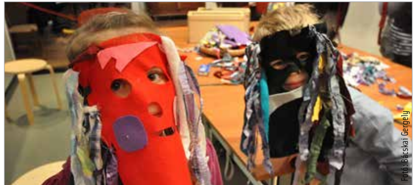
Maskarás gyerekek próbálták elijeszteni a telet a múzeumban

A tikverőzés a farsang utolsó napján kerül megrendezésre Mohán. Minden év húshagyókeddjén a 14-20 év körüli legények tradicionális maskarába öltöznek: rongyszalagokkal gazdagon díszített bohócnak, fehér ruhás szalmatoroknak, szerencsehozó kéményseprőnek, a legfiatalabb alakoskodók lánynak. A színes farsangi maskarások végigjárják a falut, és minden házba-udvarba betérnek, hogy összegyűjtsék a tyúkólakban talált tojást, mint a termékenység és bőség szimbólumát.