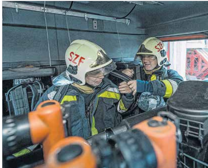
A riasztást követő egy-két percen belül a tűzoltók már az autókban ülnek, útna a helyszín felé

megnyugodjon. A minimális információ birtokában elindítjuk a riasztást, és visszahívjuk őt.