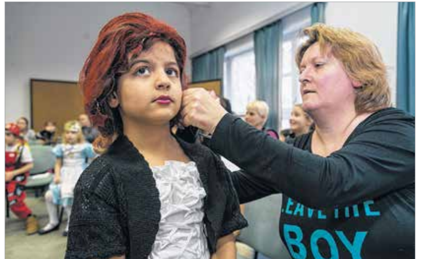
Utolsó igazítás színpadra lépés előtt

tak meg tőlük, ők is büszkén álltak a színpadra. Szuperhősök figyelték a rendet, és abájos hercegnők is megfértek a morgó krokodillal. Megannyi ötletes maskarát találtak ki a gyerekek. A legjobb jelmez tulajdonosa tortát és ajándékcsomagot is kapott. A Székesfehérvári Gyermekvédelmi Központba rengeteg felajánlás érkezik év közben. A gyerekek körében az adományoknak köszönhetően népszerű plüssállatokat, társasjátékokat, autókat is szétosztottak. Senki nem üres kézzel ment haza. A jelmezverseny után tombolasorsolás is volt, ahol az összes résztvevő gyermek számát kihúzták. A nevelőszülőknél is fontos szerepük volt, ők süteménysütő verseny keretében mérték össze a tudásukat. Különböző krémes, habos, színes édességekkel készültek, de hagyományos