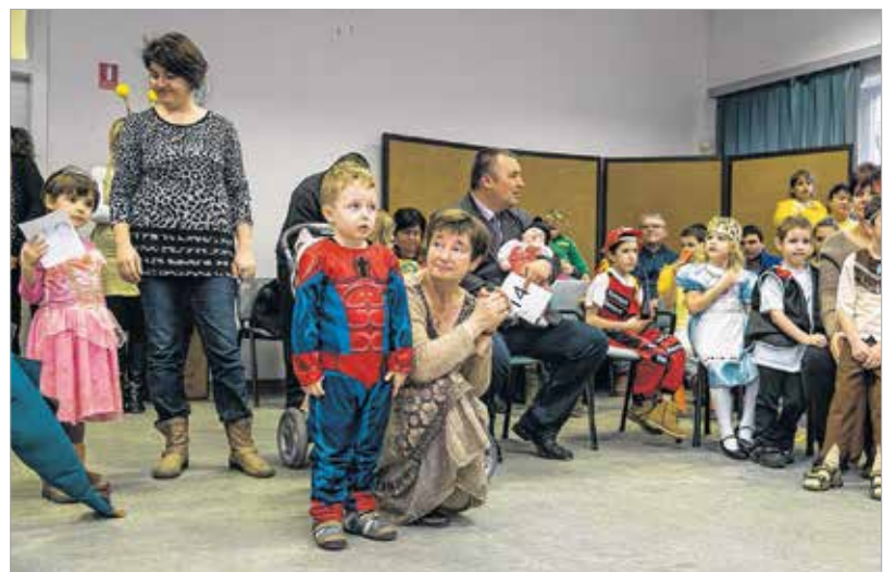
Az intézmény vezetője bátorítja a kis superhőst