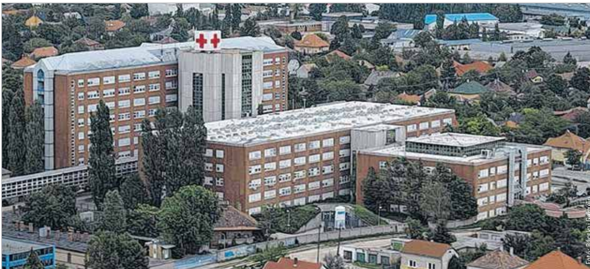
A korábban elrendelt látogatási tilalom valamennyi osztályra továbbra is érvényben marad Fejér megye kórházaiban

Fontos, hogy ebben az időszakban erősítsük immunrendszerünket, így a fertőzéseket nagyobb eséllyel ki tudjuk védeni. Gondoskodjunk a megfelelő mennyiségű vitaminnal és folyadékpótlásról! Nagyanyaink házi praktikái között az egyik leghatásosabb csodaszerként tartják számon a házi tyúkhúsleveset. Hatása magas hőfokban rejlik: a lerakódások fellazulnak a nyálkahártyán, így könnyebben kitisztul a szervezet. Jobb, mint a forró vizes inhalálás! Sokan esküsznek a következő receptre is: Torokfájáshoz forraljunk vizet, amibe mézet és friss citromot teszünk, és ennek egyvelegét fogyasztunk! Sokan arra gondolhatnak, hogy ez tea, filter nélkül. Így is van, ezért, ha valakinek jobban ízlik, nyugodtan fogyasszon teát mézzel és citrommal, de semmiképpen se cukorral! Ha fáj a torkuk és úgy érzik, valami le van rakódva, nyugodtan használjanak vizes öblögetést, mégpedig meleg sós vízzel, ami felszaggatja a torkon lerakódott elpusztult fehérvérsejteket, és javítja a vérellátást.