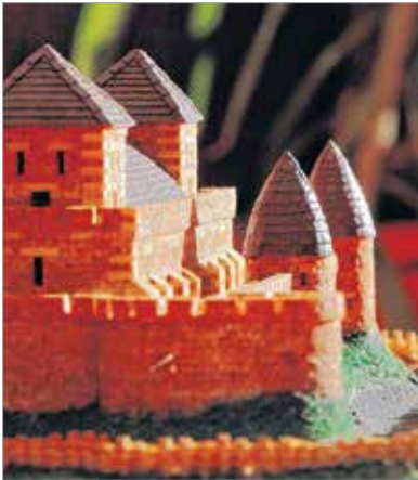
Várpalota dicső fényében, egy 1566-os rajz alapján 1:300 arányban

A török uralom alatt álló magyar várakról készített a szegedi makettező élethű másolatokat – gyufából. A sok ezer gyufaszál precízen áll a helyén, és adja vissza váraink eredeti formáját. Talán a fa tulajdonsága biz-