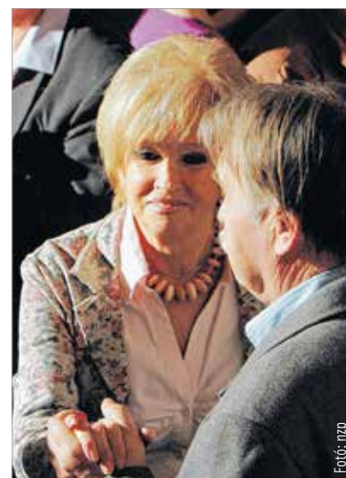
Az ifjúság csak akkor múlik el, ha azt úgy akarjuk, de a Gorsium zenekar ezt senkinek nem engedte

akárcsak negyvenöt esztendeje. Az örökzöld Bikini-slágereket együtt énekelte az egész művelődési ház. Bár én csak fotózni mentem, de megtanultam, egy év múlva vinnem kell a fiamat és a lányomat is, hogy megláthassák, mi is hiányzik nekik! A negyvenöt éves fehérvári rockbanda, a Gorsium éjszakát betöltő bulival ajándékozta meg a bátrakat.