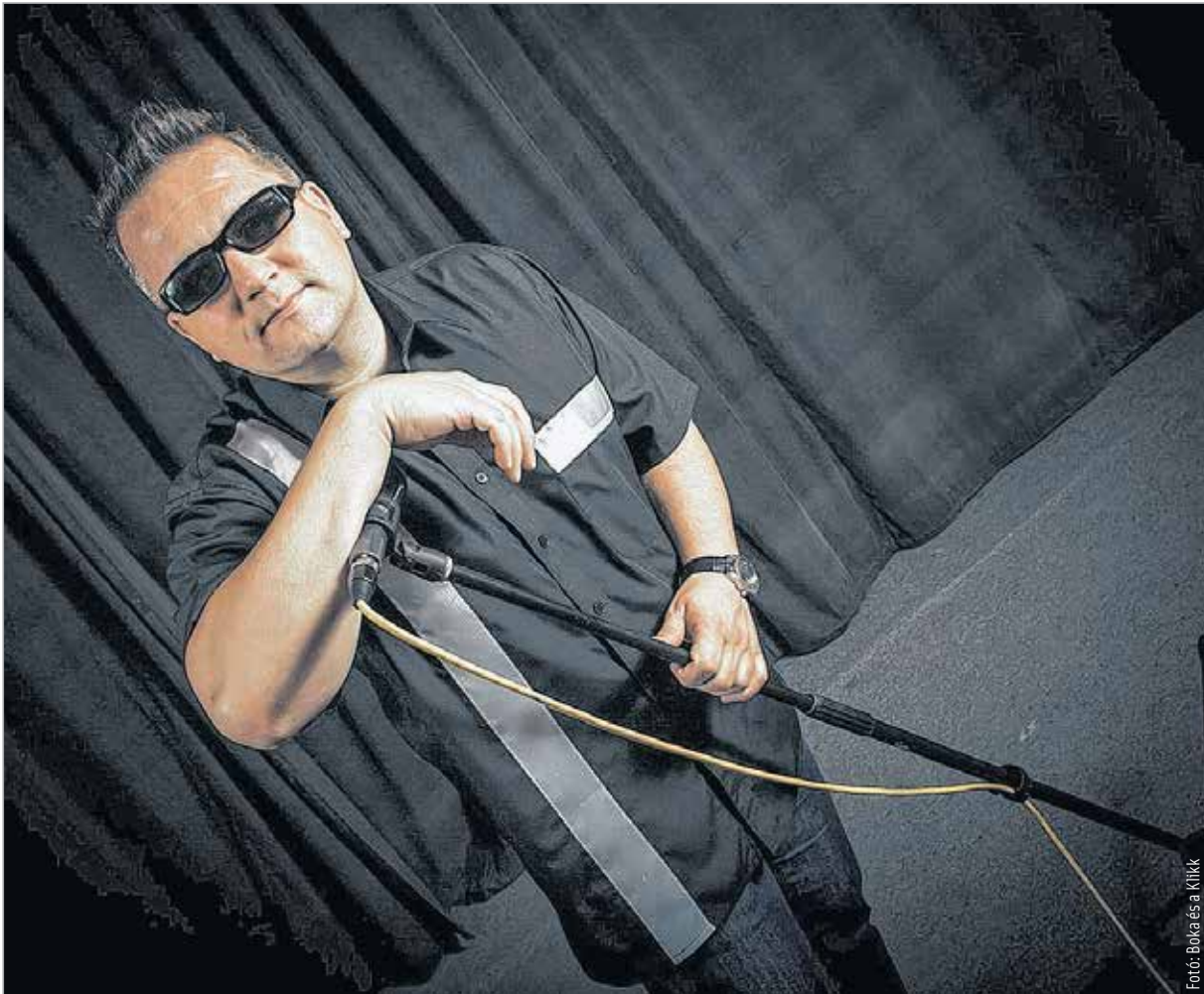
A rocker örökifjú nem hagy fel a zenéléssel, hiszen várja őt a Klakk