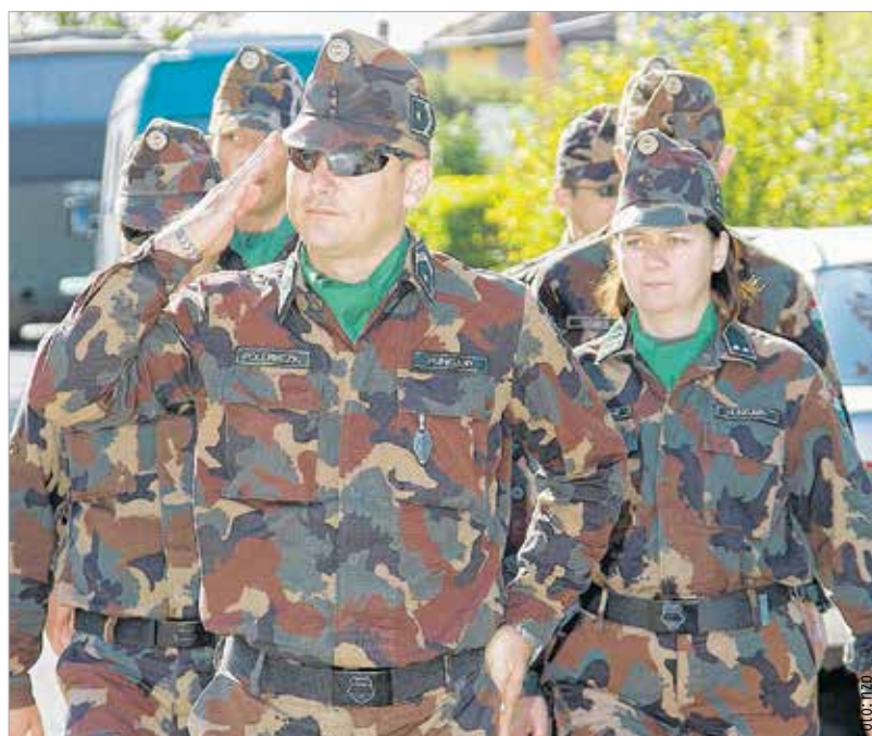
A gyors reagálású dandárokat saját hazájukban állomásoztatják, csak bevetéskor mozgósítják

Ez a központ igényel-e többlet infrastruktúrát itthon, Fehérváron? Esetleg munkahelyek is születnek?