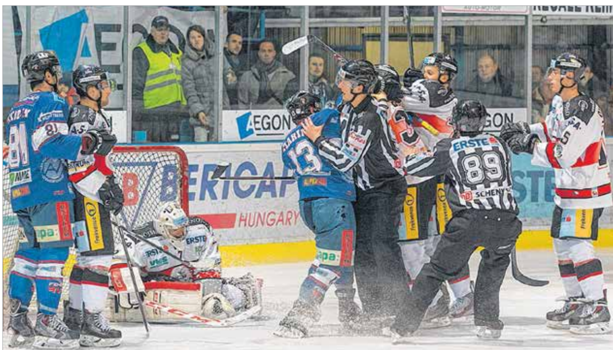
Ha kell, a csapat szó szerint megharcol a sikerért a jégen