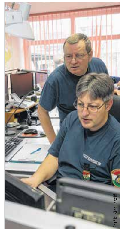
A riasztott gépjárművek helyzetét az ügyeleten végig lehet kísérni

Ha valaki meg tudja mondani, hogy miért szereti a párját, akkor már nem is szereti igazán, hiszen a felsorolt tulajdonságok alapján találhat egy másikat, egy ugyanolyat. Szerintem ugyanez vonatkozik a tűzoltó hivatásra is. Nem tudok arra válaszolni, hogy miért szeretem. Vagyis de. Csak.