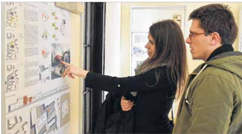
A nehéz építészeti problémára sok kreatív megoldás született

megközelítéssel bírnak. Kutya nehéz építészeti szituációban születtek ezek a pályamunkák. A saját pályázati történetemben nem találkoztam ilyen bonyo-