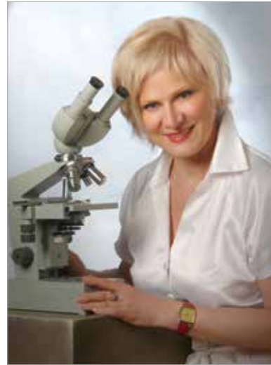
Szoboszlai Istvánné analitikus szerint már számíthatunk az első allergiás panaszok megjelenésére, érdemes felkészülni a tünetek csökkentésére

Az analitikus egy esettanulmányt is bemutatott. „Egy székesfehérvári fiatal férfibetegét csalánkiütés kivizsgálásával küldték ételallergia próbára. A páciens elmondása szerint az almától nehéz légzése volt, arra panaszkodott, úgy érzi, mintha fulladozna. Ezért nem fogyasztott már évek óta almát, amiért mindenki kinevette.