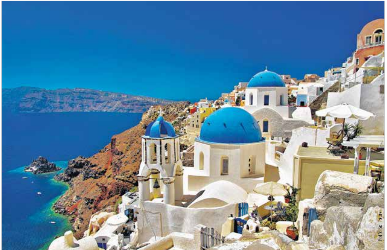
Santorini szigete nyaranta több, mint egymillió turistát vonz