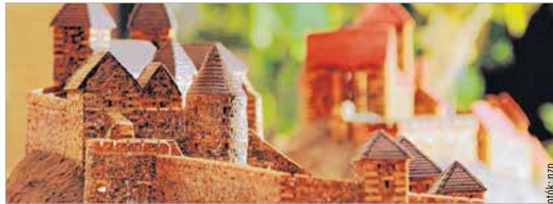
A szigligeti vár tornyainak háttérében a felvidéki Detrekő vára magasodik