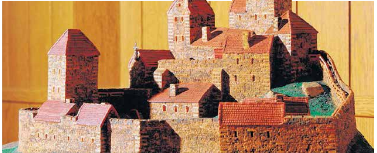
Talán egyre inkább felismerhető a valóságban is a hozzánk közel álló csókakői vár, mely előbástyája volt Székesfehérvárnak