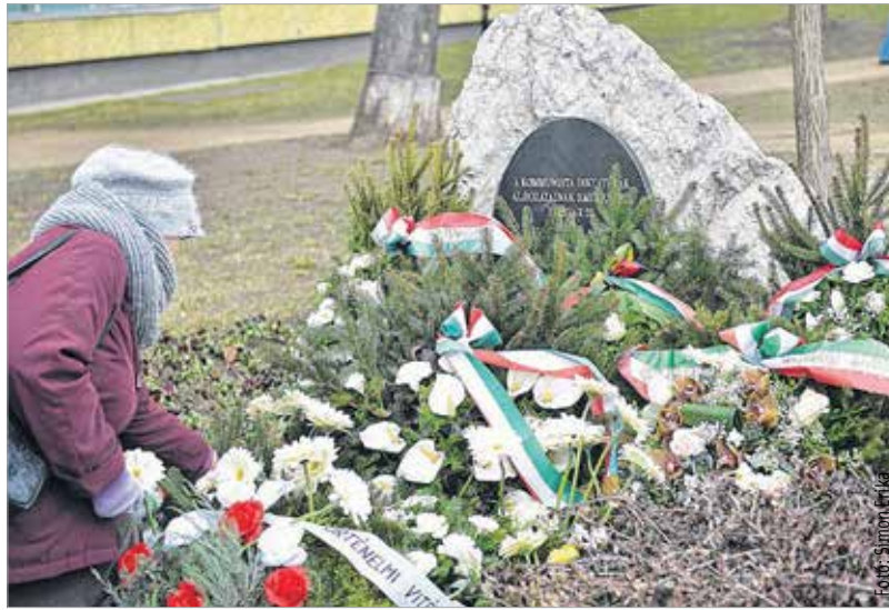
Koszorúval és egy-egy szál virággal tisztelegtek a kommunizmus áldozatainak emléke előtt az önkormányzatok képviselői, az '56-os szervezetek, a pártok, az egyházak és a rendvédelmi szervek képviselői valamint a fehérváriak közül számosan

Becklések és levéltári kutatások alapján körülbelül százmillióra teszik a kommunizmus áldozatainak számát az egész világon. Kelet-Közép-Európában az éhínségben, kényszermunka-táborban vagy kivégzés által elhunyt áldozatok száma eléri az egymilliót, de a rendszer áldozata az is, akit börtönbe zártak, vallattak, kínzottak, megbélyegeztek, akit csoport- vagy vallási hovatartozása miatt üldöztek, vagyis mindenki, akit a szabad cselekvés és választás lehetőségétől megfosztottak, testileg és lelkiileg meggyomorítottak.