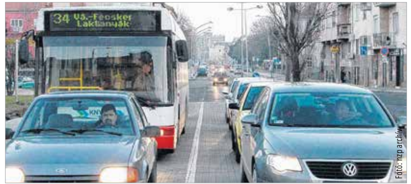
A 34-es busz utolsó útját járta a képen a régi Várkörúton, szombattól az utasok kérésére ismét változik az útvonala

rendszeresített valamennyi megállóhelyen megállnak. A szakemberek arra hívják fel a figyelmet, hogy a megoldással az átszállási kapcsolatok javulnak, de számítani kell arra, hogy csúcsidőben a menetidők növekedni fognak, így a menetrend kevésbé lesz kiszámítható.