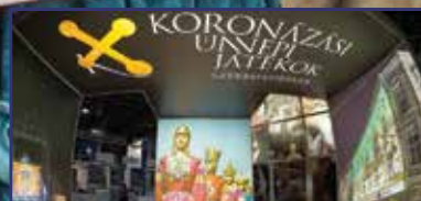
Legyen Székesfehérvár vendége! 5. oldal