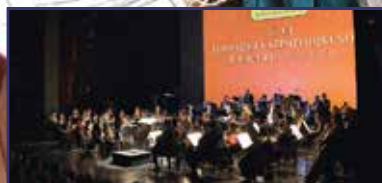
Zenével koronáztak 4. oldal