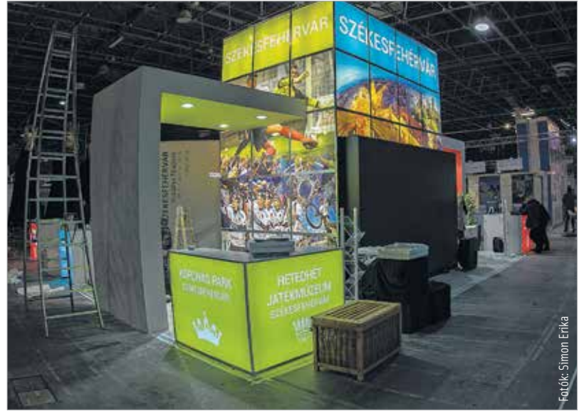
A belföldi díszvendég, Székesfehérvár standja szerda este ünnepi fénybe öltözött

Fehérvár standján természetesen a királyi óriásbábok is helyet kapnak, miközben a Szabad Színház tagjai népszerűsítik a várost. A kiemelt programokkal, kiállításokkal és a tartalmas szabadidőt biztosító helyekkel is megismerked-