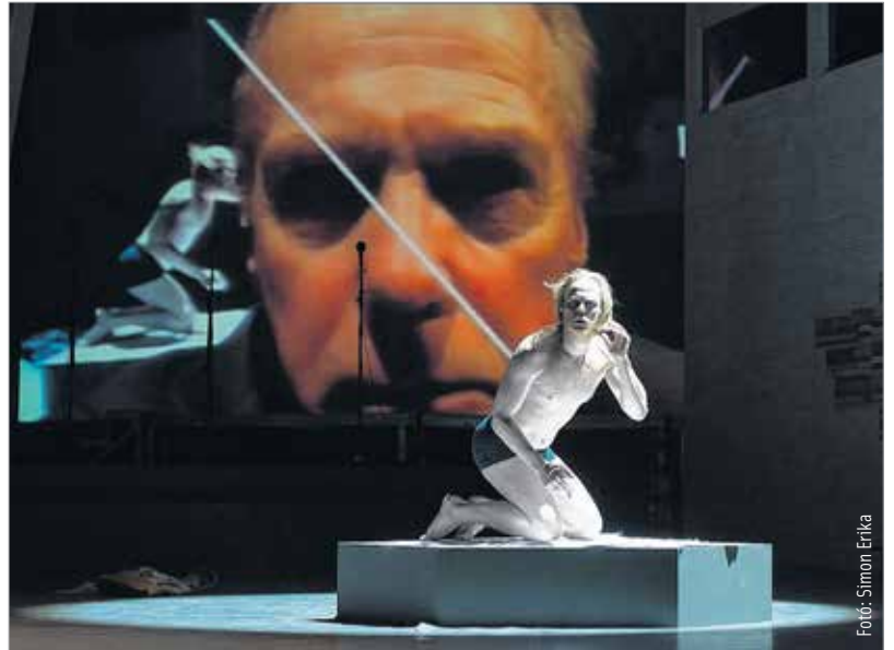
Mozart és Salieri története mai köntösbe bújtatva elevenedik meg a fehérvári teátrumban

Peter Shaffer minden korban aktuális problémát tesz meg darabja tárgyának: a tehetséges művész kiszolgáltatottságát a sznobizmussal, a korlátoltsággal szemben. Salieri tragédiája, hogy Mozart létezett. Az Amadeusban két kivételes egyéniség, Salieri és Mozart találkozik, és kényszerül egymás mellett alkotni. Ez a találkozás lesz mindkettejük tragédiája. Salierinek megadatott, ami Mozartnak nem: egzisztencia, előkelő udvari állás, kibontakozási lehetőség. Mozartnak viszont megadatott, ami Salierinek sohasem: a szabadság és a határtalan zenei zsenialitás.