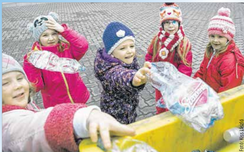
Több tonna papír és műanyag hulladék került szétválogatva a bölcsődék, óvodák és iskolák gyűjtődényeibe. A verseny folytatódik, ősszel új nyertesek örülhetnek a jó eredménynek és a pénzjutalomnak.

Napjainkra a környezeti nevelés felértékelődött. A természettel, környezettel való kapcsolat újraértelmezése szükségesszerűvé vált. A szemléletmód megváltozása egy új magatartásforma kialakítására illetve a hétköznapi életvitel megváltoztatására irányul. A hulladék elkülönített gyűjtése alapvető fontosságú, így érdemes kihasználni, hogy a gyermekkorban felvett szokások felnőttkorra természetessé váljanak. Komolyan veszi a fiatalok környezettudatos nevelését a Depónia Nonprofit Kft. Ezt a célt szolgálja a tavaly ősszel közzétett versenyfelhívás is. A 2014. október elsején kezdődő papírgyűjtési verseny folyamatos szelektív hulladékgyűjtésre és leadásra ösztönzi a bölcső-