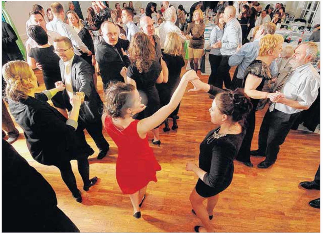
Megmutatták a Táncházban, hogy mulatnak a vigasságcsinálók