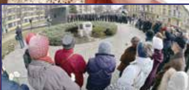
Százmillió áldozat világszerte 3. oldal