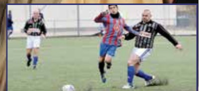
Tizennégy csapat az emlék- tornán 14. oldal