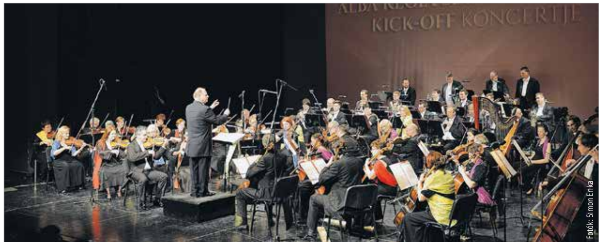
Sikerrel lépett színpadra a megújult Alba Regia Szimfonikus Zenekar

Lemaradt a koncertről? Nézze meg a TV-ben! Az Alba Regia Szimfonikus Zenekar koncertjét a Fehérvár Televízió felvételről közvetíti 2015. március 7-én 20 óra 50 perces kezdettel.