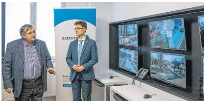
Van, aki örül, van, aki nem, de a térfigyelő kamerák rajtuk tartják a „szemüket”