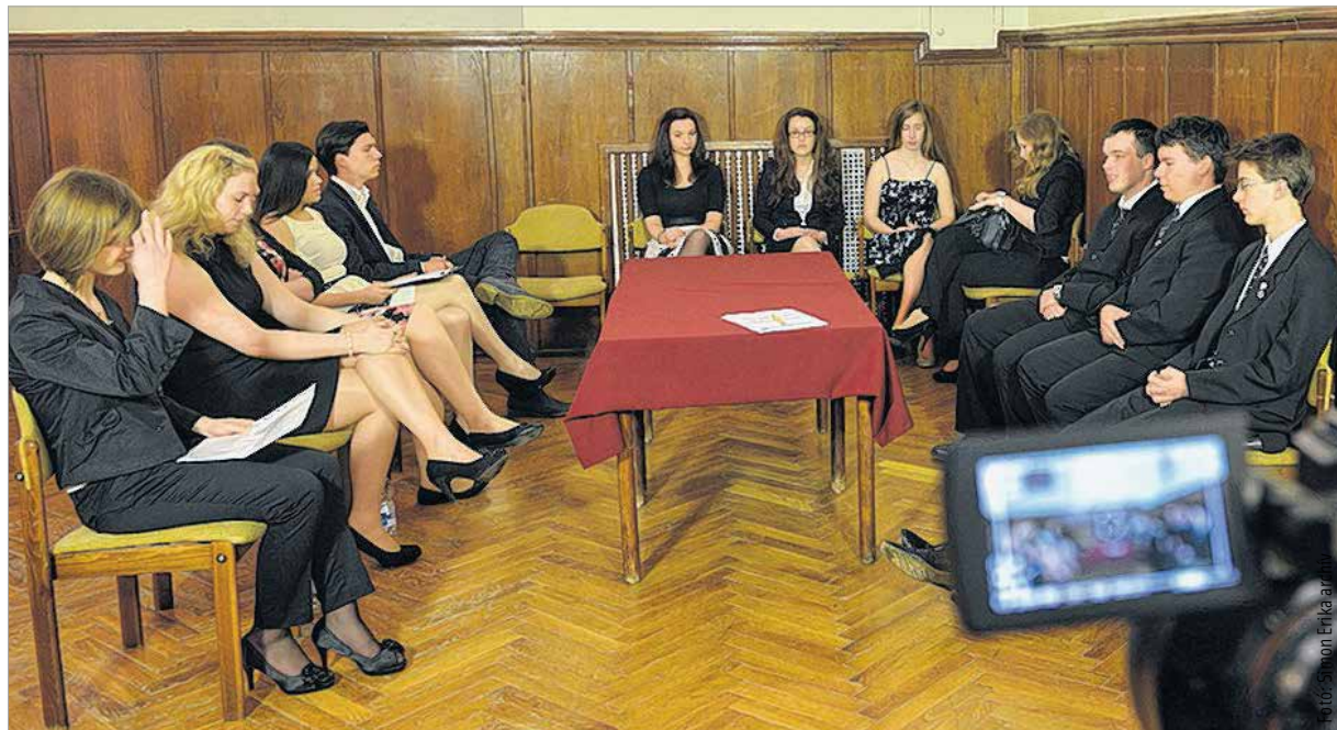
A Fehérvári Versünnepe döntősei tavaly is megmutatták: értik és szeretik a verseket, a magyar irodalmat

Kedvelik-e a mai fiatalok a verset? Joggal merül fel ez a kérdés. Azonban a Fehérvári Versünnepe bizonyította az elmúlt években, hogy a sztereotípiákkal ellentétben szeretnek a fiatalok verseket olvasni – és szavalni. az elmúlt években előadott verseket nézzük, talán az is megállapítható, hogy a nyugatos költők kifejezetten népszerűek a középiskolások körében. Kosztolányit, Karinthyt, Ady Endrét szívesen olvassák, vagy adják elő a fiatalok. A kortársak közül nagy hatással van rájuk Parti Nagy Lajos és Varró Dániel humoros költészete és Tóth Krisztina versei. A Fehérvári Versünnepe során a résztvevő fiatalok, a zsűri és a hallgatóság azt is megtapasztalhatja, hogy a vers nemcsak mondanivalója miatt érinti meg a lelket, de különlegesen felemelő hatást gyakorol, amikor a ritmussal, a személyes élményekkel felöltöztetve adják elő. Izgalmas