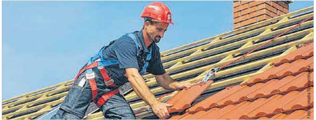
A hagyományos kerámia-cserép nyolcvan-száz évig is a ház éke lehet

A hazai piacon jelenleg a hagyományosnak mondható kerámia és betoncserép közül választhatnak a vásárlók. Előbbinek nagy előnye, hogy időtálló, széles választékkal rendelkezik, viszonylag könnyű, és a gyártók akár harminc-ötven év garanciát is biztosítanak termékeikre. A betoncserépek hasonlóan tartósak, hiszen különféle kezelésekkel látják el felületüket, hogy sokáig megőrizték eredeti színüket. Az elmúlt tíz év során a fémlemez is népszerű fedőanyaggá vált. „Léteznek ma már cserépmintájú, könnyű, minőségi lemezek is, melyek szintén