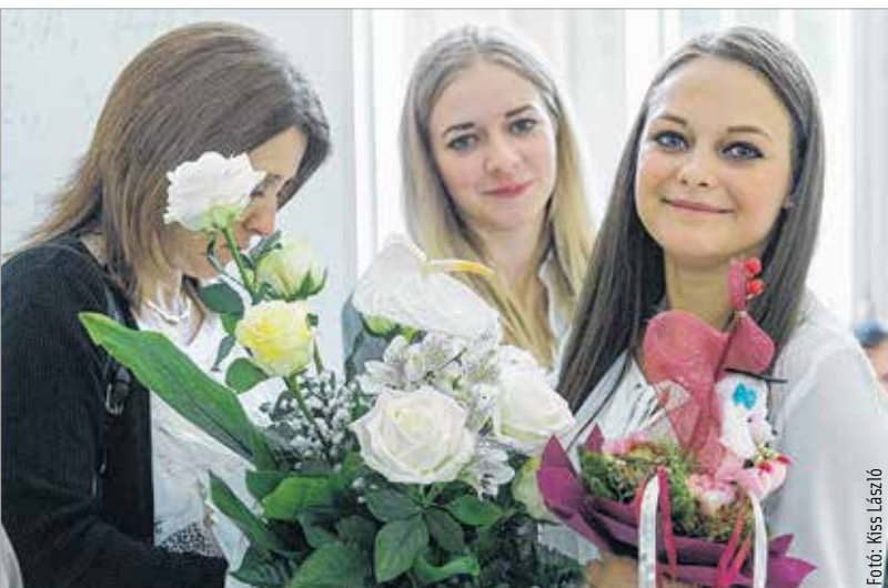
Három a nagylány

„Pályafutásom során több mint kilencezer dobást elhibáztam, vesztettem csaknem háromszáz mérkőzésen. Huszonhatszor vétettem el a rám bízott, győzelemhez szükséges utolsó dobást. Újra és újra hibáztam az életemben. Ezért tudtam mindig előrelépni.”