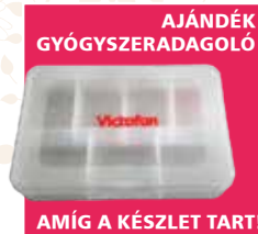
AMÍG A KÉSZLET TART!