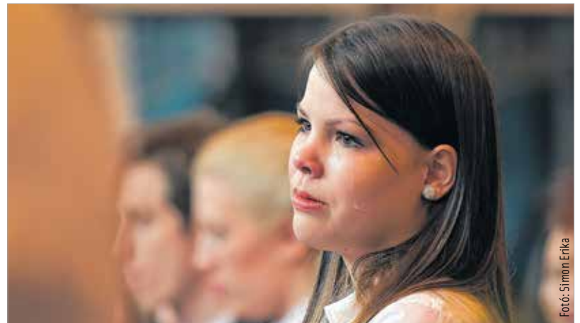
„A boldog édes ifjúság, emléke mindig visszajár...”