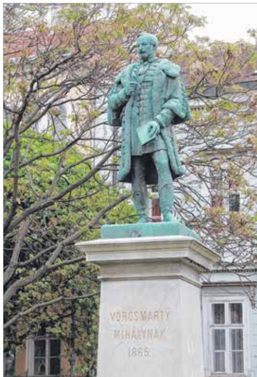
Pennával a kezében hozta 1865. májusának fagyos időjárását a költőírás, Vörösmarty Mihály illetve annak bronzszobra – vélte a népharag

koronázását. A budai vár alatt fagyott be a jég, azon a szakaszon, ahol egyébként hóforrások sora tartja melegen a folyó vizét. Esetenként fenéig átfagyott folyókról, tavakról szólnak a krónikák. A csapadék mennyisége nőtt, a párolgási veszteség csökkent, ennek köszönhetően a Balaton szintje a mainál több mint egy méterrel magasabban állt. Az 1550 és 1740 közötti időszakban az éghajlat különösen hidegre fordult. A befagyott Temze jegén vásárokat rendeztek. A talaj is négy láb mélyen átfagyott.