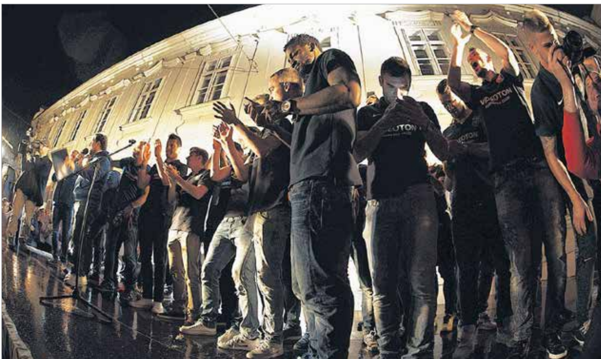
A Városháza előtti emelvényen késő éjszakáig tartott a fieszta. Ismétlés remélhetőleg május 20-án, a Magyar Kupa döntőjét követően!

A Vidi törtéjára a hab május 20-án kerülhet fel, a piros-kékek a Ferencváros ellen gyűjthetik be a bajnokság mellé a Magyar Kupa trófeáját is.