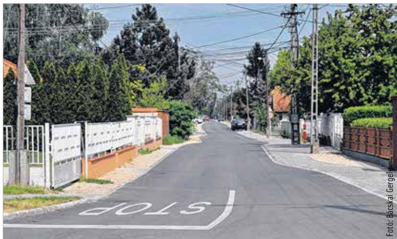
Megújult a Száva, a Dráva és a Bodrogi utca

együtt készült el. Tizenöt éve húzódó probléma oldódott meg az utak felújításával. Minden igényt kielégítő szakaszok készültek el, ezek az elkövetkezendő két évtizedben jó közlekedési lehetőséget biztosítanak a környéken élőknek. Az egész beruházás 1.2 milliárd forintba került, és teljes egészében európai uniós támogatásból valósult meg. Ebből a három utca teljes újrateremtése több mint négyszázmillió forintot tett ki. A három felújított utcában a járdák térkövesek, 3680 négyzetméternyi burkolatot raktak le a szakemberek. Tizenháromezer négyzetméteren aszfaltoztak, 7900 méternyi szegélykővet helyeztek le, és mintegy hatszáz méteren csapadékvíz-elvezető csatorna épült.