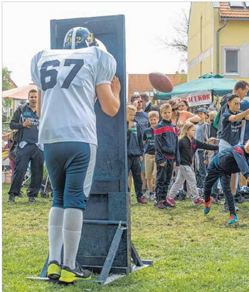
A Fehérvár Enthroners amerikaifoci-csapat most is valami különlegessel készült: ezúttal a játékosokat lehetett célba venni a tojáslabdával