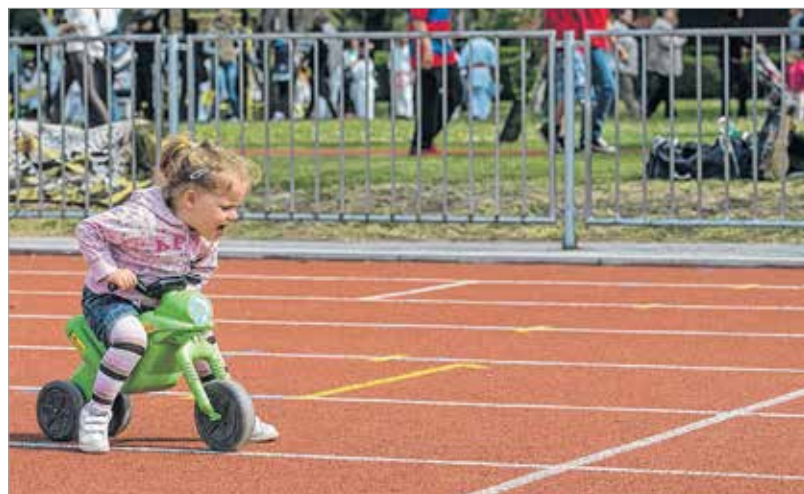
Vigyázz, kész, rajt! – a kicsik is keresték a kihívásokat