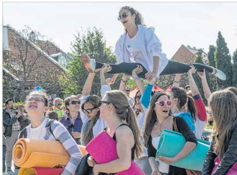
A szinkronúszó lányok vagánysága városszerte ismertté vált, köszönhetően látványos bevonulásuknak