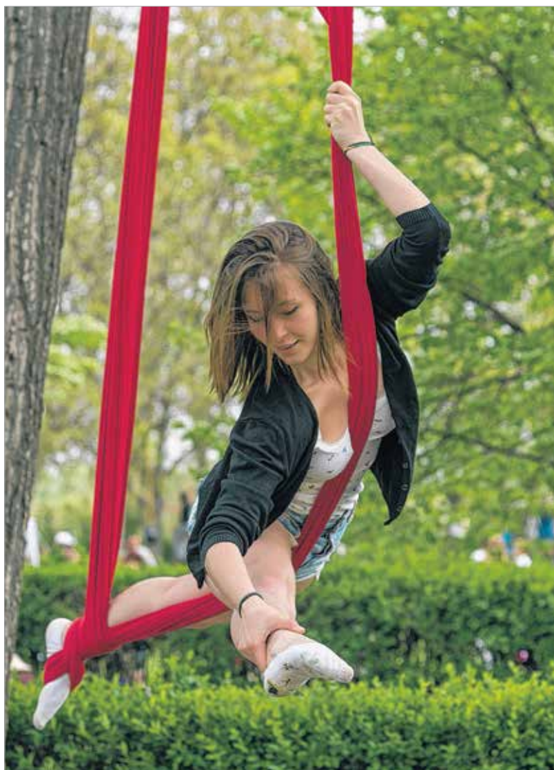
A flyfitness-bemutatón a szép hölgyek mellett a káprázatos produkciókban is gyönyörködhetett a nagydémű