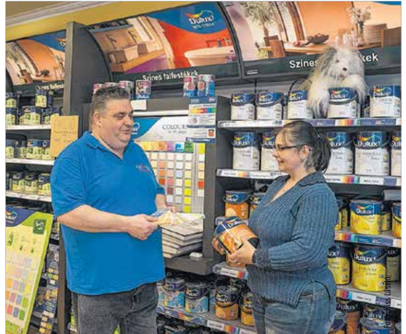
Újra trend a pasztellszínű fal, és egyre kedveltebbek a szürke különböző árnyalatai