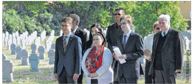
A konferencia előtt megkoszorúzták az első világháborús olasz katonák sírját a Szentlélek temetőben

Az 1915-ös esztendő komoly változást hozott az első világháború menetében: a központi hatalmakkal szövetségi viszonyban álló Olasz Királyság május 23-án hadat üzent az Osztrák-Magyar Monarchiának. A döntés senkit sem lepett meg, hiszen az olaszok számos okból sokkal inkább az antant irányába húztak. A szomszédos Ausztria-Magyarországgal szemben területi követeléseik voltak, és pozíciókat építettek ki a Balkánon. A gyors hadi sikerek helyett az Isonzó völgyében, Doberdónál és a Dolomitoknál több évig tartó állóháború alakult ki.