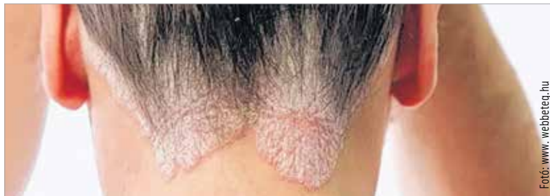
Leggyakrabban a térd, a könyök vagy a fejbőr felületén jelennek meg vörös színű, fehéren hámló, több centiméter nagyságú foltok

Az ápolók béremelést, megfelelő oktatást és a munkájuk megbecsülését kérik – ezért szerveznek utcai felvonulást május 12-ére, az ápolók nemzetközi napjára a fővárosba. A Fejér Megyei Szent György Egyetemi Oktatókórház ápolói is csatlakoznak az országos megmozduláshoz.