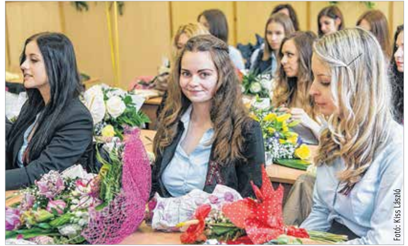
Utoljára együtt a hunyadis iskolapadban