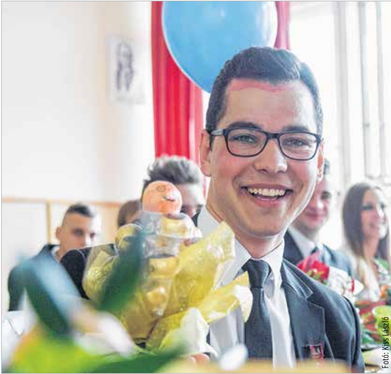
A szívből jövő jókedv a sikeres érettségi egyik záloga