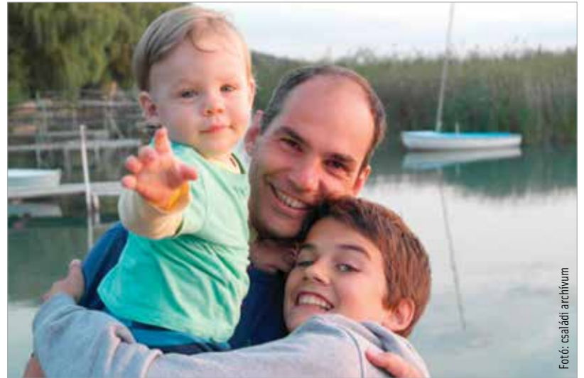
„Érdekes módon a mi családjunkban általában csak fiúk születnek, a feleségeket úgy hozzuk”

A jelenlegi feladatát ön választotta, vagy önt választották ki?