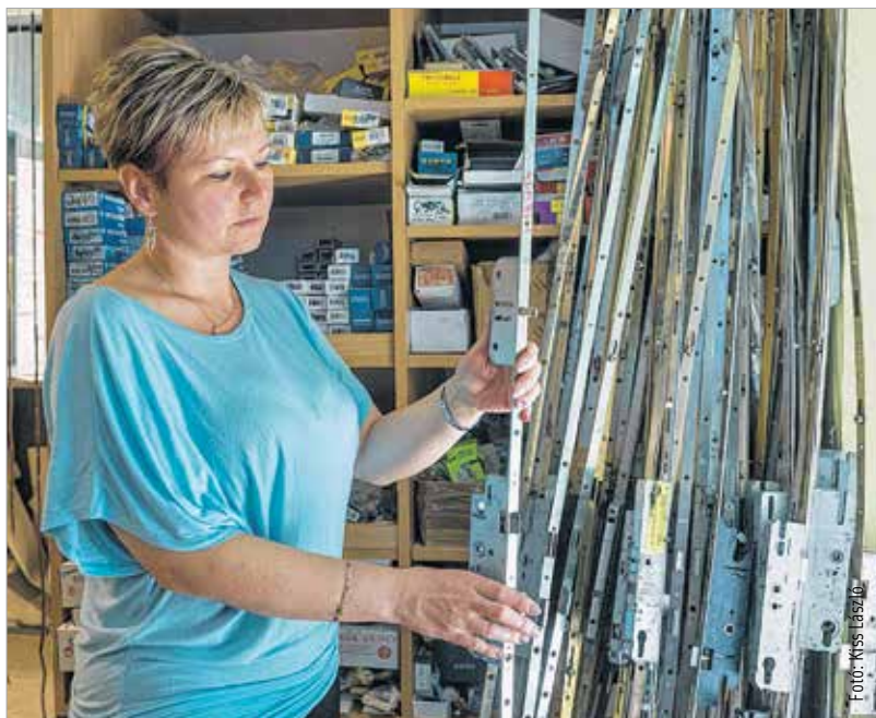
Hosszú távon megéri minőségi zárszerkezetet szerelni a bejárati ajtóba