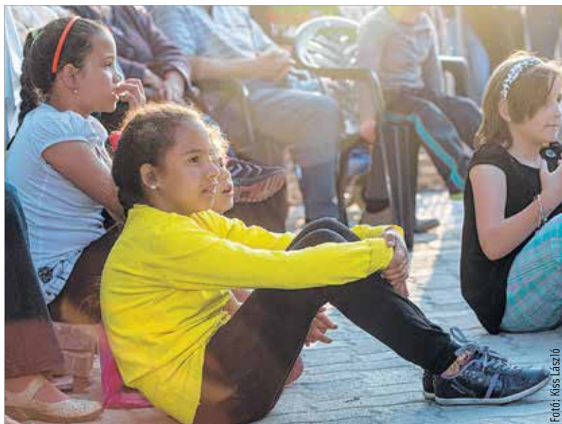
Üres szék nem volt, aki akart, az aszfaltra is ülhetett a szárazréti majálison

címmel. Délután a Székesfehérvári Ifjúsági Fúvószenekar lépett fel, majd a Kákics együttes adott gyerekműsort. Az este a retró jegyében telt, hiszen színpadra lépett a Dolly Roll, hogy ütemet diktáljon a mulatni vágyók lábába. Aki pedig tovább