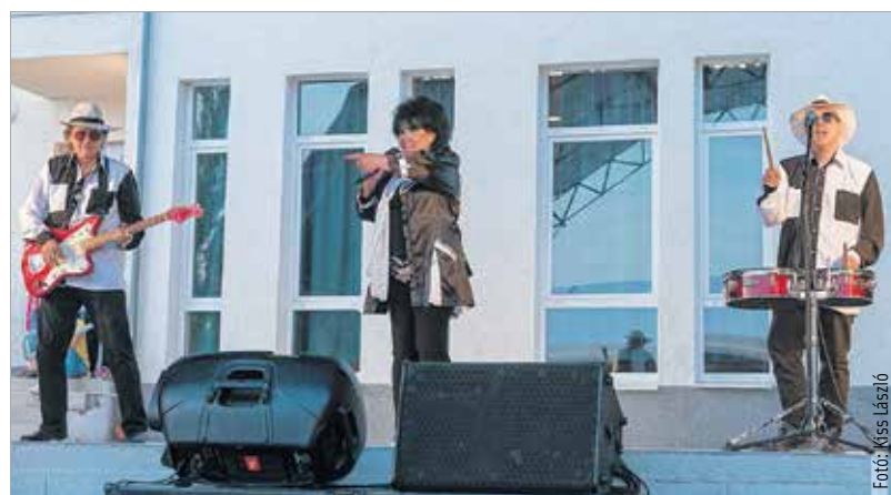
Dolly Roll-koncerttel koronázták a feketehegy-szárazréti majális

repülőalkalmatosságokat, többek között a motoros sárkányrepülőt. Volt hőlégballon-bemutató, és különféle harcászati eszközökkel is megismerkedhettek az érdeklődők.