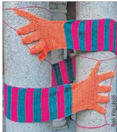
Támad a Fonalkommandó