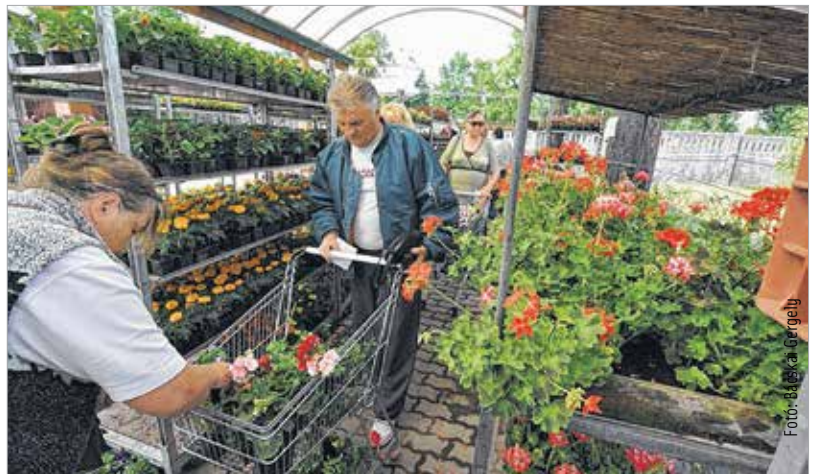
A következő fajtákból választhatnak a vásárlók: begónia, kakastaréj, dália, záporvirág, petúnia, paprikavirág, bűdöske, kerti verbéna, ezüstlevél

A fehérváriak rendkívül kedvező, 65 forintos darabáron juthatnak