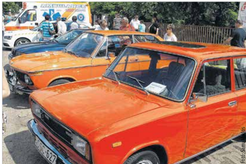
Az autós road show egyik veterán autója: a régi Seat nem véletlenül hasonlít kísértetiesen a Zsigulira