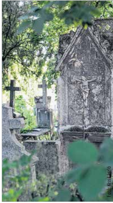
A Mind egy szálig program során megújítják a katonasírokat is