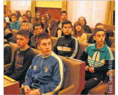
Négy napot töltöttek nálunk a gyulafehérvári Gróf Majláth Gusztáv Károly Teológiai Líceum diákjai és tanárai

A gyulafehérvári Gróf Majláth Gusztáv Károly Teológiai Líceum tizenhét diákja és négy tanára látogatott el a városházra a múlt héten. Az erdélyi intézmény már több mint másfél évtizede ápol testvériskolai kapcsolatot a fehérvári Ciszterci Szent István Gimnáziummal. A Székesfehérvárra látogató vendégek négy napot töltöttek városunkban.