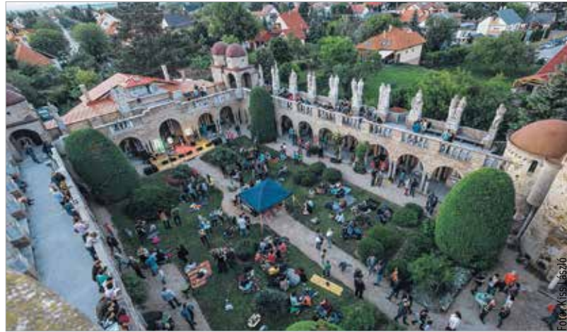
Könnyed hangulatú, felejthetetlen délutánt tölthettek együtt a látogatók idén is a Bory várban, igazi dzsemborihangulatban