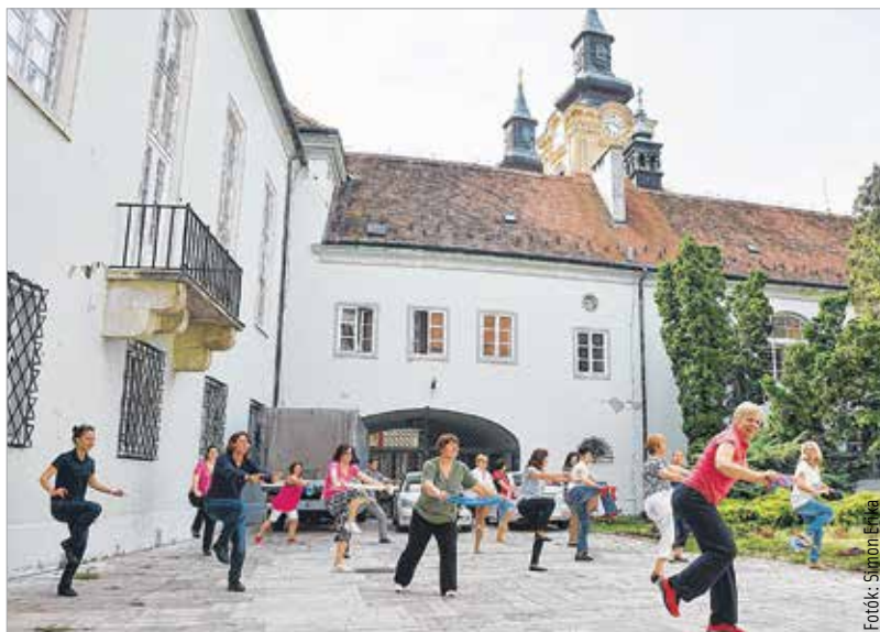
A városháza udvara is tornateremmé vált