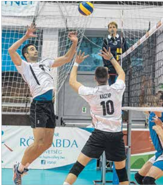
Nemzeti együttesünk erős riválisok ellen léphetett pályára

Kiváló mérkőzéseket hozott a Videoton Oktatási Központban a II. Alba Regia Röplabdagála, melyen a magyar felnőtt férfi válogatott a harmadik helyen végzett. Nemzeti együttesünk Azerbajdzsán ellen nyerni tudott a Videoton Oktatási Központban, Szlovákiától és Horvátországtól azonban vereséget szenvedett.