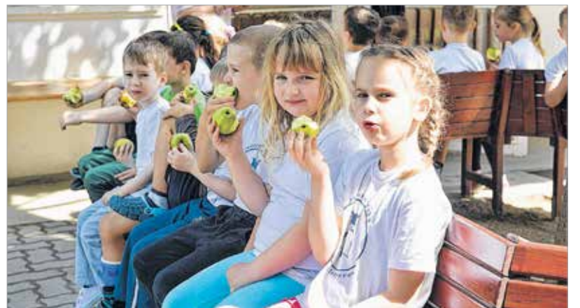
A mozgás után alma dukál – egészség már az óvodában is

városlakók kiemelkedő aktivitására idén is számítottak a szervezők. A Bregyó közti Sportcentrumban, a bölcsődékben, az óvodákban, az általános és középiskolákban, a laktanyában, a polgármesteri hivatalban, a kórházban és az uszodában mozgott az egész város. A rendezvény este kilenckor zárult, és hamarosan az is kiderül, vajon idén is Székesfehérvár volt-e a legsportosabb város.