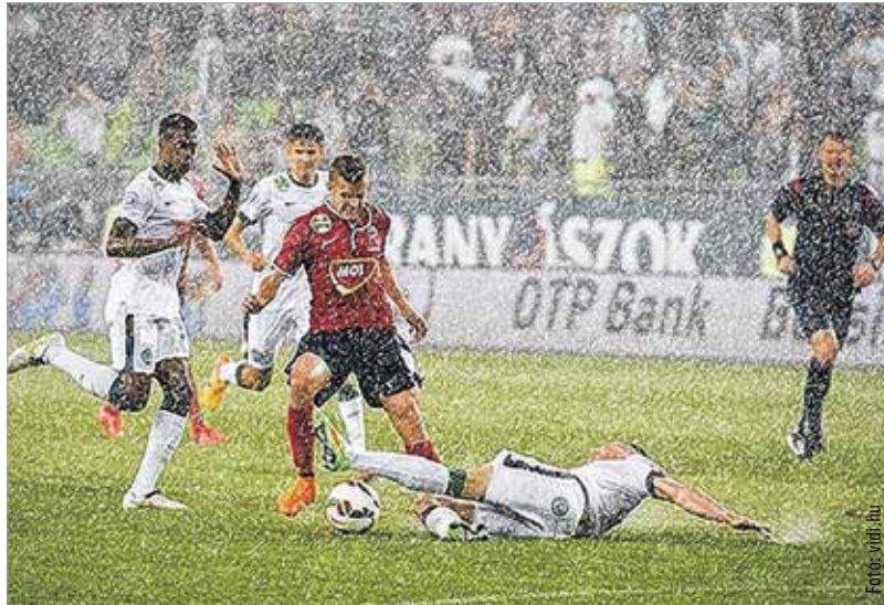
Özönvíz a pályán, hideg zuhany a második félidőben