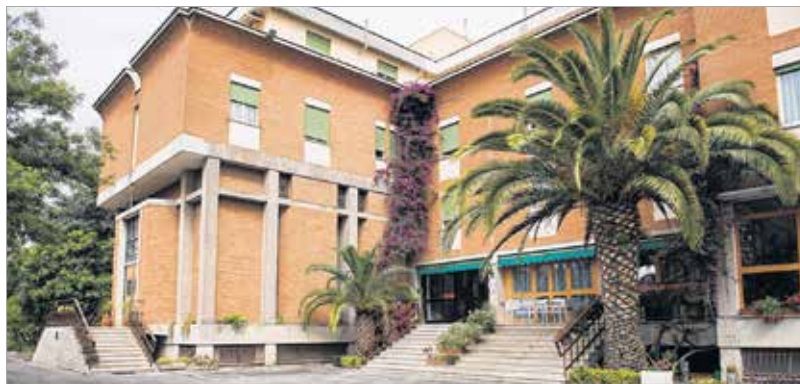
A Szent István Ház várja a Rómába látogató magyarokat