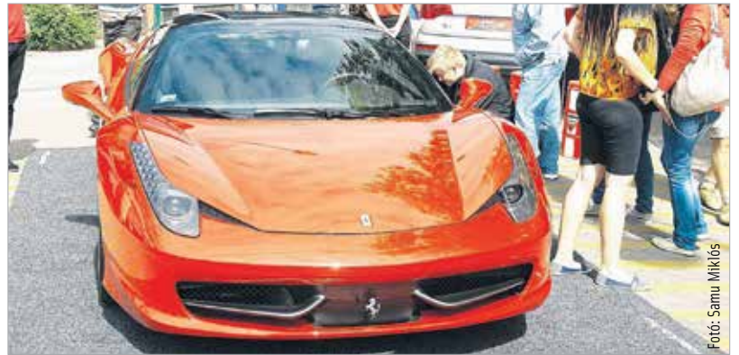
A piros Ferrari mindenki álma

kiállításon minden megtalálható volt, ami az autóval és a motorral kapcsolatos, ezenkívül új és oldtimer autók, motorok, kerékpárok, alkatrészek és kiegészítők széles palettája várta az érdeklődőket. A délután a United együttes koncertjével ért véget.