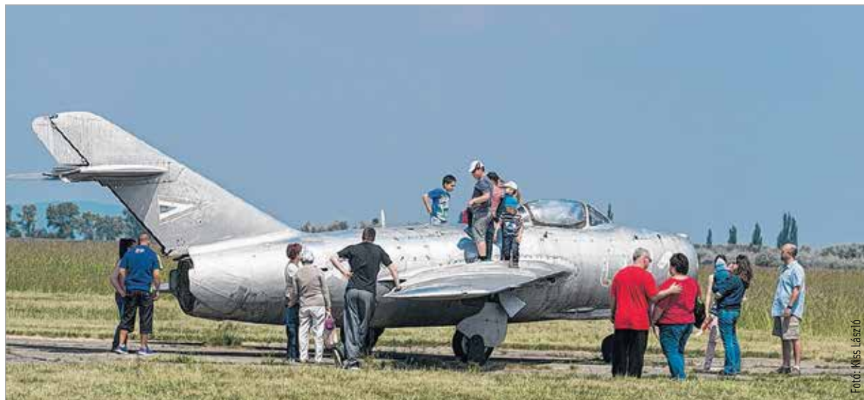
Ha a felszállást nem is, a beszállási engedélyt megadták