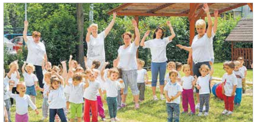
„Szél, szél fújdogálja, eső, eső veregeti...” – játékos zenés torna kicsiknek és nagyoknak