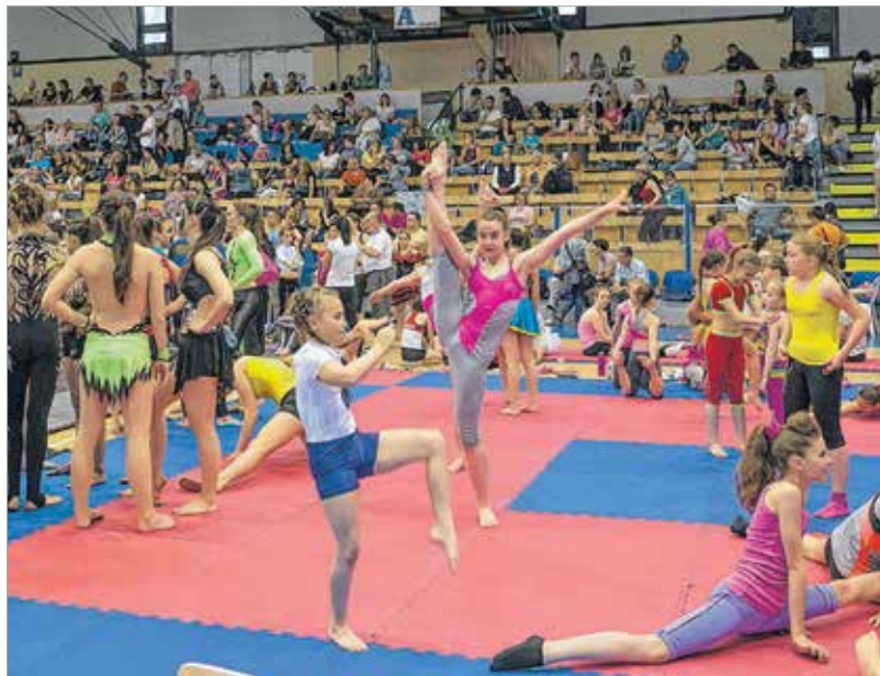
A hétfévi Fit-Kid versenyre közel háromszáz versenyző nevezett