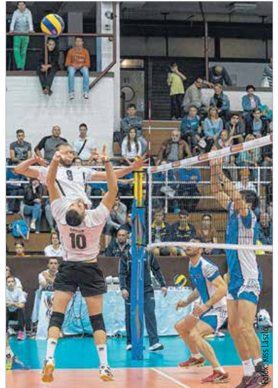
A sportág kiváló hírverője volt a röplabdagála, a nézők izgalmas csatákat, emlékeztető labdameneteket láthattak