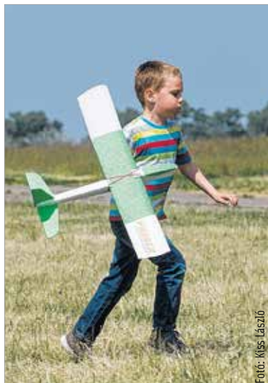
A gyerek, a repülő és a puszta

Hosszú évek után tavaly rendezték meg újra az autókiallást, és a hagyomány idén is folytatódott.