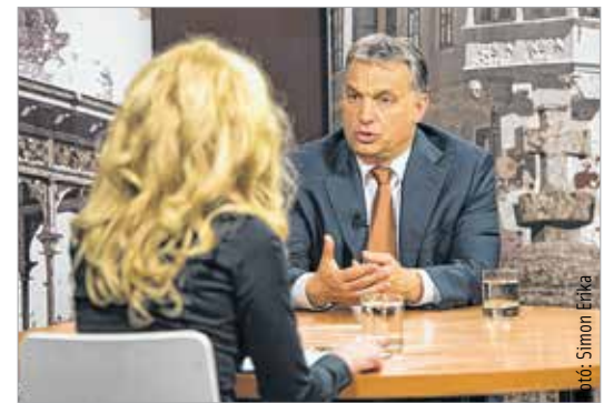
„A vidék fejlődésének a kulcsa a nagyvárosainkban van” – nyilatkozta Orbán Viktor miniszterelnök a Fehérvár Televízióknak

A fűtőerőmű visszavásárlása megtörtént, amihez az állam adta a forrásokat. Megállapodtunk az elkerülő befejezésében, amit hamarosan át fogunk adni. Mintegy 8,4 milliárdos kórházfejlesztésben állapodtunk meg, amit a következő hónapban átadunk. A Gárdonyi Géza Művelődési Ház felújításáról is megállapodtunk, ott kis lemaradásban vagyunk, de reményeim szerint a következő hónapok során ezt ledolgozhatjuk, és akkor a 2013-as megállapodás is teljesül. Általában nem könnyűen írok alá megállapodást. Azt ötször is meg kell gondolni – az ember inkább kétszer mérjen, mielőtt egyszer vágna. De