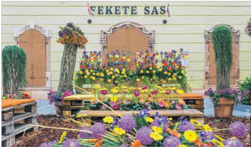
A patikamúzeum előtti tér kompozíciója második helyezést ért el

A helyi virágkötők szinte az egész belvárost virágba borították. Összesen tizenegy kompozíció díszítette a hosszú hétvégén a város főterét és a Fő utcát. Cser-Palkovics András polgármester pénteki megnyitóját után a rangsora a látogatók állították fel: a legtöbb szavazatot az Országalma díszítése kapta. Székesfehérváron a helyi virágkötők összefogásának köszönhetően tizenegyedik alkalommal szervezték meg a programot. A Fehérvári Programszervező Kft. célja az volt, hogy a pünkösdi ünnepét hangsúlyozzák, valamint különféle programokkal készültek, hogy a családok kellemes kikapcsolódást találjanak a hosszú hétvégére.