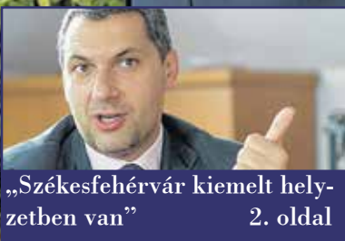
„Székesfehérvár kiemelt helyzetben van” 2. oldal