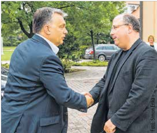
Orbán Viktor miniszterelnök a Fehérvár Médiacentrumot is felkereste