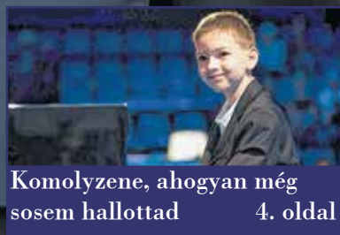
Komolyzene, ahogyan még sosem hallottad 4. oldal