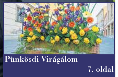
Pünkösdi Virágálom 7. oldal