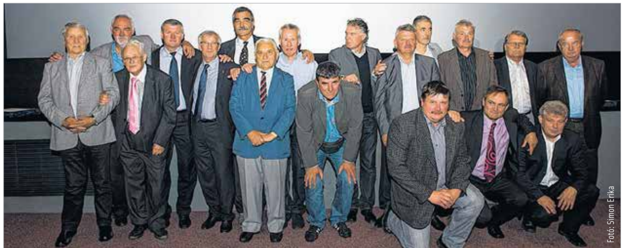
A filmvászon előtt a főszereplők, a harminc évvel ezelőtti menetelés résztvevői