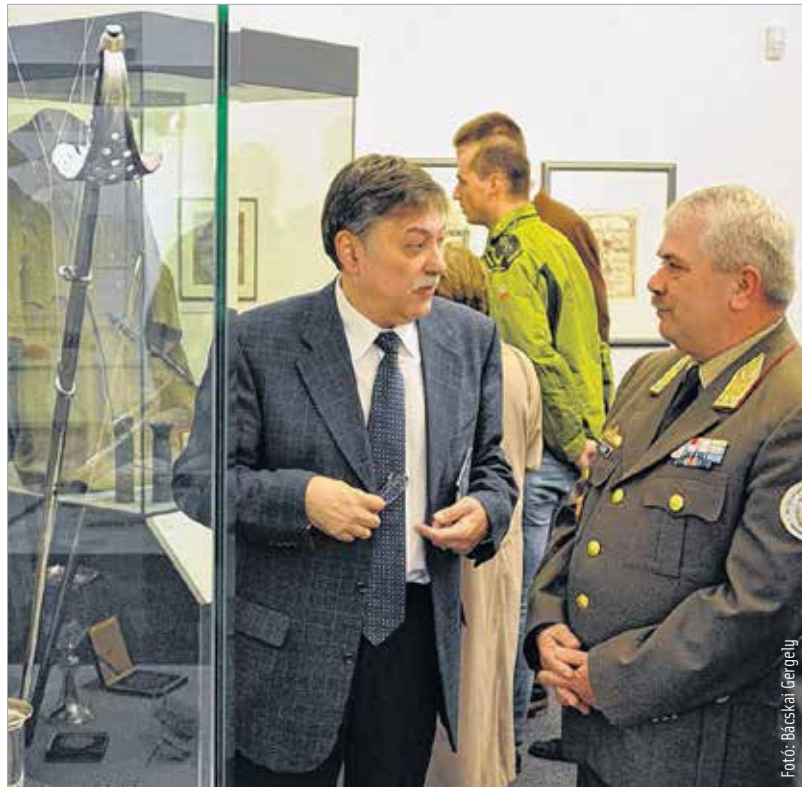
A honvédelem napja alkalmából szervezett programsorozat meghatározó eseménye a „Volt egyszer egy tisztkar” című kiállítás volt, amit a Szent István Király Múzeumban lehet megnézni július 7-ig