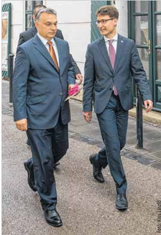
Kis lépés két embernek, nagy lépés Fehérvárnak

A jó ízlés és a törvények is kijelölik, mit tehet egy miniszterelnök a városért. De azon belül mindent meg fogok tenni. A mai megállapodás egyébként egy korrekt megállapodás, ami jár a fehérváriaknak, mert megoldoztak érte. Fehérvár egy olyan város, amely nem hozomra kér, hanem már bizonyított.