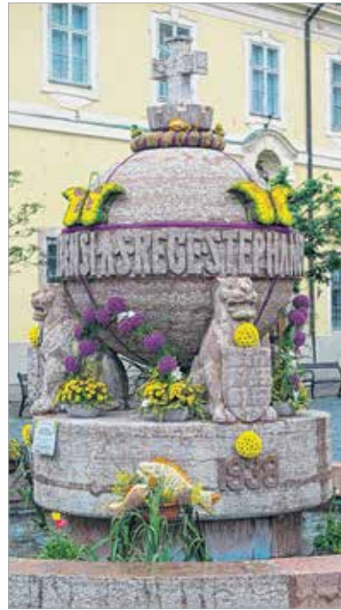
A Budai 66. virágüzlet díszítette Országalma bizonyult a legszebbnek