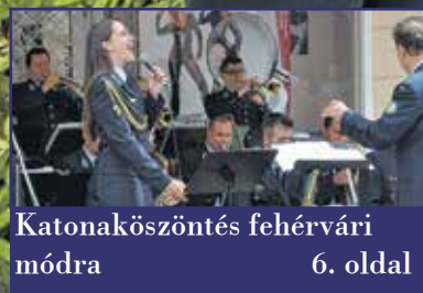
Katonaköszöntés fehérvári módra 6. oldal