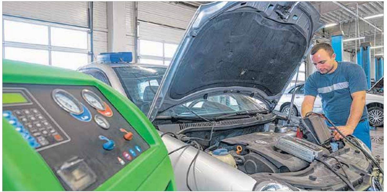
Az ózonos klímatisztítás a legkorszerűbb eljárás

Teljes mértékben megszünteti a kellemetlen szagokat, kiirtja a vírusokat, baktériumokat a rendszerből. Gombaölő hatású, így a megtelepedett gombaspóráktól is megtisztítja a légkondicionálót, így az autóra jutó levegőt. Ez azért is fontos, mert ezek a gombok megfázásszerű megbetegedést is okozhatnak. Emellett az ózonos tisztítással kiirtjuk a klímából az allergén anyagokat is.