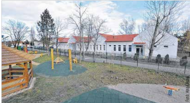
Megújult az óvoda és a játszótér is

A Mura utcában, a lakónegyed és a vasúti sínek közötti területre játszópark épült, hogy a környéken lakó gyerekek és felnőttek hasznosan tölthessék el a szabadidejüket. A parkban a fából készített nagy hajó és a rugós játékok mellett helyet kapott egy labdajátékokra alkalmas dűhögő is. A nappali órákban nyitva tartó, térfelügyelő kamerával is felszerelt térre fákat és bokrokat is telepítettek. Kettős funkciójú parkot alakítottak