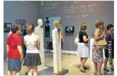
Pilinszky és Fehérvár – „szakrális” tárgyak, fotók, könyvek és képzőművészeti alkotások egy tárlaton