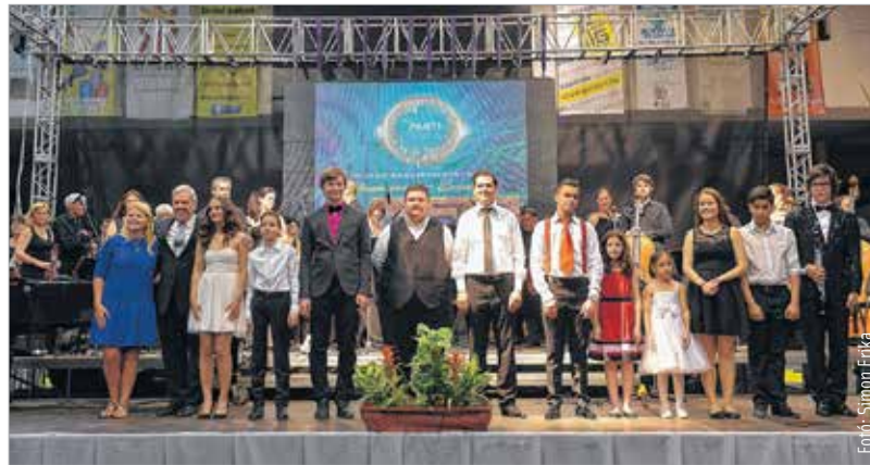
Osztatlan sikert arattak a Fehérváron fellépő Virtuózok

A fiatal tehetségek életkora hat és huszonegy év között van. Különböző hangszereken játszanak, más-más egyéniséggel bírnak, csupán egyvalami közös bennük: zenére és színpadra születtek. A komolyzene bizonyos szempontból olyan, mint a futball: már gyermekkorban komolyan kell venni, hogy felnőttként klasszissá váljon, aki úzi. A ritmus, a dinamika, a játék egy életre szól. Korán felismerhető a tehetség: a mag, ami csak szorgalommal, napi öt-hat órás gyakorlással hozhat gyümölcsöt. Ehhez kell a megfelelő környezet, a támogatás, a lehetőség. Nem csupán a tehetségek kibontakozása miatt, hanem azért is, hogy a kiváló zenei ízekre minél többen ráérezzenek. Hétfő este egy sportcsarnoknyi embernek adatott ez meg. S bár némiképp beárnyékolta az estét a csarnokban megtelepedett füledt