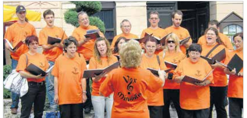
Utcai éneklés Keszthelyen

együnkben, mert erre a bizalomra épül a fejlődésünk és az elért eredmények is, hiszen ne felejtsük el: amatőr kórusról van szó.” A Vox Mirabilisben családok, házaspárok, barátok énekelnek együtt, többen a kórusból együtt sportolnak, és vannak, akik közösen