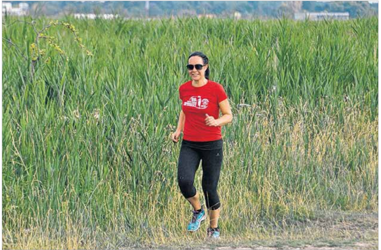
Műtete után néhány héttel a kétgyermekes édesanya élete első maratonját is teljesítette márciusban

Szeretnék futni még egy maratont, de azt már négy óra harminc perces idővel szeretném teljesíteni. Azzal elégedett lennék. Nagyon szeretnék szolgálni az emberek felé. A kórházban is valahogy mindig megtaláltak. Ha valaki nagyon maga alatt