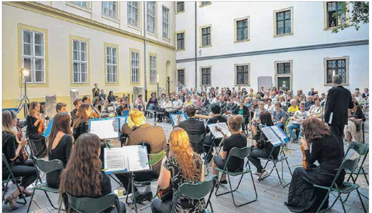
A váruv várt koncert a megújult díszudvarban teljes sikert aratott

A zenekar megfordult Európa számos országában, díjakat nyert, hazai és külföldi fesztiválokon vett részt. 2009-ben fellépett a 200 éves Haydn jubileum alkalmával a kismartoni Esterházy-kastély világhírű Haydn-termében. 2013-ban meghívást kapott Horvátország Európai Unióba történő belépése alkalmából rendezett fesztiválra, Zadarba. Ugyanebben az évben részese lehetett a Magyar–Olasz Kulturális Évad 2013 rendezvény-sorozatnak Rómában, a külügyminisztérium támogatásával, ahol két sikeres koncertet adott, amiről a vatikáni rádió is beszámolt. Hazai szereplései közül meg kell említeni a Budapesti Egyházzenei Fesztivált, melynek több éven át részese volt. Székesfehérváron a város vezetése rendszeresen igényt tart a zenekar koncertjeire, így 2014-ben a Holokauszt Emlékév alkalmából a