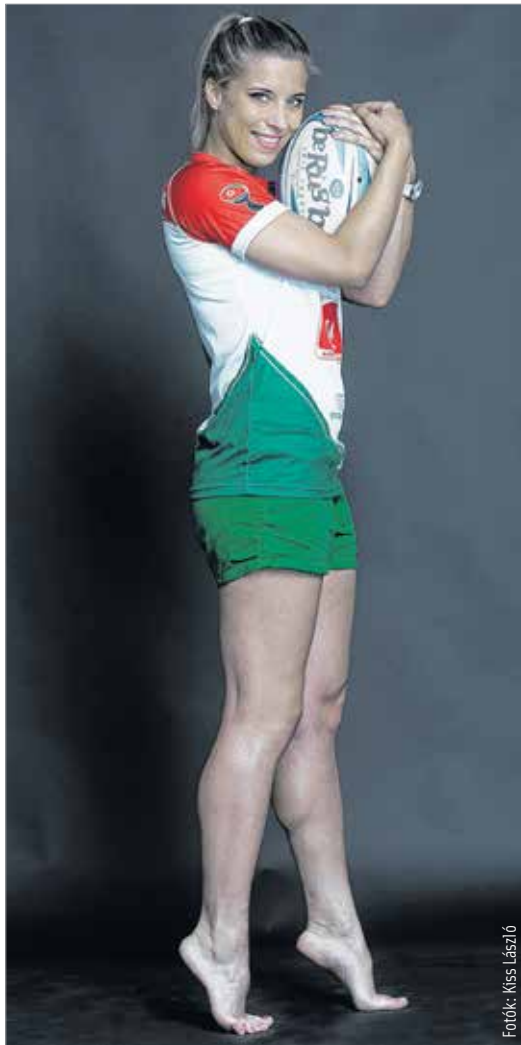
Pap Helga a válogatottban elért sikereire a legbüszkébb

Először nem hiszik el, de egy idő után kénytelenek, főleg amikor elkezdem mesélni a sztorikat. Azért az elején mindig előkerül, hogy egy ilyen törekeny lány hogy rögbizhet? Aztán persze kiderül, hogy én vagyok a pályán az egyik legdurvább játékos, sokszor állítottak már ki ezért. Volt olyan – persze nem szándékosan – amikor az ellenfeletem úgy lefejeltem, hogy szétrepedt az orra... Szóval nem vagyok