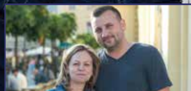
Menni vagy maradni?