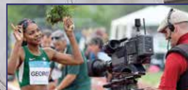
Gyulai Memorial: újra sztárparádé Fehérváron! 29. oldal

Uniós pályázati kommunikáció egy kézben – Fehérvár Média Centrum