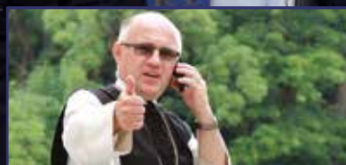
Ismét sört főznek a szerzetesek