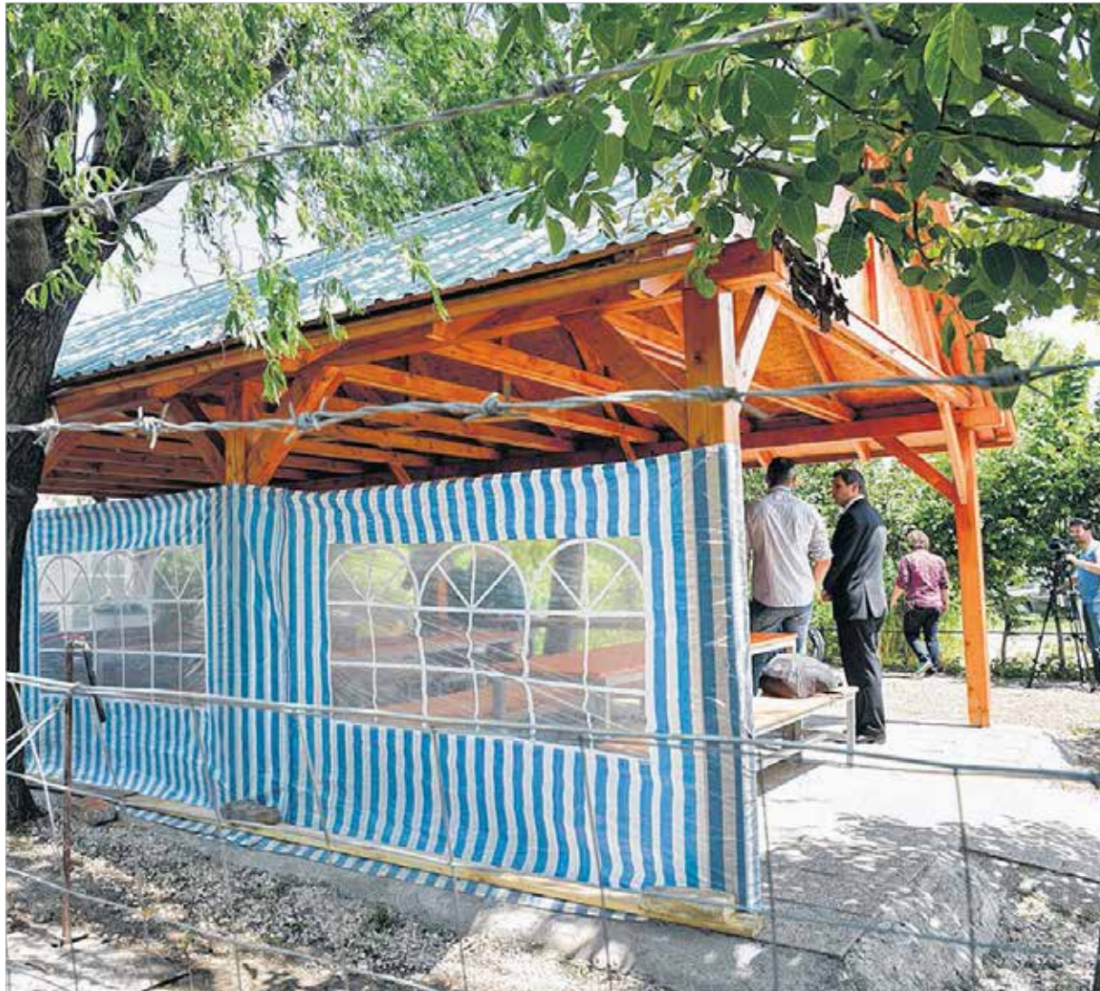
A pavilonban akár rendhagyó biológiaórákat is lehet tartani

mondott a HOFESZ-nek a palotavárosi fejlesztésért, ami a közösséget is építi, és jó programoknak biztosít helyet. A képviselő kiemelte, hogy a tavat rekreációs övezetté jelölték ki a város, az ehhez kapcsolódó fejlesztések sorra valósulnak meg. Viza Attila szerint a közösségi térben eltöltött idő is építi a várost, hiszen alkalmat ad arra, hogy jobban megismerjék egymást az emberek.