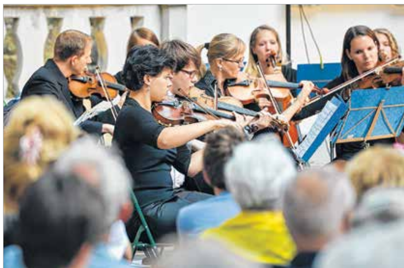
A fiatal tehetségek felkészültek a kihívásokra

a megszokásból, és ezzel egy teljes zenei körutat teszünk Európában.” A siker természetesen jelezte, hogy a kísérlet nem volt hiábavaló, a közönség és a zenekar egymásra találása nem egyszeri, hiszen régóta tudjuk, hogy Székesfehérvár a komolyzene városa is. A komolyzene kedvelői megtapasztalhatták, hogy a Major István által vezetett zenekar szisztematikus munkájának gyümölcse beérett. A tehetséges fiatalok muzsikája már-már a legnagyobb hangversenyzenekarokéval vetekszik. Ezt rövidesen a zene egyik ósházájában, Olaszországban, Milánóban is bizonyíthatják, őszi fellépésükkor.