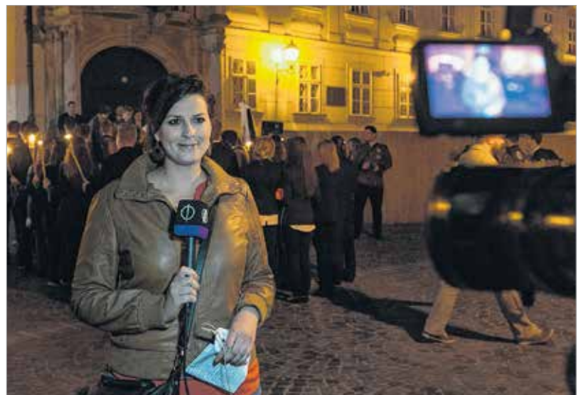
A Fehérvár TV révén a város és a megye hírei naponta eljutnak az országos csatornák hírműsorába is

kíván, mely több önálló szakterület bevonását is szükségessé teszi. A nagyvállalatok piaci versenylőnyét a mikro-, kis- és középvállalatok kreativitásuknak, rugalmasságuknak, helyzetfelismerés utáni gyors megújulásuknak is köszönhetik. Így valószínűleg nyertes pályázóként az sem kerüli el figyelmüket, hogy a pályázati forrásból finanszírozott kötelező kommunikáció miként fordítható minél nagyobb hatékonysággal a vállalkozás előnyére. Sok kis és középvállalkozó nem tud arról, hogy milyen nagy lehetőség rejlik a