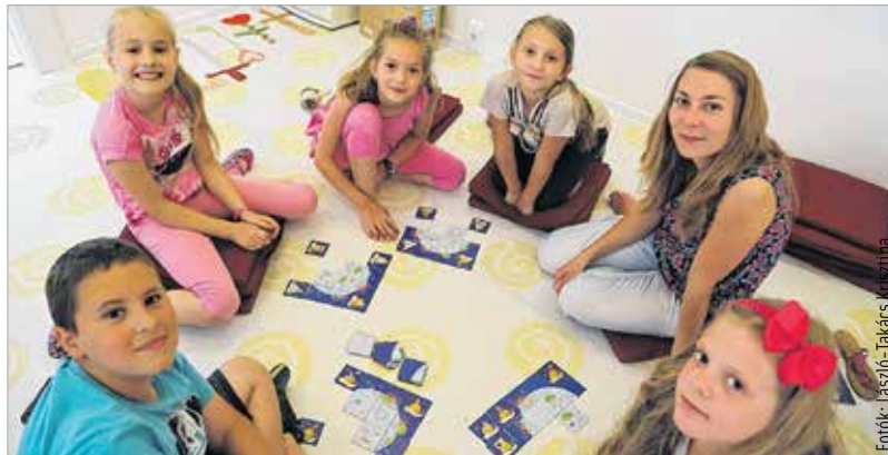
Dolgoznak a csapatok: vajon kinek sikerül legjobban megoldani a feladatot?