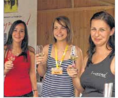
Három a kislány. A szerémségi Ipolynyék ifjú hölgyei is borbarátok.