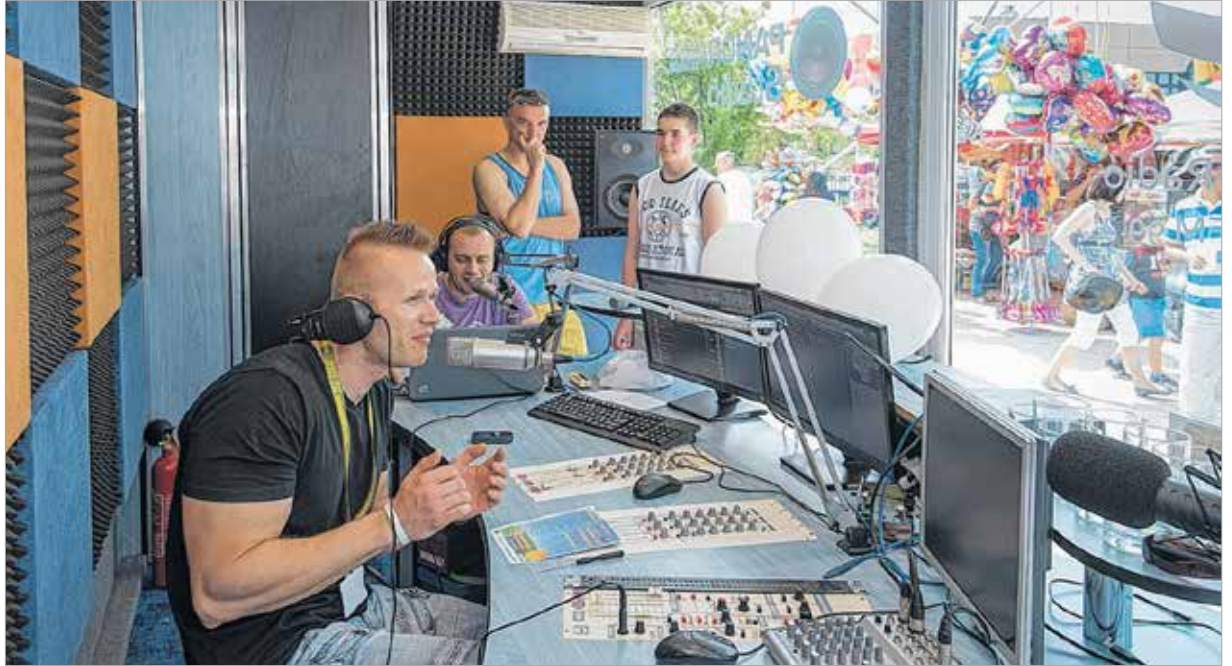
A Fehérvár Médiacentrum hírei Székesfehérváron és a környező településeken négyféle csatornán jutnak el a lakossághoz: a Fehérvár Televízió és a Vörösmarty Rádió adásaiban, a Fehérvár magazin hasábjain és saját internetes felületein keresztül

Az elmúlt héten a Fehérvár Médiacentrum vezetősége fogadta a KKVHÁZ vezérigazgatóját és pályázatrókról egy csoportját. A személyes hangulatú bemutatkozó beszélgetésen tapasztalatcserére is sor került, majd a vendégek megismerkedtek a Fehérvár Televízió és a Vörösmarty Rádió stúdiójával, és meglátogatták a szerkesztőséget is, amelyben a Fehérvár hetilap és az online felületek szerkesztésének feladatait is ellátják a Médiacentrum munkatársai. A találkozó apropóját az adta, hogy az elkövetkezendő időben a mikro-, kis és középvállalkozások is számíthatnak pályázati segít-