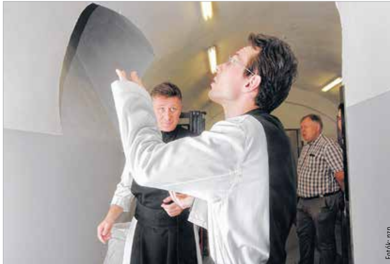
A rendház szerzetesei egyelőre a levegőből próbálják bekapni az illatos és ízletes malátát, az első sör csak három hét múlva érik be

A Fehérvár Televízió stábjába elsőként vehetett részt azon a mustrán, ahol az alapanyagokat, az őrlőket, erjesztőket és érlelőket megnézhettk a sörfőzde elindulásakor. A boltíves pince felújított falai között természetesen már jó pár napja állnak a berendezések, de szerdán jött meg a hatósági engedély az arany színű nedű gyártására. A malátaillat betöltötte a teret, amikor megkérdeztük, mikor csapolják az első korsó sört. „Itt huszonegy napig biztos, hogy nem lesz sör!” – csattant fel az egyik szakember, aki a lelkes amatőrnek sem nevezhető stábot felvilágosította, hogy a ciszterci söroket legalább huszonegy napig, de lesz olyan is, amit nyolcvan napig kell érlelni. Azaz kiderült számunkra, hogy legjobb esetben is csak vizet ihatunk a zirci apátságban... A sörkészítés alapfeltétele a jó minőségű víz, hát megkérdeztük a főapátot, hogy szentelt vízből készül-e a szerzetesek söre. Dékány Árpád Sixtus így felelt: egy szentelt épületben a csapból is szentelt víz folyik, főleg ha az bakonyi karsztvíz! Ezután adta magát a lehetőség, hogy kifaggassuk a főapátot.