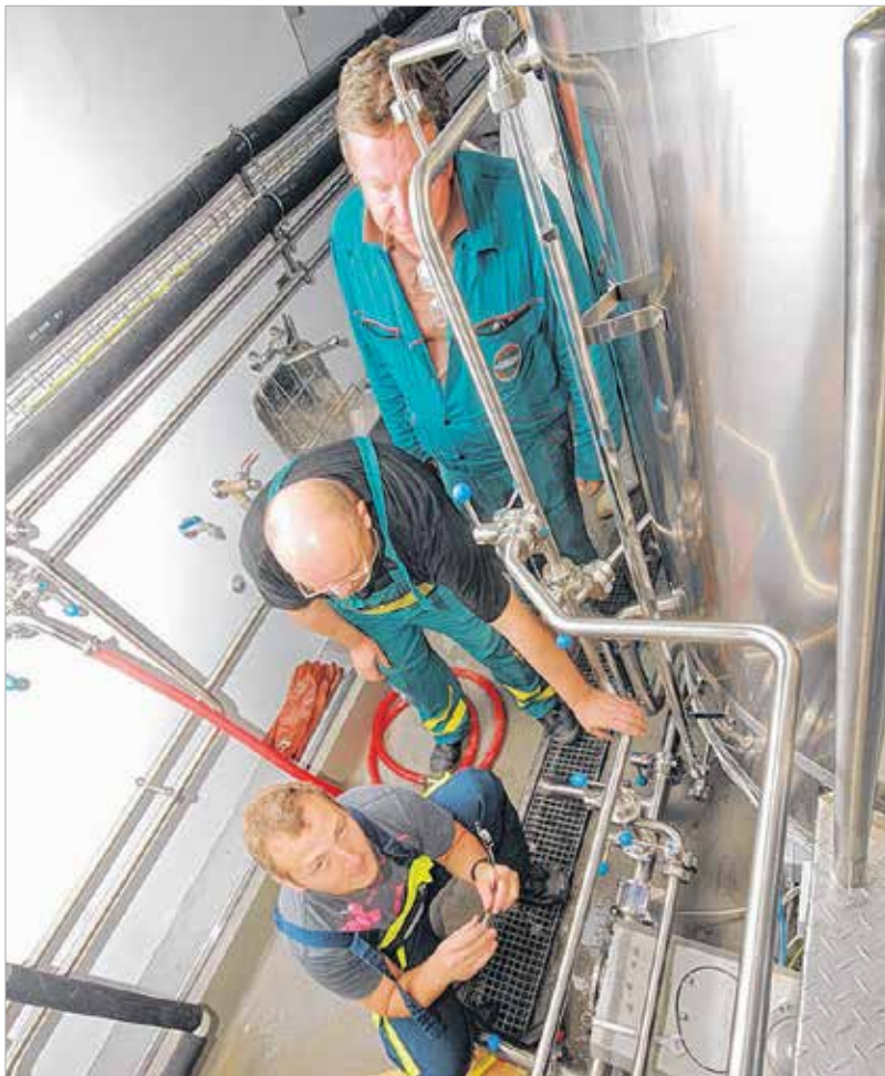
A sörfőző szerelői meg vannak győződve arról, hogy a sörkészítés legfontosabb alkotóeleme a csavar