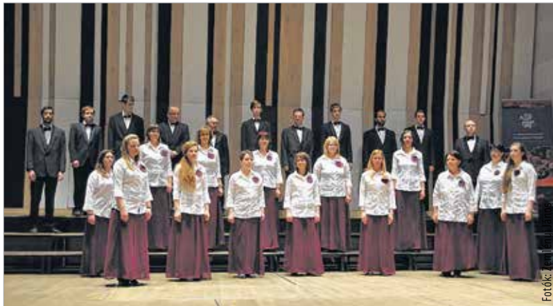
A Vox Mirabilis tagjai hobbiként művelik a kóruséneklést, mégis nagyon komolyan veszik