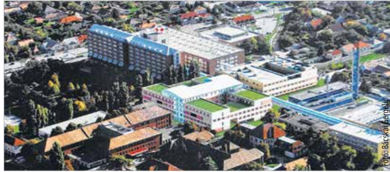
A kórház látványterve

Az új részleg a tervek szerint biztosítja majd, hogy a betegek a kórházba kerüléstől a rehabilitációig komplex ellátásban részesüljenek egyetlen zárt, biztonságos rendszerben. „A fehérvári kórháznak olyan ellátási rendszere van, hogy szinte minden betegség helyben gyógyítható, tehát minden Fejér megyei lakó Fejér megyében meggyógyulhat. Jelenleg is működik az a rendszer, hogy több településen van egynapos sebészet. A Szent György Kórház legkiválóbb orvosai járnak Sárbogárdra, Bicskére, Enyingre és Móra is. Azért lobbizunk, hogy a kórházat erősítsük a város és a vidéki települések érdekében is.” – mondta Törő Gábor országgyűlési képviselő.