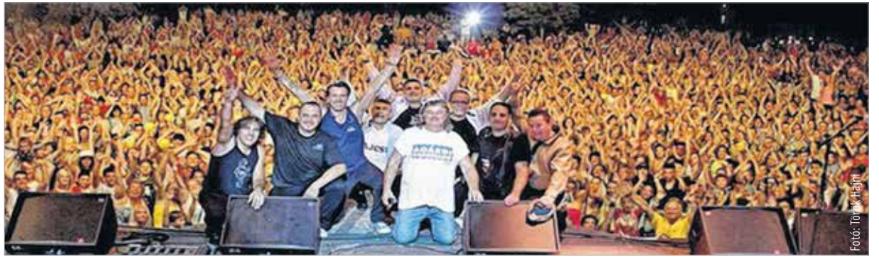
Varázslatos nyári éjszakák várják idén is a magyar könnyűzene rajongóit az Agárdi Popstrandon

bulimra, amelyen egy óriáskivetítőnek köszönhetően több ezer fiatal énekelte együtt a dalokat, miközben táncolt is.” A szív szerelem azonban mindig Agárd maradt. „1977-ben személszállító pótkocsikon indítottam el a Popstrandot és a 90%-ban saját erőből felépített rendezvényközpont több mint három évtizedes sikertörténetét. Azóta megszámlálhatatlan sikert tudhatunk magunkénak, valamennyi ma-