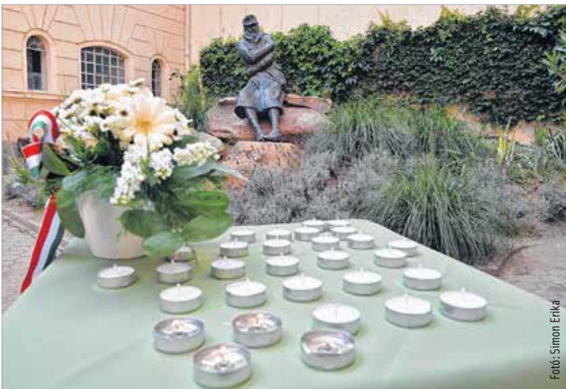
Gyóni Géza krisztusi korban, 33 esztendősen, hősi halottként búcsúzott a földi létől

miként maradhat valaki a háború poklában önmaga. „Méltósággal és felelősséggel kell emlékeznünk, hiszen ő az első nagy világegyesben vesztette életét. A mai világot látva – amikor az ember békéért kiabál, és békét szeretne, miközben hihetetlenül könnyen teremt békétlenséget – láthatjuk, hogy mindenhol, így nálunk, Magyarországon és határainkon túl is háború dúl, fegyverekkel és fegyverek nélkül. Nagyon nagy a felelősségünk, az emlékezésben is nagy, mert őriznünk kell azokat az értékeket és az egymás mellett élés értékrendjét, amelyek mentén tudunk békében, egymásra odafigyelve élni.”