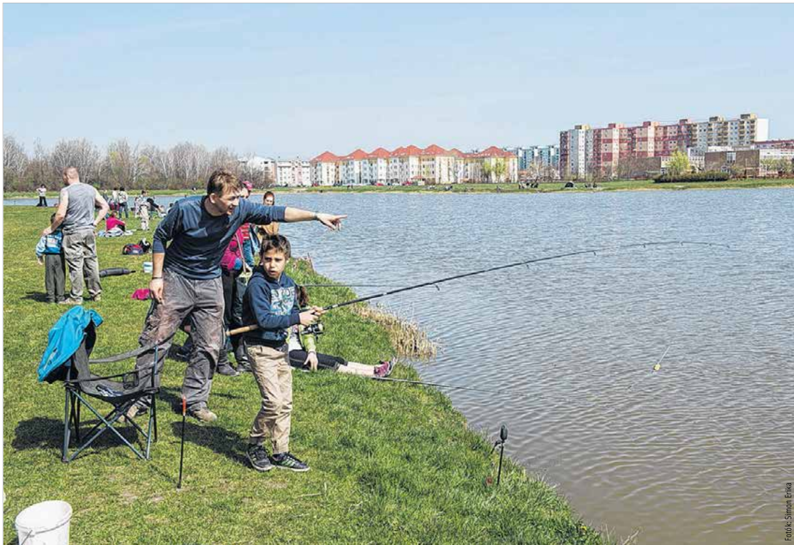
A horgásztáborban a gyerekek megismerkednek a pecázás rejtelmeivel