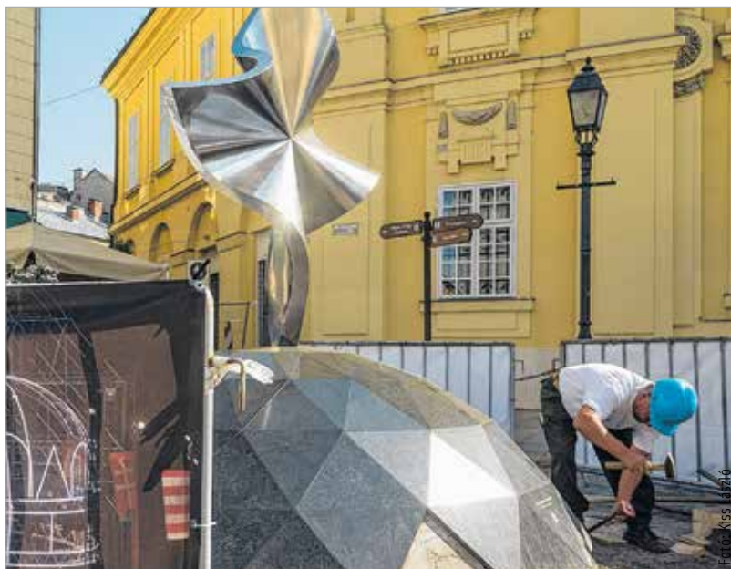
A Civil Központ előtt lesz a Millenniumi emlékjel új helye, hamarosan új köztéri alkotás díszíti a belvárost

marad üresen: a Városház tér Fő utca felőli sarkára a város történelmi szerepéhez illő meglepetés-alkotás készül a fehérváriaknak. Még tavaly döntött arról a közgyűlés, hogy áthelyezik a Millenniumi emlékjelet. A Városgondnokság közreműködésével csütörtökön szállítják át új helyére, a Fehérvári Civil Központ előtti térre Józsa Bálint alkotását. A mű eddigi helye sem marad üresen, az új köztéri alkotást a Székesfehérvári Királyi Napok keretében avatják majd fel.