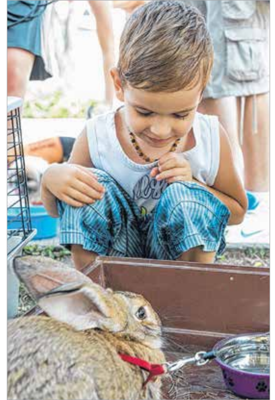
A gyerekeket elvarázsolta a két óriási fül