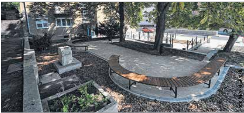
Nem csak a forrás ad újra vizet, a tér is megszépülve várja a pihenni vágyókat