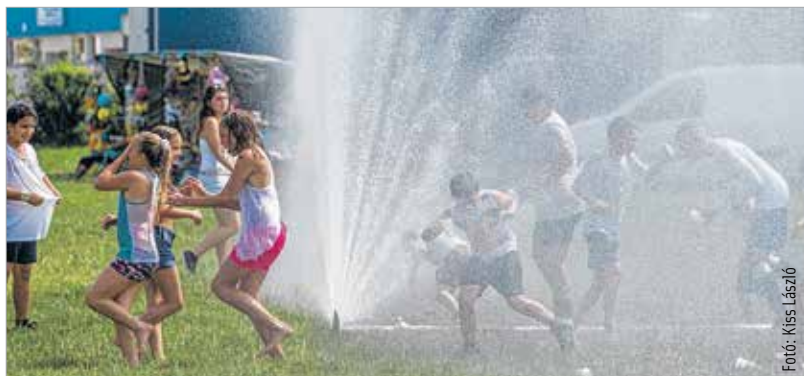
A rugby-pályán a tűzoltók biztosították a strandélményt

Ezt a törekvést szolgálta a Köfém Lakótelepi Családi Nap, amelyet tavaly azzal a céllal indított el az egyesület, hogy a rászoruló családok ingyenesen vehessenek részt színvonalas családi programokban. Az idei eseménynek a Köfém rugby-pálya adott otthont, az egész napos ingyenes rendezvény főként a gyermekeknek szólt: a legkisebbek az ugrálóvárban és a trambulínban szórakozhattak, a nagyobbak különböző játékos versenyeken mérték össze tudásukat. Emellett megismerkedhettek a rendezvény szervezőivel, betekintést nyerhettek a judo rejtelmeibe, és akinek alkotni volt kedve, kézműves foglalkozásokon tehette ezt meg. Focibajnokságot is rendeztek, sőt, akik közben megéheztek, azoknak töltött káposztával és pörkölttel is készültek a szervezők.