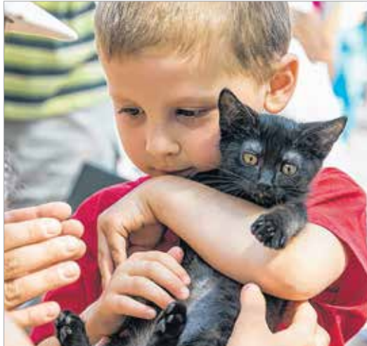
A fekete bársonytalpú senkinek sem akar balszerencsét okozni