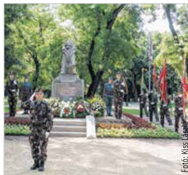
A 17-es honvédekről minden évben megemlékeznek a Zichy-ligetben

A 17-es gyalogezred megjárta a Kárpátokat, harcolt a betörő orosz csapatok ellen, majd 1915-től az olasz fronton, főként Doberdón és környékén vívott állóháborúban töltött be meghatározó szerepet. A katonák a zord körülmények és a tetemes emberi veszteségek ellenére is hőiesen helytálltak, és méltán váltak Székesfehérvár emblematisz katonai-történelmi példaképeivé. Székesfehérváron minden évben megemlékeznek a Zichy-ligeti emlékműnél a gyalogezred emléknapján, hogy a csatatereken maradt hősök helytállása, küzdelme ne merüljön feledésbe. A helyszín azért is szimbolikus jelentőségű, mert a közvetlen szomszédságában van az ezred korabeli laktanyája. A történelmi zászlók bevonulása, majd a Himnusz elhangzása után Huszár János vezérőrnagy, a Magyar Honvédség Összhaderőnemi Parancsnokság törzsfőnöke mondott beszédet, melyben hangsúlyozta: mindenkinek kötelessége emlékezni azokra, akik életüket adták a hazáért. „Emlékezni és emlékeztetni nekünk, utódoknak kell! Az utókornak kötelessége honvédő hagyományaink, értékeink őrzése és továbbfejlesztése!”