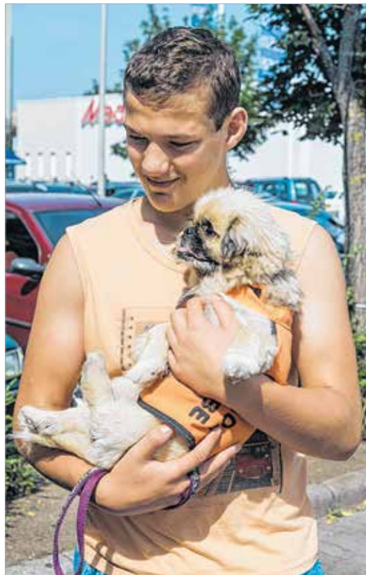
A négylábúak örömmel fogadták a törődést