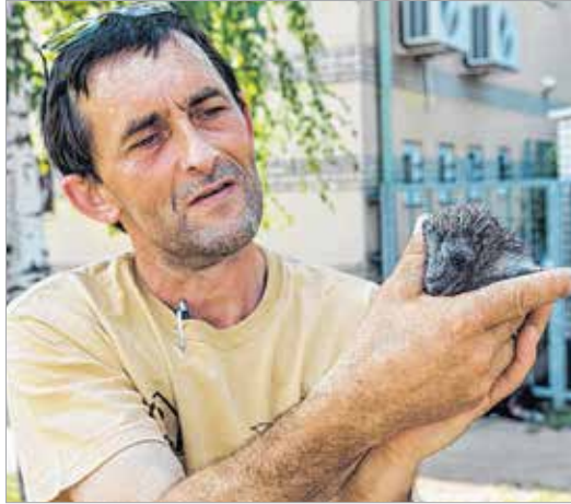
Ez a süni sérülten került egy családhoz, de mára már teljesen felépült. Olyan szelíd, hogy meg is lehet simogatni.