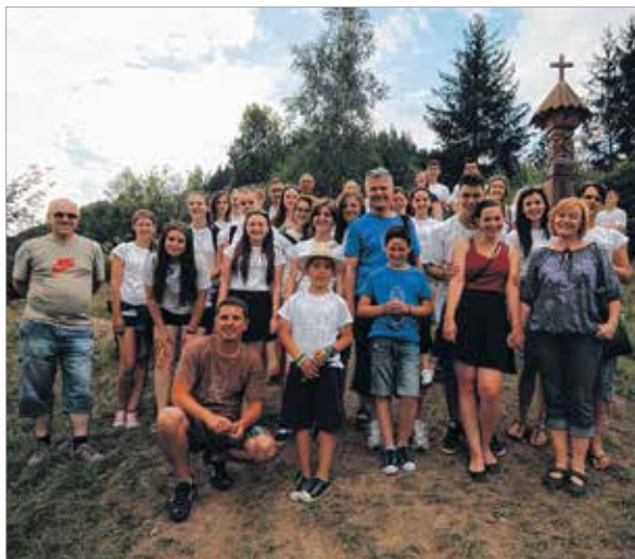
Az V. Székelyföldi Verstábor csapata az ezeréves határnál, a Gyimesben