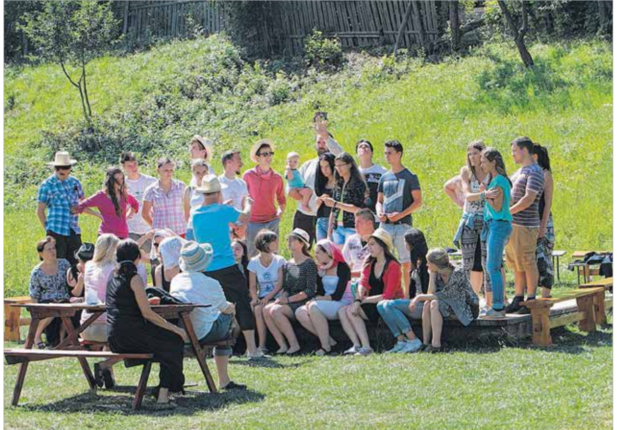
Az utolsó próba a táborzáró gála előtt