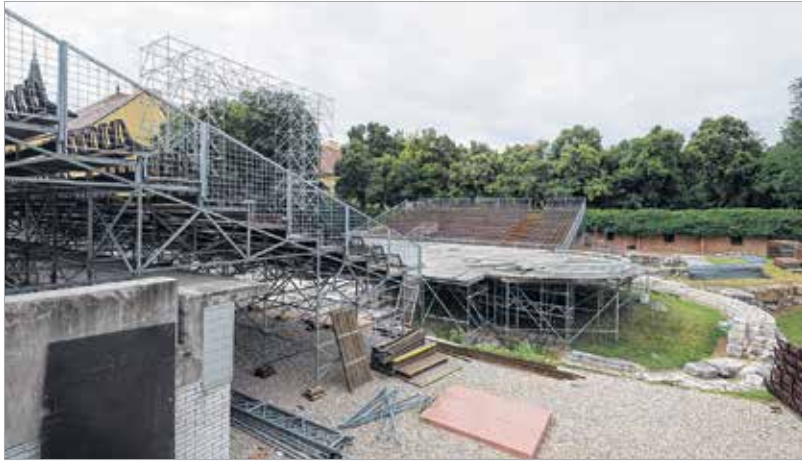
A nézőtéren kétezer-ötszázán férnek majd el

már méreteivel is jelzi, milyen grandiózus előadások színhelye lesz. Maga a színpad ötszáz négyzetméter, a nézőtér pedig kétezer-ötszáz fő befogadására lesz alkalmas. A két kisebb lelátónál idén lesz két arénabejárat is, a színészek ezek felől is be tudnak majd menni a színpadra. A színpad melletti toronyok is igazán látványosak, hiszen húsz méternél is magasabbak. Idén Könyves Kálmán legendája kel életre a Koronázási Ünnepi Játékokon augusztus 15-én és 16-án.