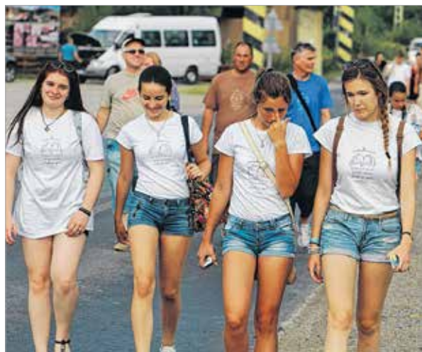
Ha nem táncoltak, nem nyelvtörőztek, nem énekeltek, nem verseltek, akkor kirándultak a fiatalok