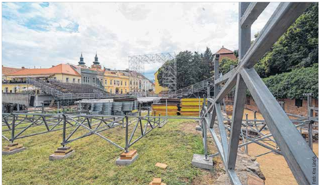
Épül a Koronázási szertartásjáték színpada a Nemzeti Emlékhelyen. A katasztrófavédelem csak úgy ad engedélyt a használatára, ha a lelátót mindenki perceként belül el tudja hagyni. A menekülési útvonalak meglétét minden esztendőben ellenőrzik a szakemberek.

A Fezen mellett az augusztusi ünnepi programok is munkát adnak a kéklámpásoknak. A feladatuk ugyanaz lesz, mint a fesztivál esetében: a tűzvédelmi előírások