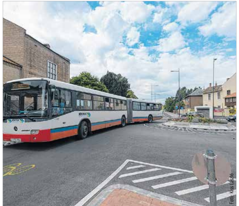
Hasznosak a körforgalmak