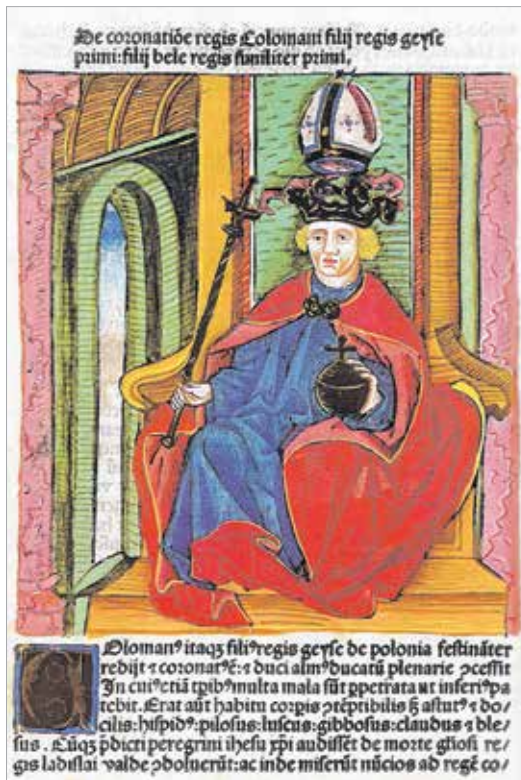
Thuróczy János krónikájában így ábrázolják Könyves Kálmánt