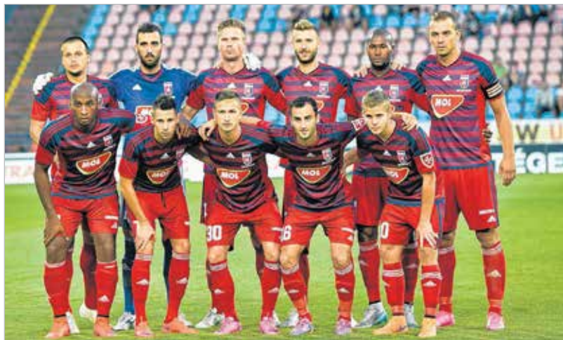
Nemzetközi brigád: macedón, szerb, holland, horvát, brazil, francia, portugál légiós a Vidi kezdőjében

a jobb eredmény, hogy nincs vérbeli góllövő a csapatban... Igaz, egy kapufánál szerencséje volt a Vidinek, de összességében semmivel nem tűnt gyengébbnek a Bajnokok Ligája csoportkörében is járt ellenfél. Sőt szöglettel, lövésekkel teljesen be is szorította, és Vinícius remek fejesével kiegyenlített. Meccshangulat uralkodott a Sóstói Stadionban, s bár a döntetlennel inkább a BATE ke-