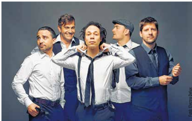
A dzsessz nagygágyúja, az Electro Deluxe lép színpadra Fehérváron