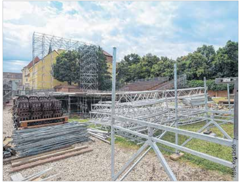
A színpad ötszáz négyzetméteres, az oszlopok pedig több mint húsz méter magasak