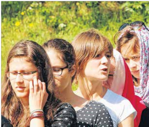
A közösen elmondott beszédgyakorlatok csapatot formáltak a közösségből