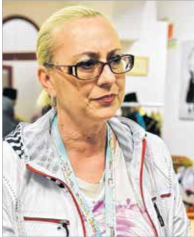
Alla Volosina célja az orosz táncok megismertetése

Az Oroszországi Lipeck régióból érkezett Razdolie Táncegyüttes neve szabadságot jelent. A csoportot 1967-ben alapította a tartomány híres táncművésze, Valerij Seljakin. Műsorukban az orosz néptánc