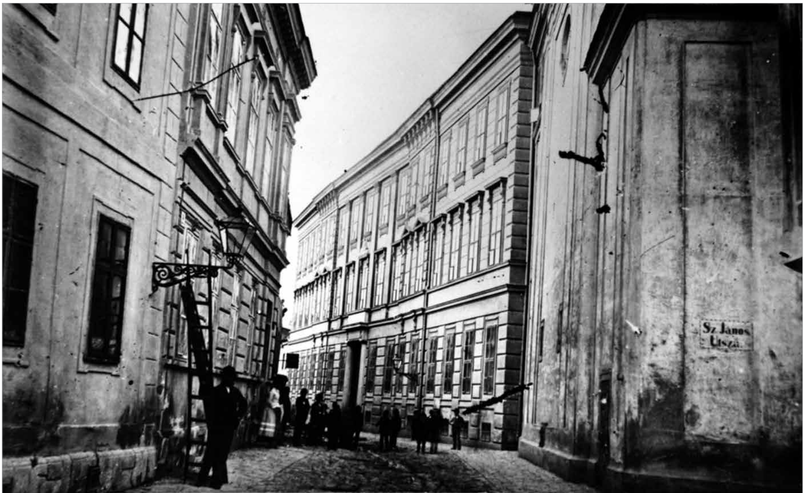
A Ciszterci Gimnázium épülete az Oskola utcában. 1879

már magyar nyelvű színdarabokat adtak elő. 1767-ből magyar nyelvű betlehemes játékok szövegét ismerjük, amelynek címe: „Három Szent Királyok utazása, az az némely rendes magyar Versek, mellyekben leírattatik az három sz. királyoknak Csillag vezérése által Betlehembe az újonnan született Királynak, Jezusnak felköszöntésére és imádására való utazások, mellyet legelsőben Székes fejei vári Magyar népnék kívánságára, az után Nagy Győr Városának nagyobb vigasságára illendő pompával szolgálai kötelességektül repraesentáltak némely érdemes ifjak Deákok Ao. 1767 és 1768-dik esztendőben.” A pálosok a XVIII. század végén már a magyar nyelvet is tanították. A ciszterciek 1813 után az alsóbb osztályokban már magyarul oktattak. Budai, pécsi, zágrábi német színtársulatok először a XVIII. század utolsó évtizedében szerepeltek Székesfehérváron. Az első magyar színtársulat 1813-ban lépett fel a belvárosi Pelikán fogadó színháztermében. Ez adott helyet 1818-24 között a pesti színházépület lebontása miatt otthontalanná vált magyar színtársulatnak, amelyet Fejér megye nemessége támogatott. A színtársulat fenntartására indított közadakozáshoz csak három székesfehérvári polgár járult hozzá. A magyar nyelvű színjátszásnak, az itt bemutatott színvonalas daraboknak is szerepe lehetett a város magyarrá válásában.