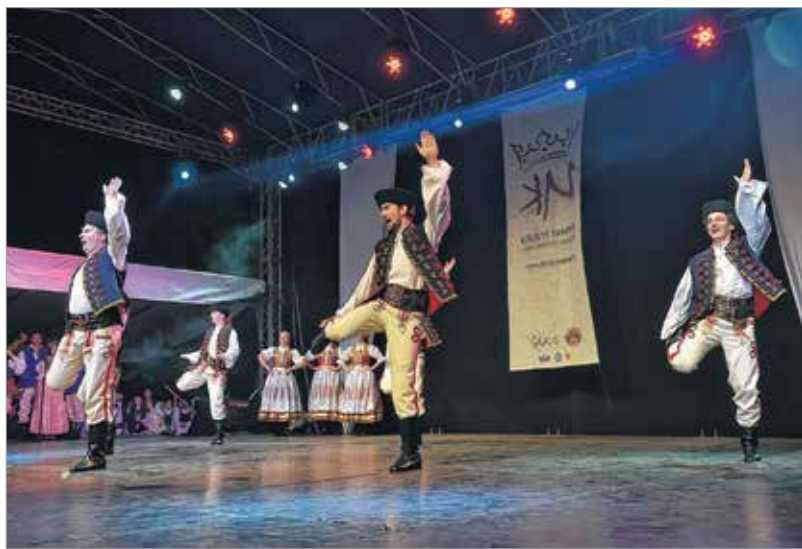
Gyönyörűséges, színes az élet a lengyel ünnepeken

kon. Ezért mindent megteszünk, hogy évről évre részt vegyünk olyan európai fesztiválokon, ahol bemutathatjuk a tanultakat. Értéktörző szerepünket nem adjuk fel. Az elmúlt időszakban színpadra léptünk Kazahsztánban és Írországban. Közép- és Nyugat-Európában már ismertek vagyunk, hiszen számtalan fesztiválra kaptunk meghívást. Nagy öröm számunkra, hogy idén eljöhettünk Székesfehérvárra. A város nagyon szép, a fesztiválnak pedig különleges atmoszférája van.”