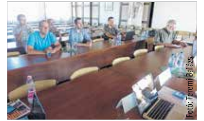
A Közép-Dunántúl régió fejlesztéseit Pápán mutatták be a Magyar Természetjáró Szövetség és konzorciumi partnerei, a Vadex Zrt. és a Verga Zrt. közreműködésével

Hazánk legnépszerűbb és legnagyobb múltú túraútvonala, a 2550 kilométer hosszúságú Országos Kékkör 2,7 milliárd forintos uniós támogatással újul meg szeptember végéig.