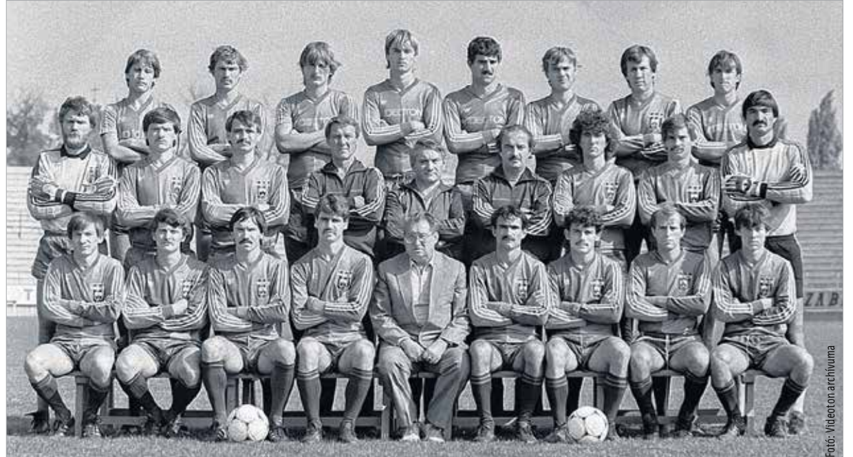
A kép fekete-fehér. A nagyszerű csapatot azonban színes, nagyszerű egyéniségek alkották.

utazások és az edzőtáborok annyira összekovácsoltak bennünket, hogy egyszerűen hiányzott már akkor is, ha egy-egy napot nem voltunk együtt. A miénk több volt, mint egy futballbarátság, ismertük egymás rezdüléseit, közös volt az életünk a pályán és a pályán kívül is. Fiatalként a Rákóczi úti munkásszálláson laktunk, számtalan ma már hihetetlen történetet tudnék mesélni erről, hiszen mint az akkori munkásszállások többsége, a Rákóczi út is olyan volt akkoriban, mint egy laktanya. Szerencsére azért mindig