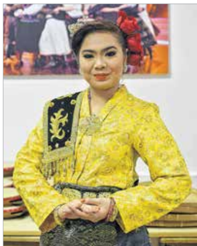
Báj és erő a maláj ünnepen

Alapítása, 2000. óta a PrismaSeni Táncegyüttes a malajziai művészet és kultúra meghatározó szereplőjévé vált. Csoportjuk kiemelt szerepet tölt be a kulturális nevelés területén. Az együttes ötven tagból áll, akik a számukra otthont adó egyetem diákjai. Fő céljuk egy olyan fenntartható művészeti ág