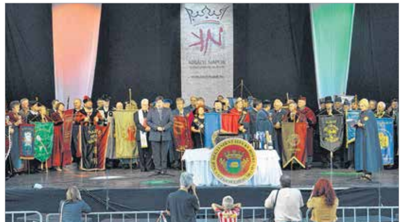
Az ország összes borlovagrendjét meghívták a találkozóra

nek a szőlész- és borásztársadalom képviselőinek: „Nagyon sok olyan szakember van itt, akinek érdemes meghallgatni a véleményét. Mi azzal, hogy évjárat-bemutatót tartunk a Zengő zászlósborunkból, szeretnénk megismerni társaink véleményét, hogy leszűrjük a tapasztalatokat. A visszhang alapján derülhet csak ki, hogy jó úton járunk-e. Természetesen szóba kerül az is, hogy az idej nem túl kedvező időjárás mellett ki miként tudta megőrizni a bor minőségét. Ilyenkor szó esik minden borszakmai kérdésről. Nagyon fontos egy ilyen rendezvény abból a szempontból is, hogy a különböző borregiókból érkezők kicserélhetik gondolataikat. Ez segít abban, hogy az egymás felé nyitott szakemberek közösen oldják meg problémáikat. Csak így lehet jó minőségű bort termelni. Mivel a régiók is különböznek, természetesen a felvetett problémák is mások, de azért vagyunk itt, hogy ezeket megoldjuk. Összességében elmondhatjuk, hogy a magyar szőlész- és borásztársadalom jó úton jár. Ellentétben a nyugat-európai vagy újvilági borokkal, hazánkban még mindig a tradíció az első, ami meghatározza a borkészítést. Mészt már inkább a technológia a meghatározó. Ez az új stílus – ötvözve a hagyományokkal – Magyarországon is sikeres lehet!”