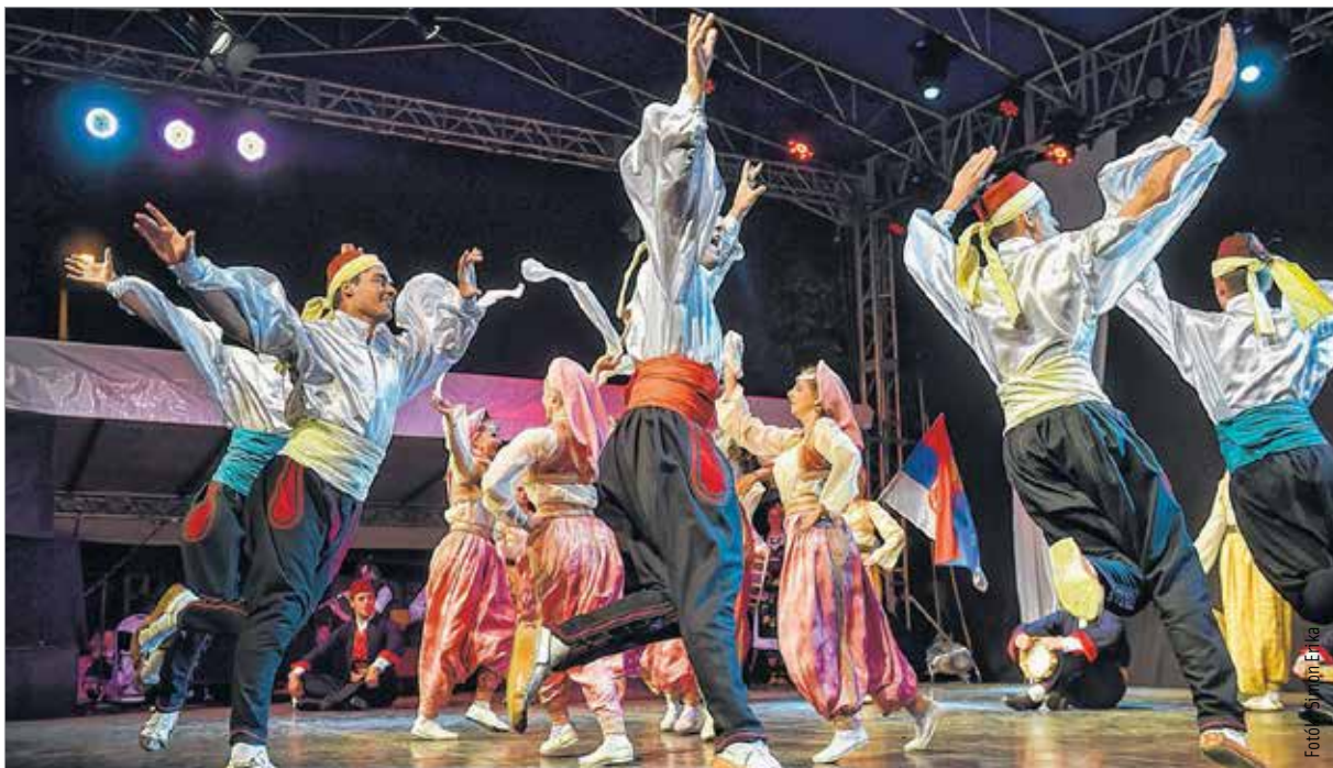
Szerbia egész területére jellemző táncait felvonultatta az együttes

együttes sem ismeretlen számunkra, hiszen tavaly Marseille-ben együtt voltunk. Így ide már nem ismeretlenként érkeztünk. A város nagyon tetszik, a fesztiválozók fanatizmusa lenyűgöző. Nagyon jó érzés olyan programon részt venni, ahol az emberek annyira szeretik a néptáncot és a folklórt. Elképesztő érzés, amikor az embereknek az sem számít, ha esik az eső, ők akkor is jönnek és részt vesznek a programokon. Imádják ezt a fesztivált és fellépőként fantasztikus dolog ezt megtapasztalni. Azt hiszem, a Királyi Napok egy óriási dolog. Bízom benne, hogy továbbra is hosszú évekig éltetik az emberek, a város és természetesen a szervezők ezt a fesztivált!”