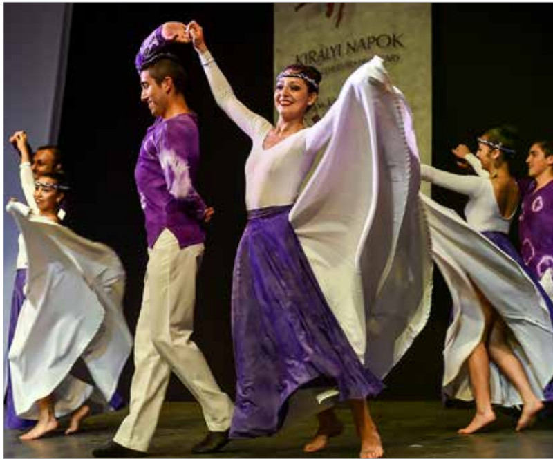
Átlomkép a színpadon