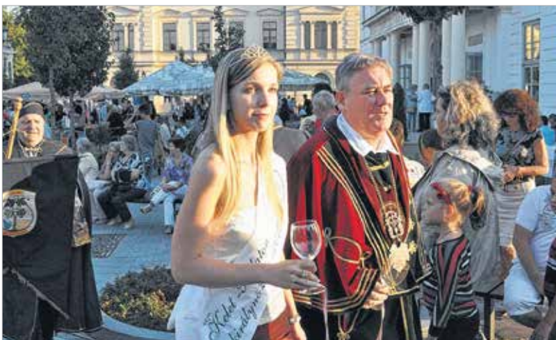
A borlovagok és a borkirálynő vonulása városi látványosság volt