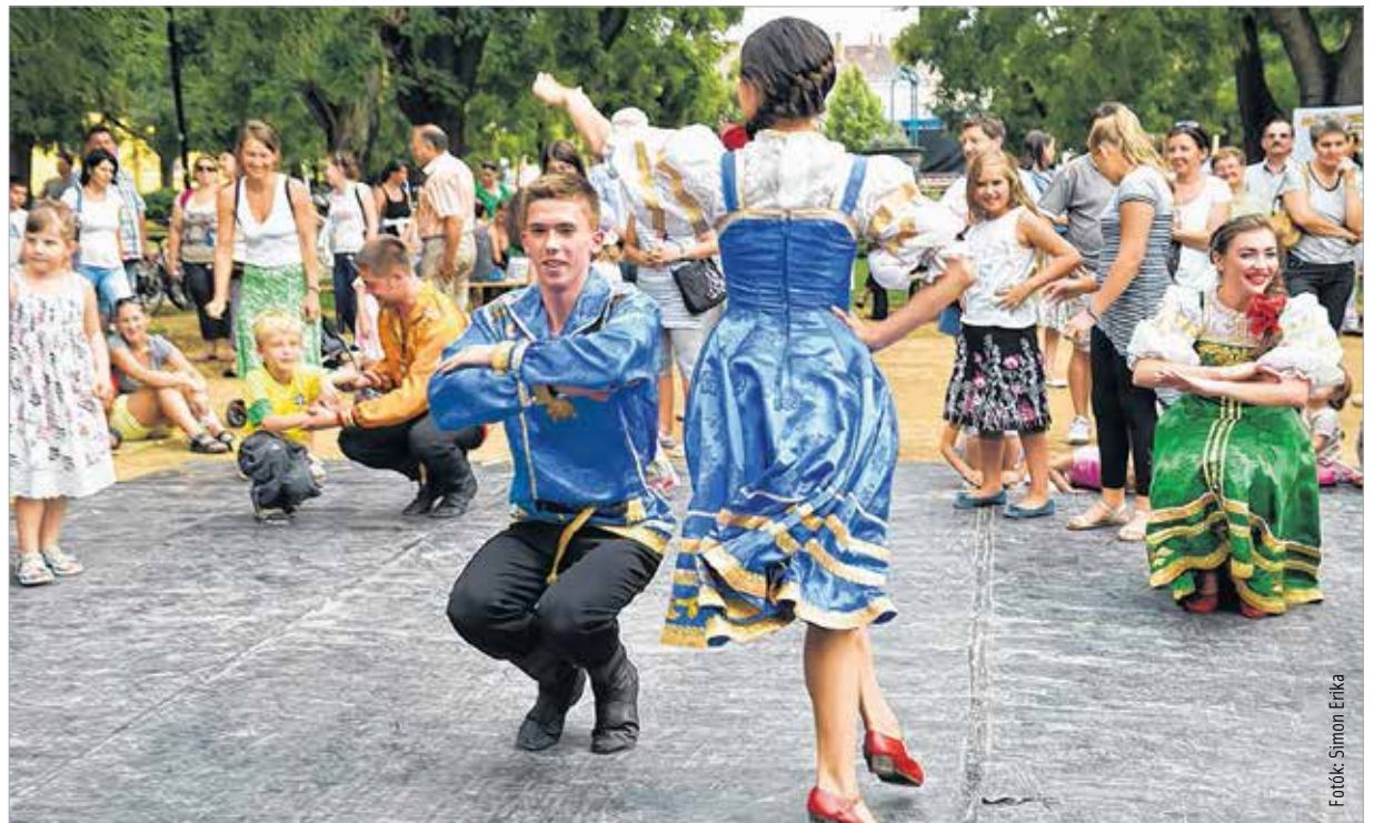
A kecsesség és dinamika meghódította a fiatalokat is

mellett megfigyelhettük más népek táncait is. Az együttes megalapítása óta számtalan helyen megfordult a világban, és mindenütt elkápráztatták a közönséget. A kezdeti időszakban csak oroszországi városokban léptek fel, azóta már számtalan nemzetközi fesztiválon arattak sikert. A táncsoport saját zenekarral rendelkezik, két harmonika és egy hegedű biztosítja a hagyományos orosz dallamokat. Előadásukban elsősorban tradicionális orosz táncokat láthattunk, illetve olyan hagyományos ünnepnapokon játszott műveket, melyek világszerte népszerűek. A táncos blokk legnépszerűbb része, minden orosz táncok legkifejezőbbje a kalinka.