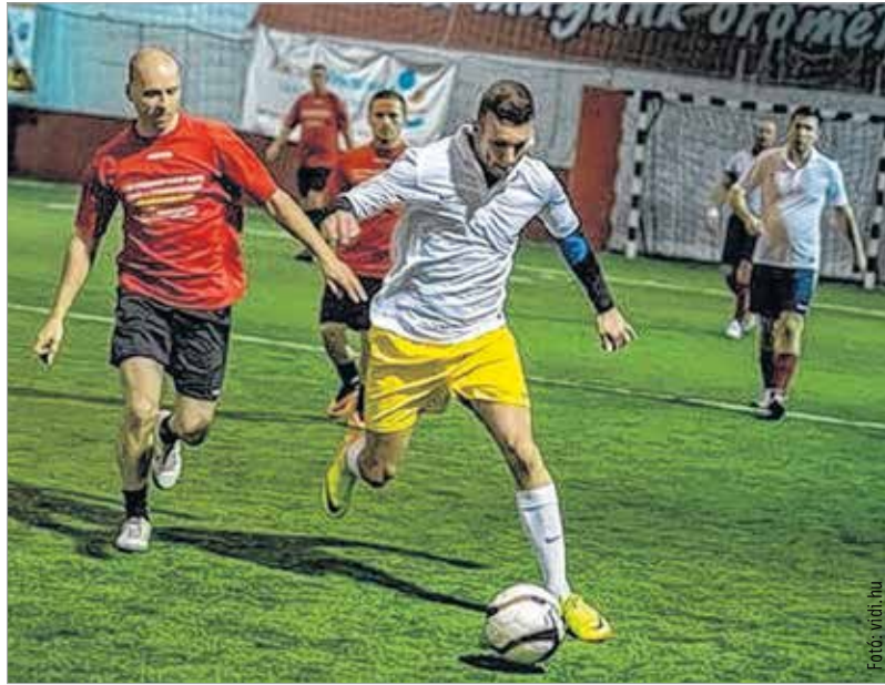
A kispályás futball bázisa Fehérváron mindig adott – akár egy válogatotthoz is

A kispályás foci talán a legnépszerűbb tömegsport Magyarországon (is), a játék, amit gyerekektől öregekig baráti társaságok ezrei úznak heti rendszerességgel. És ennél persze jóval több, hiszen városi bajnokságok százai működnek hol szervezett, hol kevésbé szervezett keretek között. Fehérváron két éve az Alba Liga égisze alatt zajlik a több évtizedes múltra visszatekintő versenyorozat. Mivel az MLSZ által is elismert bajnokságról van szó, nem meglepő, hogy az 5+1-es kispályás futball országos szövetsége is a koronázó városban alakult meg. Vállalva a feladatot, hogy a műfaj rengeteg képviselőjét megpróbálja valamilyen rendszerbe összefogni, országos sorozatot létrehozni, a tömegbázison erős várat építeni. „Fehérváron mindig nagyon jó bajnokság zajlott, az utóbbi években kifejezetten az MLSZ útmutatásai alapján. Igaz, a nemzetközi szövetség a futballt ismeri el kispályás labdarúgásként,