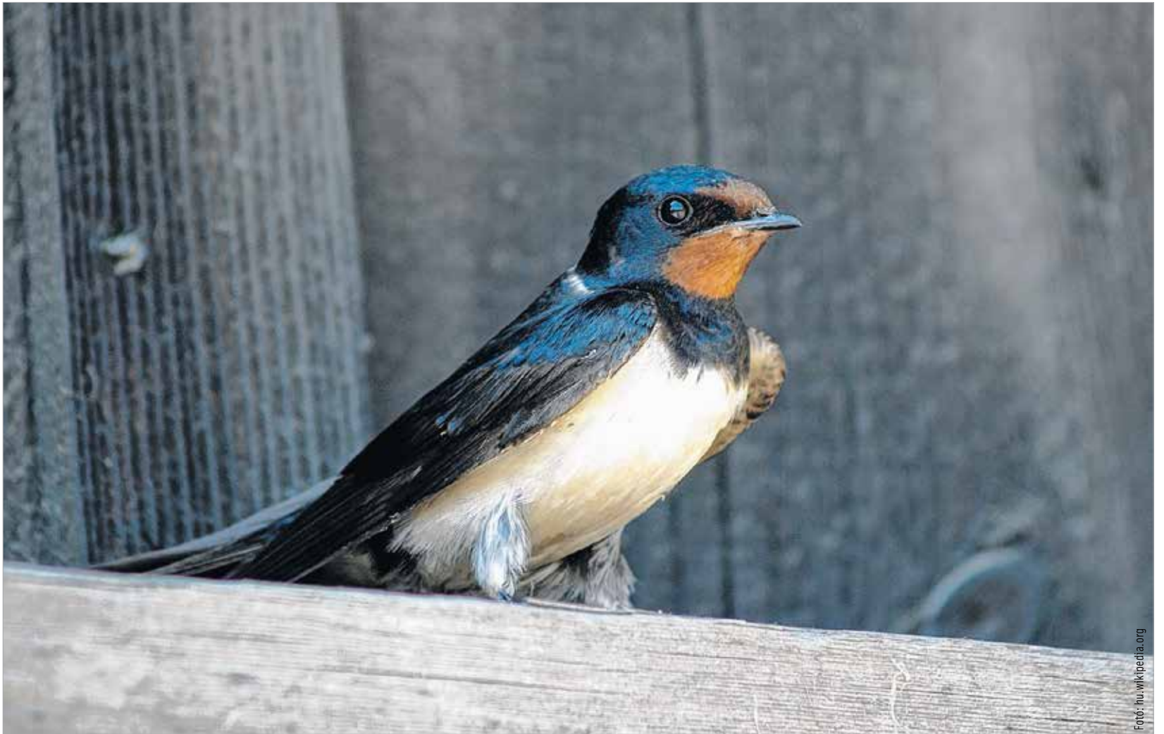
Füsti fecske, azaz Hirundo rustica . Alig-alig török már meg ékes hangjukkal a nyári égboltot. Védett madárfaj. Természetvédelmi értéke tízezer forint.

A modern agrárkemikáliákkal kiváltják a biológiai kártevőirtást, tehát a technológia megoldott, az már más kérdés, hogy ezzel is pusztítást végzünk például a beporzó rovarok körében, mondjuk a házi méhnél. Igazából akkor derül ki, mekkora a baj, ha belegondolunk, hogy az olyan alkalmazkodóképes madarak, melyek az emberi társadalmakkal élnek több ezer éve, mint mondjuk a házi vagy a mezei veréb vagy épp a búbos pacsirta, már nem tudnak megélni az ember környezetében. Kérdéses, az ember