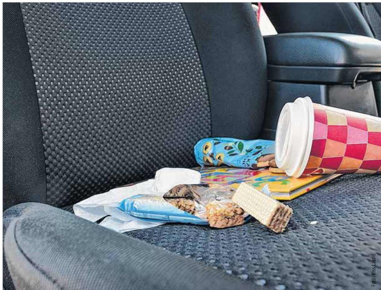
Nyári csendélet az első ülésen – a nyomokat jó, ha frissen takarítjuk!

Az autómosók általában gőzt használnak a foltok ellen, ami egy átlagos háztartásban kevésbé fellelhető – gondolhatnánk elsőre. Pedig ott lapul a szekrényben a gőzölős vasaló, ami jól helyettesíti a profi gépeket. Első körben gőzöljük át ezzel a kárpitot jó alaposan és minden részén akkor is, ha csak kis helyen található folt. Ezt követően hígítsunk fel háztartási kárpittisztítót a szer gyártójának ajánlása szerinti arányban, szoba-hőmérsékletű vízzel. Ezt a levet egy jó minőségű, sűrű szövésű mikroszálás ruhával dörzsöljük bele a kárpitba. Itt is fontos, hogy a teljes kárpitfelületen dolgozzunk, ne csak foltosodásban érintett területen. Később, a száradáskor látjuk majd meg ennek