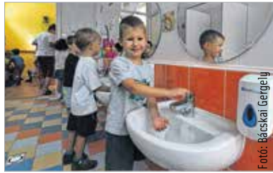
A felújított vizesblokkokat már birtokba is vették az ovisok

Hétfőn tartották a „Közösségi Értéktanteremtő Program – Együtt Székesfehérvárré!” önkéntes napját a Tolnai Utcai Óvodában és a Tolnai Utcai Óvoda Sziget Utcai Tagóvodájában. Idén már több mint húsz fehérvári cég dolgozott közösen az önkormányzattal annak érdekében, hogy a város óvodáinak vizesblokkjai megújuljanak.