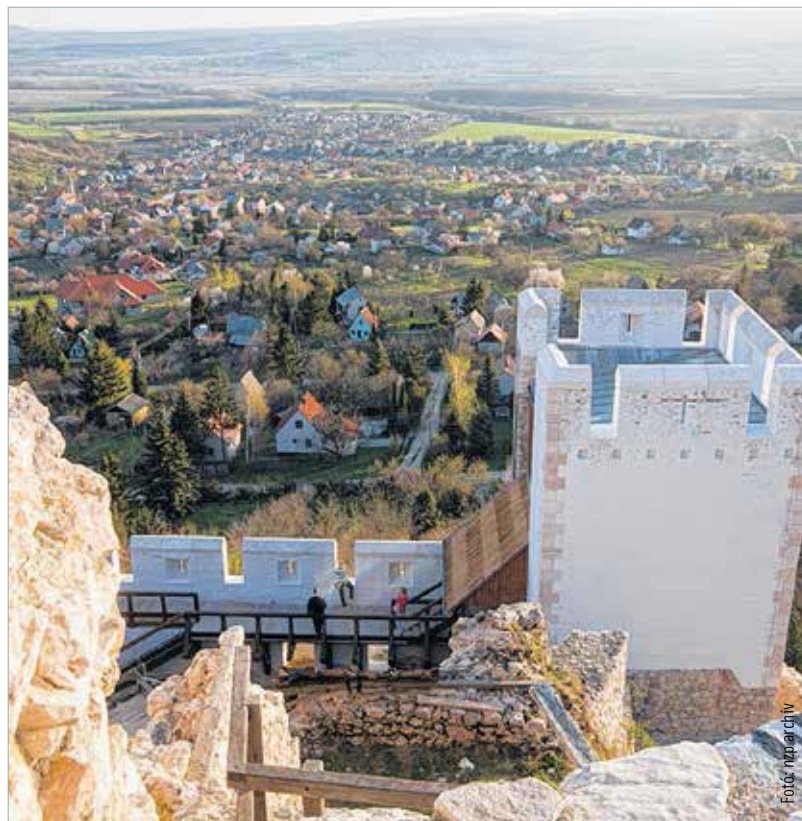
A csókakői vár lélegzetelállító lenről és fentről nézve egyaránt – hétfégi programjai mindezt csak fokozzák