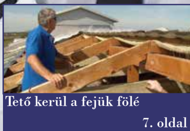
Tető kerül a fejük fölé 7. oldal