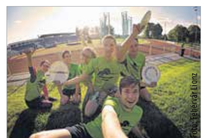
A Lionz vidám csapat, a sport mellett a jó hangulat is garantált

erősségei, ezt a pontvadászat második fordulójában is bizonyíthatják majd. A fehérvári gárda a haladó kategóriában az első kört a harmadik helyen zárta, a szeptember 5-én rendezendő második fordulóban a cél már az első két hely valamelyikének elérése lesz.