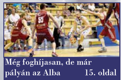
Még foghíjasan, de már pályán az Alba 15. oldal

Uniós pályázati kommunikáció egy kézben – Fehérvár Média Centrum palyazat@fmc.hu • www.fehervarmediacentrum.hu