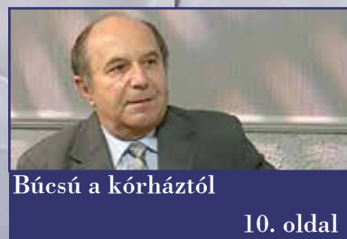
Búcsú a kórháztól 10. oldal