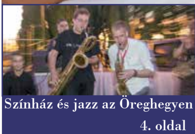
Színház és jazz az Öreghegyen 4. oldal