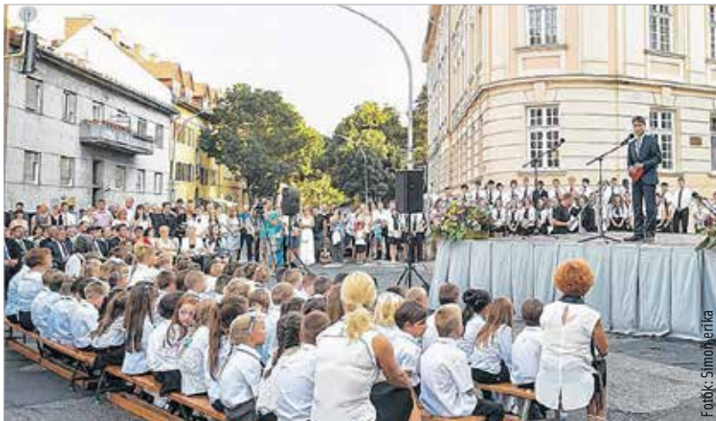
Ünnepelőbe öltözött diákokkal telt meg a Várkörút és a Budai út kereszteződése.

A Teleki Blanka Gimnázium 1876-ban egyetlen osztály 45 tanulóival kezdte meg működését Községi Polgári Leányiskola néven. Számos átalakulást követően a Teleki Blanka Gimnázium és a Sziget Utcai Általános Iskola egyesülésével jött létre a jelenlegi működési forma 2005-ben.