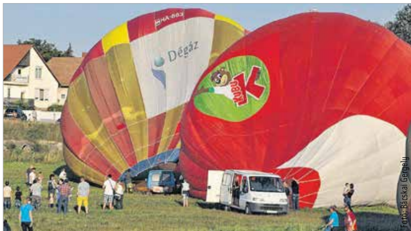
Hőlégballoonozni szenvedély és elhivatottság kérdése. Mint minden komoly sportág, ez is teljes embert kíván.