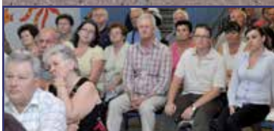
Fejlesztés a Vízivárosban 2. oldal