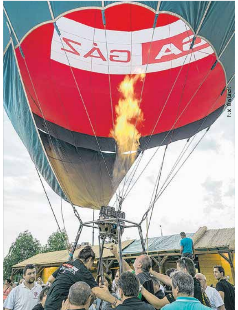
A székesfehérvári megnyitó természetesen egy hőlégballoon felszállásával kezdődött