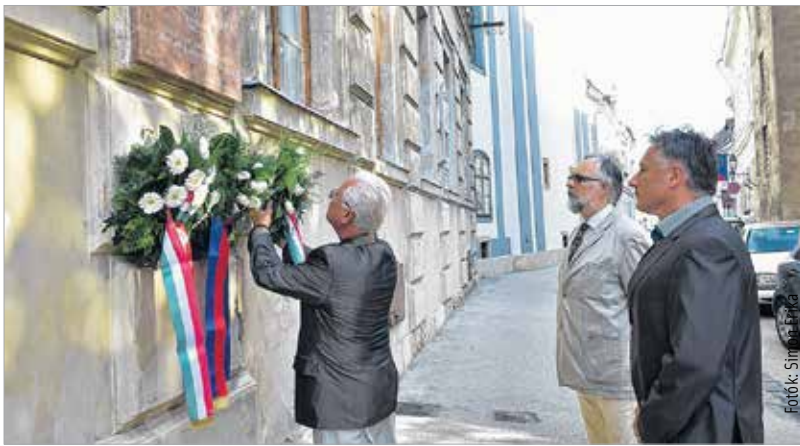
Az egykori munkatársak, tanítványok, tisztelők nem feledkeznek meg professzorukról