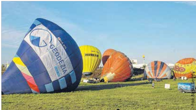
A hőlégballoonozás technikai sport, ugyanakkor komoly felkészülést, szakmai tudást igényel