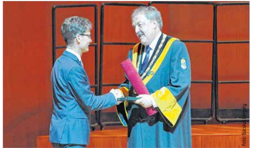
Az egyetem rektora a Művészetek Palotájában köszönte meg a polgármester és az önkormányzat elkötelezettségét a fehérvári felsőoktatás fejlesztése mellett

Az egyetem hatodik kara, az Alba Regia Műszaki Kar tavaly júliusban alakult meg, mely az Óbudai Egyetem Alba Regia Egyetemi Központjának valamint a Nyugat-magyarországi Egyetem Geoinformatikai Karának integrációja révén jött létre. A kar Fehérváron maradása nagyban köszönhető a város önkormányzatának, melynek elismeréseként Székesfehérvár polgármesterének díjat adományoztak.