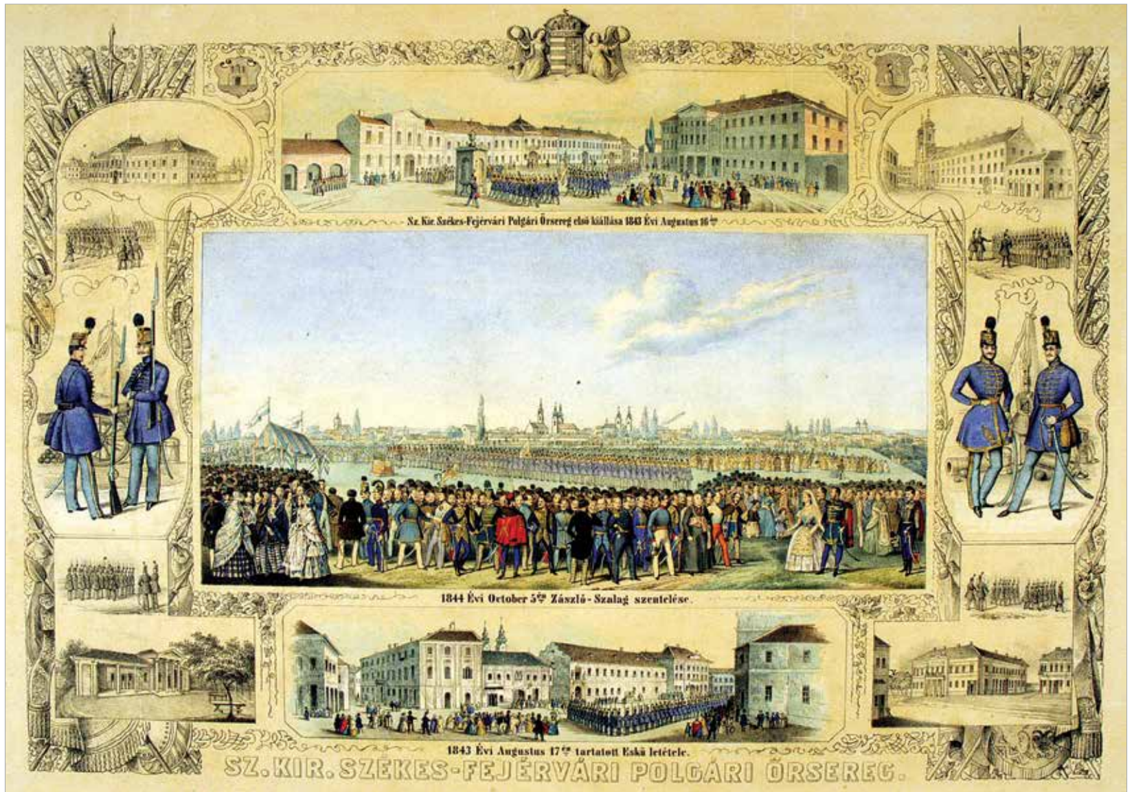
Illusztráció: Ismeretlen mester kőrajza a székesfehérvári polgári őrsereg ünnepeiről a város látképeivel, városképi részletekkel a XIX. század közepéről (Szent István Király Múzeum)

két német nevű is, a szabadságharc bukását követő megtorlás első áldozatává vált. Székesfehérvárnak a népfelkelés megtorlásaként jelentős hadisarcot kellett fizetnie, amely elsősorban az iparos polgárságot sújtotta.