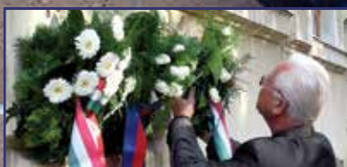
Romhányi György, a tanító 20. oldal