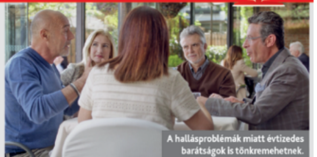
A hallásproblémák miatt évtizedes barátságok is tönkremehetnek.