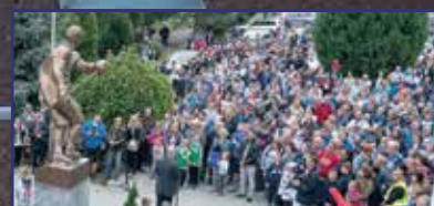
Szoboravatás, szezonrajt, szép remények 29. oldal