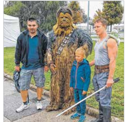
A képről a fénykard sem hiányozhatott

Fehérvár azokból az ipari termelő üzemekből tudja fejleszteni magát, mint amilyen a Denso. A polgármester megjegyezte, sokan kérték a kerékpárút megépítését, ami még az idén elkészül a Sóstó Ipari Parkban. A családi napon a szemerkelő eső ellenére a gyerekek és a vállalkozó kedvű felnőttek kipróbálhatták a minigolfot, a legkisebbek régi, kézzel hajtott, kosaras körhintában ringlispílezhettek, állatokat simogathattak. Ugrálhattak az óriási felfújható hajóban, és közelről is megnézheték, milyen egy oldtimer tűzoltóautó. A színpadon a szombathelyi kötélugrók megmutatták, milyen kreatívan lehet az ugrókötelet használni. A nap sztárjai egyértelműen a Star Wars-hősök voltak: Darth Vader egy rohamosztagos társaságában