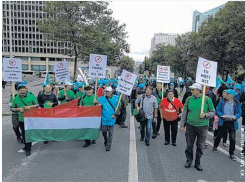
Brüsszelben tüntettek a magyar gazdák is

gazdák számára is biztonságot jelent. Tudomásul kell vennie mindenkinek, hogy nálunk nem úgy működik, hogy beállítunk egy tehenet, és abból a jöszágból azonnal fejhetünk, hanem hosszú évek munkájával lesz a borjúból tejelő tehen. Nem véletlenül mondják, hogy ez a mezőgazdaság nehézipara, hiszen ez egy nagyon lassú folyamat, amely nagy szakértelmet is igényel. Úgy gondolom, az Európai Unió nem teheti meg, hogy lemond a tejtermelésről, ezért feltételezem azt, hogy különböző támogatásokkal, intervenciók beavatkozásokkal segíthetnek a tejtermelés jövedelmezőségének megteremtésében. Most jövedelemvesztésben van valamennyi gazda.”