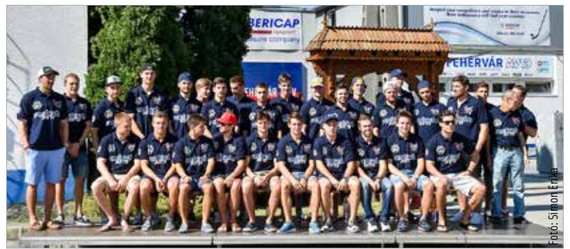
A MOL-ligában is lesz fehérvári csapat, sűrű szezonnak nézünk elébe!