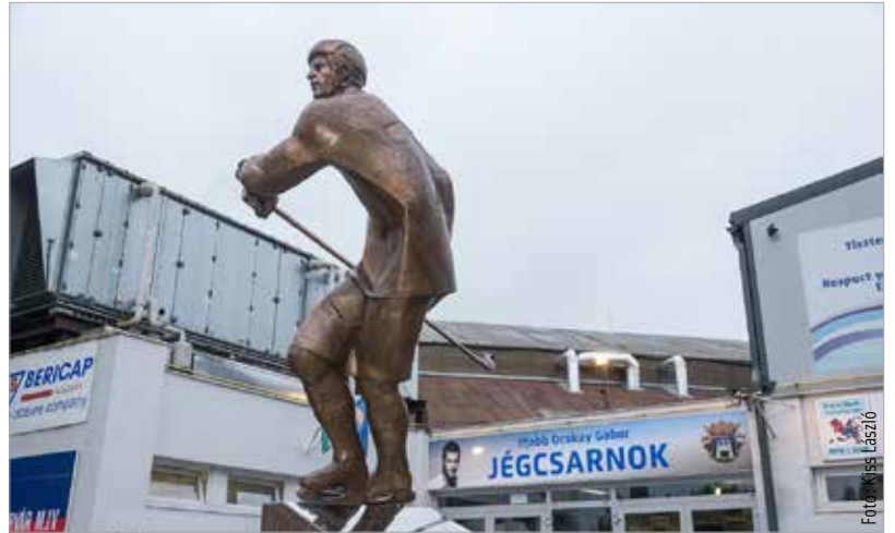
Ocskay Gábor szobra a jégkorong szobra, egy méltó emlékmű

„Két okból állítottuk fel éppen itt a szobrot, a családdal egyeztetve” – mondta Cser-Palkovics András polgármester. „Mindenkinek tudja, hogy ő szinte itt élt. Itt kezdett sportolni, itt lett belőle igazi ikon, és itt vagy innen indulva érte el nagy sikereit. Másrészt az a cél, hogy ha egy gyerek akár edzésre, akár mérkőzésre érkezik, lássa,