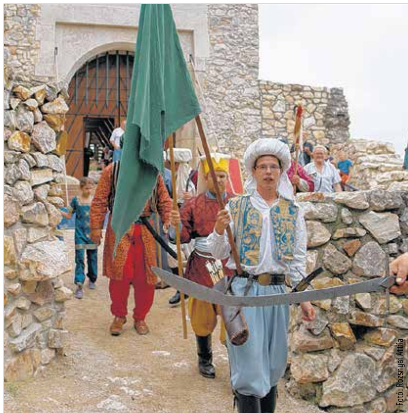
Bár itt még nagyon virgoncak voltak a török megszállók, a következő összecsapásnál visszafoglalták a magyar vitézek Csókakő várát

A kormány által elfogadott nemzeti várprogram részét képezi Fejér megye egyetlenegy kővára, amely 375 millió forint támogatást kap, hogy