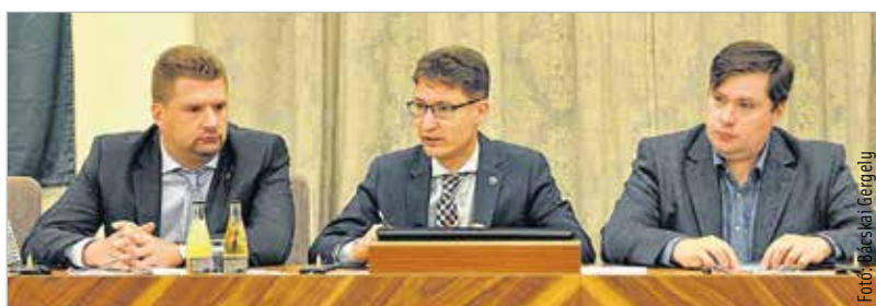
A közgyűlés elfogadta az Integrált Területi Programot, melynek révén 2020-ig tizenhétmilliárd forint uniós fejlesztési támogatás érkezik Fehérvárra

most csak érvényteleníteni tudta a fejlesztésre kiírt közbeszerzési eljárást, és nem tudják lehívni a mintegy kétszázmillió forintot. Szavai szerint az önkormányzat megvizsgálhatja azt a lehetőséget is, hogy a Városgondnoksággal saját fejlesztésben meg tudja-e valósítani a város ezt a fejlesztést. A zárt ülésen meghozott döntésekkel kapcsolatban a polgármester a Király sor és a Géza utca csomópontjában tervezett körforgalom kiépítését emelte ki. De megkezdődik a Krasznai köz és a Krasznai utca burkolatának felújítása és a csapadékvíz-elvezetés javítása is. „Fehérváron ebben a pillanatban ilyen probléma nincsen” – mondta a közgyűlést követően a migránsokkal kapcsolatos kérdéseinkre Székesfehérvár polgármestere. Még a múlt héten csütörtökön este látott napvilágot a hír, miszerint városunk buszpályaudvarán is menekültek vannak. Cser-Palkovics András szavai szerint az érintett személyek jogszerű idegenrendészeti eljárás keretében tartózkodnak Magyarországon. Kiemelte, hogy Székesfehérváron a migráció okozta probléma még nincs jelen.