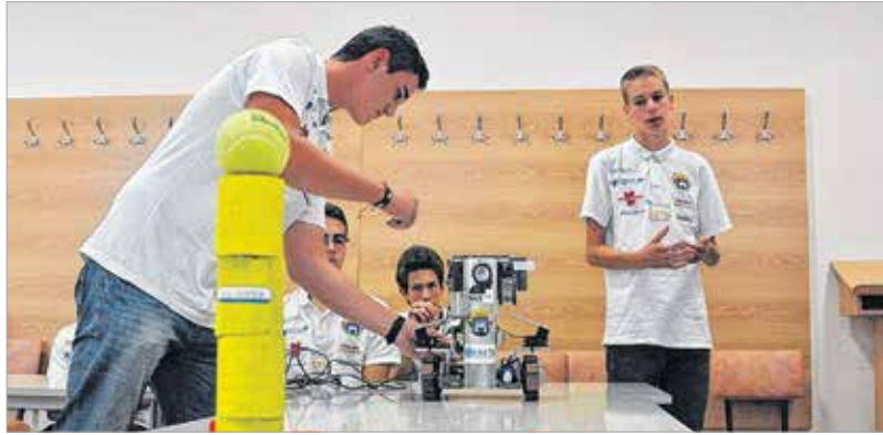
Dezső, a hős magyar robot ádáz küzdelemben rendkívül jól teljesített a versenyen. Tudását az Óbudai Egyetem Alba Regia Műszaki Karán is bemutatták a fehérvári diákok.

Idén június 6-án és 7-én rendezték az Eurobot Junior nevű nemzetközi robotversenyt, melyen magyar diácszapat először vett részt, és előkelő eredménnyel tért haza. A Teleki