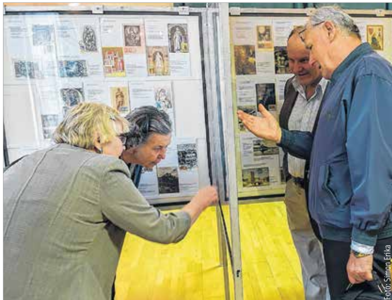
A bélyeggyűjtés szenvedély, az értő szemnek minden bélyeg különleges

össze tudják kapcsolni hivatásukat a szenvedélyükkel. Én abban látom a bélyeggyűjtés népszerűségének okát, hogy összekapcsolható az ember mindennapjaival is. Az idei kiállításunk ugyanígy tematikus, mint az eddigiek. Bár évről évre változik a tematika – hiszen követjük az elvet, hogy ne mindig ugyanazt állítsuk ki – de a jubileumi