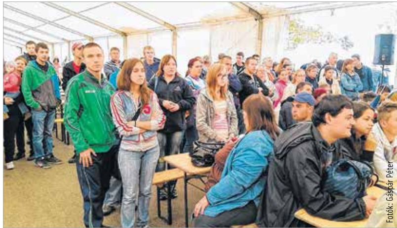
A rossz idő ellenére sokan látogattak ki a családi napra

a legnagyobb természetességgel sétálgatott a gyár területén. Leia hercegnő pisztolyával, Luke Skywalker a fénykardjával pózolt. Csusbakkát pedig bárki elkaphatta egy szelfire.