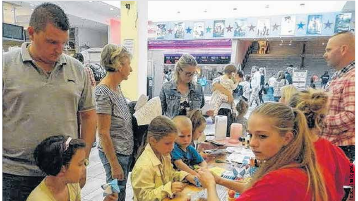
Kézműves-foglalkozás és játékos ügyességi feladatok – senki sem unatkozott a nyárbúcsúztatón

Szenvedélybeteg-segítő Szolgálat, a Fúzió Egyesület, a Székesfehérvári Otthon Segítünk Alapítvány és a Wichern Alapítvány Tranzit Szolgálatok voltak.