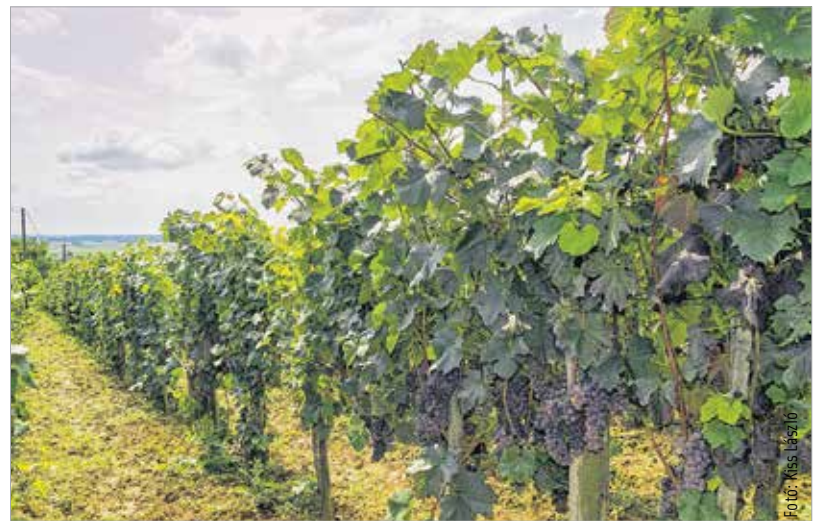
A minőségre és a mennyiségre az idén nem lehet panasz

havi negyven, ötven milliméter eső esett, az sem tett jót az ültetvénynek. Úgy nézett ki, bajba kerülünk, hiszen ez a kettő együtt tönkretelhetne volna az egész évről. Aztán fordult a kocka, hála Istennek minden jóra fordult, így jó minőséget várunk idén is. Természetesen nem minden fajta reagált rosszul erre az időjárásra, a Zengő kifejezetten szép termést ad. Hús százaléka körül van a cukorfoka, és egészségesek a fürtök. Összességében elmondhatom, nincs okunk panaszra.” Szabó-Bisztricz Anett tűzoltó főhadnagy, megyei katasztrófavédelmi szövívő a szüret veszélyeire is felhívta a figyelmet: „A szüret egyik veszélyforrása a borkészítés során kialakuló, gyakran emberéletet is köve-