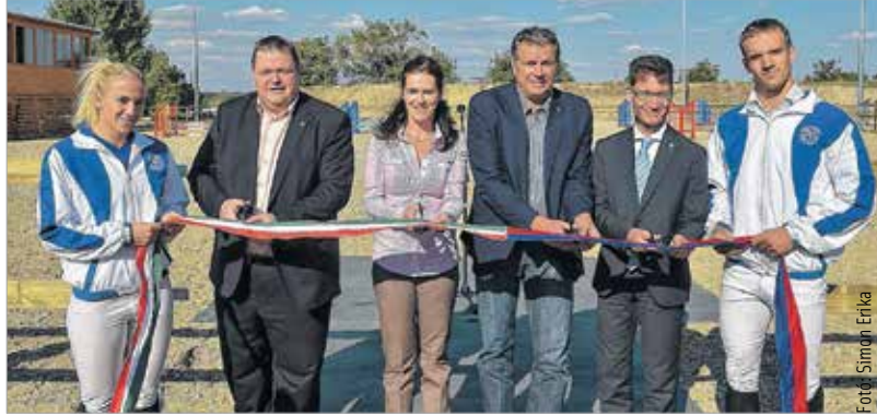
A Volán Fehérvár új lovardájának avatóján az ünnepi pillanatoké volt a főszerep, a szalag átvágása után azonban már a munka kerül előtérbe

„Az a célunk, hogy minél több sportágnak meglegyen a saját otthona, mert azt tapasztaljuk, hogy ha a saját otthonaikban vannak, akkor a jó gazda gondosságával fogják azt ápolni, szeretni, adott helyzetben karbantartani. Nagy öröm, hogy néhány nappal ezelőtt a jégkorongozóknak valamint a többi jéges sportág képviselőinek bővült az edzési és versenyzési lehetősége egy új jégfelülettel. Legalább akkora öröm, hogy most az öttusázók vehették át ezt az új létesítményt.” – mondta el a komplexum avatóján Cser-Palkovics András polgármester. A versenyzők már birtokba is vették a létesítményt, melynek további