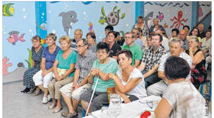
Sokan voltak kíváncsiak, mi történik lakókörnyezetükben