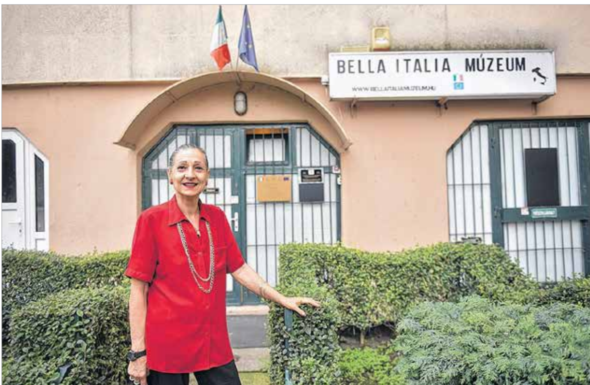
A Bella Itália Múzeum új utakon jár

Mikor kezdett el beérni munkája gyümölcse?