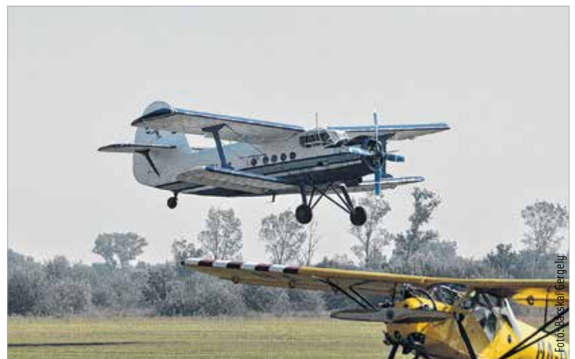
A veterángépek még ma is méltóságjeljesek, ráadásul stabilak a levegőben

Székesfehérvár Megyei Jogú Város Önkormányzat Közgyűlésének Gazdasági Szakbizottsága