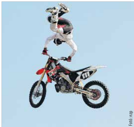
Első nekifutásra azt mondaná az ember, nem normális – mégis precíz, pontos és látványos volt a motokrossz-bemutató