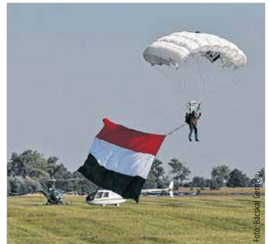
A szolnokiak és az albatroszos ejtőernyősök nemzeti trikolórral értek földre