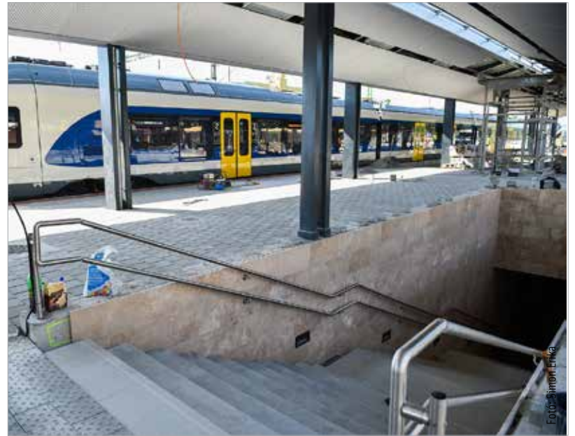
Keddtől már az utascsarnokon, az új aluljárón és az elkészült új peronon keresztül lehet megközelíteni az ideiglenes peronokat

A székesfehérvári vasútállomás felújítása várhatóan 2016-ban fejeződik be teljes vágányépítéssel, a Budapest és Börgönd felőli oldal még hiányzó új kiterőinek megépítésével és az ideiglenes peronok elbontásával.