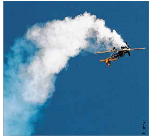
Teleírták a kék eget Börgöndön zuhanóban, fejjel lefelé, pörögve, kacszáva

gyakorlatáról volt szó. Ha már gyakorlat: kutató-mentők bevonásával folyik szeptember 24-ig a Személyi Mentés Egységesítési Képzés 2015 elnevezésű valós idejű nemzetközi repülőgyakorlat Börgöndön, amit a repülónap idejére felfüggesztettek, és csak a többi gyakorlóléhszínen, Pápán, Szentkirályszabadján, Újdörögden, Taszáron, Kalocsán, Győrben és Szombathelyen folytattak.