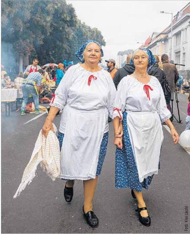
Kétfestőben, ketten, párban