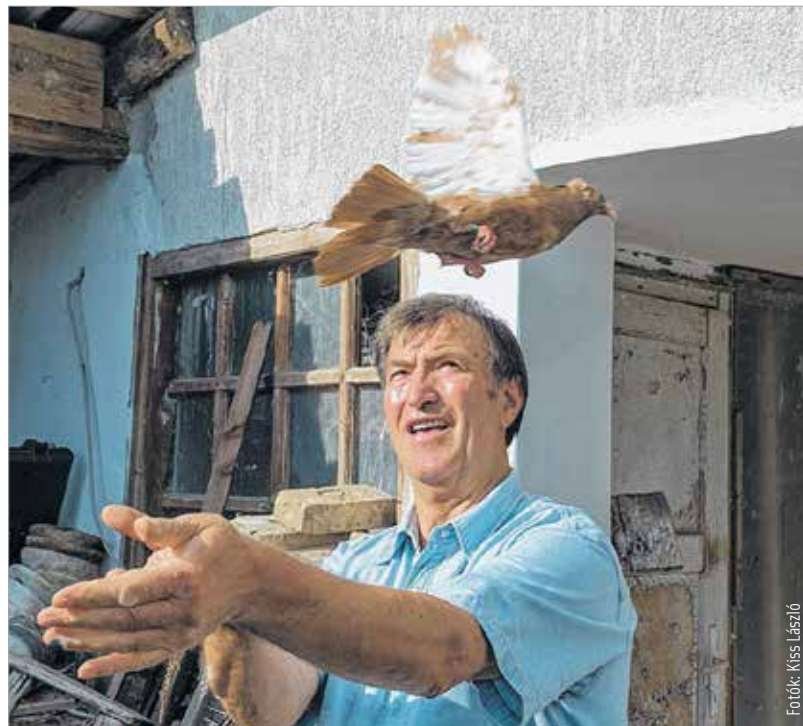
A galamb általában hat-nyolc évig él, minél öregebb, annál sötétebb a tollazata

sorszám. Ha a madár Magyarországon valahol elveszne, akkor a személyi alapján az interneten ki lehet deríteni, ki a tulajdonosa.” A másik fészekből első pillantásra egy sólyom és a galamb szerelemgyerekeinek tűnő madár bukkant elő. A bácskai hosszú csőrű keringő igazán érdekes látvány: egyszerre jámbor