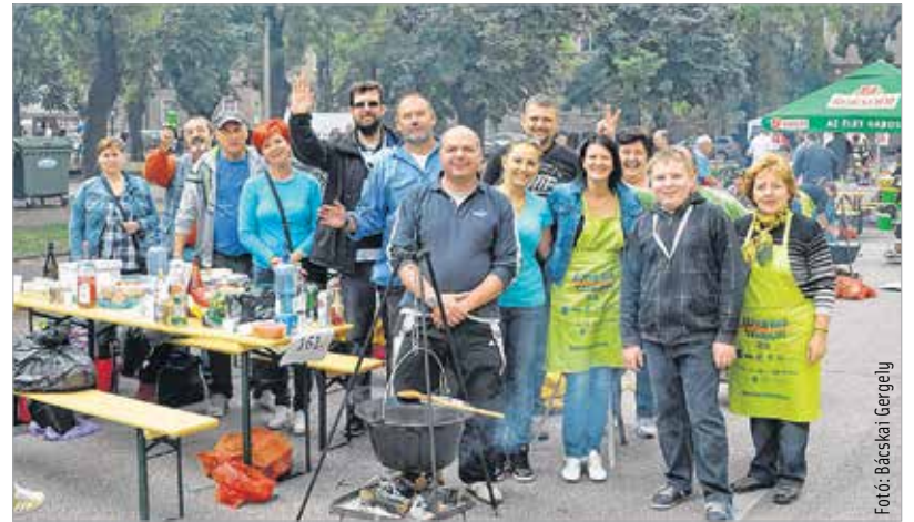
Amikor három generáció erősíti egymást