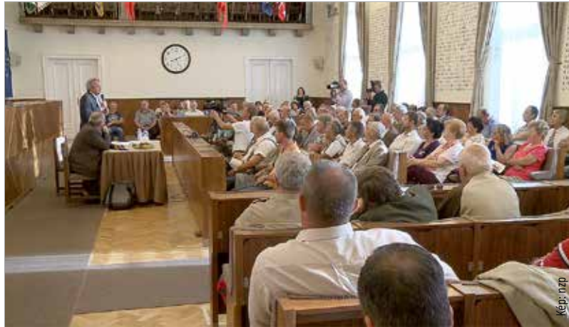
A városházára meghirdetett előadásra sokan voltak kíváncsiak, sőt véleményüknek hangot is adtak

Az előadás levezetője Vargha Tamás honvédelmi államtitkár volt, szakértője Tóth Péter, a Nemzeti Közszolgálati Egyetem Stratégiai Védelmi Központjának igazgatója. Vargha Tamás az előadáson elmondta, hogy a honvédség állományát migrációs válság esetén vetik be, de akkor is csak a rendőrség segítségére, annak támogatására. Önálló műveleteket a katonák nem hajtanak végre. A kialakult helyzettel kapcsolatban az államtitkár kijelentette: annak lehetünk tanúi, hogy Görögország nem csinál semmit, a migránsokat átengedi az országán, Szerbia és Macedónia hasonlóan cselekszik, bár ők nem tagjai az Európai Uniónak. Vargha Tamás kiemelte, mindez úgy történik, hogy a konfliktusok hosszan elhúzódnak: a Szovjetunió 1980-ban vonult be Afganisztánba, Irakot huszonegy éve támadta meg az USA, már Szíriában is túl vagyunk a tűréshatáron, de mindeközben semmi nem oldódott meg. Tóth Péter a kialakult helyzet közvetlen okait így jellemezte: „Polgárháborúk dúlnak Szíriában, Irakban. Líbia kettészakadt. Líbia