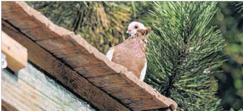
A galamb általában hat-nyolc évig él, minél öregebb, annál sötétebb a tollazata