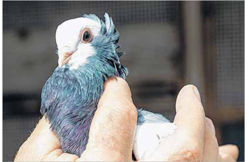
A székesfehérvári bukógalamb nemzeti kincs

A kis házban komplett duplexben fészkeltek a galambok. A felső polc sarkában állt a fészektányér, amiben folyamatosan