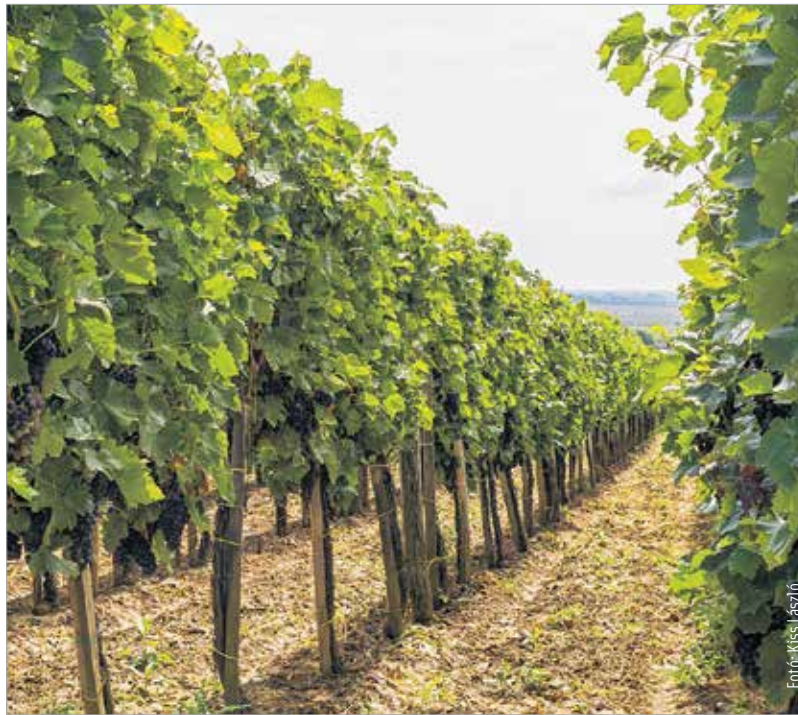
Az Oktatási Minisztérium által elismert képzési formában november 2-án, hétfőn indítják útnak a „Bolygó Hollandi” elnevezésű borismereti tanfolyam következő kurzusát

Magyarországon huszonkét borvidék található. A hozzánk legközelebbi móri borvidék méretében az egyik legkisebb, de a híresebbek közé tartozik. Múltja a történelmi időkbe tekint vissza, azonban bortörvényünk 1996-tól sorolja a borvidékhez Mór, Pusztavám, Söréd, Csókakő, Zámoly és Csákberény I. és II. osztályú szőlőkataszteri besorolású határterseit.