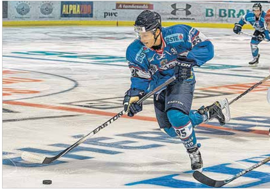
A fehér mezes Innsbruck csak üldözte, de nem érte utol a Volánt