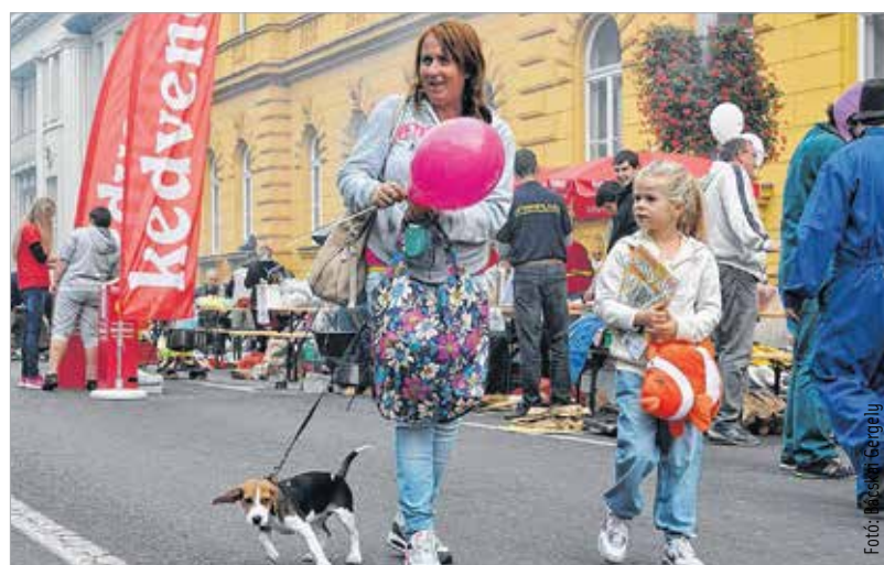
Még mondják, hogy a kutyának sem kell...

tuk Székesfehérvár polgármesterét Bajára, a halfőző fesztiválunkra. Ez a meghívás természetesen nemcsak Székesfehérvár polgármesterének, hanem a város minden polgárának szólt. Ezt a látogatást viszonzzuk most azzal a gondolattal, hogy a hasonló találkozóknak jövőjük lesz. Nagy megtiszteltetés számomra, hogy itt lehetek! Olyan élményekkel gazdagnodom, olyan újdonságokkal térhetek haza, amit otthon is hasznosítani tudunk. A kapcsolatunkat feltétlenül tovább építjük!” A megszólított csapatok válaszaik önmagukért beszélnek. Külön-külön is játékos harmóniát sugallnak. Ime, egy csokor a csapatvezetők lecsófőző stratégiájából. A felvezetés természetesen az újságíróé, a válasz azonban a különböző és mégis azonosan