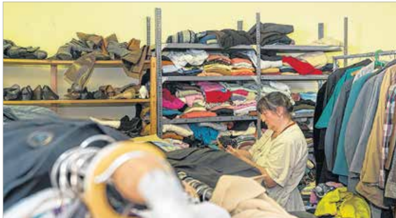
Ruhát, cipőt is ingyen kaphatnak a rászorulók a Máltai Szeretetszolgálattól

Nemcsak az étkezés, van, hogy a ruházkodás is gondot okoz valaki-