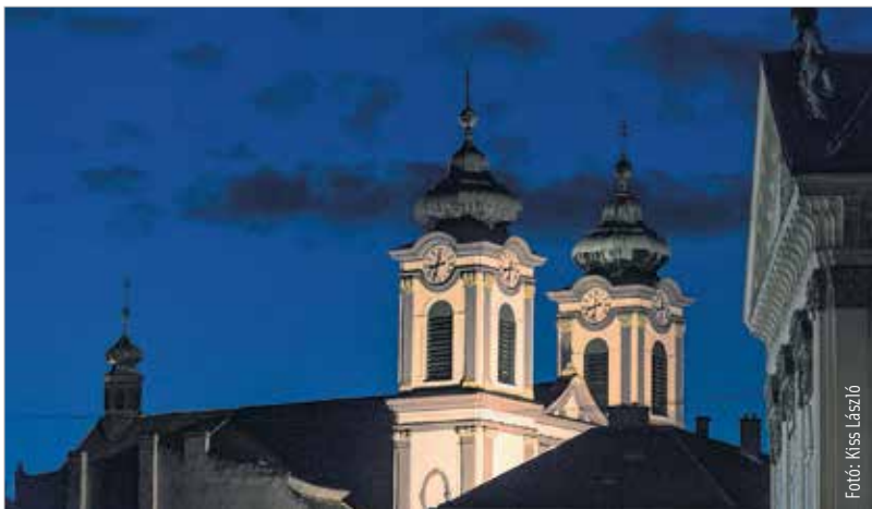
Lép be és láss! A Nagyboldogasszony Ciszterci Plébánia is csatlakozott a nyitott templomok napjához.

a kulturális örökség napjaival együtt a nyitott templomok napja, amikor a templomok, zsinagógák megnyitják kapuit, és a közösségek bemutatják templomaik művészeti értékeit. Színes kulturális programokkal, helyenként toronymászással várják az érdeklődőket. A felhívásra idén több mint száz templom jelentkezett. Lép be és láss! címmel a Nagyboldogasszony Ciszterci Plébánia is csatlakozott az eseményhez. Szeptember 19-én 10 órától egészen 20 óráig várják az érdeklődőket. A csatlakozó települések és templomok részletes listáját megtalálhatják a fesztivál honlapján az imatérképen: www.ars-sacra.hu