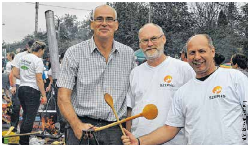
Három a testőr, kettő a fakanál

sokkal inkább a jelenlétük volt. „Olyan lecsót szeretnék főzni, ami a számunkra olyan kedves székely ízeket adja. Ahogy felénk szokás, házi szalonnával, házi kolbással ízesítjük. Mindent beleteszünk, ami jár, sőt még annál is többet, de nem az a lényeg, hanem hogy újra itt lehetünk!” A Városgondnokság jó szokása szerint vigyázott a szervezet jó