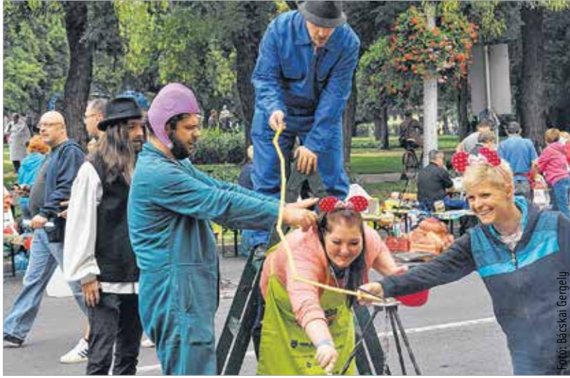
A Szabad Színház műszaki alakulata méretet vesz