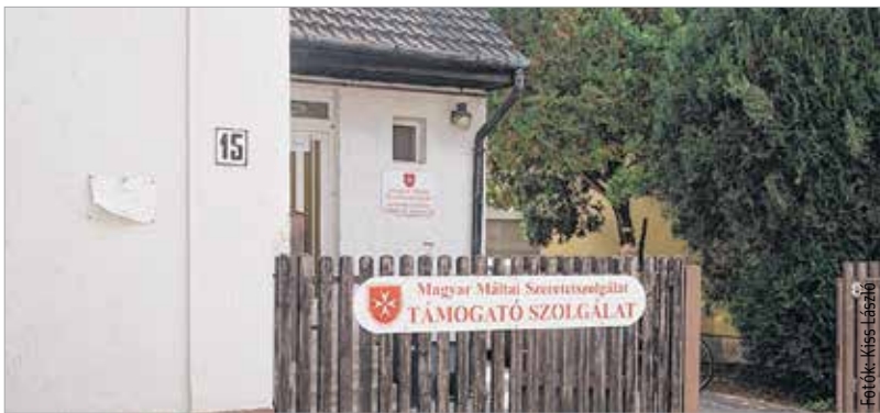
Minden szerdán várják a rászorulókat a Taksony utcában

A Máltai Szeretetszolgálat székesfehérvári csoportja 1992-ben alakult meg. A Taksony utcában két éve működnek. A csoport tagjai önkéntes alapon végzik a segítő, karitatív munkát. A rászorulókat szerdánként reggel 9 órától várják. Étél- és ruhaadományt szintén ide lehet hozni, hétfőn, szerdán és pénteken.