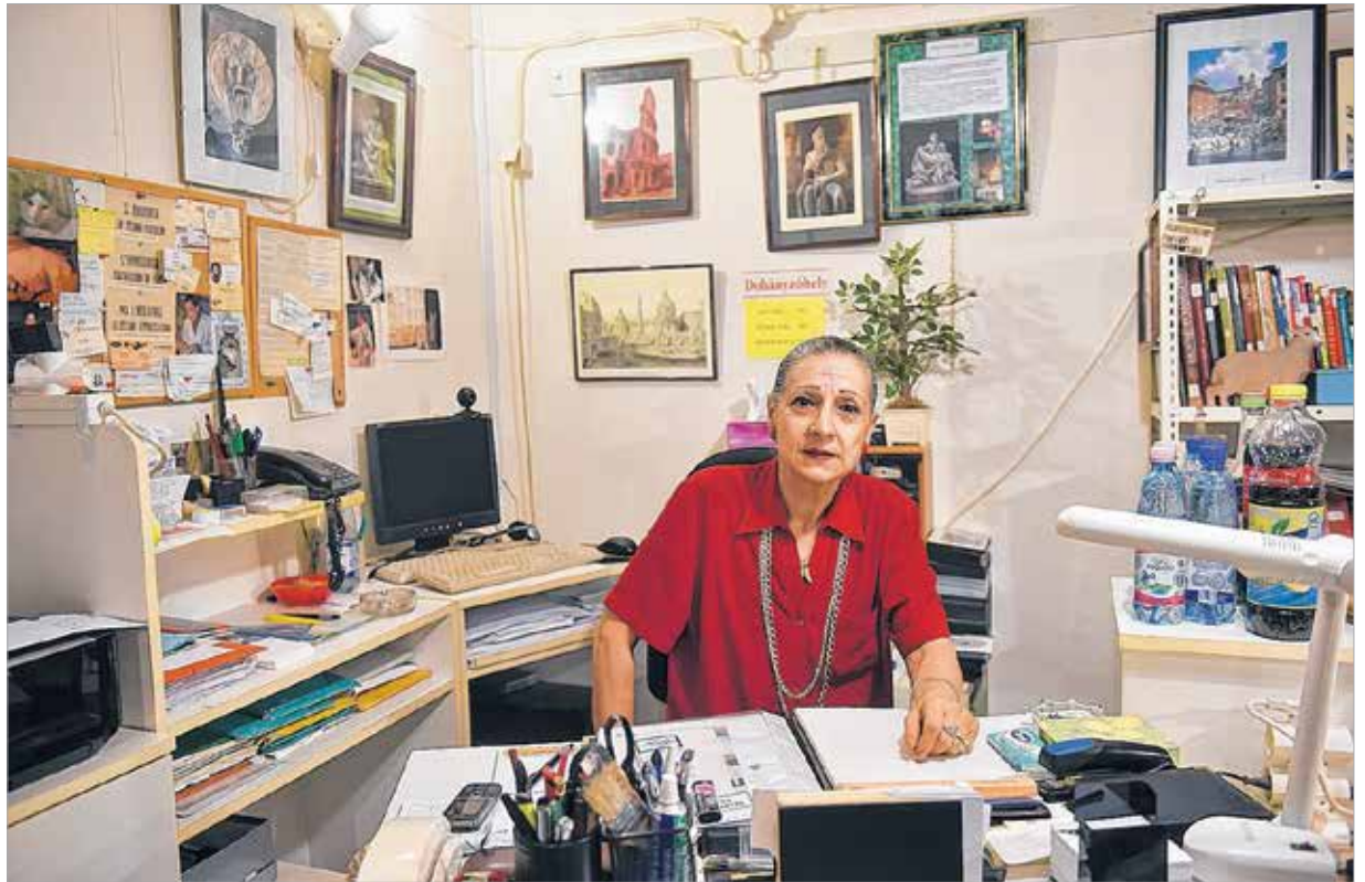
Sok jó gondolat kis helyen is elfér

Több mint tíz olyan tematikus kiállítást rendeztem, amely más-