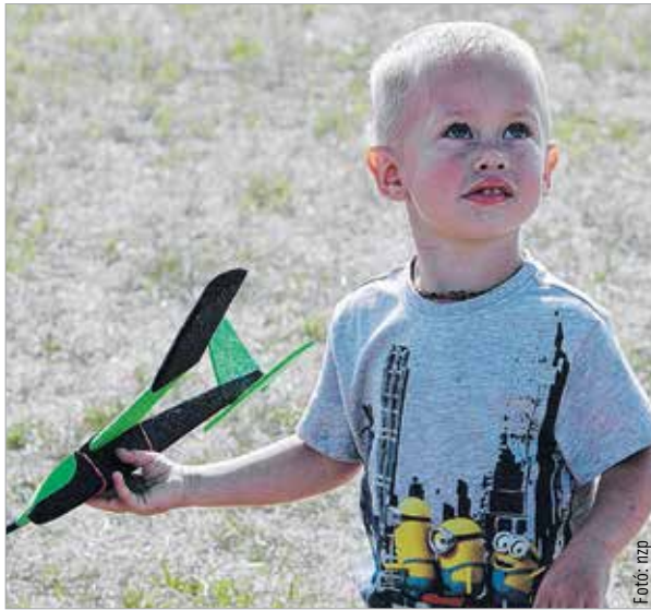
Szinte biztos, hogy pilóta leszek!

A repülónapon természetesen az eszem-izom is uralkodott, a