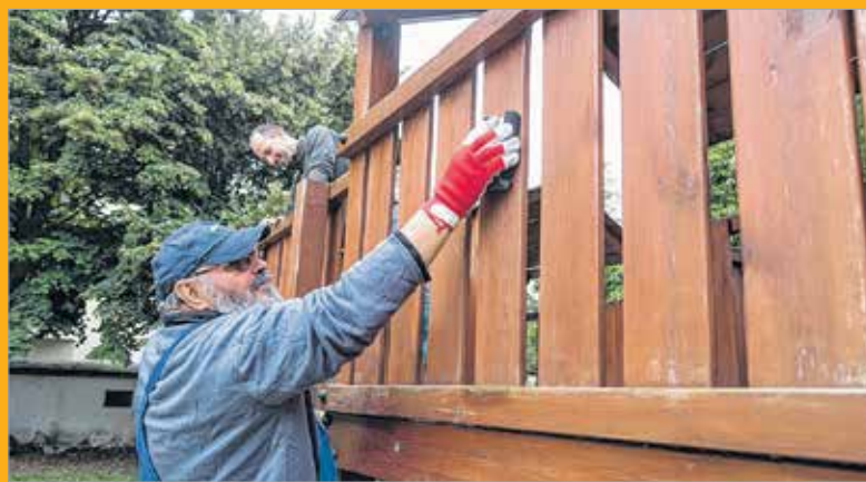
Ez már a harmadik alkalom, hogy a Széphő munkatársai a társadalmi felelősségvállalás jegyében felkeresnek egy intézményt, és rendbehozzák a padokat, játszóeszközöket

Az idei évben az immár hagyományná vált segítségnyújtásban az Arany János Óvoda, Általános Iskola, Speciális Szakiskola és Egységes Gyógypedagógiai Módszertani Intézmény részesült a Széphő jóvoltából. A felső- és középfokú munkaruhába bújtak, hogy az udvari játékok javításával, felújításával komfortosabbá tegyék a választott intézmény tanulóinak hétköznapjait.