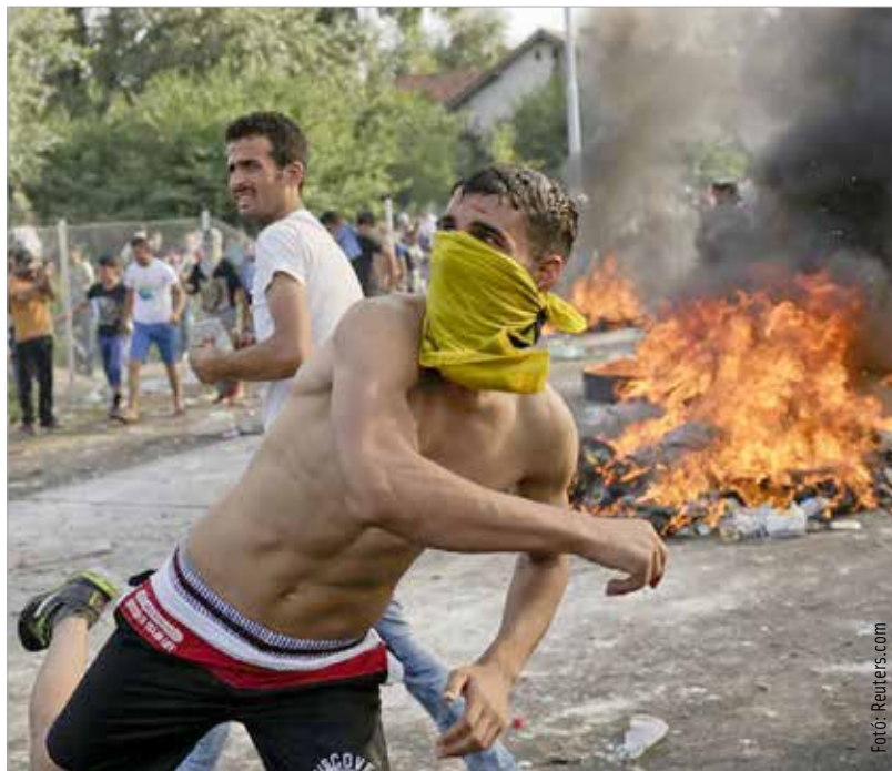
Ismerős a kép? Pedig nem 2006-ban készült. Ők éppen menedéket kérnek az Európai Uniótól...

és Tunézia korábban a szub-szaharai migrációt felfogta Európa előtt, de azzal, hogy e két állam diktatúrája összeomlott, kinyíltak a kapuk. Úgyanakkor nagyon fontos az Iszlám Állam előretörése. Szíria Aszad-rendszere harmadnyi területre zsugorodott, miközben a fennmaradó kétharmadot fegyveres alakulatok irányítják. Mindezek mellett ki kell mondani, hogy az észak-afri-