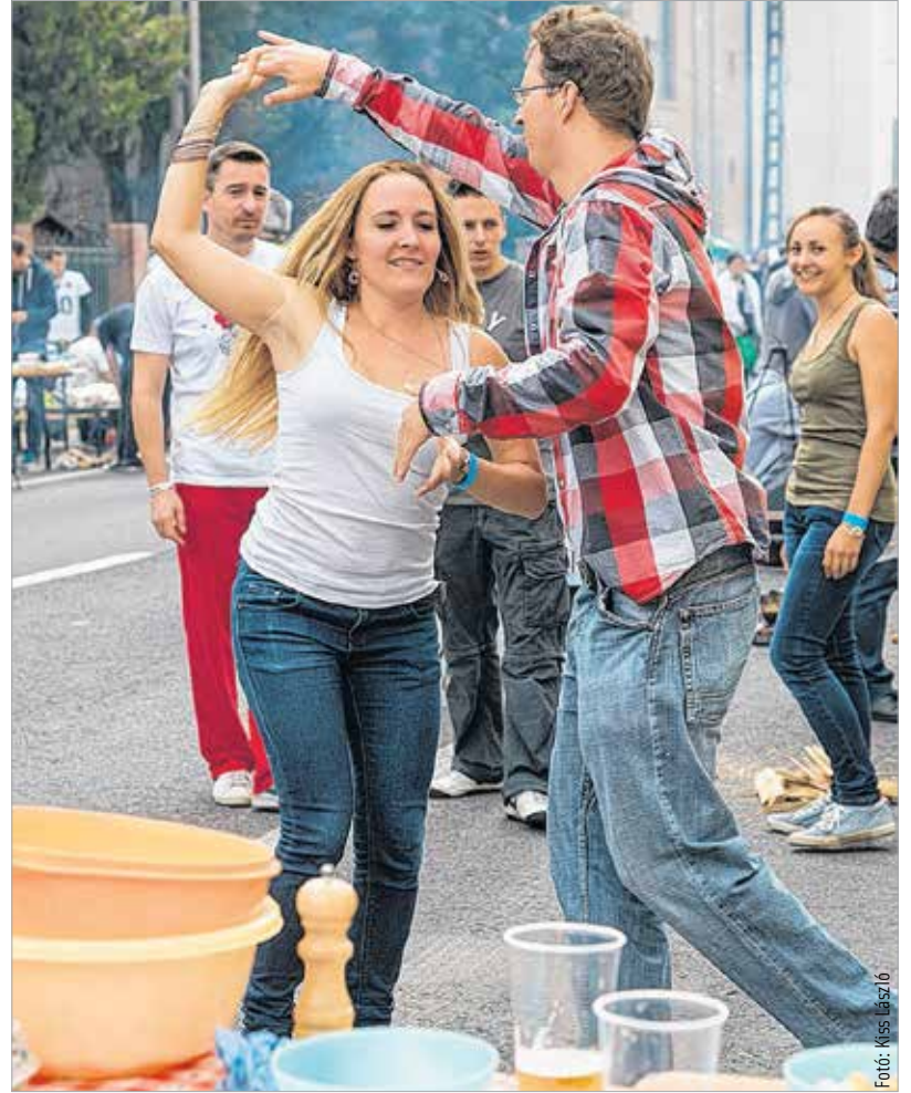
Tánc a füstben...