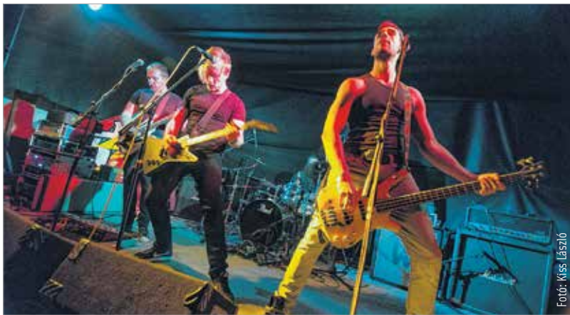
Helyi zenekarok szórakoztatták a fesztiválózókat

Nézzé meg videókat is az eseményről: www.fehervartv.hu