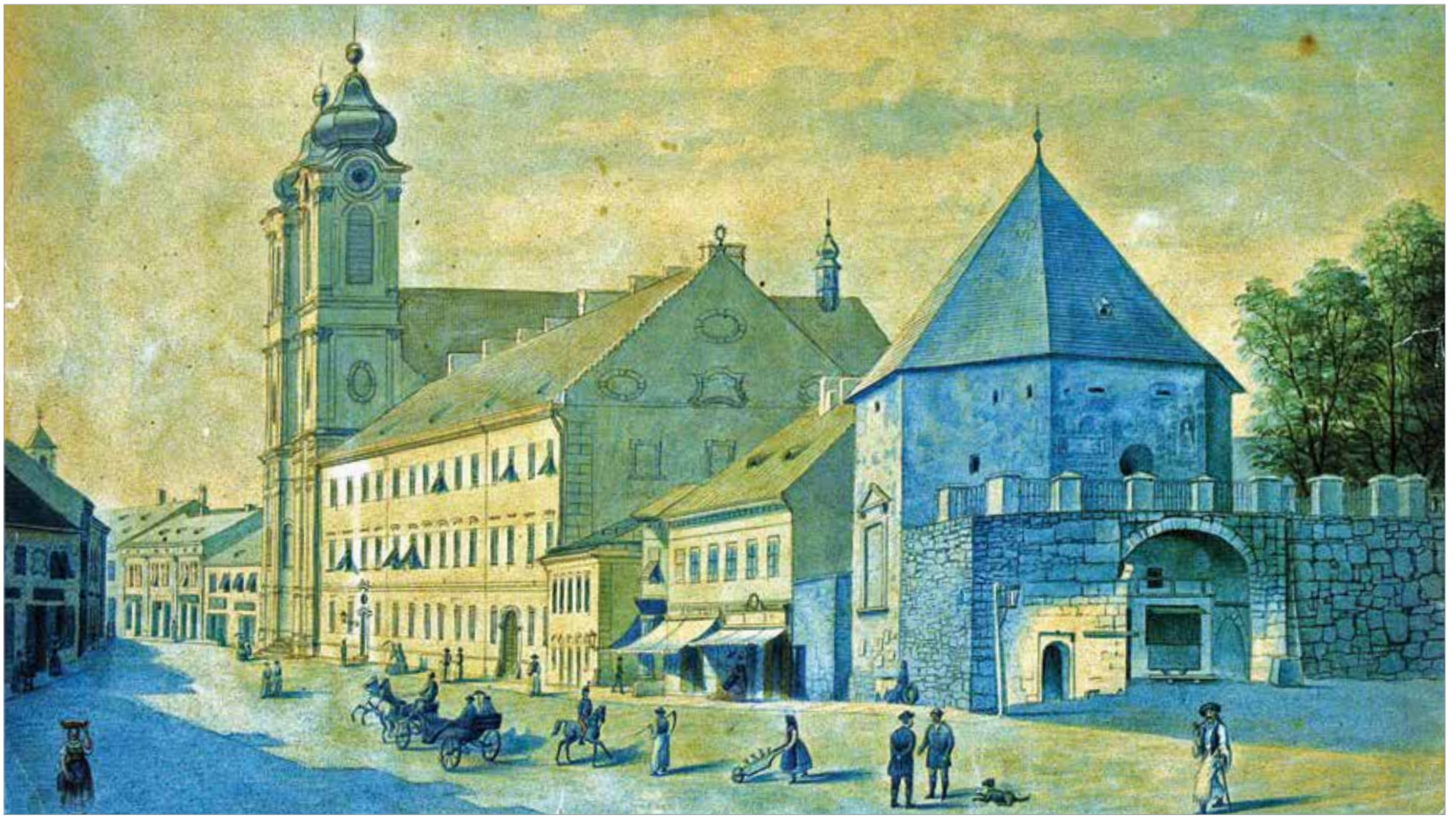
Székesfehérvár főutcája a budai kapu tornyával, a ciszterci rendházzal és templommal. Aujedszky Adolf festménye, 1870 (Szent István Király Múzeum)

gyakorlatban csupán a megszo-kottságon alapul. Ennek alapján a püspökség 1885 december elején Székesfehérváron a német nyelvű misét megszüntette. Az utolsó né-met nyelvű miét 1885. adventjének elején egy szerzetes tanár mondta a ciszterci templomban. A fehérvári