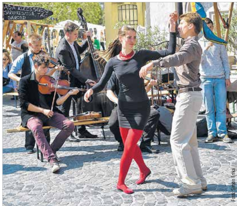
Értékek helyben, tánccal és színes sokadalommal