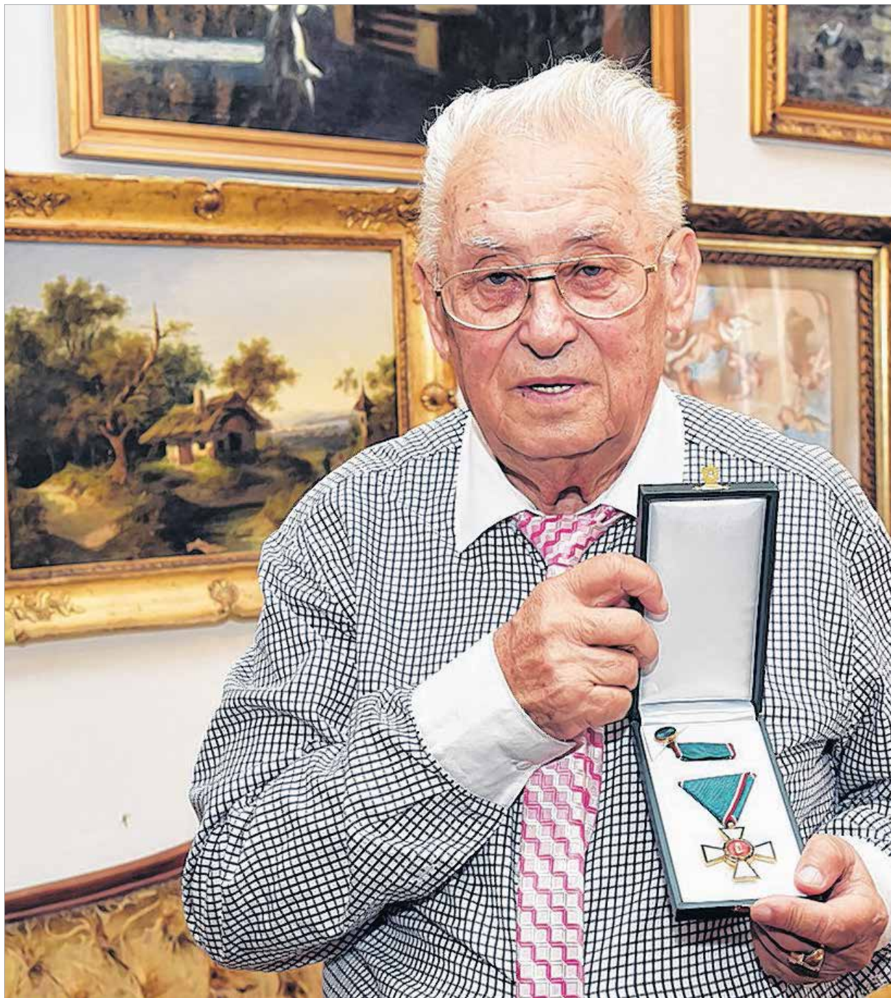
Méltó helyre került a Lovagkereszt

Ő vette észre, hogy szabadidőmben is sokat foglalkozom szövetekkel, részt veszek a boncolásokon. Ő erősített meg abban, hogy ezt a szakirányt válasszam. Mikor áthelyezték az intézetből Makóra, mi sem volt természetesebb, hogy mentem utána. Makó volt a legjobb hely, ahova kerülhettem, ahol végérvényesen megtanulhattam, mit jelent önállóan lenni.