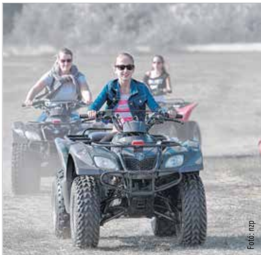
Az amazonok sem akartak kimaradni az extrém sportok élvezeteiből