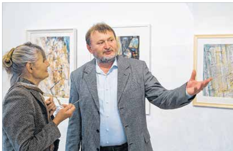
A fókuszban mindig a művész és művészete áll

hit a vallásban, a szerelemben, a szeretetben, az értelemben. A második részben a műtermi csendéletek világát mutatom meg. A szép fehérvári modellek kicsit más ábrázolásmódban mutatkoznak meg, míg a harmadik az európai társadalom, amelyik nem lehet már zárt, mert olyan kultúrák hatása alatt áll, amelyek egyre jobban kisajátítják és megváltoztatják azt, amire mi azt mondjuk, hogy íme ez a