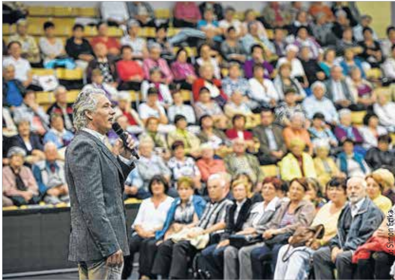
Telt ház várta a Vörösmarty Színház művészeit a sportcsarnokban