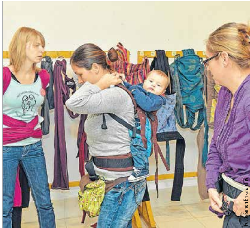
Tudjon meg még többet a témáról! A Fehérvár Televízióban erről is szó esik csütörtökön 19 óra 45 perctől az Együtt magazinban.

S hogy miért jó a hordozás? Sokan úgy vélik, azért is, mert a babakördözés lehetővé teszi, hogy a