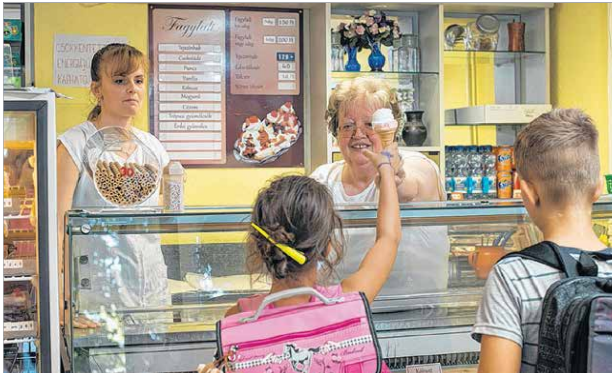
A cukrászdában fagyaltot karácsonyig tartanak