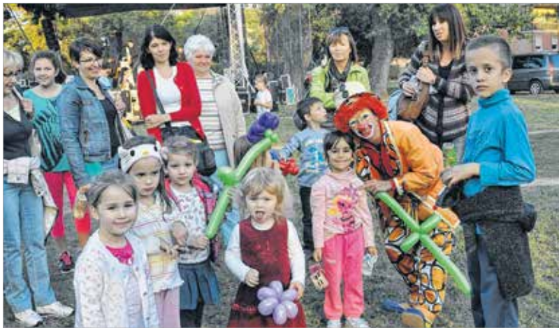
Andi bohóc nélkül a Böndörödő sem lenne az igazi!

Böndörödő lényegében olyasmi, mint a pöndörödő: így őszi tájt a szőlő levelei sárgulnak, barnulnak, pöndörödnek vagy éppenséggel böndörödnek. Ez