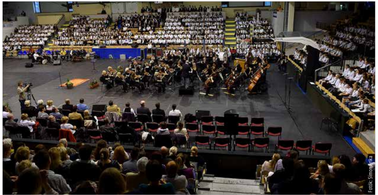
Liszt Ferenc Előjátékok című szimfonikus költeménye az Alba Regia Szimfonikus Zenekar tolmácsolásában hangzott el