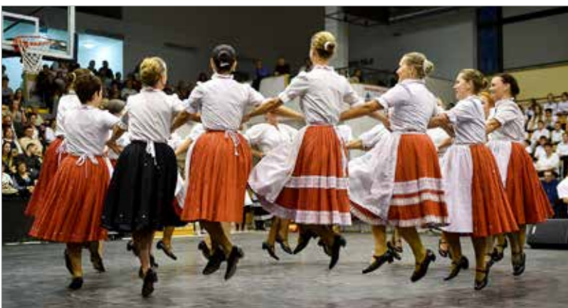
Mondóka és szerelem táncban. Szimbólumok az Alba Regia Táncegyüttes senior táncosaitól.