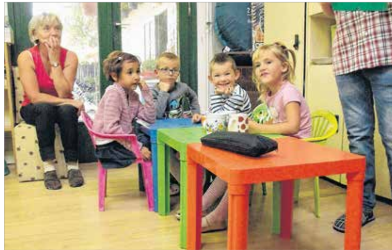
A legkisebbek is jól érzik magukat második otthonukban

Mindazt igyekszünk megadni a gyerekeknek, amit alapesetben a család adna. Nem helyettesíteni akarjuk a szülőket, csak szeretnénk a hónapok alatt nyúlni és bizonyos funkciókat átvenni a gyermekevelésben, annak érdekében, hogy a család egyéb területeken meg tudjon erősödni. Például hogy túlorát vagy éppen munkahelyet tudjon vállalni a szülő. Azt hiszem, mindent, amit otthon az iskolát és óvodát követően délutántól estig megkap a gyermek, azt mi is meg tudjuk