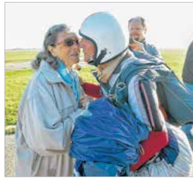
Ötvenhét év óta együtt