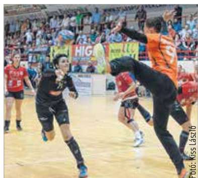
Hiába a második félidő jó játék, csak egy pontot szerzett az FKCs a Kohász ellen

Előbb kis híján, már a meccs első félidőjében elvesztette, majd a másodikban tulajdonképpen már megnyerte a Fehérvár KC a Dunaújváros elleni megyei rangadót. Végül azonban hathatós játékezői, és zsúriasztali segédlettel 20-20-as döntetlennel ért véget a találkozó. Az FKCs vezetőedzője érthetően nem volt boldog a lefújást követően, igaz, akkor még igazságosnak találta a két ellentétes félidőt hozó mérkőzésen a döntetlent. Az utolsó percekben történeteket visszanezve azonban már más állásponton volt: „Ötvenkét másodperccel a vége előtt, 20-19-es állásnál az Újváros támadott, és