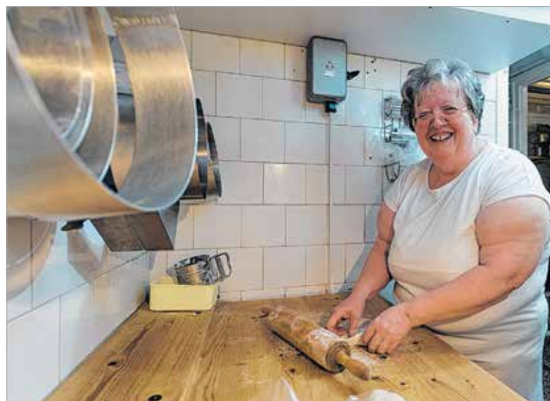
Mosolyogva könnyebben megy a munka

„Nem vagyunk rendetlenek! Nem hagyjuk kint véletlenül a táblát. De