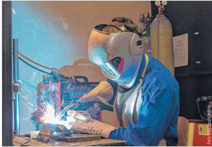
Az új OKJ jobban megfelel a munkaerőpiaci igényeknek

Ez a gyakorlatban azt jelenti, hogy huszonöt éves kor előtt a szokásos reggel nyolctól délutánig tartó órarendben lehet a szakmát elsajátítani. Ha valaki ennél idősebb, akkor az esti vagy a levelező tagozat közül választhat. Ha a kiválasztott képzés mindkét munkarendben indul, akkor érdemes estire járni. A magyarázat nagyon egyszerű. Az OKJ-s tanfolyamon tanuló diákok diákigazolványt kapnak, de a levelezősök kevesebb utazási kedvezményben részesülnek. Ha valakinek olyan a munkarendje, élethelyzete, hogy nem minden órán tud megjelenni, célszerű az egyéb képzési formák, például a távoktatás után érdeklődni.