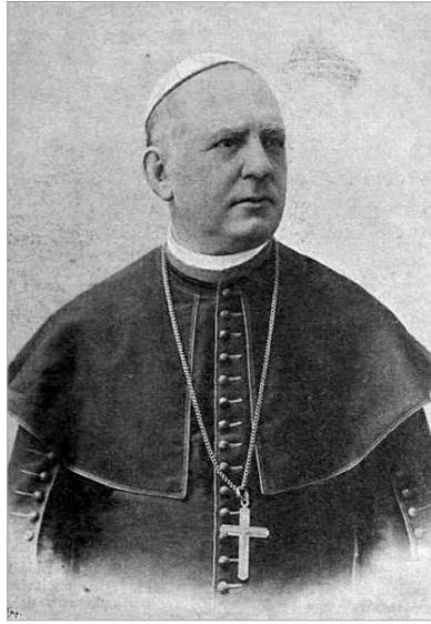
Steiner Fülöp 1890-es székfoglalásától egészen 1900-ban bekövetkezett haláláig volt Székesfehérvár megyéspüspöke

A média evangelizációs lehetőségét felismerve Steiner Fülöp volt az, aki a Szent István Társulat alelnökeként szorgalmazta, hogy jelentessenek meg kis, füzetszerű hitvédelmi kiadványokat, melyek a hívek hitéletét segítették. Ugyancsak a Szent István Társulat kiadásában jelent meg a Katolikus Szemle című nívós folyóirat, amit kifejezetten szaksajtónak szántak. Mózessy Gergely egyháztörténész szerint ez akkoriban olyan nyitáshoz számított, amire szükség volt, hiszen olyan kort élünk a 19. század utolsó évtizedeiben, amikor a társadalom berendezkedése egyre inkább liberális irányt vesz. „Az 1890-es évek politikájában