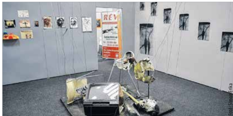
A tárlat 130 négyzetméteren virtuális effektetek, különleges fények és titkos ajtók segítségével mutatja be a hazai drogfogyasztás problémáját

A szervezők tizenöt fős csoportok jelentkezését várják folyamatosan a kef@szekesfehervar.hu e-mail címen vagy a 70 984 8618-as telefonszámon a szervezők.