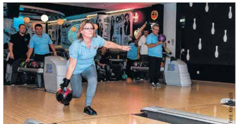
Már a bowlingnak is van városi bajnoksága Székesfehérváron. A sportágot kedvelő amatőrök első fordulóját szerda este rendezték, a továbbiakban hetente kétszer játsszák majd meccseiket a bajnokságban.