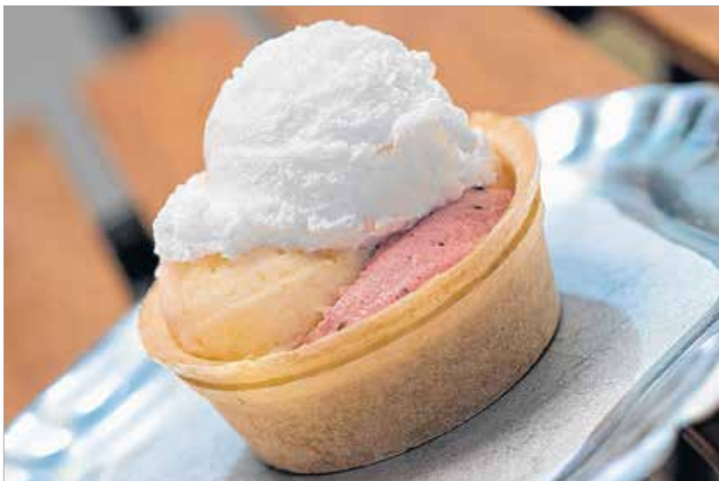
Nincs olyan fagyalt, amit Teréz ne szeretne

„Ez egy egészséges fagy, mert nincs benne semmi mesterséges. Szerintem ha nem ilyet árulnék, az üzlet ezen a helyen meghalna. Kell valami plusz, amiért a vendég idejön. Van például olyan kuncsaftom, aki még diákként szokott rá a fagyinkra. Azóta elkerült Zamárdiba, de ha megy Pestre a sztrádan, mindig beugrik két gombócra. Egy