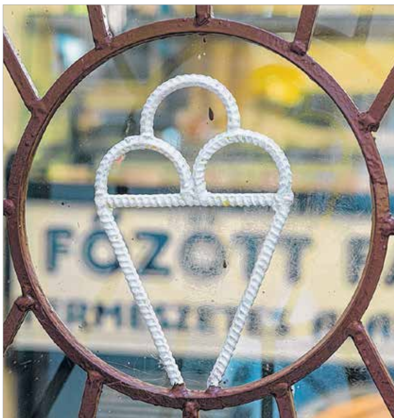
Nosztalgiarács a nyolcvanas évekből

„A fagyink legalább olyan híres volt, mint a Viniczaié. Nyáron nem tartottunk süteményt! Akkoriban sokkal olcsóbb volt egy gombóc, mint most, így jóval több is fogyott. Előfordult, hogy nem tudtunk annyi tejes fagyit tartani, mert a hiánygazdaságban egyszerűen nem lehetett. Volt, hogy nálunk csak vaníliát meg gyümölcsöket lehetett kapni. Az emberek ilyenkor gyorsan átszaladtak a Vörös Hadsereg