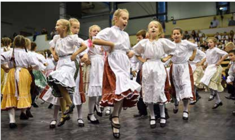
Naphívogató, kapuzó, megtisztulást jelképező harmatszedeő táncjáték a Kodály Iskola gyermekeivel

nak. Az ő visszaemlékezéseik szerint ez nagymértékben köszönhető az ott elsajátított zenei tudásnak is. A szellem kibontakozását, a kreativitás erősödését segíti az ének- és zeneoktatás, a zenével való mindennapos együttélés.”