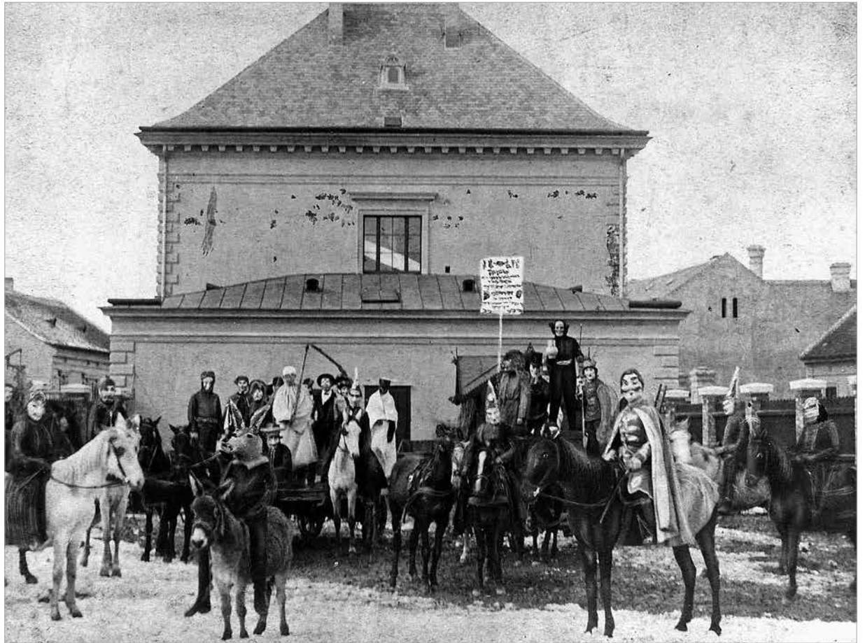
Húshagyókeddi alakoskodó felvonulás, rendezték a tűzoltók. Székesfehérvár, 1900 körül

fiúk párosával vagy hárman-négyen kenderkőcből ragasztott bajusszal, szakállal, bekent arccal, láncot csörgetve járták az utcákat, házakat, ijesztgették a kisebb gyerekeket.