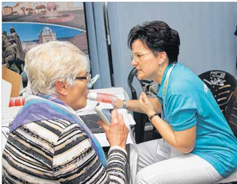
A kórház dolgozója a szakma iránti elhivatottságukról tettek tanúbizonyságot a Szívügyünk Fehérvár programon, hiszen órákon át, önként vállalva vizsgálták meg sok száz embert

szer megbetegedéseinek szűrése mellett a daganatos betegségek szűk körének szűrései valamint a mozgásszervi betegségek szűrései is helyet kaptak a rendezvényen. Az önkormányzat nem fenntartója a megyei kórháznak, de mint a polgármester mondta, a prevencióra nagy hangsúlyt fektetnek. Cser-Palkovics András elmondta: rendszerek a városrészi szűrővizsgálatok, és a Szívügyünk Fehérvár programot is harmadik alkalommal hívták életre. A sportcsarnokba látogatókat Vargha Tamás és Törő Gábor országgyűlési képviselők köszöntötték. A szűrőnaphoz egy rajzpályázat is kapcsolódott, a legszebb munkák alkotóinak Brájer Éva alpolgármester adta át az okleveleket.