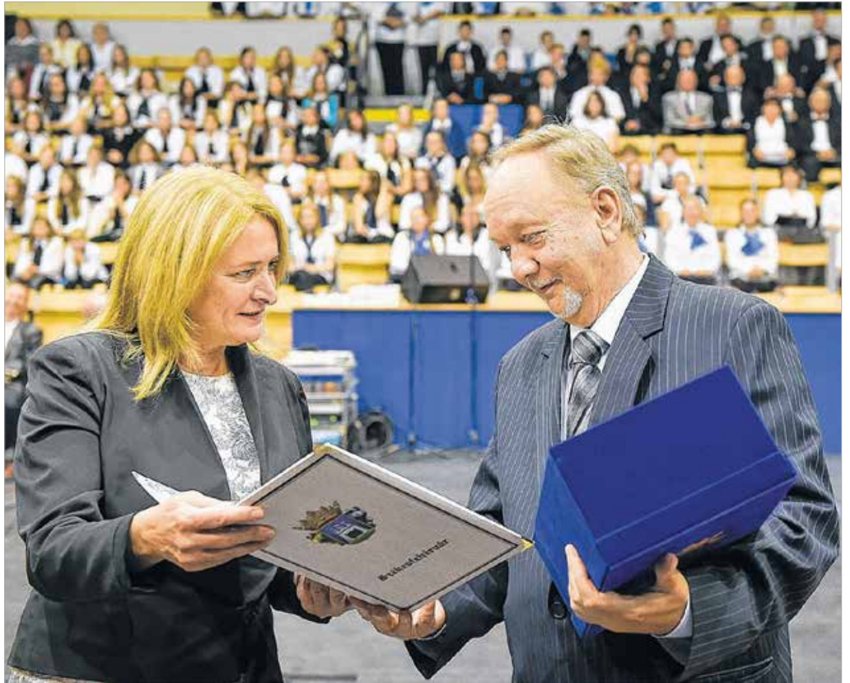
Az idén is jó kezekbe került a Fricsay-díj