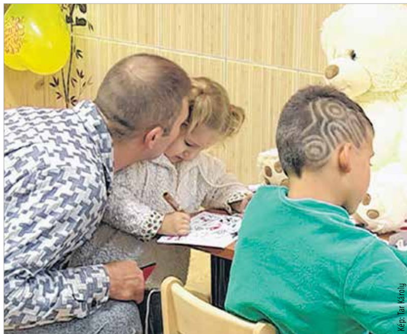
Megújult a beszélőhelyiség. Csak a gyerekek nehegy túlzottan megkedveljék...

Amint átlépi valaki a börtön kapuját, azonnal egy másik, saját szabályrendszerrel működő világba kerül, függetlenül attól, hogy látogatóról, dolgozóról vagy fogvatartottról van szó. A rendszer mindenkit megfoszt valamitől, és ez a megfosztottság a rabokra