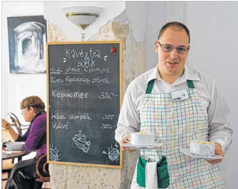
Déli saszé leveses bögrével