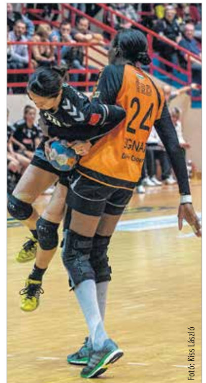
Ekkora különbség azért nem volt az Érd és a Fehérvár között