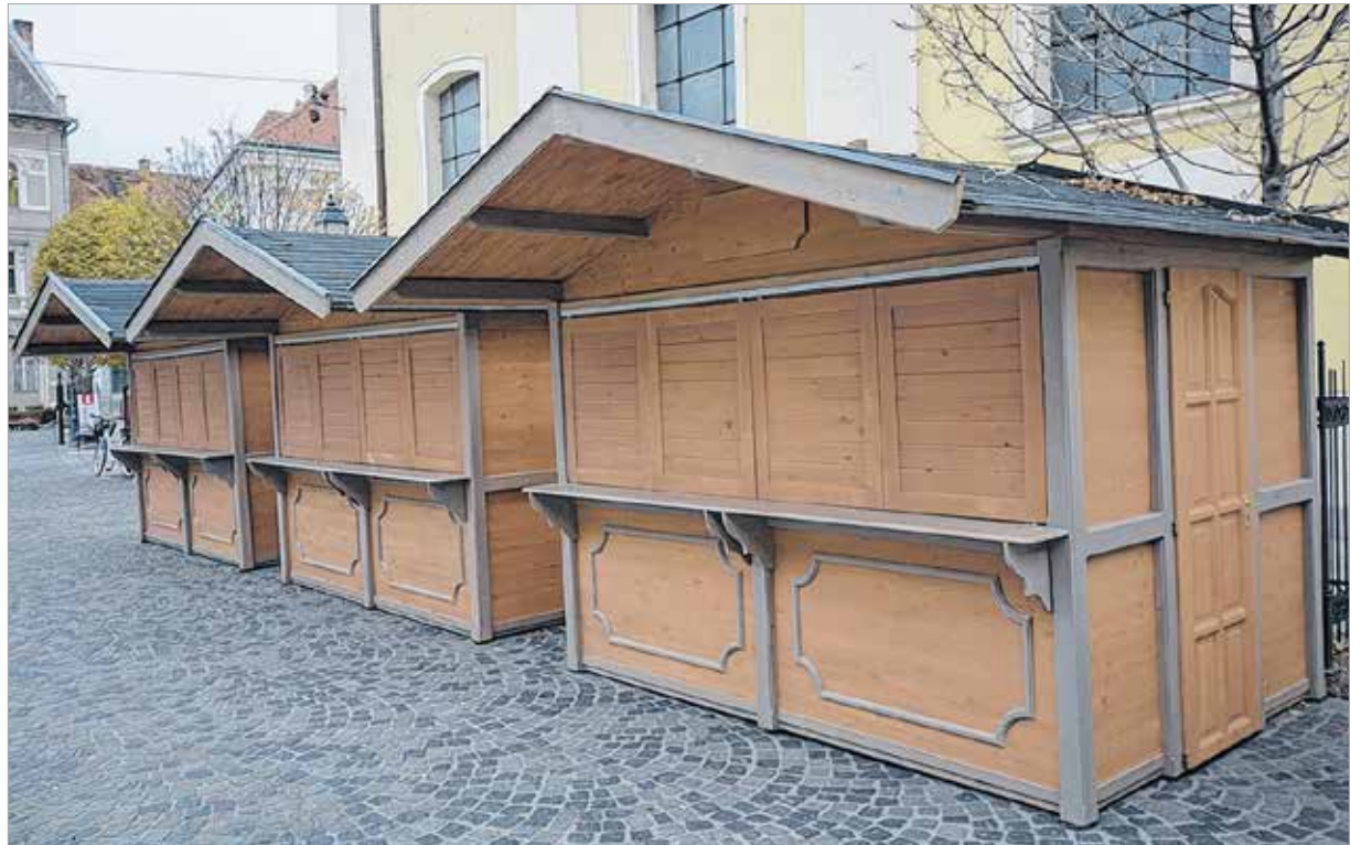
Összesen harminchat új faház készült, háromféle méretben. Az idei adventi vásáron láthatjuk ezeket először a belvárosban.