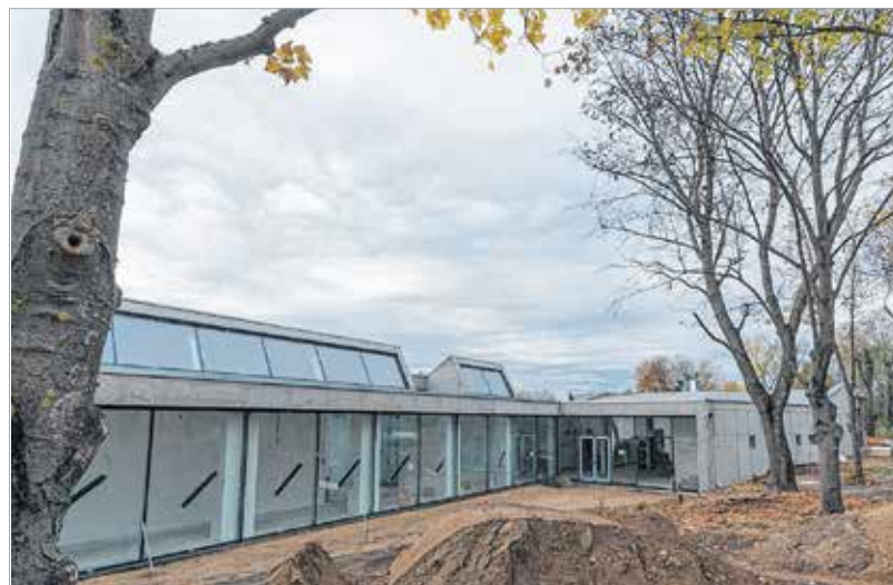
A látogatóközpont tervezése során elsődleges szempont volt, hogy a római korhoz igazodva, de modern köntösbe bújtatva szerves részét képezze majd a tájnak az épület

A meglehetősen rossz állapotban lévő, római kori lakóház mintájára készült U alakú épületet szintén felújították. Szinte rá sem lehet ismerni! Az épületben részben az eredeti funkciót betöltő helyiségeket – irodák, raktárak – alakítottak ki, másik szárnya pedig látványraktárnak ad majd helyet, ahol a feltárások során előkerült leleteket mutatják be. A kerámiatöredékek, téglák, több mázsás kövek részben a park területén lesznek láthatóak, hiszen a projekt részeként a Zichy