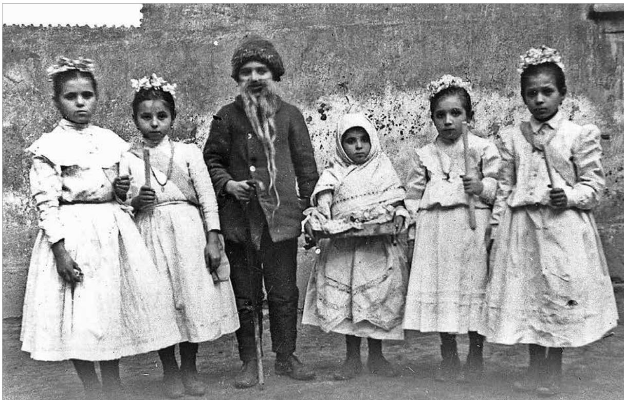
Betlehemezők, a székesfehérvári bölcsőcske szereplői, 1913

Köszöntésükért néhol pár fillért kaptak, máshol elzavarták őket. A Luca-napi szokásokkal többek között a baromfitartás hasznát igyekeztek biztosítani. A régi századfordulón Luca-nap reggelén még az ölben füstös bottal, piszkafával vagy söprűnyéllel meglucázták, megpiszkálták a tyúkokat. Közben ezt mondták: „Nekünk sokat tojzatok, a szomszédnak kotlajatok!” Akadtak, akik hasonló célból söprűvel cirógatták meg a tyúkokat. Karácsony előtti hetekben a betlehemező csoportok, karácsony este vagy újévkor köszöntő, adománygyűjtő pásztorok jártak házról házra. Felsővárosban aprószentek napján a legények fűzfavesszőből font korbáccsal megvirgácsoltak mindenkit, de főleg az eladósorban lévő lányokat. Közben ezt mondták: Egészséges légy, keléses ne légy, Jövő évben még frissebb légy! Ha valamelyik lányt nagyon megütötték, azt dióval, almával engesztelték ki. A lányok között ilyenkor ez a mondás járta: aki a legtöbbet vert rájuk, az lesz a kérőjük. Aprószentek napja után a korbácsot elégették, mert azt tartották róla, hogy bajt, kelést okoz. A karácsonyi ünnepkör utolsó napján, vízkeresztkor Székesfehérvár-Felsővárosban és Palotavárosban is az 1920-as években még 13-14 éves fiúk jártak a kiugratható csillaggal háromkirályok képében köszönteni.