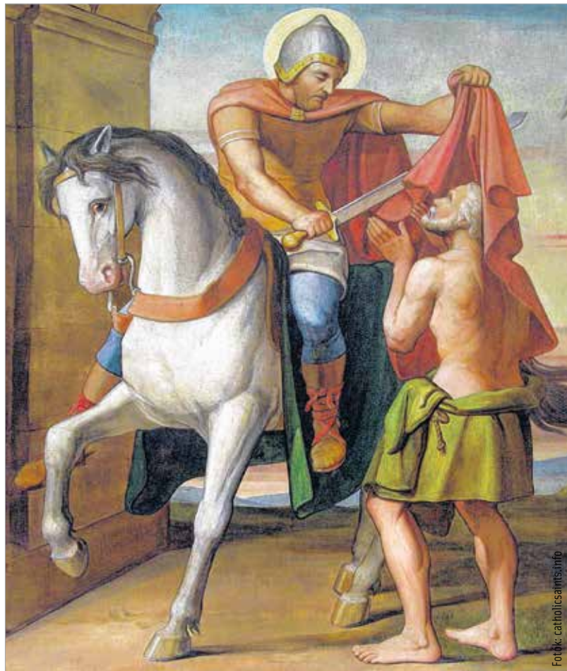
A koldusnak ajándékozta fél köpenyét

Márton később Itáliába ment. Milánóban nem látták szívesen, ezért a remetéseget választotta. A kopár Tyúk-szigeten egy másik paptársával együtt teljesen magába fordult. Sokat imádkozott, folyamatosan bűnbánatot gyakorolt. Ebben a magányban jutott el hozzá a hír, hogy a közben szintúgy elüldözött Hilárius is visszatért Poitiers-be. Egy percig sem tévovázott, útra kelt. A Poitiers-től két kilométerre lévő Ligugében remeteközösséget hozott létre, ahol a papjelölteket és a keresztény hitre készülöket tanította. Ekkor vette fel a papi címet is. Közben sokat utazott, új egyházközségeket létesített, amelyek később egyházi központokká váltak.