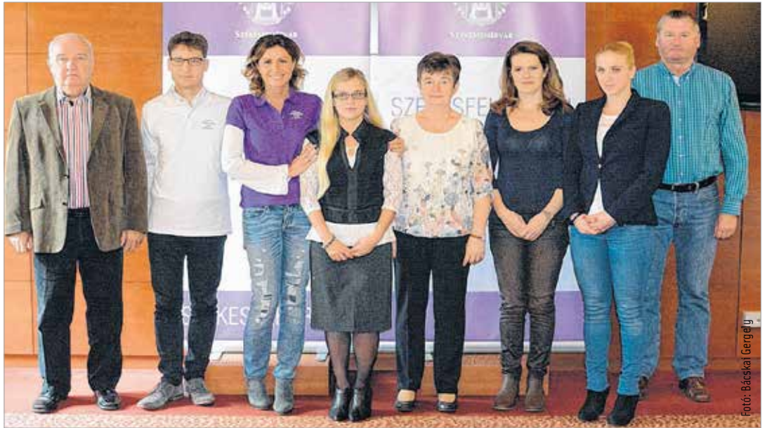
A szervezők és a jótekonysági futás „címzettjei” a sajtótájékoztatón