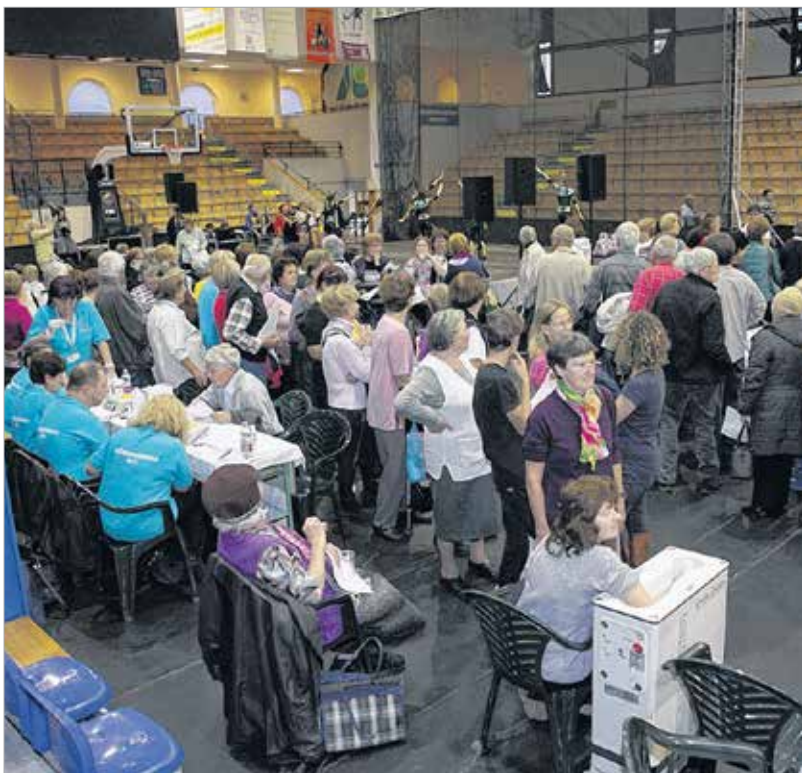
Szinte zsúfolásig megtelt a Vodafone Sportcsarnok