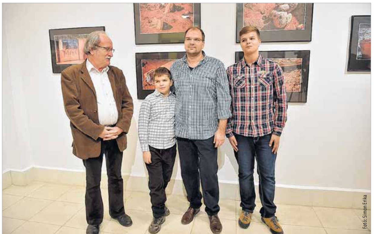
Az öt esztendővel ezelőtti eseményekkel kapcsolatban még ma is vannak megválaszolatlan kérdések

dokumentációs képsorozat, amely más látószögéből és nézőpontból mutatja meg a katasztrófa utóéletét.” Molnár Artúr Vörös október című kiállítása november 29-ig tekinthető meg a Szabadművelődés Házában.