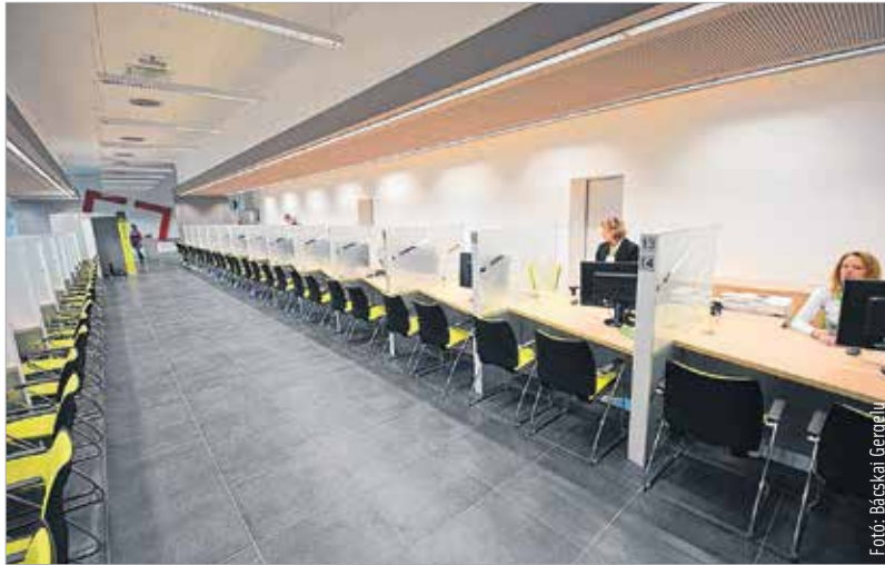
A kormányablakban négyszáztizenkét hatósági ügytípus intézhető

„Itt, az ország egyik legnagyobb, második generációs kormányablakában méltó körülmények között fogadhatjuk