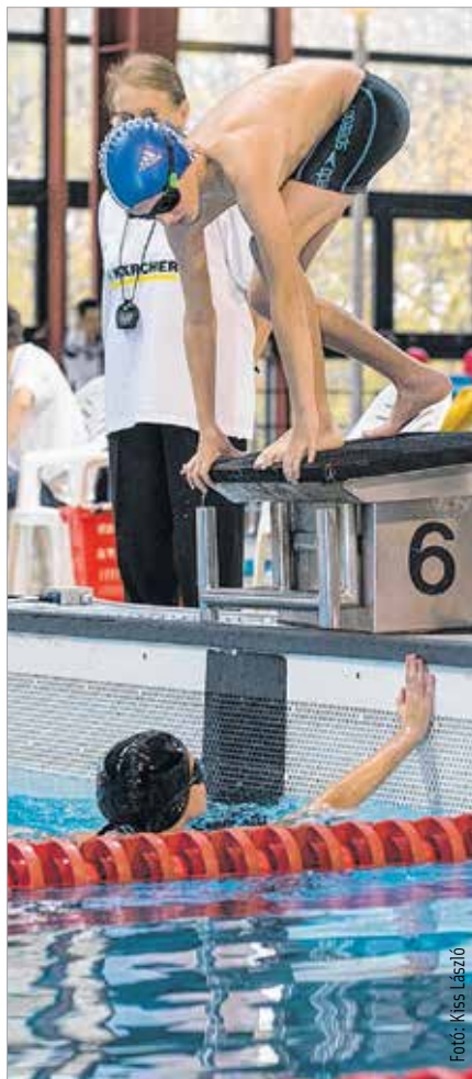
A rajt előtti feszültség ugyanolyan, mint a nagyoknál

A városi versenyen a legjobbak közé kerülő gyermekek a megyei fináléba jutottak, az ott kiválóan szereplők pedig az országos döntőben úszhatnak majd a dobogós helyezésekért.