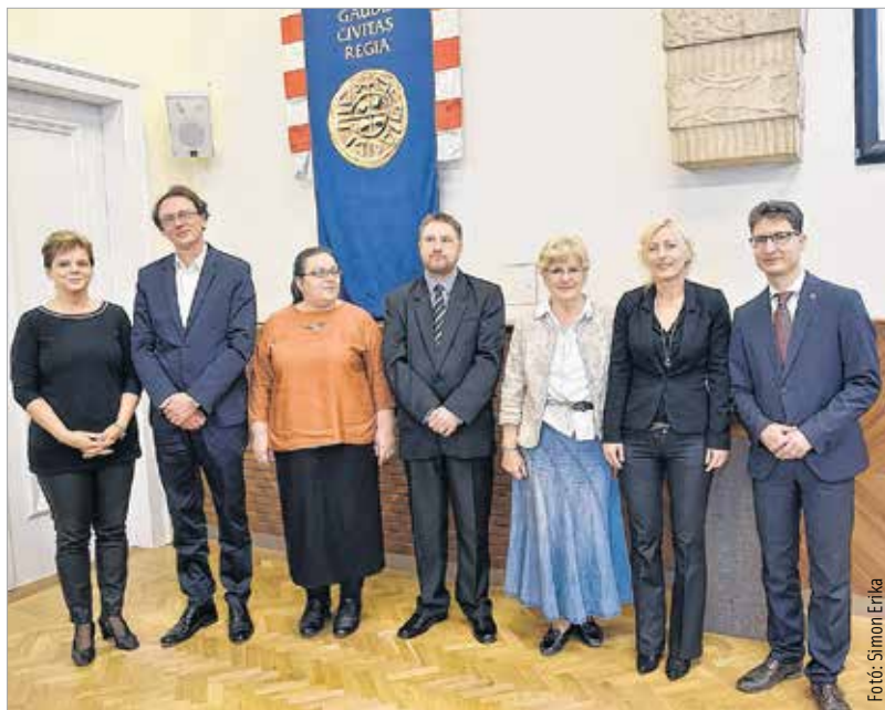
A 2022-ig tartó program igaz áttörést jelent városunk kulturális életének megismerésében