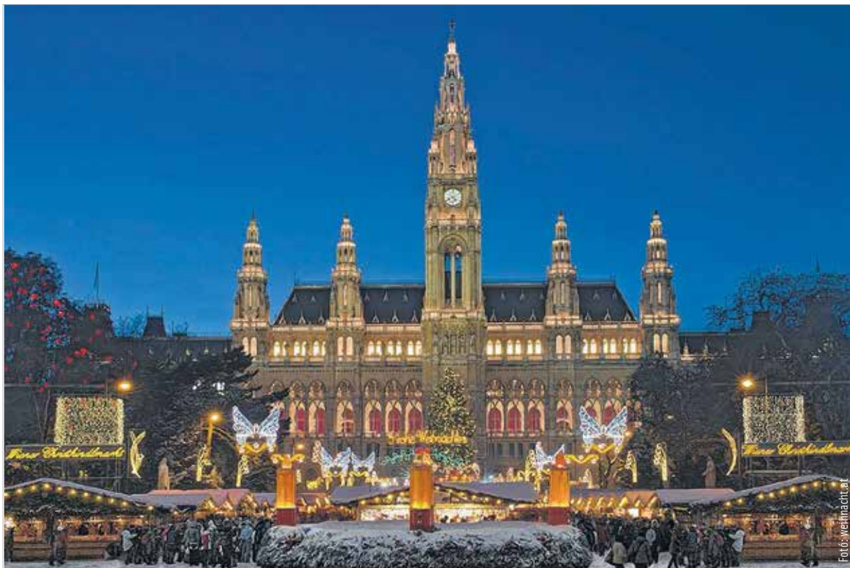
A Christkindlmarktra minden évben több millió látogatót várnak

A gyerekek fűtött faházban sajátíthatják el a gyertyaöntést, a mézeskalácssütést,