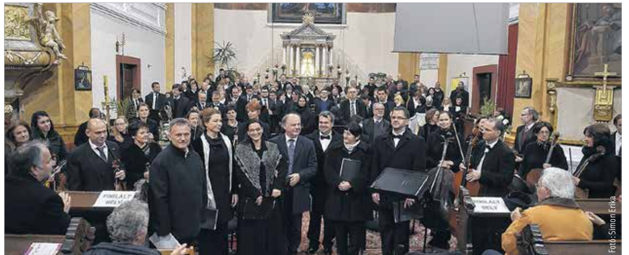
Méltó helyszínen, nagyszerű előadókkal mutatták be – hazánkban először – Suppé gyászmiséjét