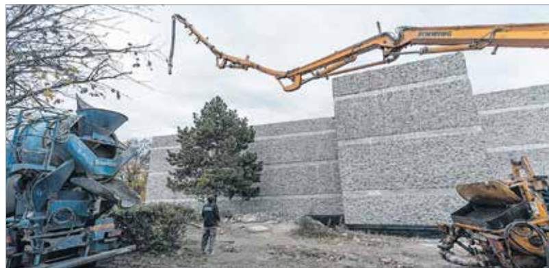
A munkálatok még folynak

Gorsium eredeti városfalának nyomvonalán tíz méter magas kilátó épül, ahová ha felmegy a látogató, egész Gorsiumot belátja. A színház háttéréül szolgáló erődfal egy szakaszát a hozzá kapcsolódó két oldal- illetve saroktoronnyal műemléki rekonstrukció keretében mutatják be. A falfelülethez 972 köbméter betont használtak fel, háromezer négyzetméter a kőfelület. Az erődfal tíz méter magas, maga az „L” alak kétszer hatvan méter, és van három bástya. A fal és a tornyok teteje funkcionál majd kilátóként is, innen tekinthetik át a régészeti park egész területét a látogatók.