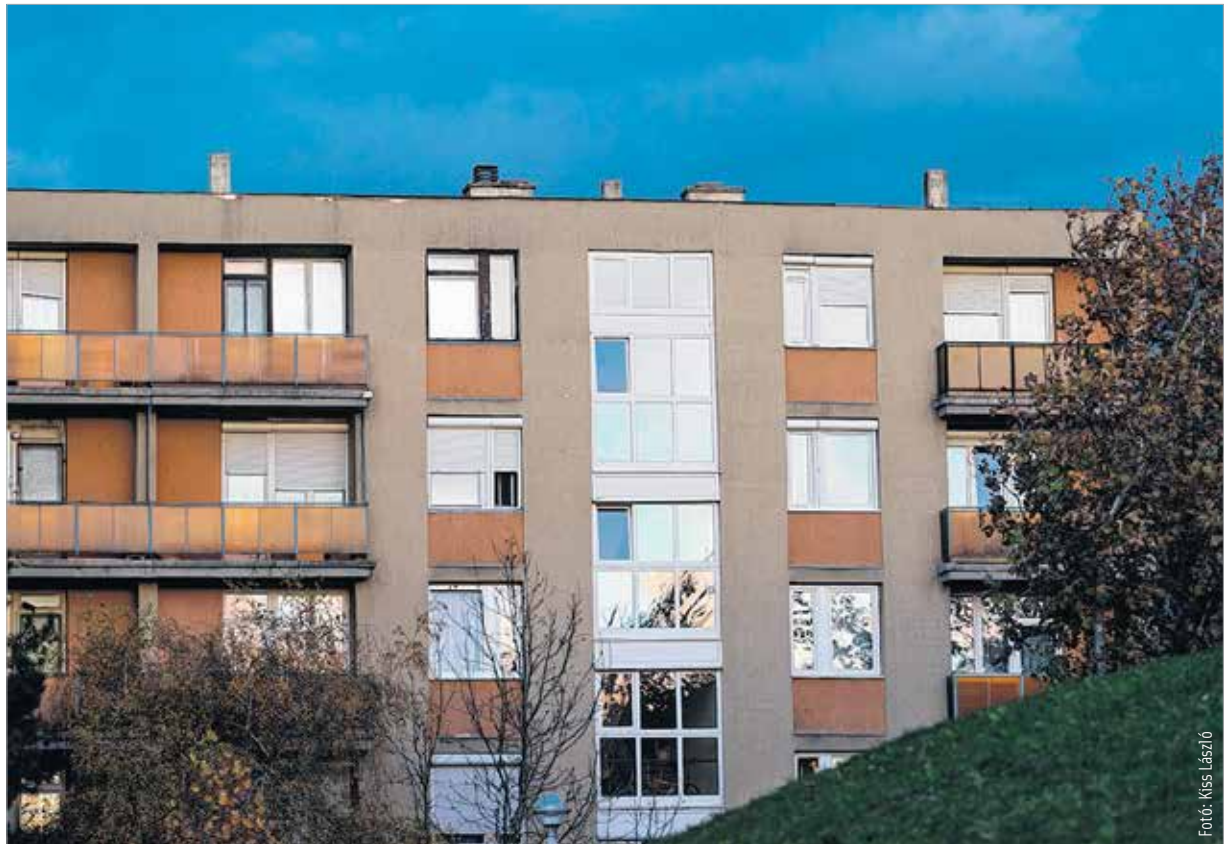
A panellakások ára is milliókat emelkedett

A paneloknál is hasonló a helyzet. Év elején nyolc- kilenc