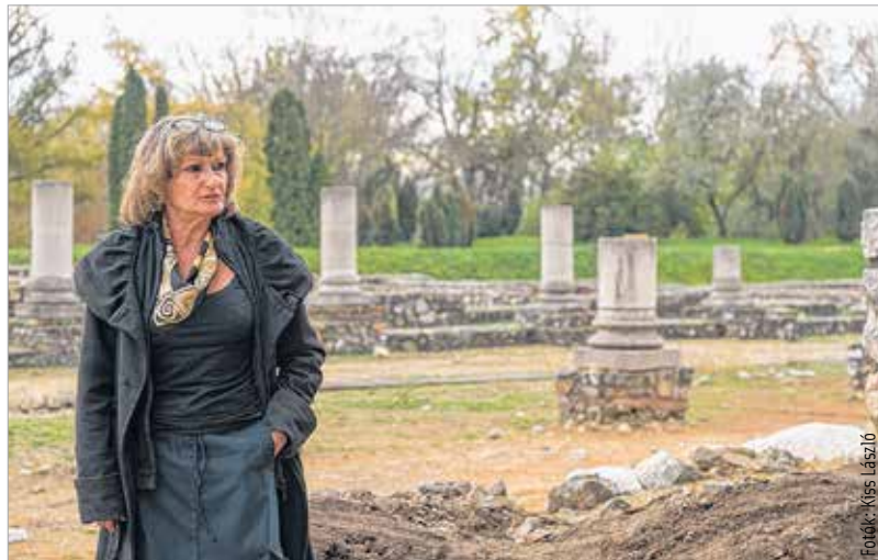
Célegyenesben a Gorsium Régészeti Park felújítása