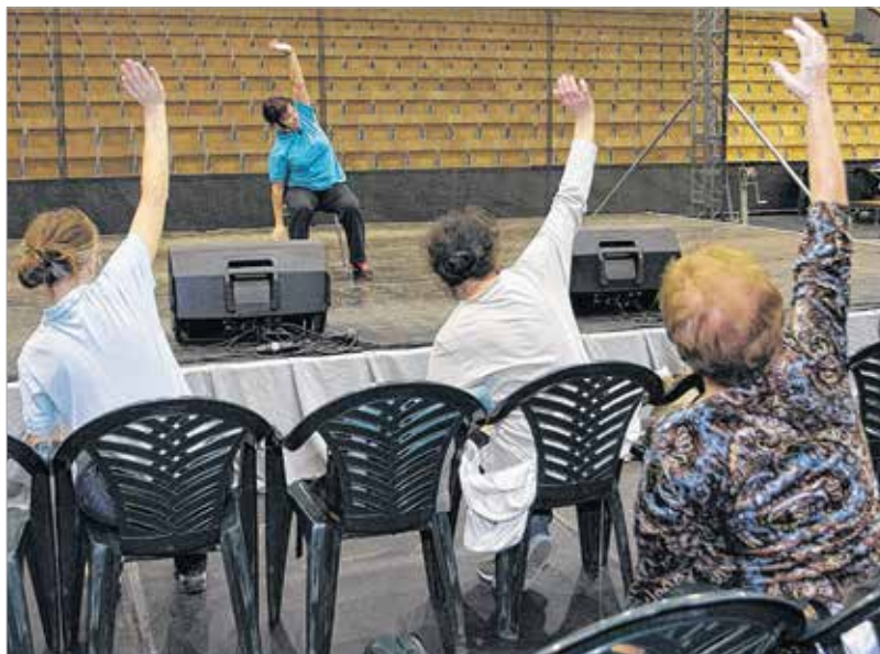
A szűrővizsgálatok mellett a gyógytornát is kipróbálhatták az érdeklődők