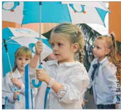
Az óvónők és a gyermekek színes műsorral készültek az évforduló alkalmából

A Videoton 1975-ben építette a modern, különleges alaprajzú, kétszer nyolc csoport befogadására alkalmas óvodakomplexumot, aminek nyitvatartása az üzemen dolgozók munkaidejéhez igazodott. A kilencvenes években a gyár átadta a komplexumot az önkormányzatnak, ami a későbbiek folyamán két különálló intézményként működött tovább: Pozsonyi Úti Óvoda és Gyöngyvirág Óvoda. A kilencvenes évek végén az Egészségesebb Óvodák Nemzeti Hálózatának bázisintézménye lett a létesítmény, majd a Pozsonyi úti Óvodában autista gyerekek gondozásába kezdtek. Később létrejött két német nemzetiségi csoport, illetve az intézmény megkapta a Madárbarát és a Zöld Óvoda címet is. 2011-ben összevonásra került a Pozsonyi úti Óvoda és a Gyöngyvirág Óvoda, így Székesfehérvár legnagyobb óvodája lett Gyöngyvirág Óvoda-Kindergarten Maiglöckchen néven. Jelenleg tizenöt csoporttal működnek, köztük egy autista csoport és két német nemzetiségi csoport.