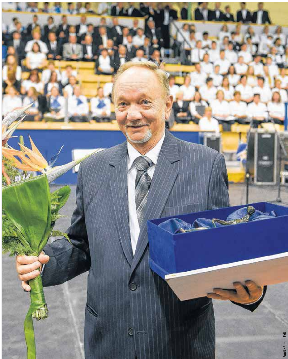
Bódi Árpád ma is példakép

embertől! Számunkra természetes volt, hogy a színpadon úgy jelenjünk meg, hogy azzal megadjuk a tiszteletet a zenének és a hallgatóságnak is.