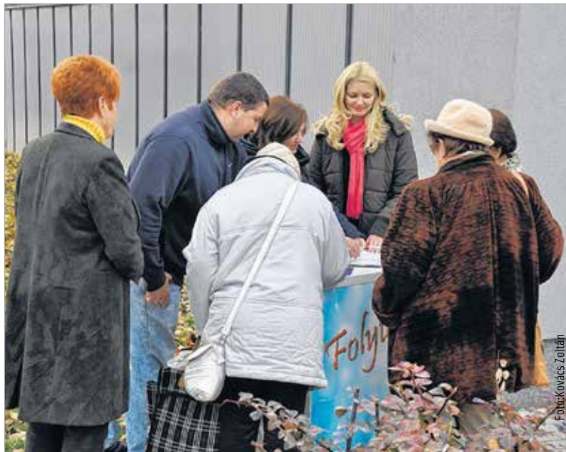
A város több pontján gyűjtik az aláírásokat

Törvényjavaslatot nyújt be a Fidesz a Parlamentnek a kötelező betelepítési kvóta ellen. Az előterjesztés arra kötelezné a kormányt, hogy forduljon az Európai Unió bíróságához, és kezdeményezze a letelepítésről szóló uniós jogszabály megsemmisítését – közölte Gulyás Gergely, a kormánypárt frakcióvezető-helyettese Budapesten. A törvényjavaslatról legkésőbb december elején szavaz az Országgyűlés.