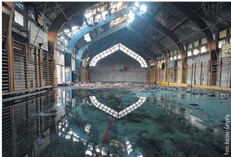
Ennyi maradt a tűzoltás után a tornateremből