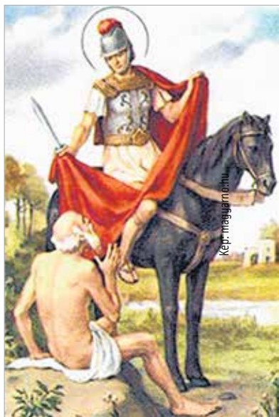
Szent Márton az irgalmasság példaképe

A Szűzanya után Márton volt az első nem vértanú szent, aki éppen ezerhétszázadik éve látta meg a napvilágot Pannóniában. Irgalmasságával már életében belopta magát a nép szívébe, amely „úgy fogadta emlékezetébe, mint az irgalmas szamaritánust, aki a koldusnak utolsó ruhadarabját is odaadta, és mint a jó pásztor ragyogó példáját, aki a szeretetet tette életének vezérlő elvévé.” – fogalmaz a püspökök körlevele. Az irgalmasságra, az együttérzésre ma különösen nagy szükség van, hiszen ez az egyetlen keresztény válasz lehetséges a társadalmi nehézségekre. „A mai szociális nehézségek láttán Szent Mártont állíthatjuk sokak szeme elé a felebaráti szeretet példaképeként és a békeesség hatékony képviselőjeként.” A püspöki konferencia szerint életpéldája a nem hívők számára is vonzó: „Bár a világméretű szegénység orvoslására ma komplex gazdasági terveket kell készíteni, mégis nyilvánvaló, hogy az egyéni, személyes szeretet jótéteményeire, az