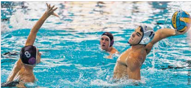
Dobogós helyen állnak a Fehérvár Póló SE csapatai az OB I-ben

Az egyesületnél nagy hangsúlyt fektetnek a toborzásra is. Csütörtökön elindul a Sulipóló elnevezésű sorozat, ahová illusztris vendéget várnak a szervezők: Fodor Rajmund kétszeres olimpiai bajnok vízilabdázótól vehetik majd át a gyerkőcök az érmeiket, kupákat.