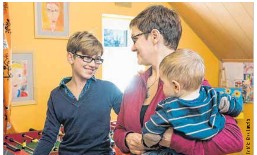
A család is segít: anya a hátszág