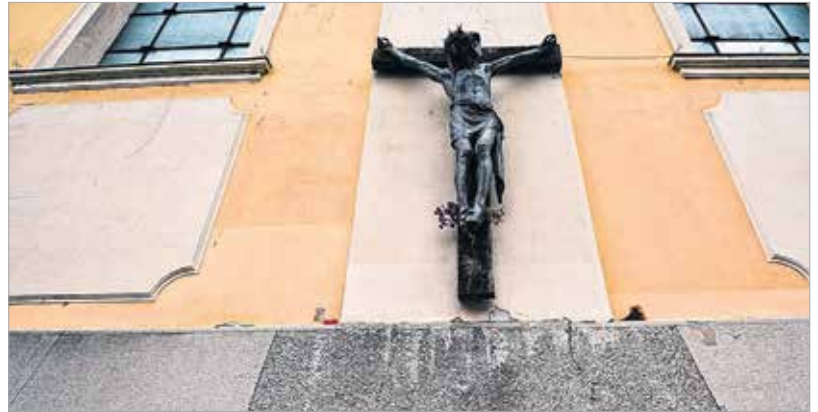
Közösen imádkoztak, majd mécseseket helyeztek el a francia tragédia és a világban történt terrortámadások áldozatainak emlékére

A megemlékezést Vargha Tamás honvédelmi államtitkár, Székesfehérvár országgyűlési képviselője kezdeményezte, aki a nemzeti gyásznapról és az áldozatok családjaikat ért veszteségekről beszélt. Mint mondta: egy nehéz hét után elindultak egy koncertre, a nemzeti válogatott mérkőzésére vagy éppen beültek ismerőseikkel egy étterembe – és már soha nem érnek