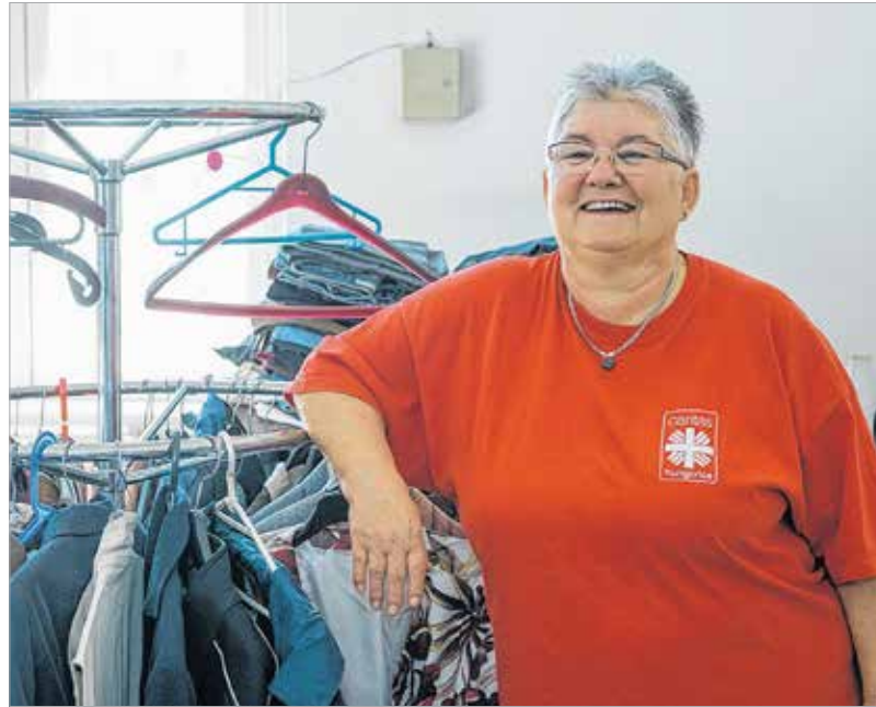
Délelőtt a karitászboltjában: folyamatosan érkeznek a ruhák. A jobb darabok kedvezményesen áron megvehető, a befolyt összeggel a rászorulókat támogatják.

a lehetőséggel, azt a kiégés nem veszélyezteti, mert jól tud mértéket és irányzékot venni. Mindig örültem, hogy a munkánkban erre