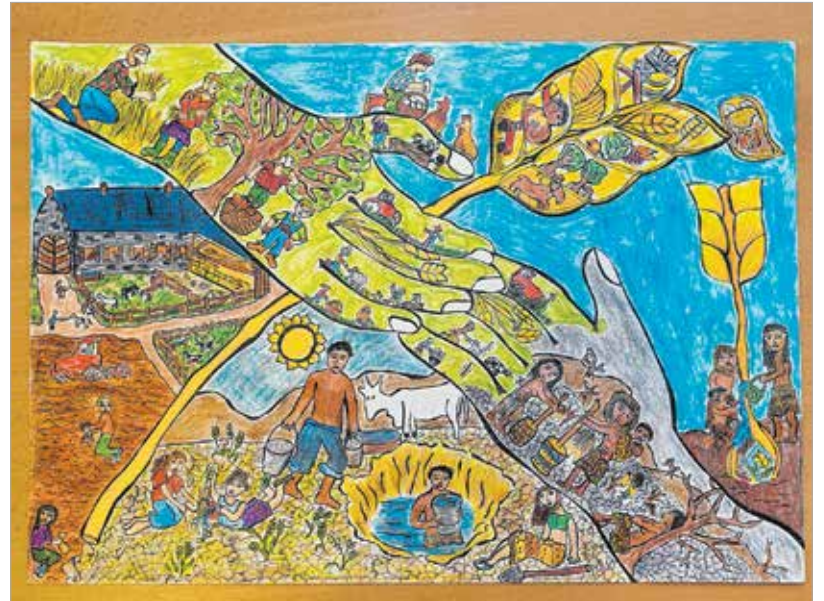
A díjnyertes pályamű A segítő kezek címet viseli

„Már egészen kiskorában is rajzolt, mivel azonban ő az első gyermekünk, nem tűnt fel azonnal, hogy az átlagnál ügyesebb. A nagymama testvére hívta fel a figyelmünket rá, hogy érdemes lenne rajzpályázaton is indítani, mert szerinte a lányunk tehetséges.” – tudtuk meg anyukájától.