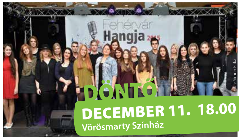
Az elődöntős csapat