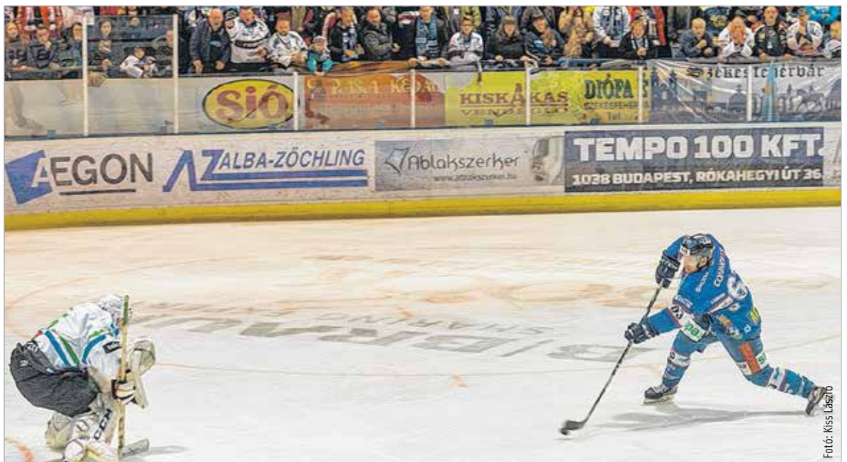
Ami nem változott: telt ház a jégcsarnokban. Ami igen: több gólt lő a Volán.