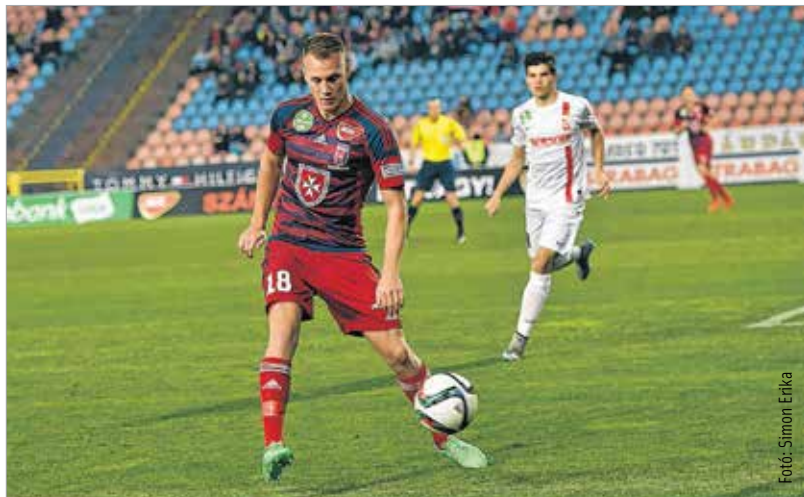
A Videotonban is stabil teljesítményt nyújt a válogatott védő

„Nagyon nagy sikert értünk el, hiszen több évtizedes várakozás előzte meg a kijutásunkat. Lassan fel is fogjuk, hogy milyen nagy dolog volt véghez, és készülhetünk a franciaországi Európa-bajnokságra. De meglepetésnek mégsem éreztem. Az összetartásokon és a meccseken korábban is ott voltam, láttam, hogy ez egy egységes, jó társaság. Főleg ez vezetett a sikerhez. Ez