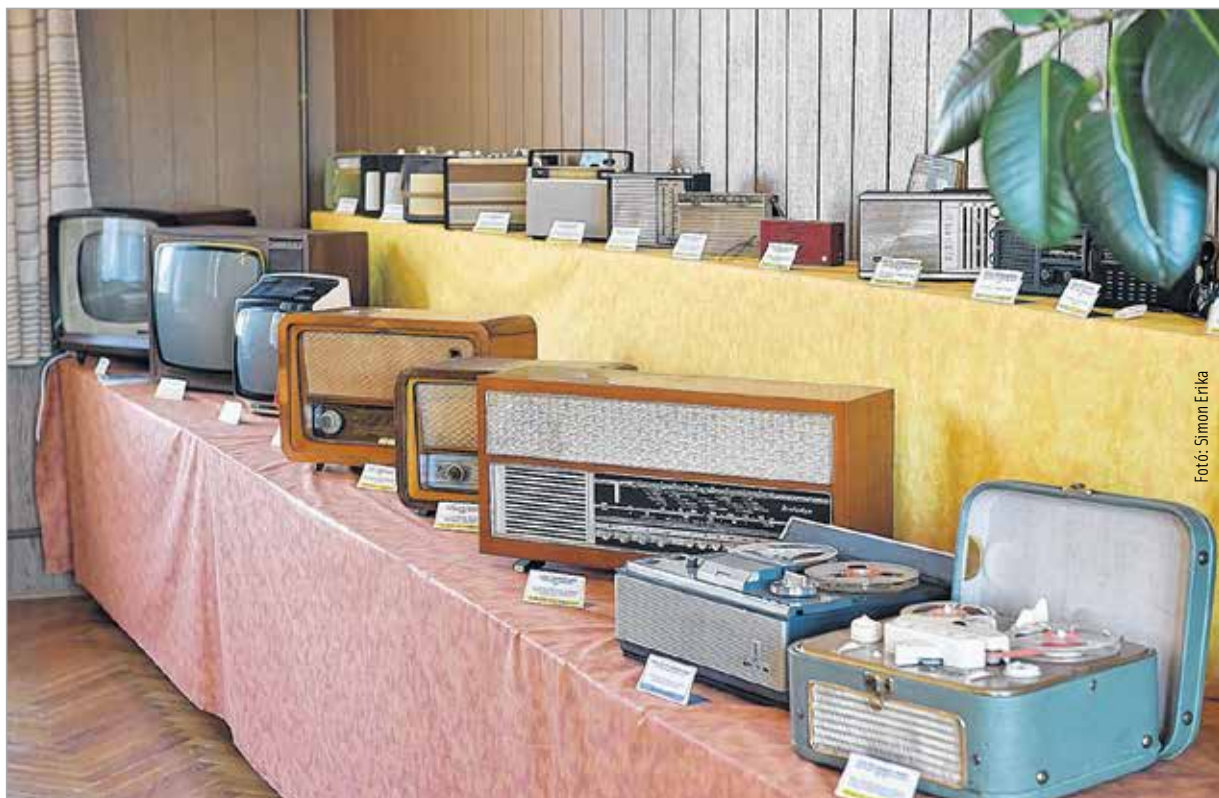
A technikai eszközök fejlődése szembeűnő, de már akkor is státusszimbólum volt egy-egy tárgy

Ezen a kiállításon a retró nem rózsaszín cukormáz szirupos volt, hanem a múltat tisztelő jelen. A kiállítás december 7-ig látogatható a Gárdonyi Géza Művelődési Házban.