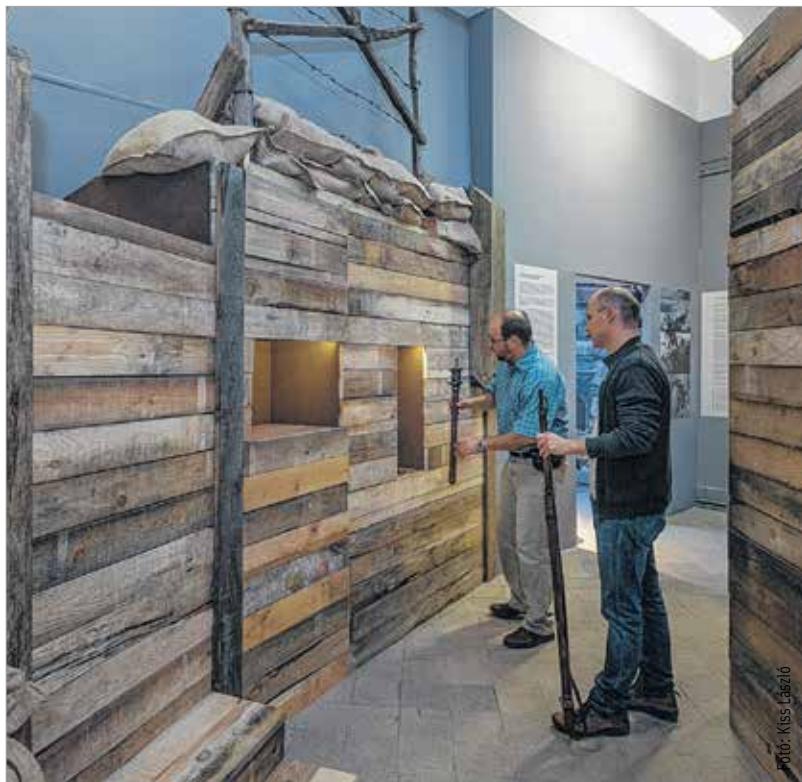
A kiállítás előtt két nappal még „ássák a lövészárkokat”

Székesfehérváron pontosan tudjuk, hogy a viláégésben sokat harcolt 17. honvéd gyalogezred, 17. népfelkelő ezred, 69. királyi gyalogezred és 10. királyi huszárezred városunkban állomásozott, de nem ismertük a katonák front mögötti életét, akik Csíkszentmártontól Doberdóig védték a hazát. Keveset beszéltek arról, milyen emberfeletti erőre volt szükségük az otthonokban maradtaknak, a hadiárvának, hadiözvegyeknek, a frontról hazatért hadirokkantaknak. E borzasztó háború hétköznapi hőseiről emlékezik meg a Szent István Király Múzeum Országzászló téri épületében rendezett különleges kiállítás, melynek megnyitója november 20-án, pénteken 17 órakor lesz. A kiállítás maga is rendkívüli, de a megnyitón olyan meglepetéseket kínál a résztvevőknek, mint a