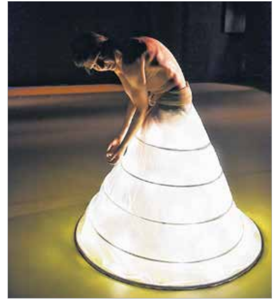
A Hekabé mozgással világít rá az ösztönök működésére és a tiszta érzelmeinkre

teremt sajátos világot. Ebben a térben pedig jól érzékelhetővé válnak az érzések, hangulatok és gondolatok áramlásai. Karakteres támpontot, vezérvonalat ad a rendező, ugyanakkor meghagyja azt a szabadságot a nézőnek, hogy az előadás ritmusát átvéve, annak segítségével mindenki szabadon engedhesse a fantáziáját. S akár az előadás végére megszülethessen mindenkinek a saját „Hekabéja”.