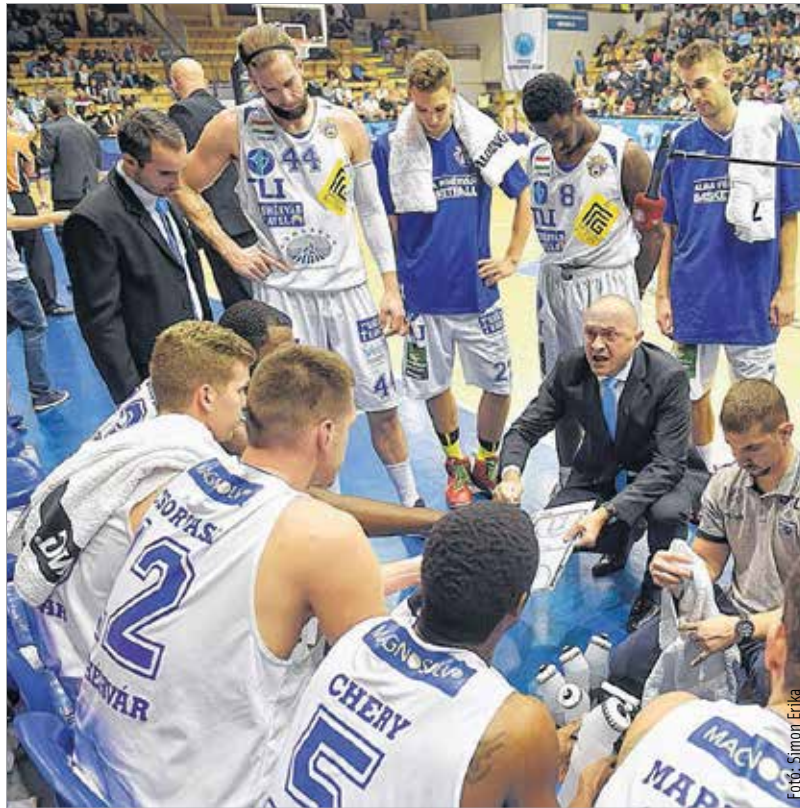
A legutóbbi hat meccsen nyerő volt az Alba taktikája. A Szolnok elleni rangadón ennél is többet kell hoznia a csapatnak a jó sorozat folytatásához.

„Nagyon jó csapat a Sopron, biztos vagyok benne, hogy sok riválisunk elvéri majd az SKC vendégeként. Ezért is tartom rendkívül értékesnek