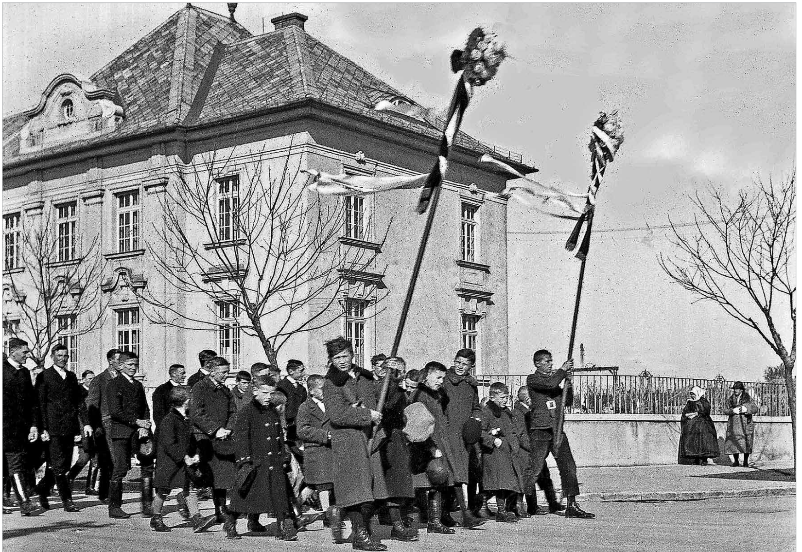
A húsvéthétfői körmenet a Feltámadás temetőbe tart. 1930

netet az első világháború idejéből: „Valami nagy várakozás töltötte el a szíveket. Soha akkora tömeg nem hömpölygött még ünnep másnapján a Sebestyén-városból a Szénaterén át a Csutóra-temető felé, amit Feltámadási temetőnek is neveztek. Koros férfiak és asszonyok ünnepelőben, kimosdott gyerekek, kifésülködött menyecskék és leányok, a hajnali öntözés illatát vonva maguk után, mentek véget nem érő áram-