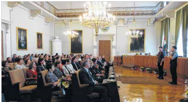
A szociális ágazatban dolgozókat köszöntötték a Megyeházán

Az ágazatban dolgozókról 1997 óta emlékeznek meg szerte a világon. Nem titkolt célja ennek a napnak, hogy a szakterület felhívja a közvélemény figyelmét azokra, akik az elesettekért dolgoznak. Mindazok, akik ezen a területen tevékenykednek, nemcsak munkát végeznek, de szolgálatot is vállalnak a szó legnemesebb értelmében. Ezek a szakemberek sajátos tudás birtokosai, akik a támogatást, segítséget igénylők részére a konkrét, azonnali, olykor nélkülözhetetlen segítségen túl konfliktuskezelő, válságmegoldó technikákat, módszereket is átadják, hogy