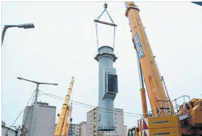
Háromszázhatvan tonna teherbírású daru mozgatta az elemeket

várhatóan semmit sem érzékelnek majd. A kéményt januárban állítják üzembe. A Király sori fűtőtelepen lévő 40 megawattos kazán csatlakozik majd rá, ha elkészül. Közben a Bakony utcában egy új kazánt is üzembe helyeznek, így a régi, Király sori 105 méter magas kémény kapacitását várhatóan teljes mértékben ki lehet majd váltani.