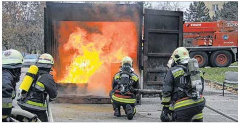
Óriási lánggal égett a karácsonyfa miatt kigyulladt szoba

A tűzoltási bemutatóra nagyon sokan voltak kíváncsiak, a Németh László Általános Iskola diákjai is megnézték, hogyan dolgoznak a szakemberek