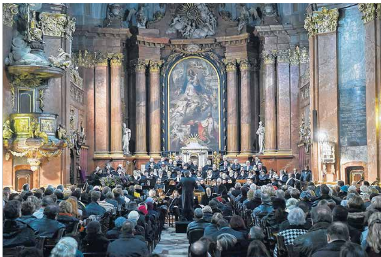
Bach oratóriuma a karácsony örök himnusza

A fejlődéshez jó és rossz kritikákra is szükségünk van. Ha csak azt hallod, milyen csodálatos vagy, akkor megfeledekszel arról, hogy fejleszted magad. Sok jó kritikát kaptam életemben, de meghallom a másik oldalt is. Úgy gondolom, egyiket sem kell a szívünkre venni, mert elbizonytalaníthat. Arra törekszem, hogy megértsem a jogos kritikát. Ha valaki azt mondja nekem, hogy nézd, ez nagyon jó, de ez nem annyira, akkor azt meghallgatom. Úgy vélem, fontos, hogy tisztában legyünk mások