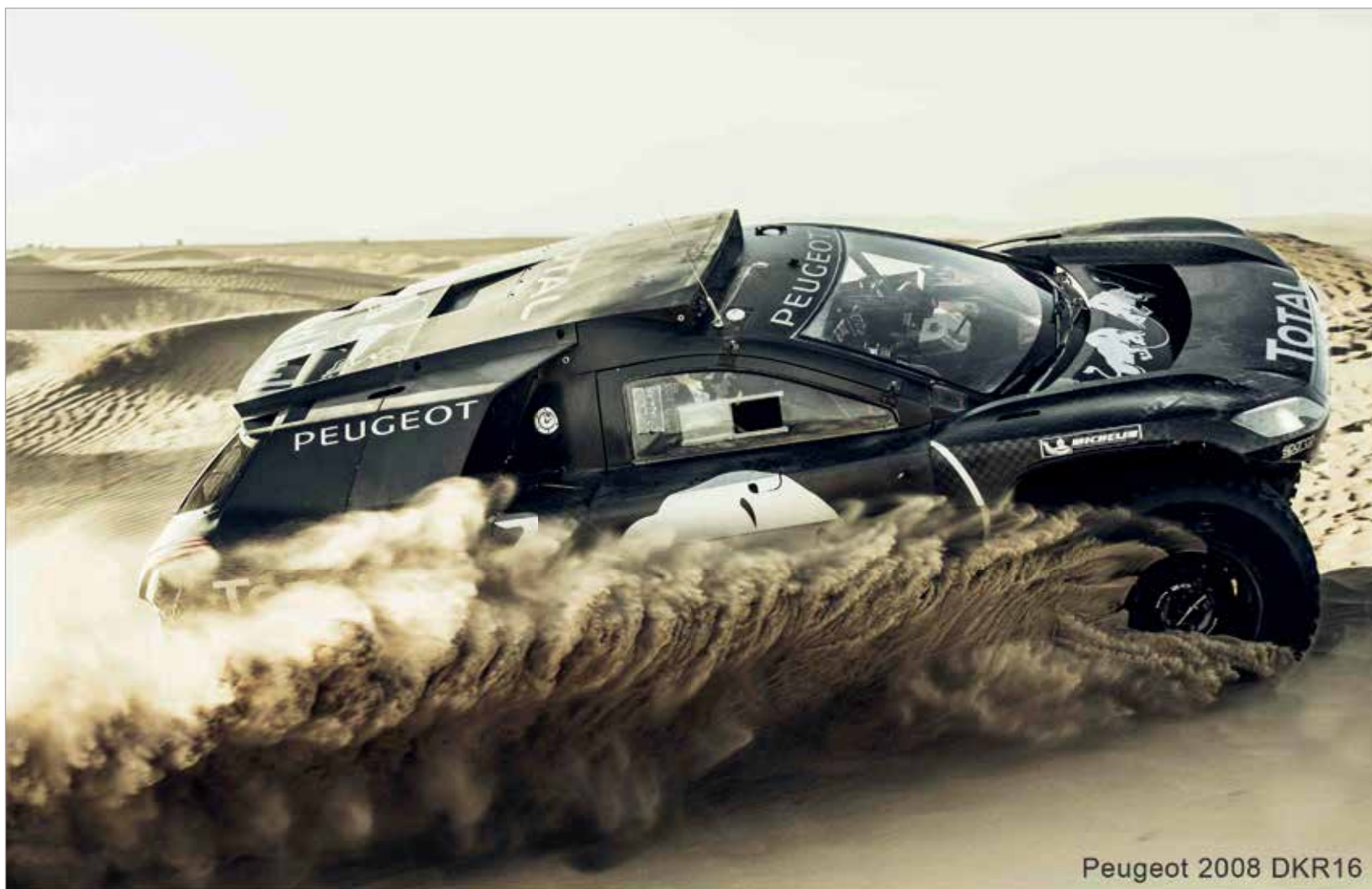
Peugeot 2008 DKR16

Kellemes ünnepeket kíván a Peugeot Fábián Székesfehérvár!