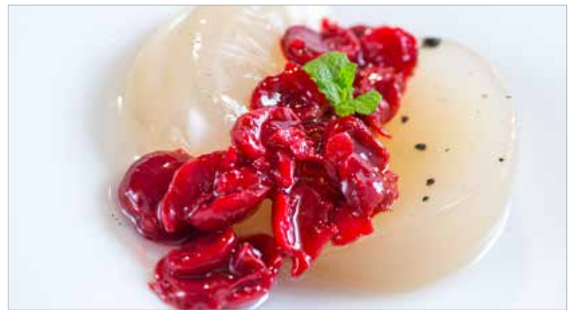
A meggy fanyarsága jól kiemeli a mák és a vanília édességét

edényben lassú tűzön az expressz zselatinnal öt perc alatt csomómentesre keverjük. Fontos: csak melegítjük, nem forraljuk! A végeredményt poharakba töltjük. Hagyjuk kihűlni, majd legalább négy órára, de inkább egész éjszakára hűtőbe tesszük. Végül nekiállhatunk a meggyöntetnek! Ez sem nehéz művelet: a kimagozott meggyet egy lábasban elkezdjük főzni. Eppen csak annyi vizet csurgassunk hozzá, amennyi a gyümölcsöket ellepi. Amikor már rottyog, keverjük el benne az étkezési keményítőt. Pár perc alatt az öntet szépen besűrűsödik. Ízlés szerint lehet ebbe is cukrot tenni, attól függően, milyen a meggy. A panna cottát lehet tányéron vagy pohárban is tálalni. Ha a tányér mellett döntünk, akkor egy kis tálba forró vizet öntünk. Ebbe helyezzük bele óvatosan a poharat. Pár percig állni hagyjuk. Majd egy gyors és laza mozdulattal a poharat a tányérra fordítjuk. A pohár tetejét addig ütögetjük, hogy a panna cotta kicsúszson belőle. A halom tetejére bőven rakunk a meggyöntetből, majd egy szál mentalevéllel díszítjük.