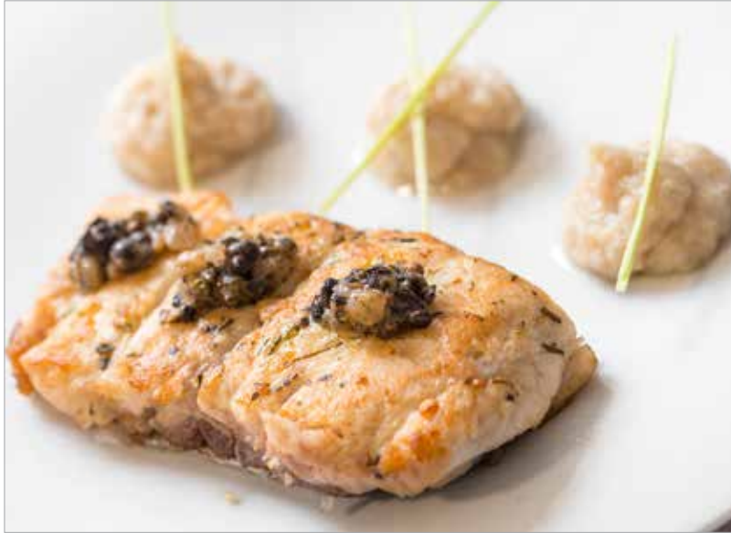
A borsmártásból elég csak egy pöttyöt tenni, mert kicsit csípős

a tejszínnel és a mustárral, és pár percig főzzük. Végül a mártást étkezési keményítővel besűrítjük. A busafilét a halfűszersóval, a sóval és a durvára összetört fokhagymával alaposan bekenjük, majd hagyjuk fél órát állni. Ezt a fázist előző nap is elvégezhetjük, ugyanis