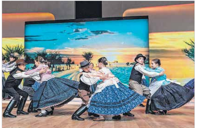
Színvonalas produkcióval kápráztatták el a közönséget adásról-adásra

egymás után győzték le az akadályokat, és a döntőbe is betáncolták magukat. Minden egyes megméretést maximális pontszámmal teljesítettek, ám nemcsak a szakmai zsűri értékelté teljesítményüket fantasztikusnak, számos szavazatot kaptak a gyerekek a nézőktől is. A tehetségkutató verseny utolsó fordulójára hazai, azaz mezőföldi táncokkal készültek. A gyerekek a felkészülési időben is remekül teljesítettek. A napi 3-4 órás próbákat