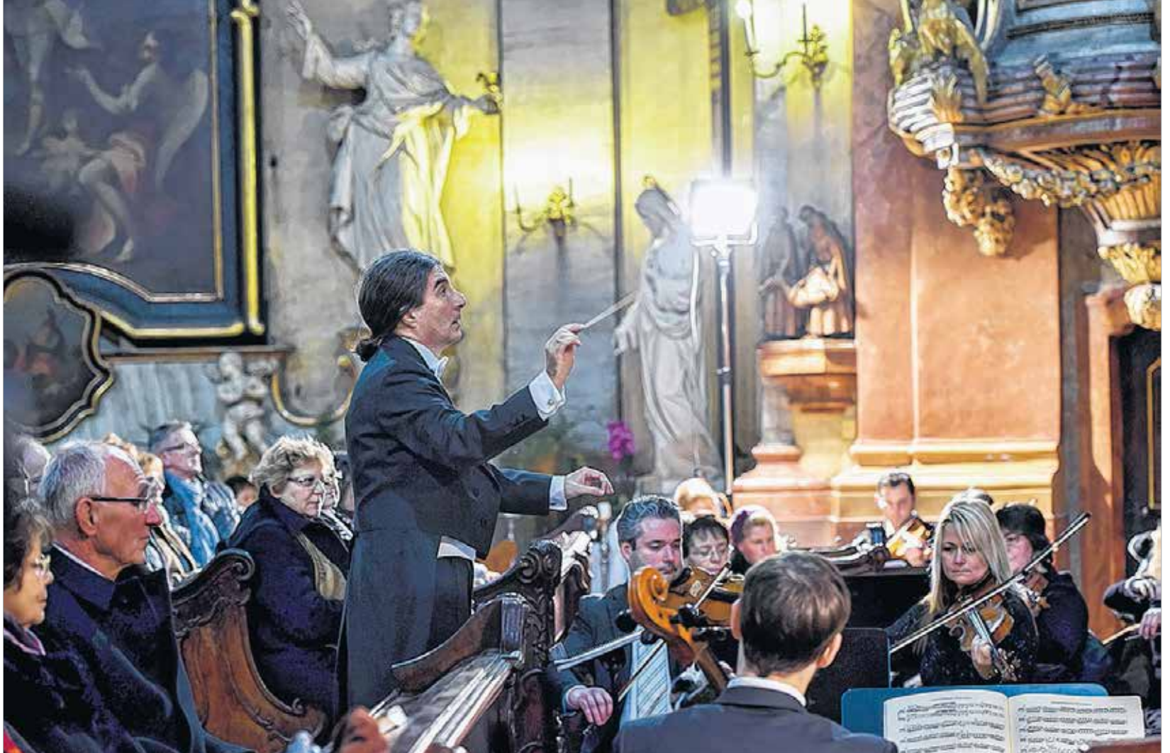
A zenekar és a karmester is jelesre vizsgázott

Milyen gondolatokkal fogadta a székesfehérvári meghívást?