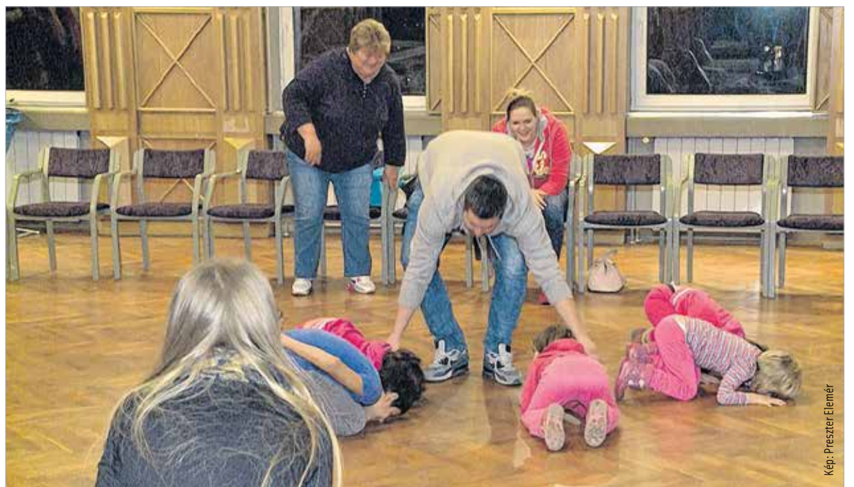
Családi vetélkedő ügyességi és kvízkérdésekkel, érzékenyítő játékokkal

„Két területi fordulót tartottunk. Októberben az első területi fordulót Mórton, novemberben a másodikát Sárbogárdon. Az első fordulóban a székesfehérvári, móri, bicskei, polgárdi járásban élők mérték össze tudásukat. Innen négy család jutott tovább. A dunaiújvárosi, martonvásári, enyingi és sárbogárdi járás területén élők számára szervezett második fordulóból három család jutott tovább. A döntő megméretetésnek Székesfehérvár adott otthont. Azt gondolom, a résztvevők jól érezhették magukat, és