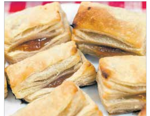
A hájas pogácsa a batyus bálok kedvenc süteménye. Aki a mozgóképet szeretné látni... Okostelefonon (iOS és Android) a LAYAR nevű ingyenes alkalmazás segítségével és használatával megnézhetik a témáról készült videót. Telepítés után a hetilap 11. oldalát kell beolvasni az applikációban, így indul a klip. Reméljük, sok vállalkozó kedvű olvasónk kipróbálja!

A Magyar Király Szállóban torkos csütörtökön tartották a cigánybált. (A torkos csütörtök neve onnan ered, hogy a húshagyó keddi húsmaradékot a nagybőgő kezdetét jelző hamvazó szerdán nem lehetett megenni. Viszont, hogy ne vesszen az egész kárba, rákövetkező nap megették.) A cigány zenészek azért ezen a napon mulatoztak, mert az előtte lévő farsangi időszakban minden hétvégén muzsikáltak. Az est egyik fénypontja az éjfél előtti bögötemetés volt, amivel jelezték, hogy a következő negyven napban nincs helye a szórakozásnak. A nagybőgőt ilyenkor feltették az asztalra, letakarták egy fehér abrosszal, majd általában tréfás szöveggel búcsúztatták el a hangszerttel együtt a farsangot.