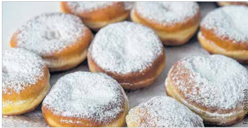
A farsangi fánk sem hiányozhatott a batyuból

„Fehérváron a huszadik század első felében több ezer földműves élt, akik városrészenként külön-külön báloztak a katolikus művelődési házban. A legmódosabbak, a legnagyobb területtel rendelkezők a felsővárosiak voltak, akiknek a farsangvégi bálját gazdabálmak hívták. A palotavárosiak és az alsóvárosiak a kevésbé tehetősebb gazdálkodók közé tartoztak, így ők egy másik hétvégén báloztak. A jökevény túl ezeknek az eseményeknek az volt a célja, hogy a legények megismerkedjenek a hozzájuk illő társadalmi helyzetű leányokkal.” Mindegyik bál a batyubálok közé tartozott, ami a gyakorlatban azt