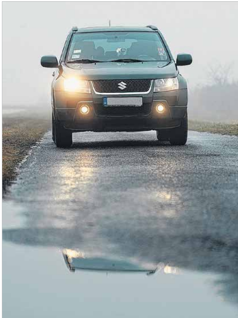
Télen a fékút a többszörösére növekedhet

Inkább a szervizen és az orvoson spóroljunk, ne a gumin!