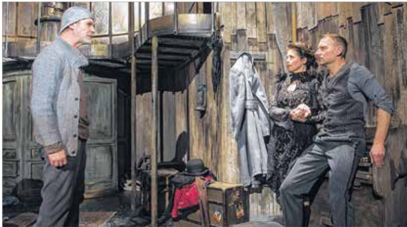
Friedrich Dürrenmatt művei többnyire az erkölcsi és politikai paradoxonok kérdéseit feszegetik. Ezúttal a házasságot boncolgatja.