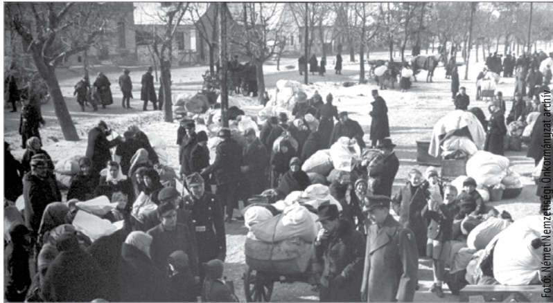
A községbe vezető utak lezárva, a leltározó tisztségviselők és a vagyonszeíró bizottság munkában, a rendőri karhatalmi zászlóalj a pakolás rendjére figyel

Fejér megye különösen érintett a kitelepítést illetően. Alig van olyan család, ahol az 1700-as évekig visszamenőleg ne lenne sváb felmenő. A hétvégi megemlékezésen olyanok vettek részt, akiket közvetlenül is érintett a háború utáni gyűlölethullám és az ebből fakadó erőszakos költöztetés. Rokonaik, felmenőik sorsáról meséltek egymásnak, azokról a családokról, akik generációkon