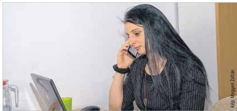
Szerdánként várják a CSOK iránt érdeklődőket a Széna Egyesület tanácsadói

A Széna Egyesület új tanácsadást indított el, aminek keretében a CSOK-ot igénybe venni szándékozó családok tájékozódhatnak a feltételrendszeréről. Sokan nem tudják még, hogyan lehet kihasználni az új lehetőséget, és milyen feltételeknek kell megfelelni, hogy igénybe vehessék a támogatásokat. Ezért a Széna Egyesület szerdai napokon szakértő segítségével tanácsadást tart.