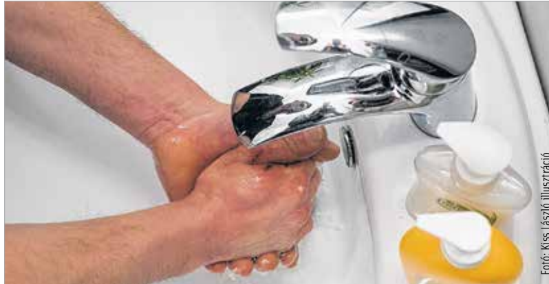
Fotó: Kiss László illusztráció

„Első lépése a seb ellátásának, hogy az, aki a sebet kezeli, alaposan, szappannal tisztára mosott kézzel kezdjen neki. Minden esetben, legyen szó akár a frissen keletkezett seb kötözéséről, ellátásáról, vagy ha csak kötést szeretnénk cserélni a már korábban szerzett seben!