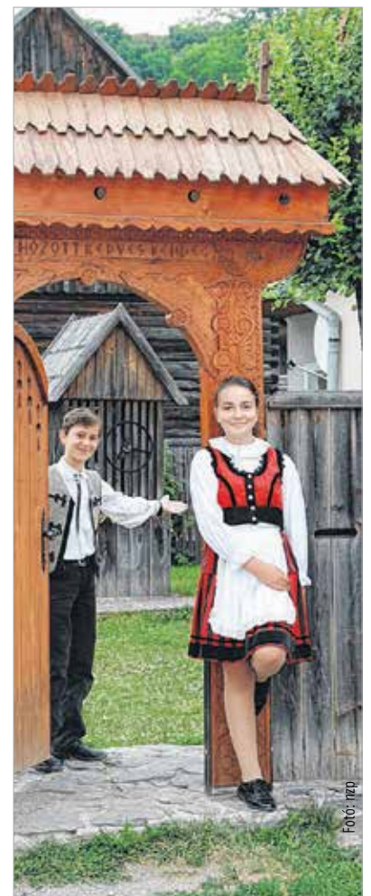
A székely invitálásnak Székesfehérváron is nehéz ellenállni