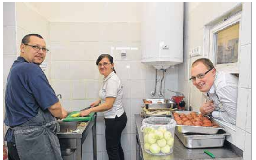
Norbis az étterem hangulatfelelőse

„Szakmai gyakorlat keretében járunk ide hetente hat órában. Ez nagyon