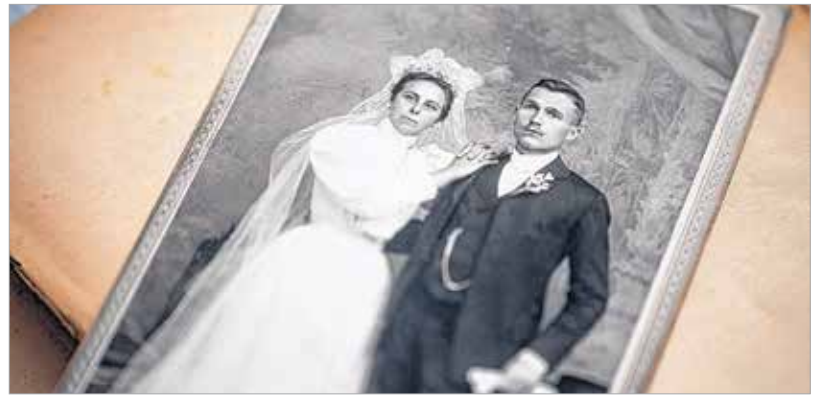
A nagymama és a nagypapa esküvői képe több mint száz éves