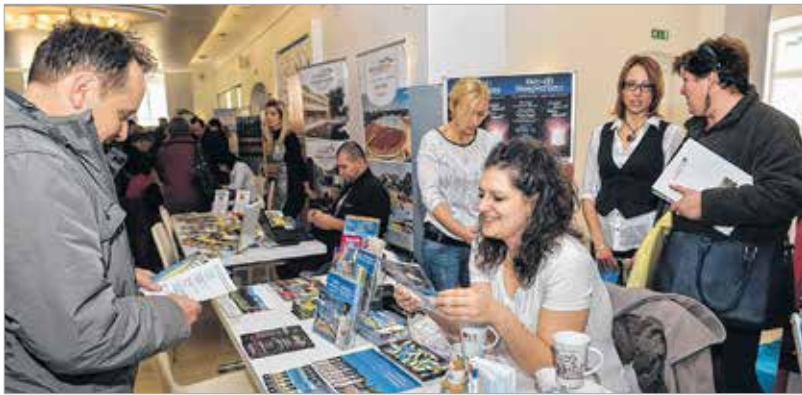
Székesfehérvár várja vendégeit

tehet azért, hogy minél többet beszéljünk és gondolkodjunk a helyi turizmusról. Ugyanakkor azért ez a kiállítás esősorban a városunkban élőket segíti abban, hogy széles kínálatból választhassanak. Mi minden évben kihasználjuk ezt a lehetőséget, hogy a székesfehérváriaknak be tudjuk mutatni a helyi és a környékbeli kínálatot is. Idén egy nagy újdonsággal bővült a város és környéke turisztikai vonzereje, ez pedig az áprilisban újrainyitó Gorsium. Nagyszerű programok várják a látogatókat, köztük májusban a Floralia tavaszünnepe.”