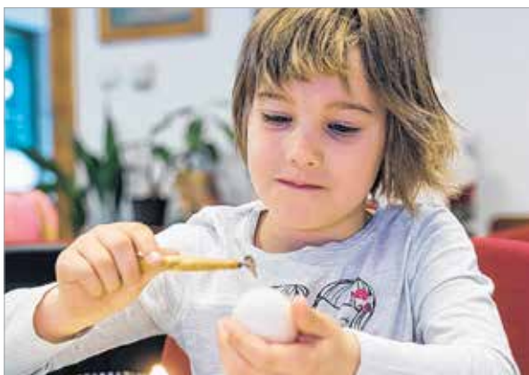
Az írókázást nem lehet elég korán kezdeni