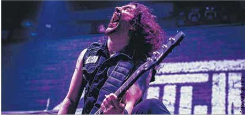
Augusztus harmadikán lép a Fezen színpadára a harminctödik születésnapját ünneplő Anthrax

A sajtótájékoztatón jelen volt Székesfehérvár polgármestere, Cser-Palkóczy András is, aki üdvözölte a szervezők azon javaslatát, miszerint az Ósfehérvár Városkártyát is bevonják a jegyértékesítésbe. Ez azt jelenti, hogy minden kártyával rendelkező székesfehérvári lakos tíz százalékos kedvezményben részesül a normál jegy- és bérletárakból.