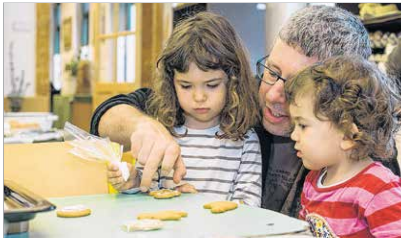
A tojások mellett húsvéti szappanok, pamutcsirkék is készültek, de húsvéti mintájú mézeskaláccsal és csipkeveréssel is foglalkozhattak az érdeklődők

Írókával készültek a hímes tojások: ennél a tojásfestő technikánál egy pálcika segítségével kell viaszból mintákat rajzolni a tojásra, és ezután beszínezni őket. De berzseléssel is lehetett díszes tojásokat készíteni, sőt aranyporos hímes tojások is kikerültek az ügyesebbek kezei közül. A kézművesek házának minden terme megtelt szombaton, a Tojásfestő maratonon.