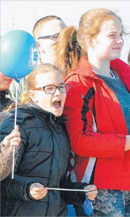
A Bory Jenő Általános Iskola diákjai figyelik a nem mindennapi mentési bemutatót

A Magyar Vöröskereszt 1881-ben jött létre. Tevékenységét a „Háború áldozatainak védelmét szolgáló” négy Genfi Egyezmény valamint ezek kiegészítő jegyzőkönyvei alapján végzi. Fő célkitűzései egyebek mellett az élet, az egészség védelme, az emberi személyiség tisztelgésben tartása, az emberi szenvedés, szociális gondok enyhítése, a betegségek megelőzése, a fegyveres konfliktusok, katasztrófák áldozatainak megsegítése.