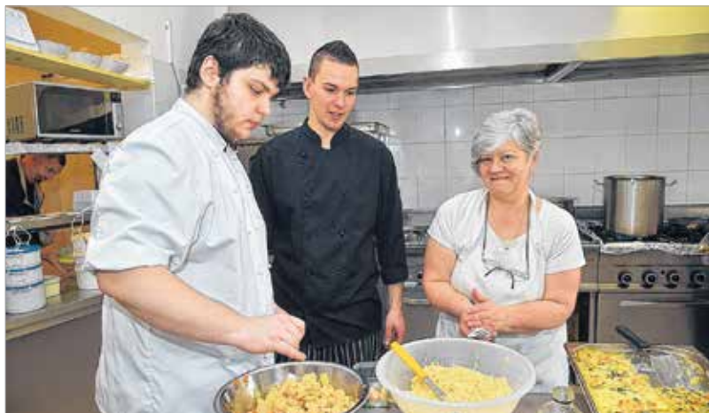
A konyha a szakácsok felségterülete

„Tudni kell, hogy itt megváltozott munkaképességű emberek dolgoznak kilencven százalékban, így figyelembe kell vennünk bizonyos problémákat, amiket magunkkal hoznak. Szerencsére a közösség nagyon jó, s nekünk fontos