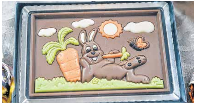
A természetes alapanyagok mellett az ötlet a ráadás