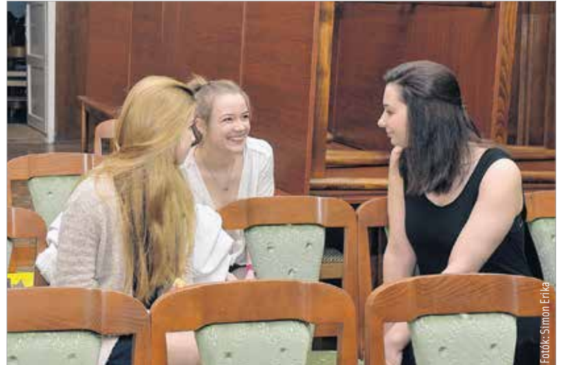
Igazi közösségi élmény a Fehérvári Versünnepe

(Kosztolányi Dezső: Erős várunk a nyelvé)