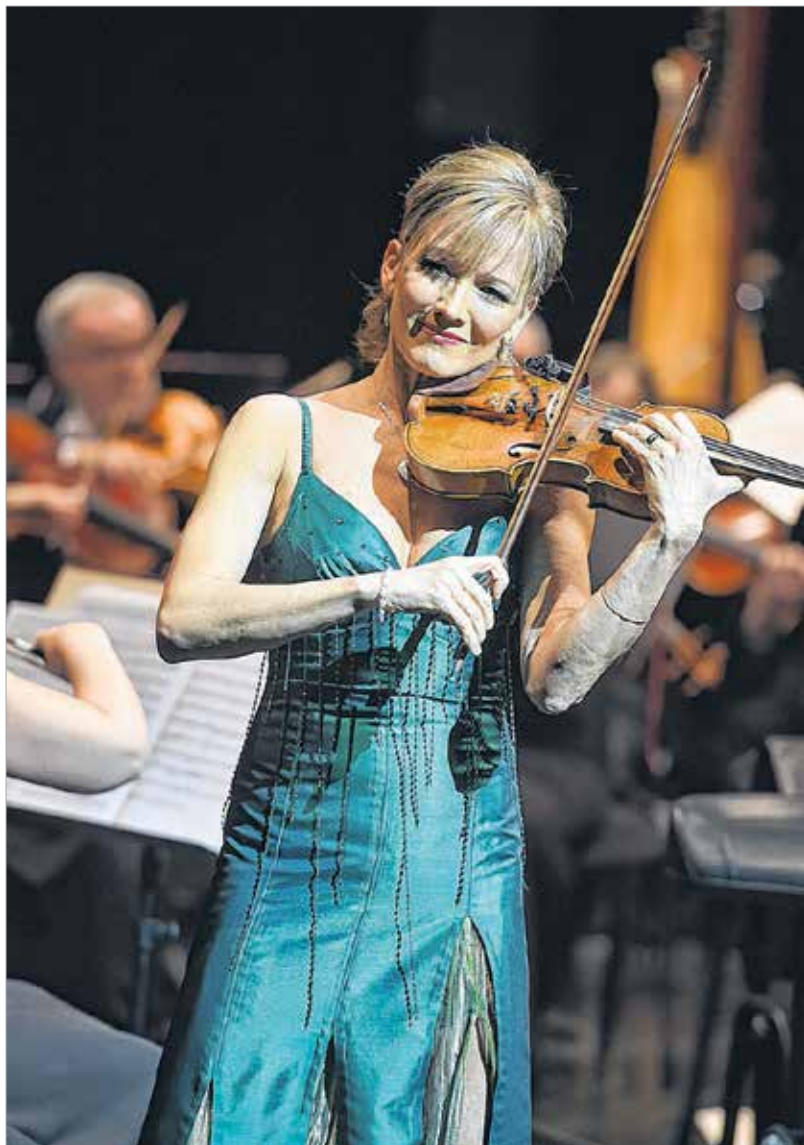
A hegedű az örök szerelem

Először úgy gondoltam, hogy elmegyek a Színművészeti Főiskolára, de nem vettek fel. Ez borzasztó