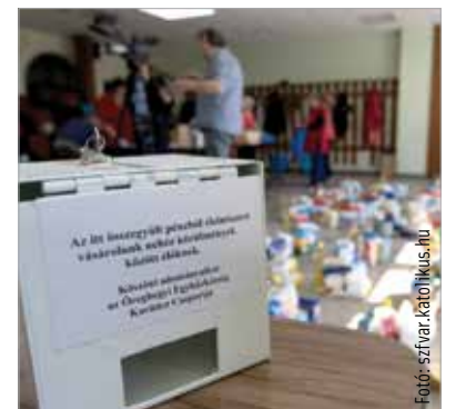
Az Öreghegyi Karitásztartós munkatársai és önkéntesei Spányi Antal megyés püspök vezetésével kedden rászoruló családokat ajándékoztak meg élelmiszer-csomaggal

Az átlagosan nyolc kilós csomagok tartalma: liszt, olaj, rizs, cukor, tészta, konzervek, tea, készételkonzervek és édesség. Az ajándékcsoomagokat több helyen kiegészítették húsvéti apróságokkal is a gyermekek számára, valamint húsvéti