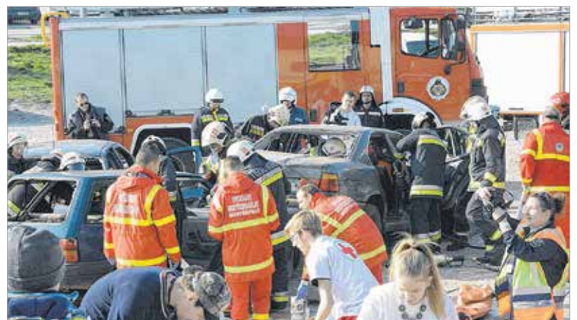
Aki a Palotai út melletti murvás parkoló közelében járt, azt hihette, egy tömegkatasztrófába csöppent. Szemtanúi lehettek, hogyan zajlik egy közlekedési baleset sérülteinek mentése és ellátása, de a rendőrség is bemutatót tartott.