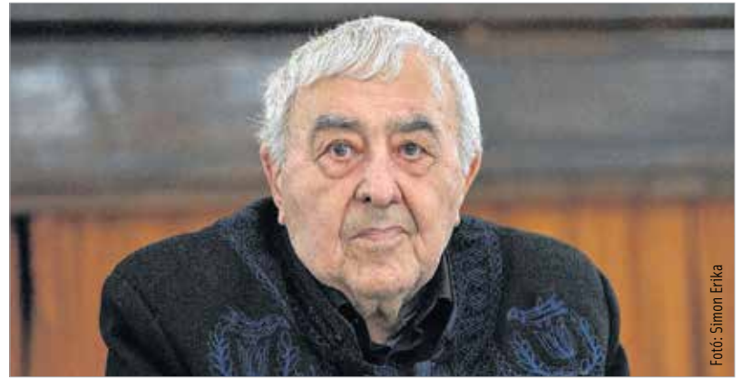
Isten éltesse Zoli bácsit!