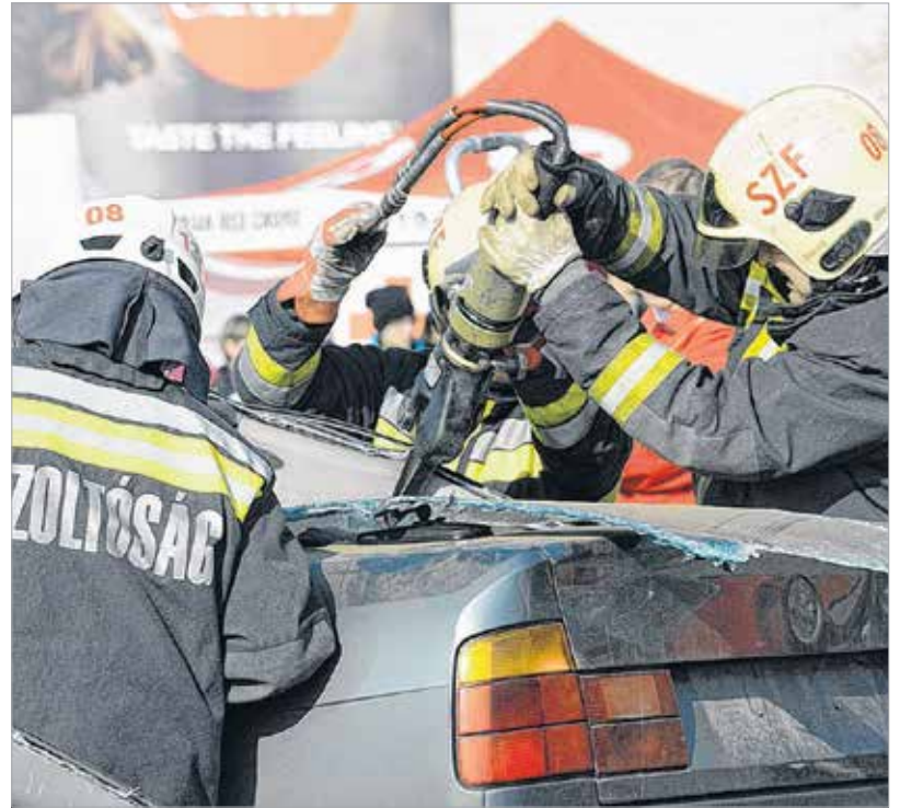
Egy imitált közlekedési balesetet szenvedett autóból próbálják kiszabadítani a tűzoltók a sérültet. A Vöröskereszt valamennyi társszervezete, a tűzoltók, a mentők, a rendőrség is részt vett a bemutatón