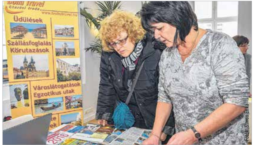
Vonzó ajánlatok egész évben

feltétlenül befelé, hanem akár külföldre, akár határon túli magyar területekre.” Posch Ede, a találkozó főszervezője elégedett a látottakkal, mint mondja, ez fontos hírverés a városnak is: „Nagyon kedvezően alakulnak az arányok: itt vannak a legnagyobb, legismertebb fehérvári utazási irodák, akik Magyarországon, Európában, de talán a világ minden részére szerveznek, indítanak utakat. Azok, akik konkrét utak iránt érdeklődtek, most kihasználhatták a lehetőséget, mert több iroda is különleges, a kiállításra időzített kedvezményrel várta a látogatókat. Ezen kívül Magyarországról is nagyon sok turisztikai attrakció jött el Fehérvárra. Hogy mást ne mondjak, közel tíz magyarországi