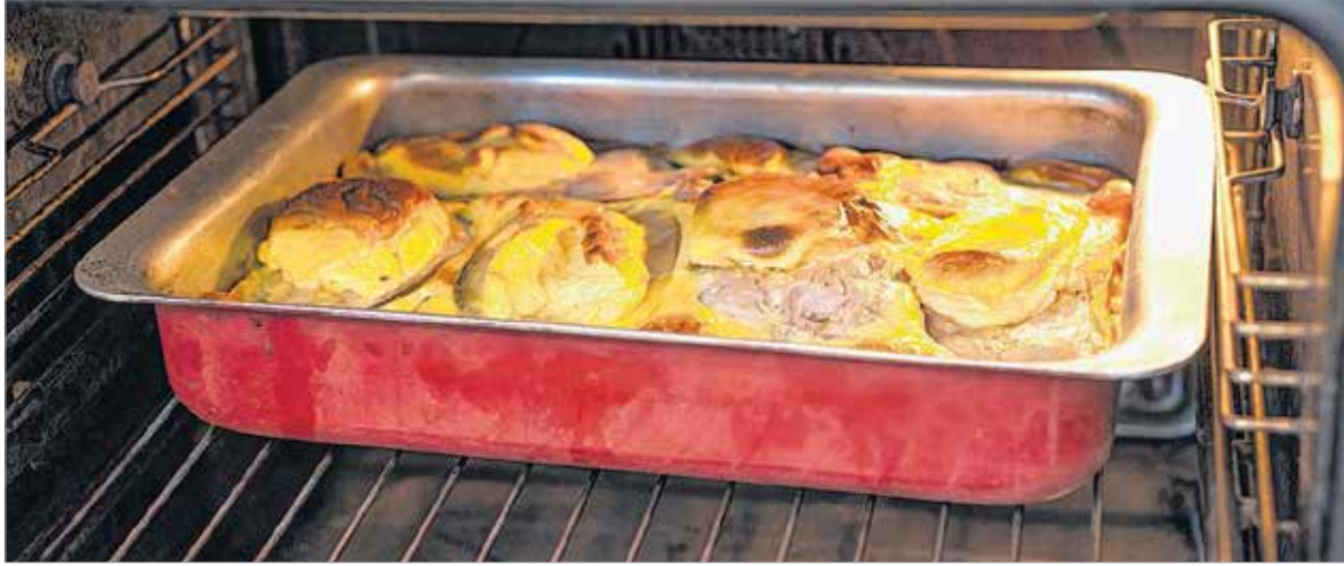
A ponty körülbelül negyven perc alatt megsül

Kati néni megtörte a tojásokat. A belsejükből kikanalazta a csirát, és beletette őket egy tálba. A héjak egy külön tálba, majd a szemétkébe kerültek. A magará-