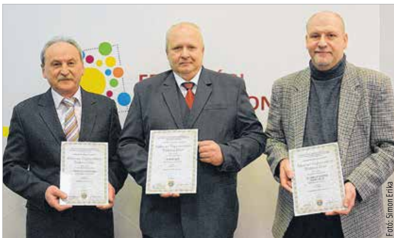
Az elismerést a fogyasztók világnapjához kapcsolódóan adományozzák, amit harminchárom éve ünnepelnek világszerte

„A mai nap is bizonyíték arra, hogy a piacgazdaságban nem minden a profit. Egy vállalkozásnak persze meg kell élnie, működnie kell, ehhez gazdasági eredmény kell. De szerencsére eljutottunk már odáig, hogy minden vállalkozás büszke lehet arra, ha felelősséggel viselkedik társadalmi ügyek iránt. A legfontosabb pedig az, ha tiszteli a saját vásárlóit!” – mondta el lapunknak Róth Péter alpolgármester.