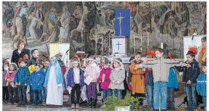
A keresztút családi esemény, melyen a gyerekekkel együtt a szülők is részt vesznek

10:30-kor ünnepi szentmisét tartanak a székesegyházban Krisztus feltámadásának ünnepén 18 órakor esti istentiszteletet a református templomban