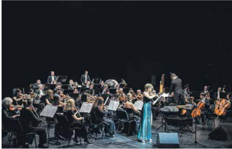
Az Alba Regia Szimfonikus Zenekar méltó partnernek bizonyult

Nagyon sok nehéz pillanatom volt, különösen a pályám kezdetén, amikor a kollégáim megkérdezték, miért akarok énekelni, maradjak csak a kaptafánál. Aztán megtanultam, hogy ez is hozzátartozik: ha az ember van valahol, és onnan kikacsintgat, azt nem nézi jó szemmel a környezete. Voltak nehézségeim, hiszen idő kell ahhoz, amíg az ember megtanul egy másik szakmát. De nem adtam fel soha, pedig volt olyan énektanárom, aki azt mondta, soha nem fogok megtanulni énekelni. De ha azt látom, hogy valamiben meg akarnak akadályozni, annál inkább ragaszkodom hozzá.