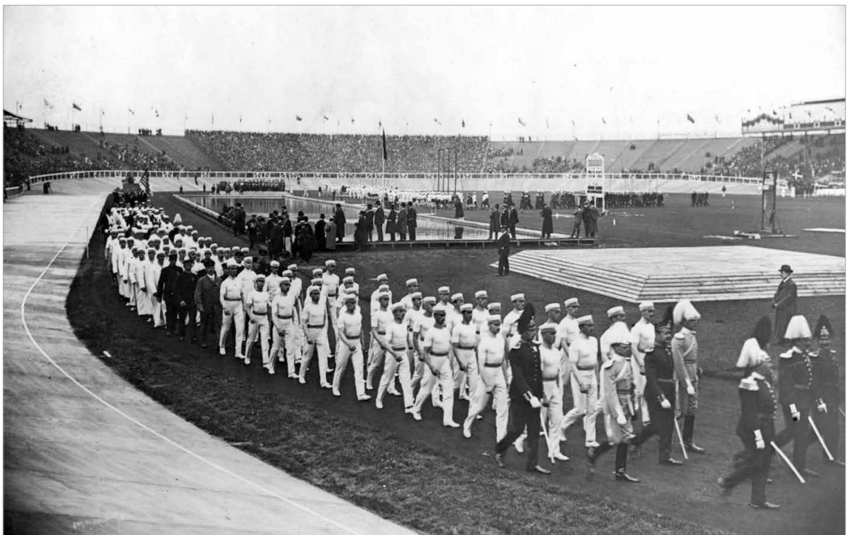
Egy újítás, ami hagyomány lett: nemzetenkénti bevonulás az olimpiai megnyitón

A negyedik nyári olimpia a magyar sport történelmében is mérföldkőnek tekinthető. Nemcsak azért, mert hatvanhárom tagú delegációnk az addigi legnépesebb volt, és a három arany, négy ezüst, két bronzérem pompás termésnek számított. Hanem mert Fuchs Jenő és a kardcsapat révén az olimpiák számkönyve legkedvesebb hegemóniájának, a magyar kard hagyományának kialakulását ünnepelhettük. Pedig a Monarchia nem engedte el a tisztai állományban lévő legjobb vívóinkat, ám így is hét magyar jutott be az egyéni döntőbe! Közülük dr. Fuchs volt a legjobb, aki természetesen csapatban is aranyérmes lett (Földes Dezső, Gerde Öszkár, Tóth Péter, Werkner Lajos társaságában.) Máig legeredményesebb olimpiai sportágunk első diadala volt tehát a londoni olimpia. A vívás (és különösen a kard) magyar mesterei generációkon át folytatták a sikereket. Összesen 83 olimpiai érmet nyertünk a páston! De negyedik legsikeresebb sportágunk, a birkózás is ekkor ünnepelhetett első bajnokát: Weisz Richárd a nehézsúlyiak között diadalmaskodott. Az itthon súlyemelésben is többszörös rekorder Weisz rendezés megküzdött a történelmi dicsőségért: az orosz Petrovval a döntőben egy órában át gyűrték egymást!