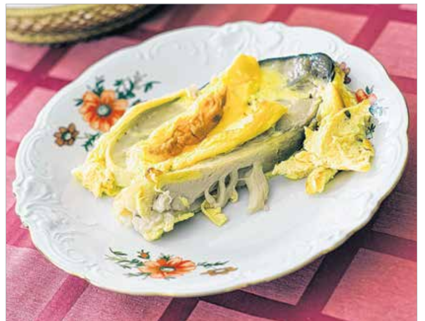
Egy kis savanyú krumplisalátával mennyei ebéd

pedig ezután is főzött a segédeknek. A heti menünek megvolt a rendje. A hétfő volt a maradéknapp, ilyenkor a vasárnapról megmaradt húsokat ették. Kedden főzeléket ebédeltek, amihez általában járt valamilyen húsféle. Ha más nem, lesütött sonka vagy szalonna. Szerdán tészta-étel volt kolbászos levestel vagy Jókai-bablevestel. Csütörtökön megint főzeléket ették. A paradicsomos káposzta a nagy kedvencek közé tartozott. Pénteken