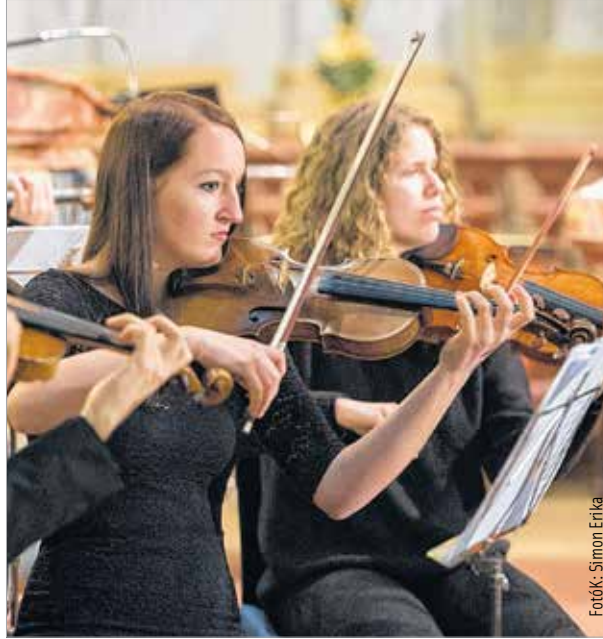
A virágvasárnap a zenében is elmélyülést igényel