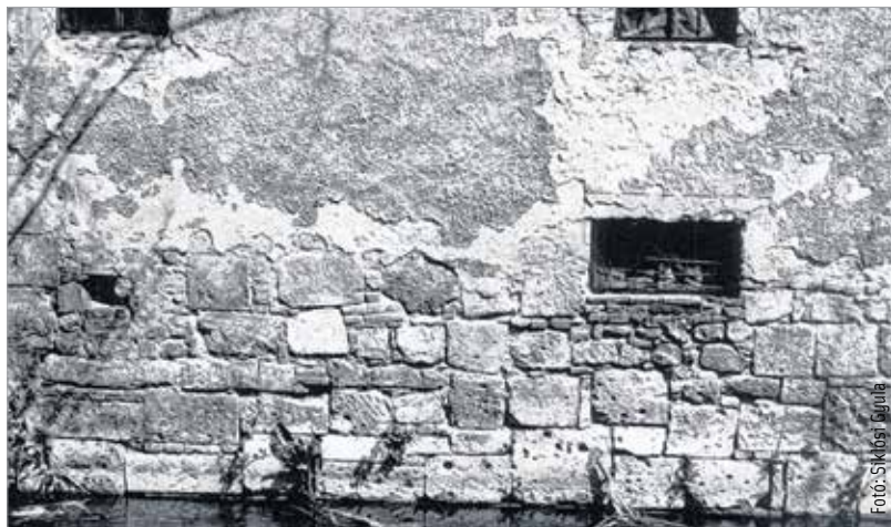
Pillanatok 1988-ból: a sörházmalom nyugati fala

Ami miatt e sorok írója szót emel, nemcsak a fentiekre, hanem különösen a műemléki védetség alatt álló valamikori molnárházra vonatkozik. A roskatag, de még most is létező földszintes épület csatornaparti falán a leomlott vakolat alatt, illetőleg az északi irányba futó kerítésfal alsó részén látható, hogy azok alapjai a malommal egykorúak, amire a falszakasz kváderkövekből megépített része egyértelműen utal is. 2013 decemberében a helyszínen tett látogatás során a jelen írás szerzője azt tapasztalta, hogy a jelenleg már használaton kívül álló és az életveszélyessége miatt lezárt kis épületet az összedőlés veszélye fenyegeti. A volt városmajor területét használó Dépónia Kft. az egykori malomház udvarát a kidobásra szánt öreg szemetesedények tárolására használja. Félő, hogy a kis épületet a jelenlegi tulajdonosa annak műemléki, város-történeti értékét nem eléggé ismerve – a kerítésével együtt esetleg lebontatja, megsemmisítve ezzel az ott beépített, többek között a hajdani városfalakból származó értékes kőanyagot is.