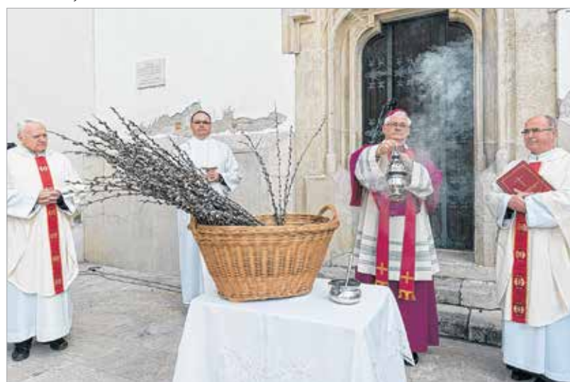
A tömjén a tisztaságot jelképezi

Ez már önmagában is nagy titok... Valóban, hiszen Krisztus a halálán keresztül győzi le a halált a föltámadásával, és ezzel az életbe hív meg mindannyiunkat. Ez egy egyenes vonal, nem csapongás, nem tétova lézengés a szélsőségek között, hanem egyenes irány, amely a földi élet minden szituációjából lehetőséget ad, hogy fölfelé nyissunk, az Isten felé. Olyan szép, ahogy ezt Szent István megértette, aki élete végén a kilátástalanságban nem keresett semmiféle politikai partnert, szövetséget, támaszt, hanem az ég felé emelte a lelkét,