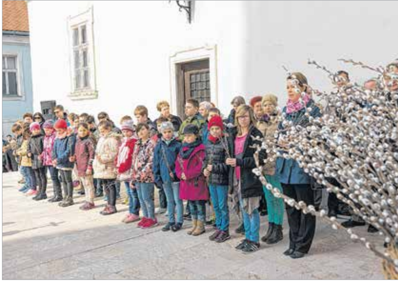
Magyarországon nem pálmaággal, hanem barkával emlékezünk Jézus dicsőséges jeruzsálemi bevonulására

húsvétra sem, mintha az pusztán a föltámadásról szólna. A húsvét a jézusi élet foglalata: Krisztus mindig nekünk adta magát. A megtestesülésben, a gyermekévekben, a felnőtt férfi nehéz munkát végző időszakában és a hároméves tanításban is, amikor tetteivel bizonyította, hogy egy közülünk, de több is, mert ő az Isten fia. Ezt a mindig önmagát adó szeretet mutatta meg nekünk a nagyhéten, a virágvasárnaptól húsvétig terjedő időszakban. Ha megpróbáljuk átélni ezeket az eseményeket, akkor felismerjük, hogy mind-mind valami egészen kivételesen szép és megragadó. Ehhez az kell, hogy az ember kicsit elcsendesedjen, és megpróbáljon elmélyedni ezekben a történetekben. Szép a virágvasárnap, amikor Jézussal lélekben mi is bevonulunk Jeruzsálembe. Tudjuk, hogy ekkor