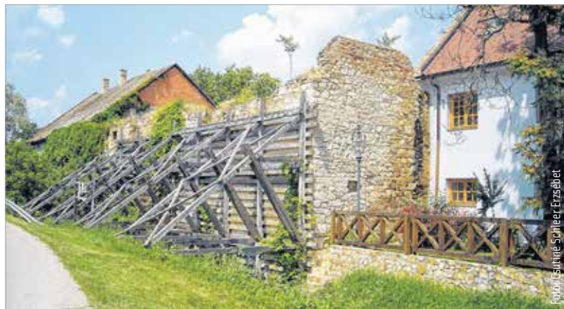
A „bedeszkázott” falmaradvány – a sörházmalom nyugati fala (2010)

lehetne megnyitni. A malom alapjainak igen értékes maradványai az újjáépített sörház északi részében, a malommal közös falban napjainkban is léteznek, és amennyiben a főiskola a nagycsarnokot látogathatóvá teszi, ez is hozzájárul, sőt emeli a kis „helytörténeti múzeum” látnivalóinak az értékét. A volt malom területén közösségi kert lehetne kialakítani fákkal és pihenőhelyekkel. Az igazgatósági épület és a sörház alatt húzódó, eredeti állapotukban megmaradt és jelentős műemléki értékkel rendelkező ászokpincék látogathatóvá tétele ugyancsak hozzájárulna a létesítendő múzeum látványaihoz.