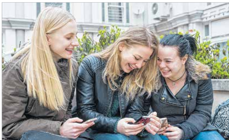
A Z és az alfa generáció számára az okostelefon szinte létszükséglet

Baby boomer: 1946-1964 között születettek X generáció: 1965-1981 között születettek Y generáció: 1982-1994 között születettek Z generáció: 1995-2004 között születettek alfa generáció: 2005 után születettek