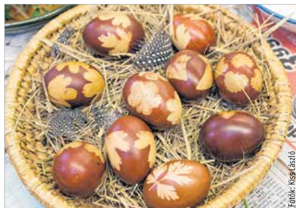
Tojás falevélmintával – egyszerre természetes és modern