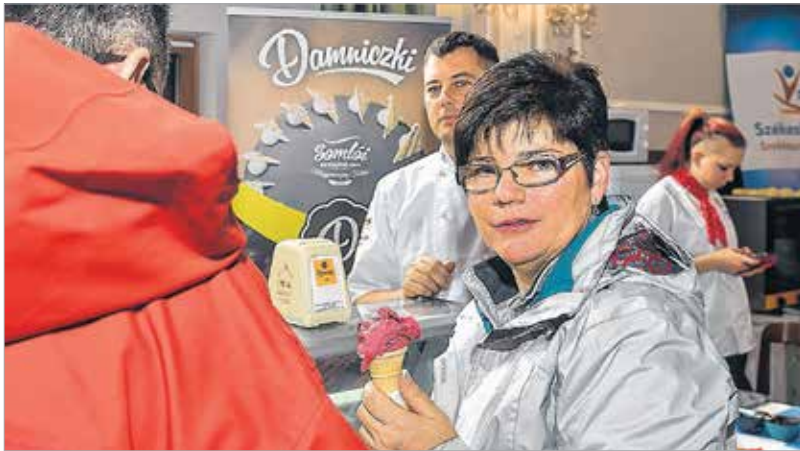
A Damniczi Cukrászdát aligha kell bemutatni a fehérváriaknak. Csak a legfrissebb gyümölcsökből készült fagyaltokkal várják a nyulakodni vágyókat.

a forgalmazókat hívtuk, akik ilyen termékeket forgalmaznak. Úgy gondolom, a magyar édesipar egyre inkább felveszi a versenyt a tradicionális európai csokoládégyártó nemzetekkel. A csokoládéink nagyon finomak, többen forgalmaznak külföldre is magyar kézműves csokoládét.” A mintegy harminc kiállító termékével bizonyította, hogy nemcsak