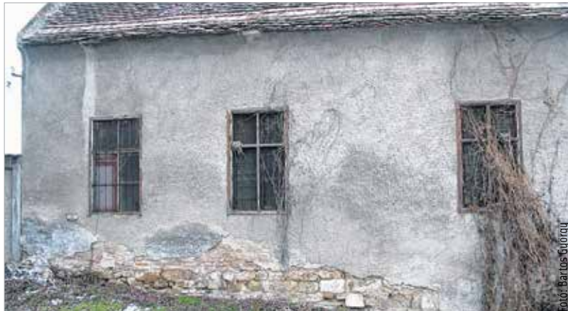
A molnárház épülete 2005-ben

Az évszázadokon át városi tulajdonú Sörház téri épületegyüttes az államosításokat követően 1989-ig a FETEVEV kezelésében állott. A vállalat az épületeket raktározási célokra használta. 1985-ben a sörházmalom a molnárházzal, a vele összeépült sörház a mélypincékkel valamint a sörházi lakóépület műemléki védetség alá került. Az Országos Műemléki Felügyelőség (OMF) a sörházmalomról és a sörházi épületekről 1988-ban műemléki felmérést készített. Ez akkor sajnos a molnárházra nem terjedt ki. Ami azért is érthetetlen és sajnálatos, mivel az utóbbi – a funkciója miatt is – mindvégig a malomhoz tartozott, azzal együtt épült fel, majd került átépítésre. A két épületet a városi iratok is egy egységként említik, a