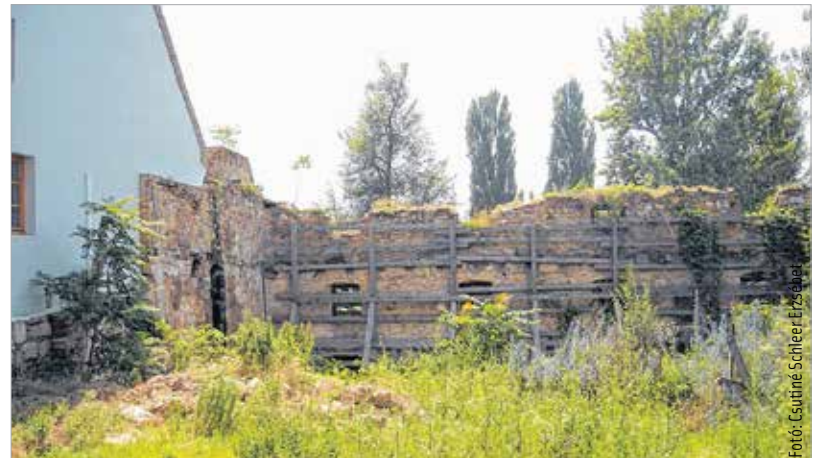
Ezen a területen akár közösségi kert is kialakítható lenne, csatlakozva a Csónakázó-tó és a Bregyó köz szepen fejlődő rekreációs övezetéhez

veszélyességük miatt – lebontásra kerültek (2005). Ugyancsak lebontották a Sörház és a malom közös falát is. Ezután az egyetlen, viszonylag épségben megőrződött csatornaparti falszakaszt az összedőléstől megvédve fagerendákkal támasztották meg, ami több mint egy évtized elmúltával még napjainkban is ugyanúgy van, eltakarva az ipartörténeti műemlékként nyilvántartott valamikori malom egyetlen megmaradt falszakaszát.