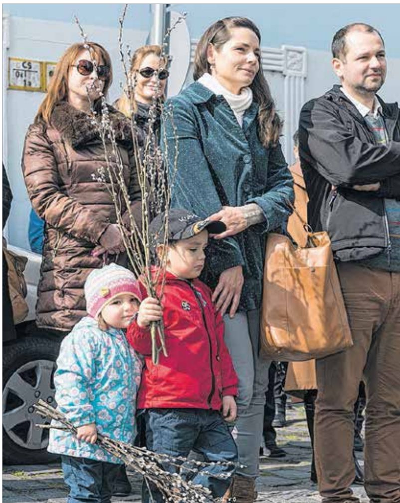
Virágvasárnap az öröm ünnepe

Ha a húsvéti liturgiát nézzük, mi az, amit kiemelne belőle, akár azért, mert