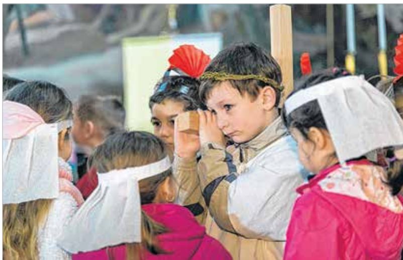
Hagyományos virágvasárnapi keresztút Maroshegyen, ahol a Szent Imre Általános Iskola és Óvoda növendékei jelenítik meg a stációkat

só leheletedig!” Ez a megváltás, és ez a lényeg. Nem az, hogy hány tövist vertek a fejébe, hány ostorcsapás érte a testét, hanem az, hogy mindenre a szeretet volt a válasza. A kereszten majd halljuk: „Atyám, bocsásd meg, nem tudják, mit cselekszenek!” Látjuk a nagycsütörtököt, annak az estének a bensőséges hangulatát, ahol Jézus búcsúzik az apostolaitól, ahol létrehozza, megalapítja az egyházi rend szentségét, és elindul az az esemény, amely megállíthatatlan gyorsasággal megy nagypéntek délután háromig, amikor Krisztus meghal. Látjuk a szenvedés útját, a kereszttutat, amelyen mi is végigkísérjük majd a Palotavárosban, aztán ott vagyunk nagyszombaton, amikor az egyház nem végzett liturgiát, hanem valóban csöndben, elmélyedve készült a feltámadásra, és próbált az értünk