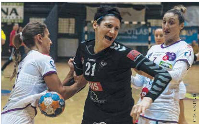
Bandelier az Érd és a Békéscsaba ellen is nagyot küzdött

Lapunk megjelenésének napján, azaz csütörtökön a Fehérvár Televízió mozgóképes illusztrációval szolgál azokhoz a tudósításokhoz, melyeket a szomszédos hasábokon olvashatnak. A Szolnok-Alba kosármeccs és a fehérvári kézilabdás hölgyek Békéscsaba elleni találkozóját is láthatják a képernyőn csütörtökön. A Fehérvár KC nem ezzel a találkozóval zárja az alapszakaszt, a sokáig halasztgatott Fradi-meccs jövő kedden lesz – szerdán pedig természetesen megnézhetik a tévében. Akár csak a valami furcsa ötlettől vezérelve szintén keddre tett Videoton-DVSC focihangadót.