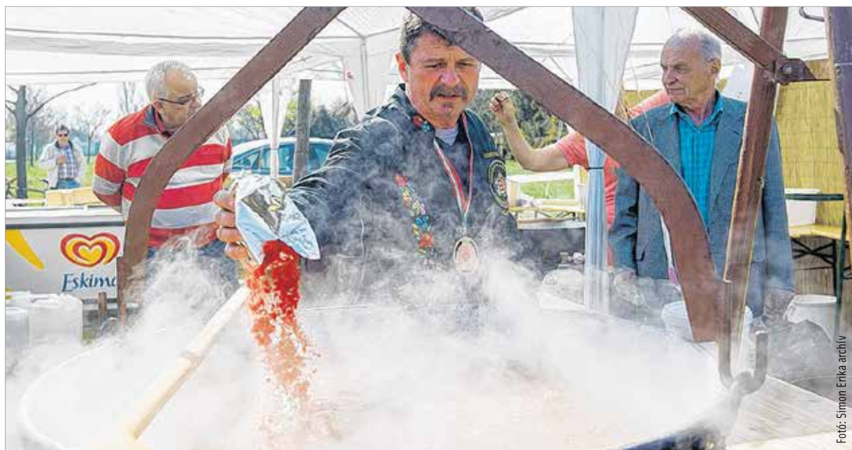
Nagyszerű hangulat, finom halételek és szórakoztató színpadi programok – április másodikán mindenkit vár a Fehérvári Halünnepre a palotavárosi tavaknál