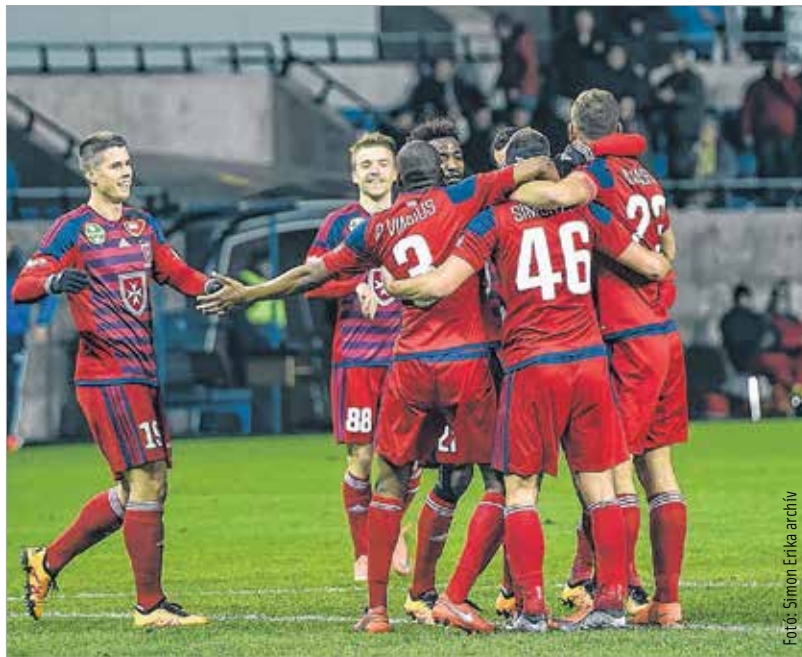
A Videoton játékosai a legutóbbi három meccsükön mindössze kétszer mutathattak be gólörömet. A Honvéd idegenbeli legyőzéséhez szükség lesz a találatokra!

A Videoton FC a hétvégén fontos lépést tehet az érmes pozíciók felé vezető úton: a Honvéd legyőzésével egyik közvetlen vetélytársát rázhatja le Horváth Ferenc alakulata. A válogatott mérkőzése miatt szünet mindkét fél számára lehetőséget adott a sorok rendezésére. Nagy kérdés, melyik alakulatnál töltötték hasznosabban a felszabaduló napokat. A Honvéd legutóbbi két meccsét megnyerte, a Vidi viszont három forduló óta nyeretlen, így a találkozó esélyesének inkább a hazaiak számítanak.