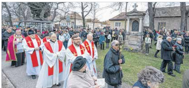
Nagypénteken délután a város papjai és hívei közös keresztutat jártak. Az egyes stációk a családban megélt keresztet hordozásáról, azok krisztusi szeretettel való elfogadásáról szóltak.

Véget ért a szent három nap, melyek liturgiáit a város közösen is megünnepelte Spányi Antal megyés püspök vezetésével. A nagypénteki keresztutat a Palotai úti kálvárián járhattuk, a feltámadást hirdető körmenetet a belváros macskakövein.