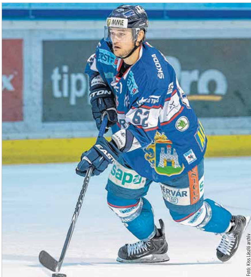
Kupagyőzelemmel ért véget a hokiszezon