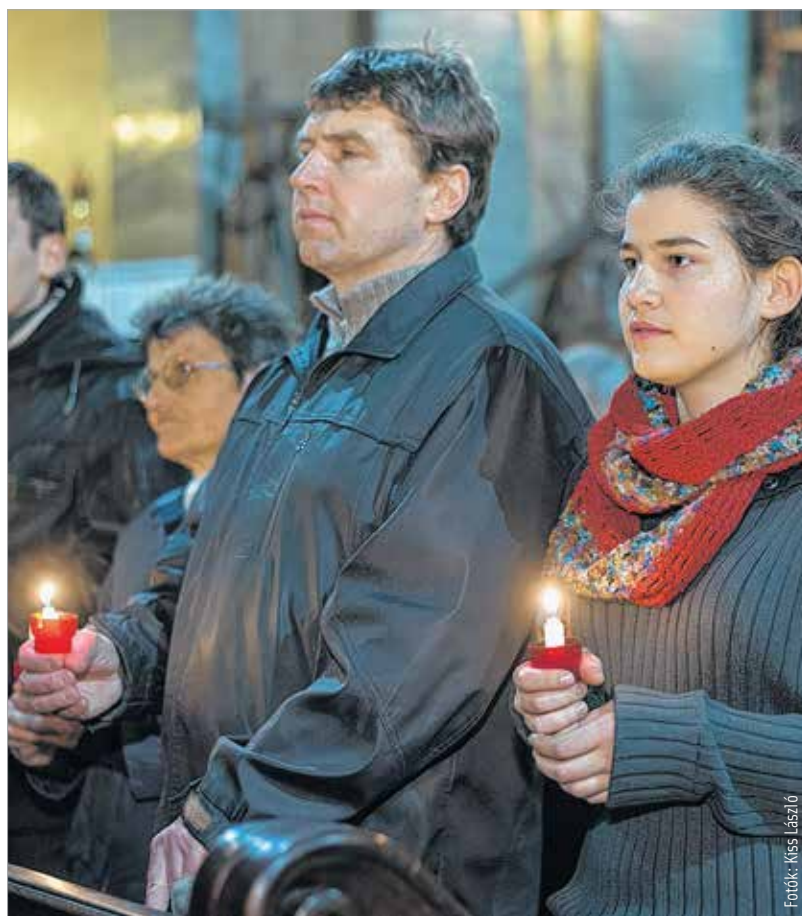
Krisztus világossága – a mise résztvevői a megszentelt tüzet egymásnak adják át. Húsvét vigíliájának fontos mozzanata az is, amikor a hívó közösség megújítja keresztelési fogalmát.