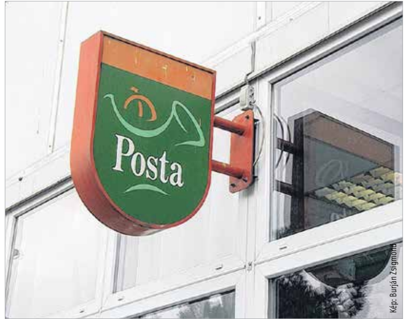
A postán elvileg három ablakban intézhetik ügyeiket a vízivárosiak