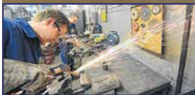
A munkálatóknak is teperni kell! 8-9. oldal