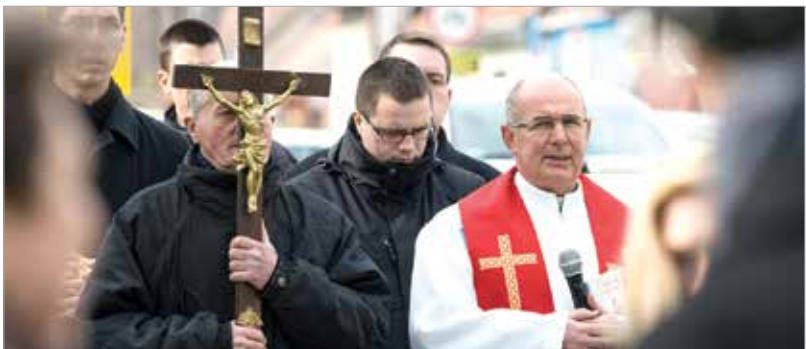
Jézus keresztútjával „az önmagát átadó életet szemléljük”