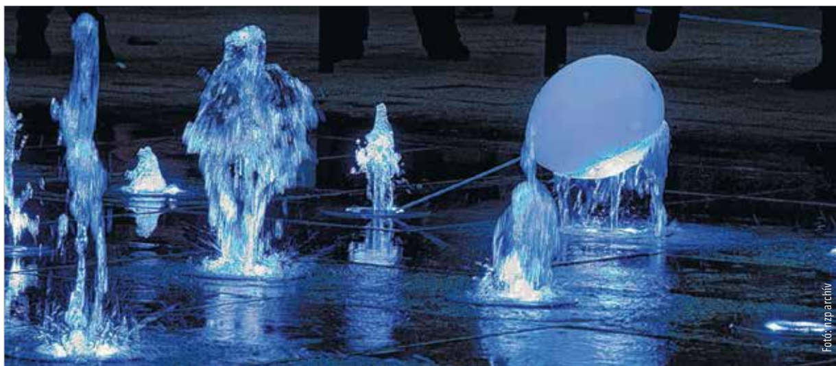
A kék szín a remény jelképe, ezért kapta a séta a Ragyogj kékben! címet. Évről évre Székesfehérváron is sokan csatlakoznak a programokhoz, és vesznek részt a közös sétán.