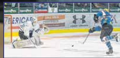
Mosoly az arcokon 14. oldal