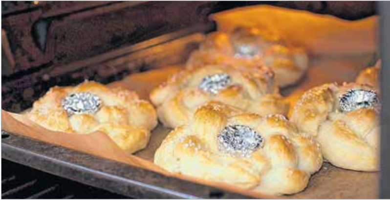
Már majdnem kisült!