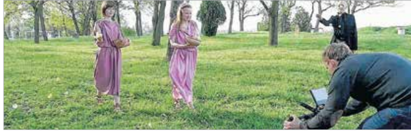
Florália az antik virágzás ünnepe, ahol a legszebb római lányok szirmokkal hintik a földet