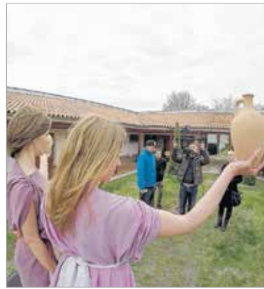
A megújított római udvarban sinumokkal a kézben a legifjabb kétezer éves lányok