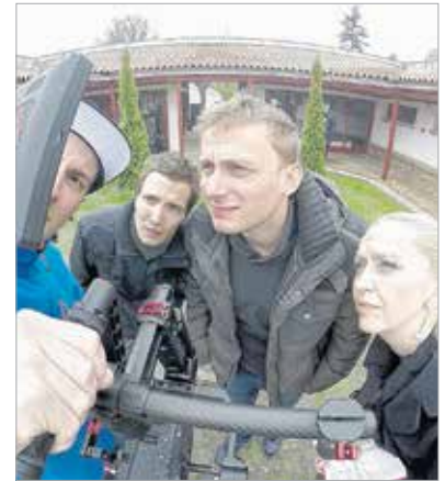
A forgatócsoport minden képkockát ellenőrzött