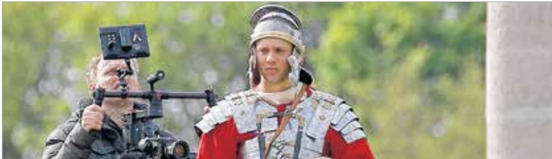
A légiós jó pénzért mindig készen áll Róma védelmére és más népek leigázására, főleg, ha film készül róla