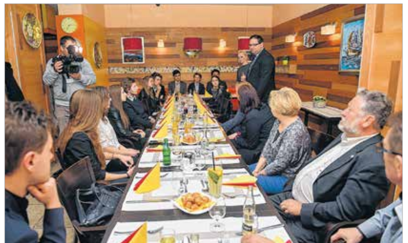
A hagyományokhoz hűen idén is volt közös, csapatépítő versünnepes vacsora

A döntő április 16-án 13 óra 30 perckor kezdődik a Szent István Művelődési Házban. Az eseményre minden érdeklődőt szeretettel invitálunk!