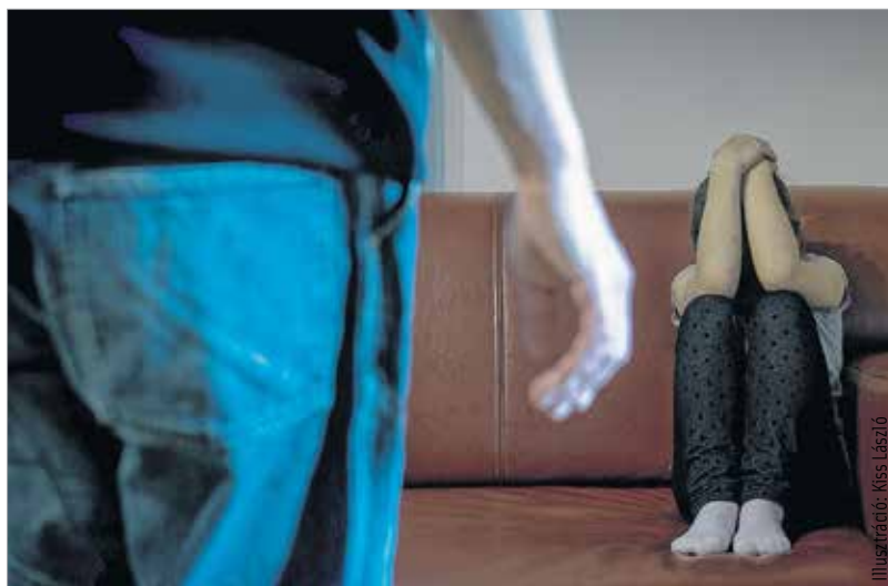
A gyermekkori szexuális molesztálás legtöbbször felnőttkorban kerül napvilágra