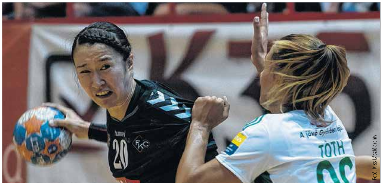
Nagyot küzdött a Fehérvár Győrben, de az ETO „más kávéház”

Ahogy várható volt, már az első mérkőzésen eldőlt a továbbjutás a Fehérvár KC–Győr párharcban. A női kézilabda-bajnokság negyeddöntőjének első meccsén Győrben léptek pályára a csapatok. Mindkét gárda kissé álmosan kezdett, de a kétszeres Bajnokok Ligája-győztes ETO hamar magához ragadta a kezdeményezést. Igaz, az első negyedóra végén még lőtávolon belül maradtak a házigazdák, sőt tizenhárom perccel a kezdés után még döntetlen, 5-5 volt az állás. A 17. percben már 9-6-ot mutatott az eredményjelző. Az első félidő pedig egy fehérvári időn túli szabaddobással valamint