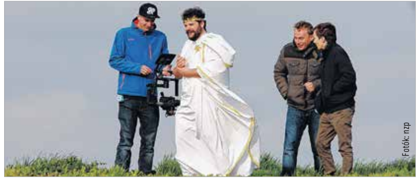
A császár napnyugatról várja az istenek ígértét, a stáb pedig tanakodik, miként rögzítse az uralkodót

szeállításakor. Május 7-én és 8-án, hosszú szünet után ismét feltáruhnak Flora ókori templomának büszke kapui, hogy az antik tavaszköszöntő, a Florália kezdetét vegye. Lesz itt római lakoma, gladiátorsuli és eleven gladiátorjáték, miközben nagy pompával bevonul a császár és jelmezes népe. E hangulatot idézi majd az a reklámfilm, amit a Fehérvár Televízió készít. A forgatás néhány pillanata képekben megőrököitve már érezteti Florália leheletét.