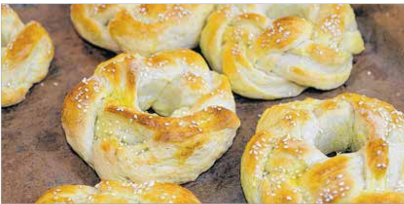
A kalácskoszorúkra még anyósa is büszke volt