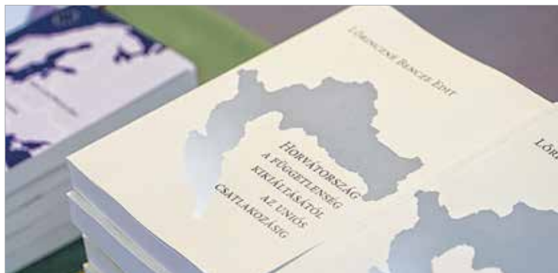
A kötet az Aposztróf Kiadó gondozásában jelent meg