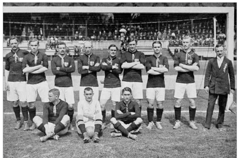
Labdarúgó válogatottunk a világszög megnyeréséért díszes ezüst serleget kapott, a németek és az osztrákok legyőzése kellett hozzá

belesérült, amikor egy meccsen Thorpe-t szerelni próbálta... Mégis atléta lett világhírű, miután Stockholmban az ötpróbában négy számot is megnyert, a tízpróbában pedig mindegyikben az első négy között végzett,