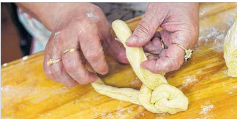
A fonás pikk-pakk el is készült

így nem volt kérdés, hogy a vizsgák letétele után hova kerül. „Érettségi után bementem a gyárba, és mondtam, hogy én itt szeretnék dolgozni. Pikk-pakk megegyeztünk. Megkérdezték, hogy ezernégy száz forint jó lesz-e. Rávágtam, hogy persze. Rögtön jött értem a küldönclány, és máris intéztük a papírokat. A Közgazdasági Főosztályra kerültem, és ott dolgoztam '88-ig. Igaz, közben megszületett a fiam és a lányom, de a gyás után szó sem volt arról, hogy nem vesznek vissza. Pedig utána kezdődött a nagy átszervezés! Nekem is új helyem lett a Videotonban, amit nagyon szerettem. Nem csak azért, mert