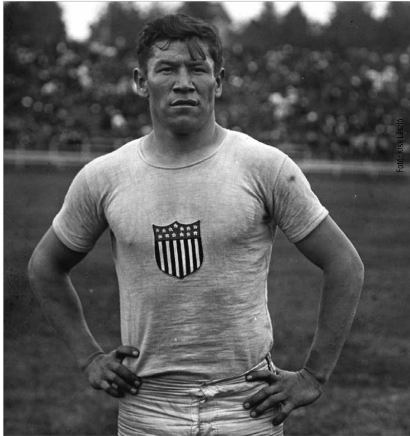
Az AP hírügynökség 1999-ben a XX. század harmadik legnagyobb sportlójának választotta az indián származású Jim Thorpe-t