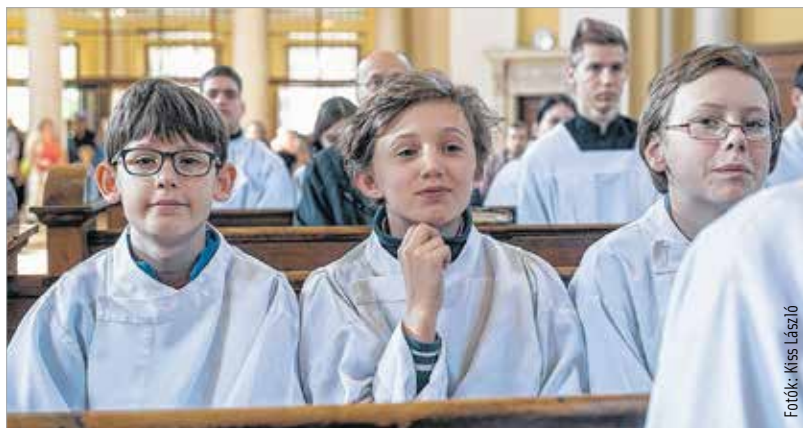
Igazán jókedvű nap volt!