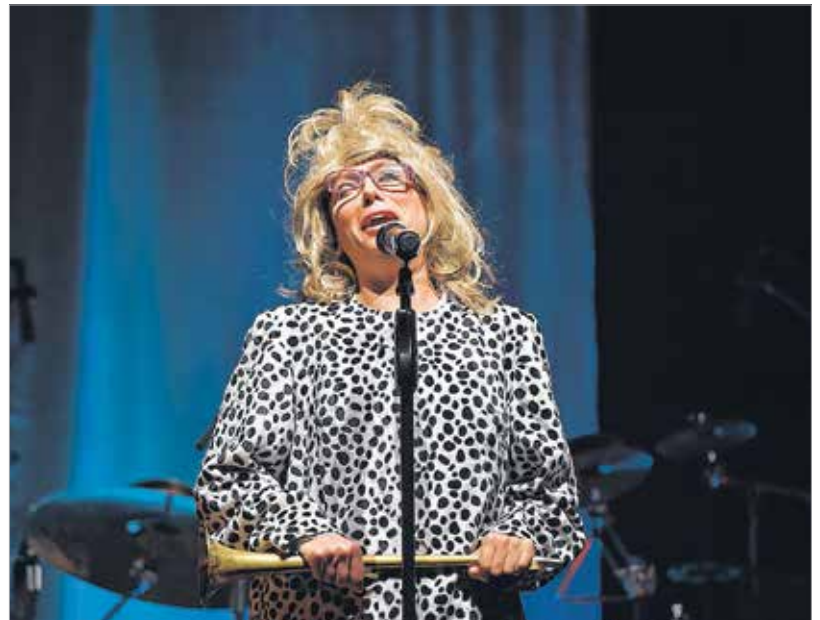
Magdicsku, a csúnya lány

R. M.: Számomra az maga a csoda, hogy jön valaki mindenféle zenei képzettség nélkül, csak a hangja van, amit úgy-ahogy kezel, aztán minden felfordul. Az első körben fogalmam sem volt, mit csinállok.