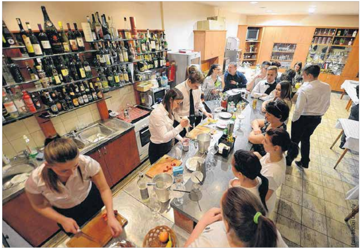
A deákosok megmutatták, miért is telitalálat a „Próbáld ki, csináld meg, ismerd meg!” jelmondat

Az esemény megnyitóján Mészáros Attila, Székesfehérvár alpolgármestere örömet fejezte ki, hogy a Székesfehérvári Szakképzési Centrum csatlakozott a Szakképzés éjszakájához. „Bízom benne, hogy az intézmények