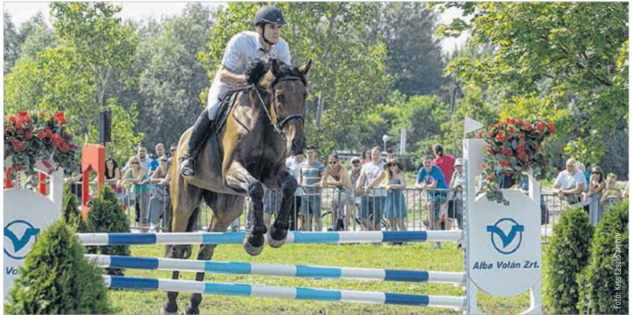
Kecskeméten hibátlanul lovagolt, és megnyerte a tusát a Volán kiválósága