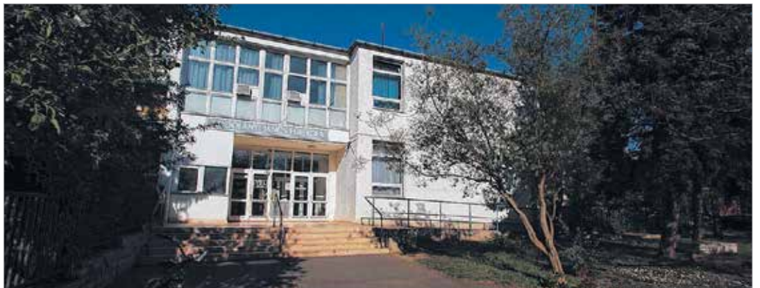
Az Ybl Általános Iskola helyén épül meg az új Vasvári

Még idesorolnám a megépült új kosárcsarnokot is. Ezek együtt mind azt a célt szolgálják, hogy a sporttagozat tovább fejlődhesen. Ott, ahol megfelelő nagyságú közösségi terek vannak, nem lehet akadály az időjárás.