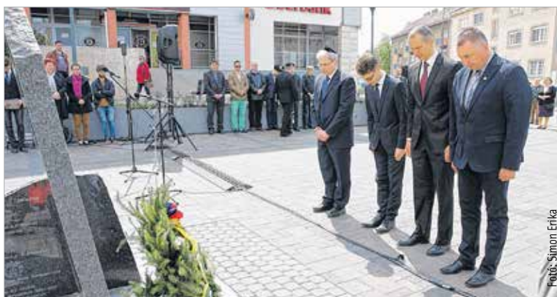
Néma főhajrás az áldozatok emlékére

Székesfehérvári Zsidó Hitközség elnöke. Székesfehérvár polgármestere arról beszélt, hogy ambivalens érzéseket keltenek benne az emléknapok, hiszen nem szolgálhatják azt a célt, hogy egyetlen napra korlátozzuk egy sorstragédia felidézését, és ezzel kipipáljunk egy feladatot, amivel nem foglalkozunk többet az év többi napján. Az emléknapok sokkal inkább azt szolgálják, hogy 364 napon gondoljunk arra, amire egy bizonyos napon emlékezünk és emlékeztetünk. „Ne felejtjük el, hogy felelősséggel tartozunk azért a csaknem három ezer fehérvári polgárért, aki nem tért haza. Felelősek vagyunk családjaikért, barátaiért, ismerőseikért.” – fogalmazott a polgármester. A beszédek után koszorúzással és néma főhajrással zárult a megemlékezés.