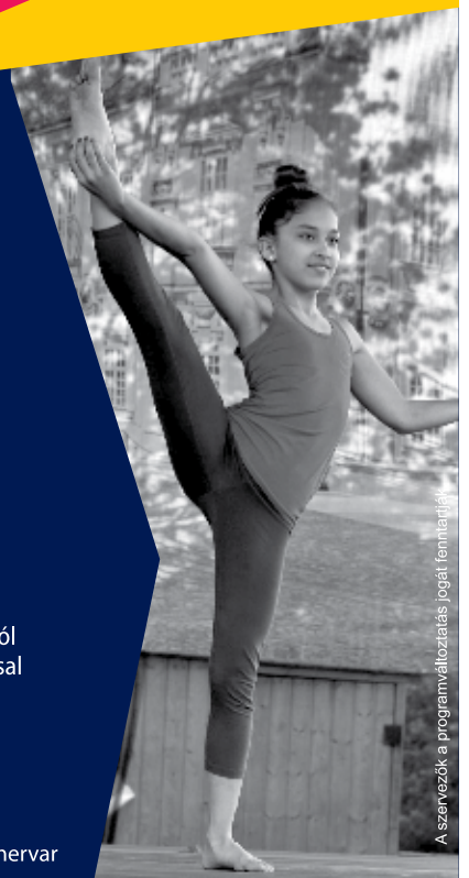
A szervezők a programváltoztatás jogát fenntartják