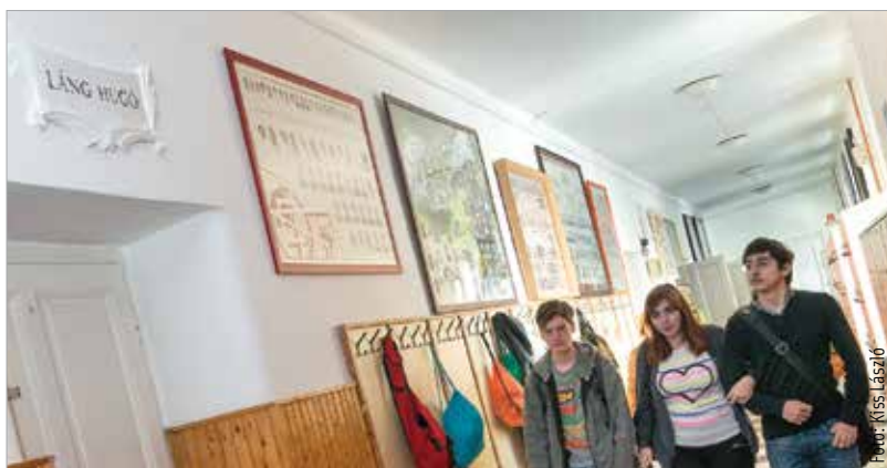
Tantermet neveztek el az iskola egykori tanáráról

emlékének megőrzése céljából. Láng Hugó országosan elismert matematikus, akinek szakterülete az ábrázoló geometria volt. Kezdetben a József Áttila Gimnázium pedagógusa volt, majd 1957-től 1994-ig a Teleki Blanka Gimnázium matematikatanáraként dolgozott. Életművét számos elismeréssel jutalmazták, többek között Beke Manó-emlékdíjjal tüntették ki és Apáczai Csere János-díjat is kapott. 1994-ben Székesfehérvár Pro Civitate díjjal jutalmazta. 2009. augusztus 20-án a Magyar Köztársasági Ezüst Erdemkeresztrel is kitüntették. Négy éven keresztül töltötte be a székesfehérvári önkormányzat oktatási bizottságának elnöki tisztségét, majd nyugdíjba vonulását követően négy évig Székesfehérvár alpolgármestere volt. Nyolcvanöt éves korában, 2012-ben hunyt el Székesfehérváron.