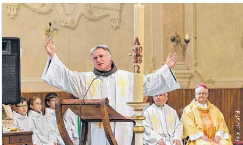
„Jót tenni jó!”

ünnepségén. „Jót tenni jó, és ha az ember kipróbálja, akkor megtapasztalja, hogy a sokféle öröm mellett ez a legnagyobb, ami érheti a földön.” – mondta, majd hozzátette: „Nincsenek kis dolgok és nagy dolgok, ahogy kis Szent Teréz írta, nincs kis szeretet és nagy szeretet. Jézus elment a garadai ördögöshöz és megszállt Zakeusnál, a bűnös vámosnál. Ő nem válogatott, neki nem volt nagy és kis ember, mert számára mindenki Isten remekműve és csodája volt.” – fogalmazott a szerzetes.