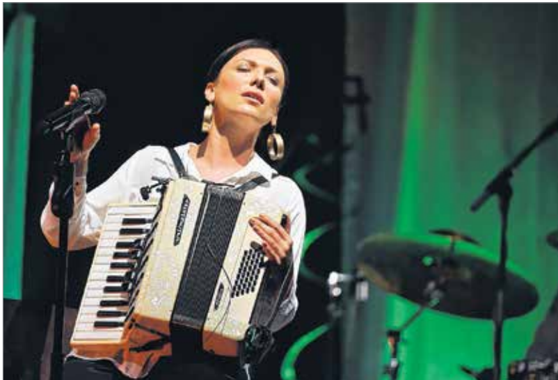
Hang plusz hangszer