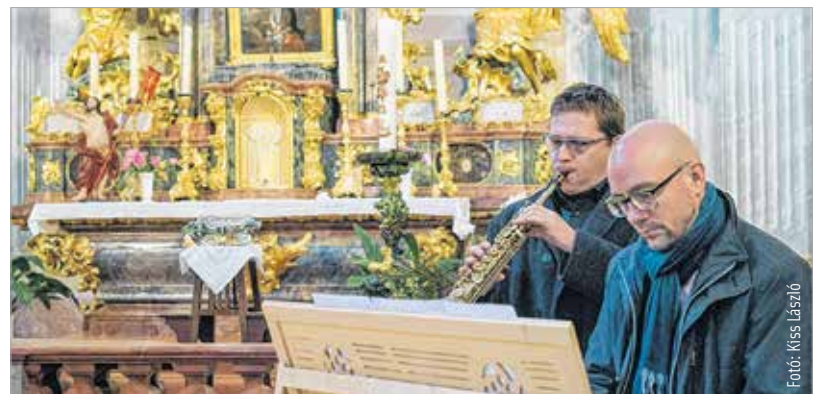
Zene, vers, ima – ezúttal Bella Istvánért szól a Ciszterci templomban