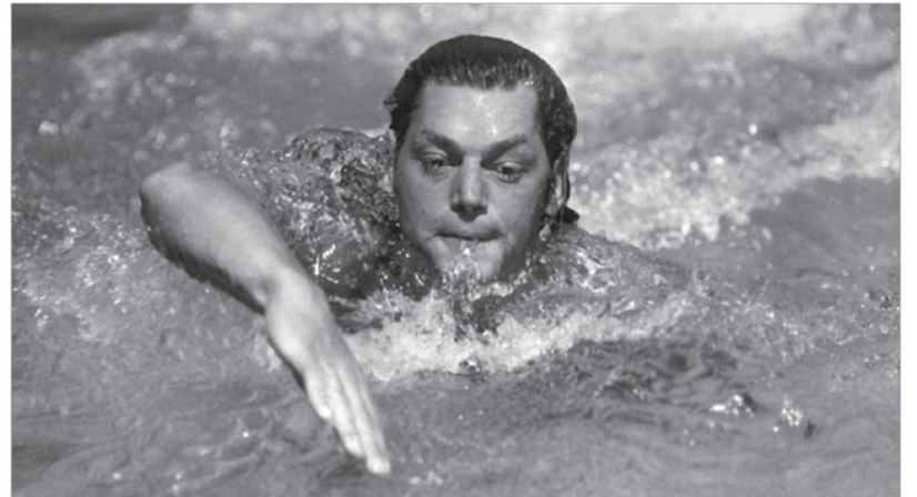
Hosszútávon nem lehetett legyőzni a repülő finnt: Paavo Nurmi a két olimpián nyolc aranyat szerzett

Az olimpiára visszatérő Magyarország nyolcvankilenc fős küldöttséggel utazott Párizsba. Tíz érmet szereztünk, ebből két arany volt. „Természetesen” vívásban, kardban született az egyik: miután a