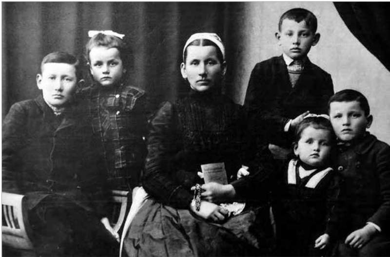
A gyerekek már nem beszéltek a német nyelvet

kaszni – konyhaszekerény stelázi – polcos konyhaszekerény sublót – komód sifon – akasztós szekerény stafirung – hozomány hecsecli – csipkeboggyó