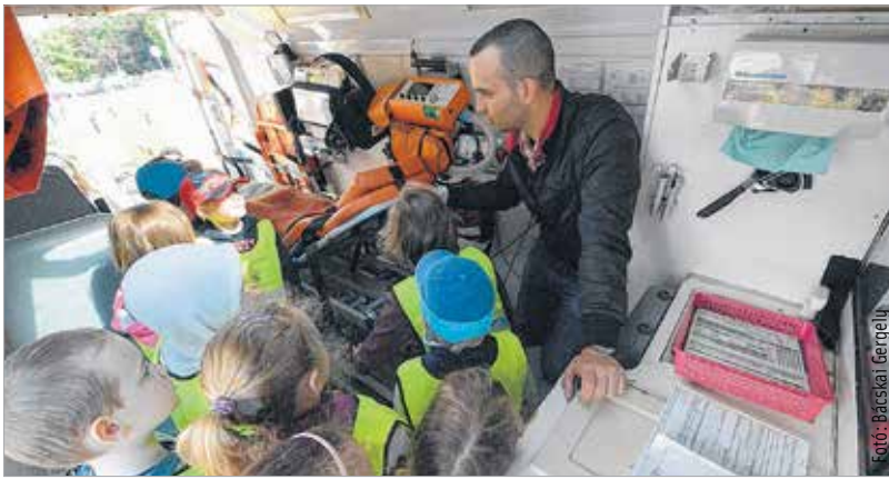
A mentők napján koszorúzással kezdtek a fehérvári állomás emléktáblájánál, majd a gyerekekkel ismertették meg a hivatás szépségeit