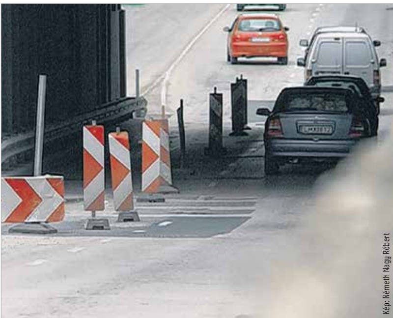
A vasúti felüljáró ugyan elkészült, az autósok viszont csak május végén vehetik birtokba az alatta megújuló útszakaszt

is csak a közlekedési hatóság külön engedélyvel lehetett az aluljáróban két közúti sávot átvezetni. Az autósok biztonságának érdekében a falak mellé magasított szegély és szalagkorlát került. Így az oldalakadálytávolság nullára csökkent, ami miatt fél méteres biztonsági sávot kellett kijelölni. A megmaradó útfelület már nem elegendő két sáv átvezetéséhez, mivel autóbuszok és tehergépkocsik forgalmát is biztosítani kell, melyek helyigénye három és fél méter.