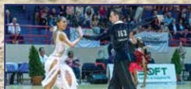
A parkett ördögei