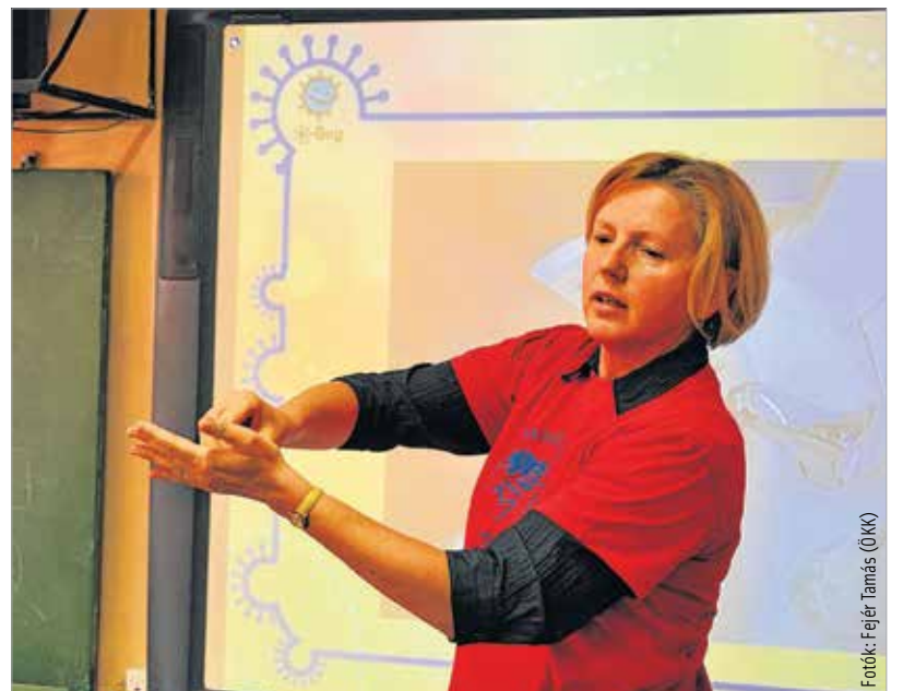
Éppen azt tanítják a gyerekeknek, hogyan kell helyesen kezét mosni. A székesfehérvári oktatási intézmények közül a Tancsics Mihály Általános Iskola csatlakozott az országos Guinness-rekord-kísérlethez. Hogy sikerült-e megdönteni a korábbi csúcst, később derül ki.

Az sem kérdéses, miért pont oktatási intézményeket vont be a kísérletbe a tisztifőorvosi hivatal, hiszen „szezonban” a nátha, az influenza, a hasmenéses megbetegedések az iskolákban, óvodákban gyorsan terjednek, így rövid idő alatt nagyszámú megbetegedést okozhatnak. Emiatt a hiányzások