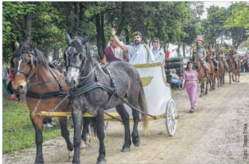
Az imperátor népes kíséretével vonult be Gorsiumba, ahol megtekintette a tiszteletére rendezett gladiátorjátékokat is

Pannónia fontos szerepet játszott a Római Birodalom életében. A pannóniai légiók Septimius Severust, Felső-Pannónia helytartóját kiáltották ki imperátornak, és elkísérték Rómába, hogy átvegye a hatalmat. Ez a segítség az uralkodót és családját több évtizeden át ehhez a provinciához fűzte, s számtalan formában fejezte ki háláját Pannónia iránt. „202-ben, amikor keleti hadjáratáról visszatért Rómába, hogy megünnepelje uralkodásának tízéves évfordulóját, akkor sem egyenesen a fővárosba ment, hanem előbb Pannóniába.