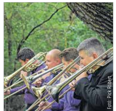
Az Artisjus-díjas Corpus Harsona Quartet is muzsikál a Királyi Erdőben

Ebben az időszakban nagyobb bevételre tehet szert. Most is, mint mindig, a fontos döntéseiben csakis belső megérzéseire hallgasson! Hiszen Önnek kiváló érzéke van ahhoz, hogy felkutatssa a sok pénz rejtő lehetőségeket. Használja ki ezt az adottságát!