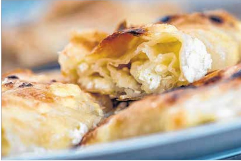
Porcukor nélkül tökéletes

felé húzta. Néhány perc múlva már az egész asztalt beborította az áttetszővé vékonyodott tészta. A vastagabb széleket egy körkörös mozdulattal leszedte, és már hozta is a vaníliás cukros túrót. Rámorzsolta, meghintette még egy kis cukros tejföllel. Egy igazi tollas ecsettel – nem ám a modern szilikonos változattal! – nagyvonalúan, érzésre megkenete olvasztott zsírral. „Ettől lesz olyan jó szaftos!” – nyugtázta elégedetten, aztán megint megemelte az abroszt, és addig dobta a tésztát, amíg fel nem tekeredett. Végül három részre vágta az édes, anakondaszerű rétest, és megkenete langyos zsírral.