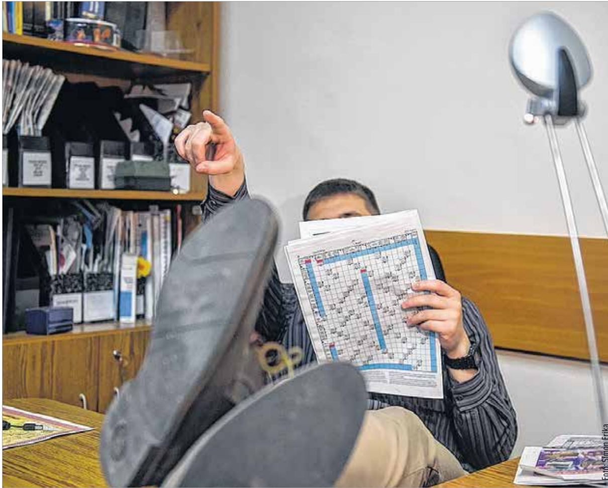
A vezetőnek mindig példát kell mutatnia

dicsérnék, akkor az alkalmazottak sokkal elfogadóbbak, ragaszkodóbbak lennének.”