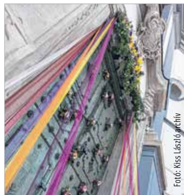
Pünkösdi a fehérvári virágkötők jutalomjátéka

Több éves hagyomány, hogy a helyi virágkötőket arra hívják: borítsák virágba a város leglátogatottabb helyeit. Tavaly hideg volt és esett, mégis sokan jöttek a belvárosba csak azért, hogy megnézzék, milyen díszítést kapott az Országalma vagy éppen a Püspöki palota nagykapuja. A Pünkösdi virágálmom alkotásaira idén is szavazhatnak a fehérváriak. A szavazólapokat a Polgármesteri Hivatal portáján és a Tourinform Irodában kihelyezett, a Fehérvári Programszervező Kft. logójával díszített gyűjtőurnába lehet leadni hétfő délutánig.