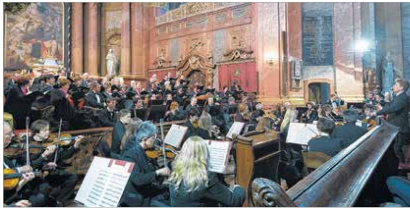
Haydnt az Isten adta nekünk, cserébe ő megkomponálta szimfóniáit

igazi, ha egy olyan helyen vezényelheti kórusát, ahol megbecsülik a megszólaló alkotót: „Nagy várakozással készültünk, és magát a műsorválasztást is úgy próbáltuk összehozni, hogy a szép alkalomhoz illő legyen. A Te Deummal, egy dicsőítő himnusszal kezdtünk, amely Joseph Haydnnak egy kevésbé ismert, de annál pompásabb műve. Igazi különlegesség, hogy ez megszólalhatott. Ezt követően a megújulás jelképeként egy korai Haydn-mű, a Reggel szimfónia következett, ami egyfajta újrakezdet szimbolizál. A műsor legnagyobb része a Harmoniemesse, ami Haydn hat nagymiséje közül a legutolsó, s talán a legértékesebb alkotás.”