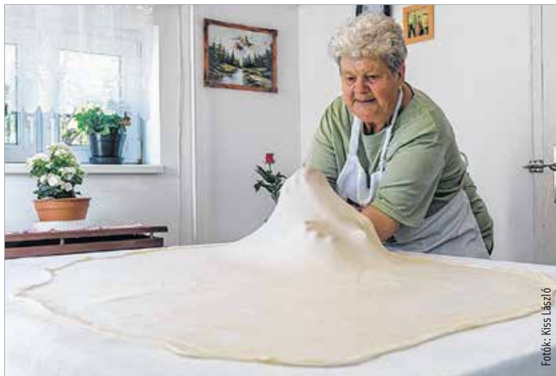
A rétestésztát, ha úgy gyúrjuk, mint a kelt tésztát, nehezebben lehet kinyújtani