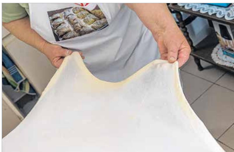
Már most szinte teljesen áttetsző

rendezni, utána meg tizennyolc évig voltam az óvoda konyháján. Előfordult, hogy tizenöt kiló lisztet dagasztottam be kézzel! De arra is volt példa, ha ősszel sok almát hordtak össze a gyerekek, akkor almás rétest vagy pitét sütöttünk nekik! Ha megtermett itthon, mindig vittünk be paradicsomot, paprikát, zellert, petrezselymet