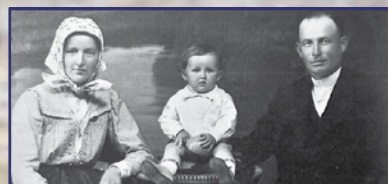
„Mindig legyél ízumflájszig!”