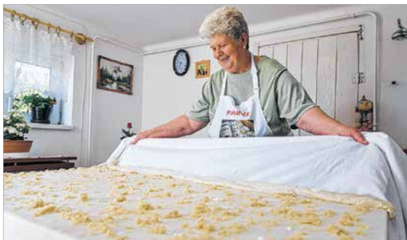
Tekeredik a rétes, kigyó akar lenni...