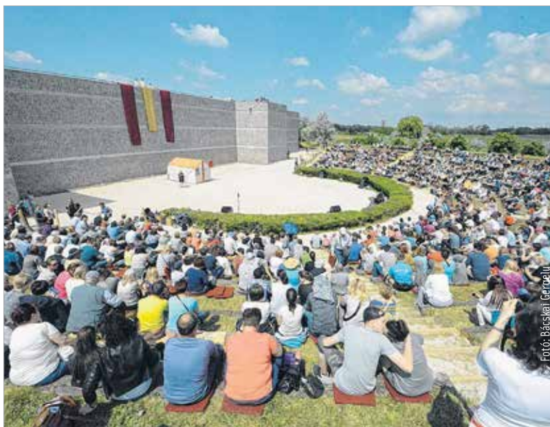
Ezrek a tavaszünnepen

A visszatérését egybekötötte a pannóniai határ szemlélésével. Ez az egyetlen olyan nagyon jelentős történelmi esemény, amit Gorsiumhoz tudunk kapcsolni. Ezt idézzük fel a hagyományokhoz hűen a Floralián is minden évben.” – mondta