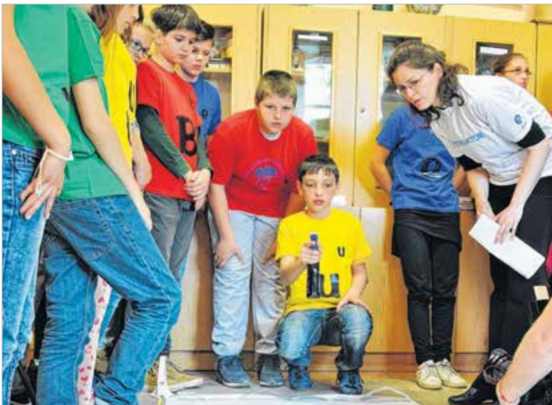
A gyerekek a gyakorlatban is láthatták, milyen messzire jutnak el a kórokozók, ha tüsszentünk. Csupán egy kis ételfestékre volt szükség a szemléltetéshez.

programjához csatlakozott oktatási intézményben. A Guinness-rekord-kísérletet az Országos Tisztifőorvosi Hivatal kezdeményezte. Fejér megyében tíz iskola közel ezer résztvevővel jelentkezett a korábbi rekord megdöntésére, országosan pedig összesen százkilencven iskola tizenháromezer tanulója fogott össze azért, hogy megelőzzék az eddigi csúcstartót, Glasgow-t, a maga 3039 résztvevőjével.