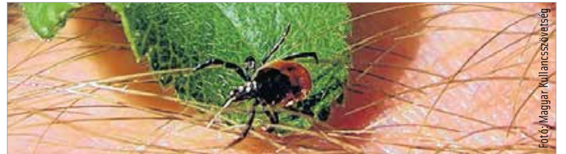
Magyarországon az embert és társállatait veszélyeztető leggyakoribb kullancsfajok közé tartozik a közönséges kullancs

Az ÁNTSZ közleményében arra hívja fel a figyelmet, hogy aki a következő időszakban hosszabb kirándulást vagy szabadtéri programot tervez, lehetőleg kerülje el a kullancsokban gazdag, sűrű aljnövényzetet, bozótost, valamint az erdőben csak a kijelölt gyalogutakon haladjon, és használjon kullancsriasztó szert. Ha a bőrünkbe befűródött kullancsot időben felfedezzük és eltávolítjuk, akkor nem kerülhetnek a kórokozók a szervezetünkbe, ugyanis az állat jellemzően csak a beszúrás követő néhány óra múlva juttatja fertőzött nyálát az emberbe. Ha hazaérünk, tartsunk kullancsvizitet, nézzük át gyermekünk, családtagjaink bőrét. Amennyiben a kullancscsípést követően betegség-tüneteket (például: bőrtünet, izomfájdalom, láz, fejfájás) tapasztalunk, forduljunk orvoshoz!