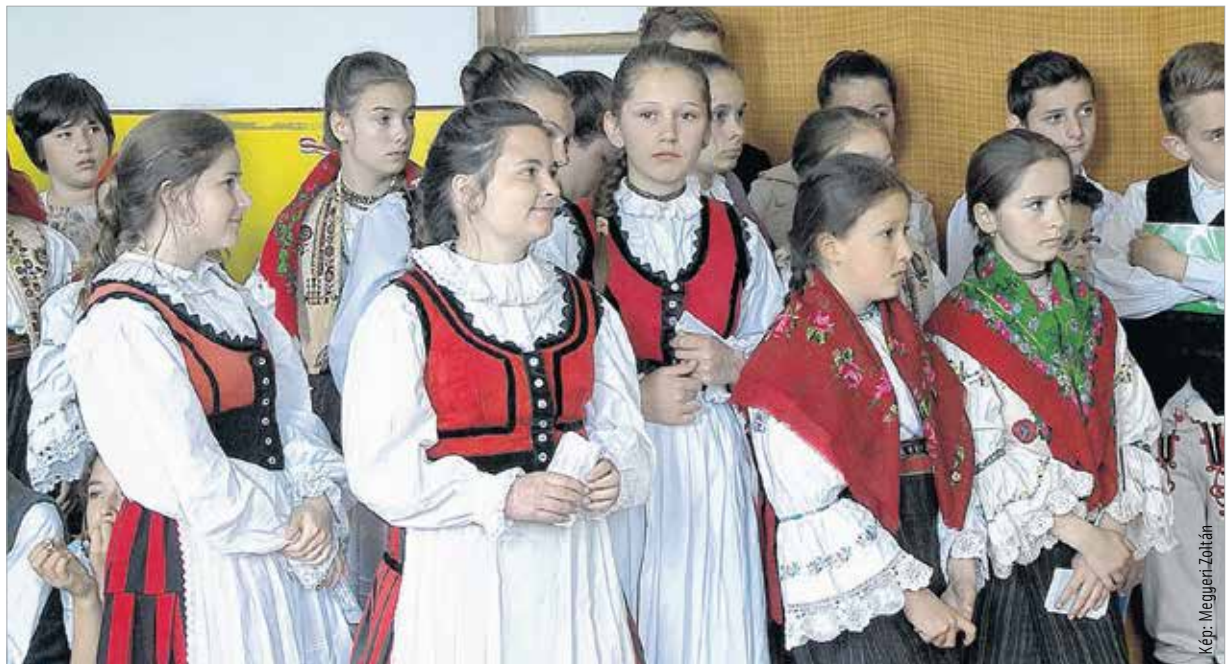
„S fogcsikorgatva hirdetem: / nem ért véget a küzdelem! / Mert valami még megmaradt. / Görcs zibbasztja a markomat, / de markomban még itt a Szó: / a láthatatlan lobogó!” (Wass Albert)