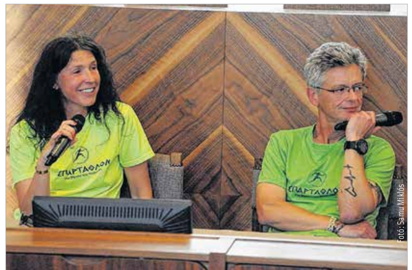
Mesélni mosolyogva is lehet a spartathlonról – lefutni aligha...