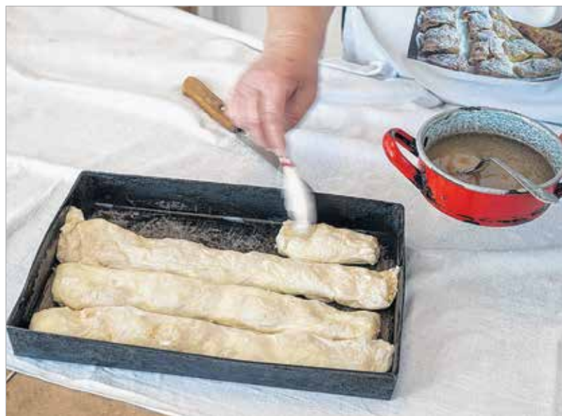
Még egy kis zsír, hogy ne száradjon ki