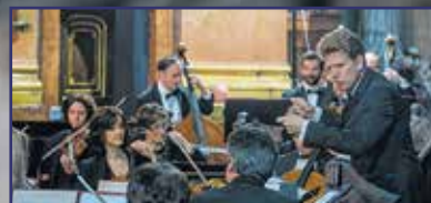
Haydn-varázs a bazilikában