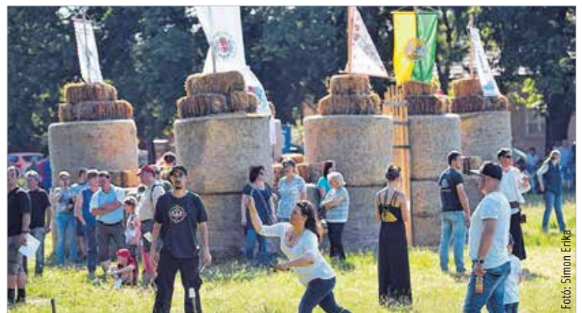
Régi harci dicsőségeinket őrzi az ifjak mentalitása. Apáikra emlékezve játékos ostrommal vették be a várat.