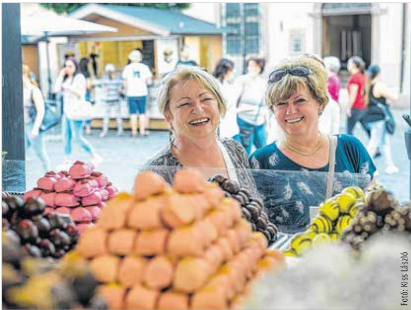
Mi szem-szájnak ingere...