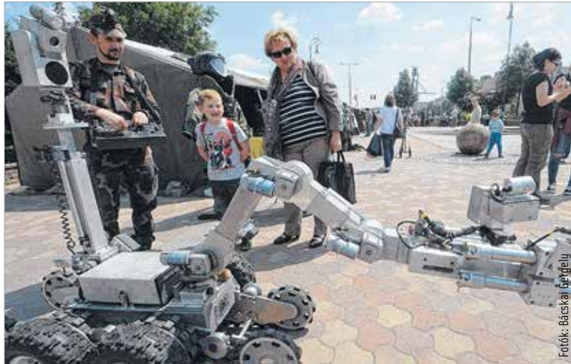
A programokkal az a cél, hogy bárki betekintést nyerhessen a katonák mindennapi életébe és a fiataloknak is megmutassák a honvédelem érdekességeit

A Fehérvár katonái rendezvényen a Liszt Ferenc utca bejáratánál ünnepélyes keretek között indították útjára az ideai adománygyűjtő programot. A „Mind egy szálig” akció keretében május 27-ig min-