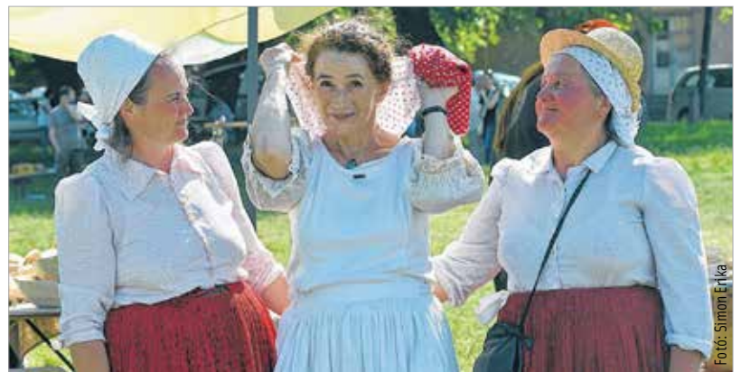
A Botond-nap a hagyományőrzés és a tiszta szívek napja. Az öltözetek is azt mutatják, eleink tisztasága és becsülete ma is alapvető egy hasonló rendezvényen.