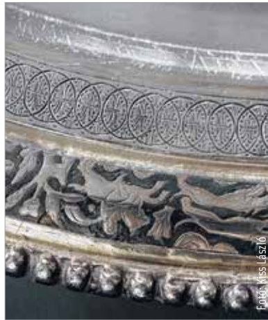
Mikor kerül elő újabb tárgy a Seuso-kollekcióból?

A Fehérvár magazin hasábjain is többször foglalkoztunk már a Seuso-üggyel kapcsolatos különböző felvetésekkel.