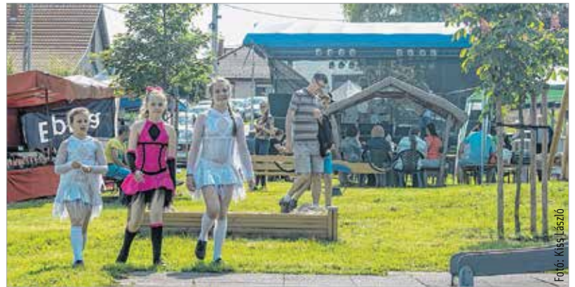
A csalai majálison minden generáció megtalálhatta a neki tetsző programot