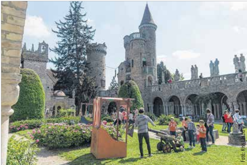
A Bory-vár családi napján, Székesfehérvár egyik legszebb helyszínén színes, változatos programokkal tölthették el az időt szülők és gyermekek

A feljebbvaló is felettebb elégedett lehet földi dolgainkkal, hiszen varázslatos hétvégével ajándékozott meg bennünket. Ennek megfelelően Csalán és Feketehegy-Szárazréten igazi majális, a Bory-várban családi nap, a vásártéren hagyományőrző Botond-ünnep, míg a belvárosban az édességek végtelen tárháza nyílt ki erre az egy napra. „Ingyen idő májusi potomság, csillagerővel nyílnak a rózsák.” – írta a kora nyár dalnoka, Utassy József. Ezen a hétvégén megtapasztalhattuk, hogy nemcsak a rózsák, de a szívek is kinyíltak.