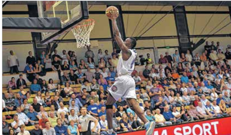
Pénteken visszavágó: az Alba megmutathatja Pakson is, mi az a kosárlabda

és bizonyára úgy jött kedden a Gáz utcába, hogy megmutatja, micsoda erőt merített ebből. Ehhez képest egy negyed után már hússzal vezetett, végül hatalmas fölényrel nyert az Alba (96-68). Remek védekezés, lehenyerlő támadások, erőfitogtatás, győzel-