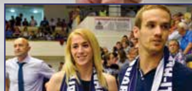
Bejött a padlógáz! 31. oldal