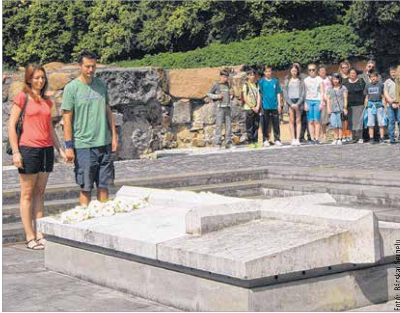
A trianoni országhatárok sem szakíthatták szét a magyar nemzetet

Székesfehérvár a Nemzeti Emlékhelyen szervezett megemlékezést, ahol a gyergyószentmiklósi Batthyány Ignác Technikai Kollégium diákjainak műsora mellett a város polgármestere bejelentette az Országzászló tér felújítását