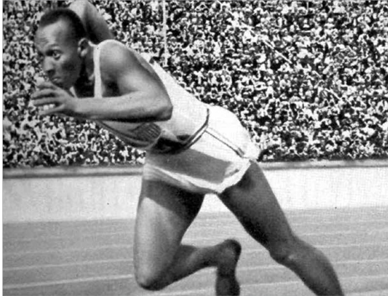
Visszaemlékezések szerint Jesse Owens diadalmenete idegesítette Hitlert, de az vitatott, kezelt-e az olimpiai stadion legnagyobb sztárjával

Az olimpiai eszme nagysága újabb nagy szimbólumokban került elő. Volt Berlinben felcsendülő harangszó, amely felszólított a küzdelmekre. A győztesek tölgyfacsemetét kaptak, hogy hazájukban ültessék el. És ekkor először érkezett meg a játékok helyszínére az olimpiai láng Olümpiából, a játékok bölcsőjétől. Szintén állandósult motívumként