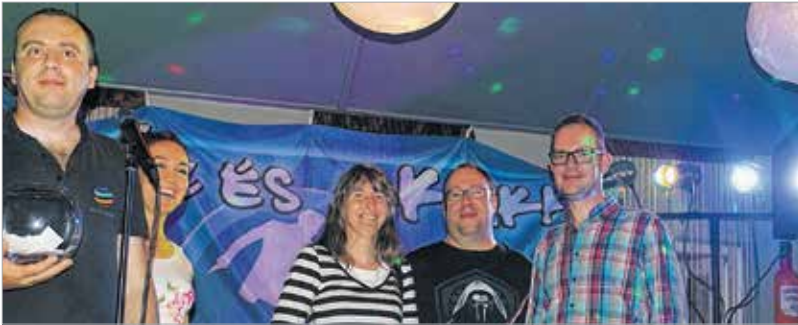
A tombola fődíja egy tablet volt

Pénteken nagy sikerrel lezajlott a Vörösmarty Rádió közönségtalálkozója az egyik fehérvári vendéglátóhelyen. A szép számmal érkező hallgatók személyesen is megismerhették az éterből már ismerős „hangokat”, és nemcsak a rádió szerkesztőit, műsorvezetőit, de azokat az állandó vendégeket is, akik hétről hétre színesítik a műsort. A találkozó végén Bokányi Zsolt zenekara, a Boka és a klikk szórakoztatta a közönséget.