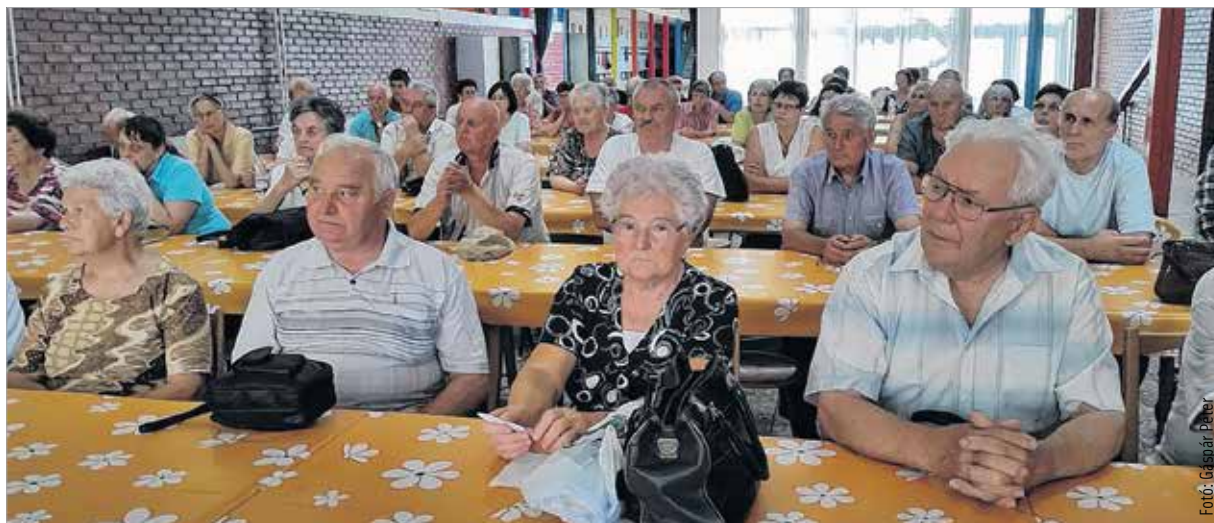
A polgármester a fehérváriaktól azt kéri, hogy ha bevezetik az új rendszert, az első hetek tapasztalatai nyomán jelezzék észrevételeiket az önkormányzatnak

Június 12-én, vasárnap 15 órakor adják át a játszótérrel a Csapó utca mellett, az átadásra mindenkit szeretettel várnak!