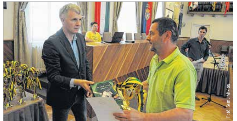
Az Alba Liga városi kispályás bajnokság 2015/2016-os idényének legjobb csapatai vehették át az érmeiket és serleget a Városháza dísztermében. A most véget ért szezonban hetvenkét csapat szerepelt a liga különböző osztályaiban. A fehérvári az egyik legjobban szervezett városi bajnokság. S. Z.