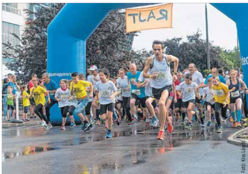
A futók részére kijelölt ezerhatszáz méteres útvonal érintette a Rákóczi utat és a Várkörutat

megvalósuló sportprogramon közel ezerötszázan vettek részt. A futók részére kijelölt ezerhatszáz méteres útvonal érintette a Rákóczi utat és a Várkörutat. A bemelegítő kör után a családi csapatok, a munkahelyi váltók és az egyéni futók mezőnyét egyszerre rajtoltatták el a szervezők. A legkitartóbbak 9.6 kilométert teljesítettek, de volt, aki levezetésként az ezt követő Depónia-futáson is rajthoz állt. Ahogy Hirt Károly ARAK-elnök többször hangsúlyozta, nem a versenyzésen, hanem a közösségépítésen van a hangsúly: ahogy a céges csapatok, úgy maga a futóközösség is egyre összetartóbb.