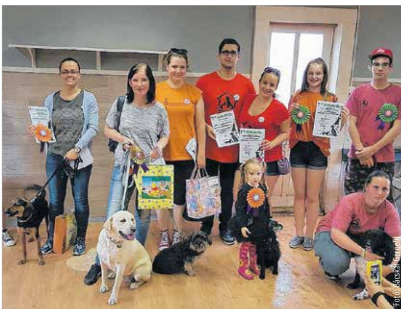
Egész napos program várta a nyílt nap résztvevőit

szolgálatában. A Takarodó út 5. szám alatti menhely számos rendezvénye közül kiemelkedik a hagyományos nyílt nap, amit minden év júniusának elején rendeznek érdeklődők százezreinek részvételével. Itt mutatják be a munkatársak és az önkéntesek mindennapi munkájának, rendkívüli erőfeszítéseinek eredményeit, és szórakoztatják az állatbarátokat, a családokat. Idén június 5-én, vasárnap rendezték meg a nyílt napot, ahol egész napos programsorozattal várták az érdeklődőket.