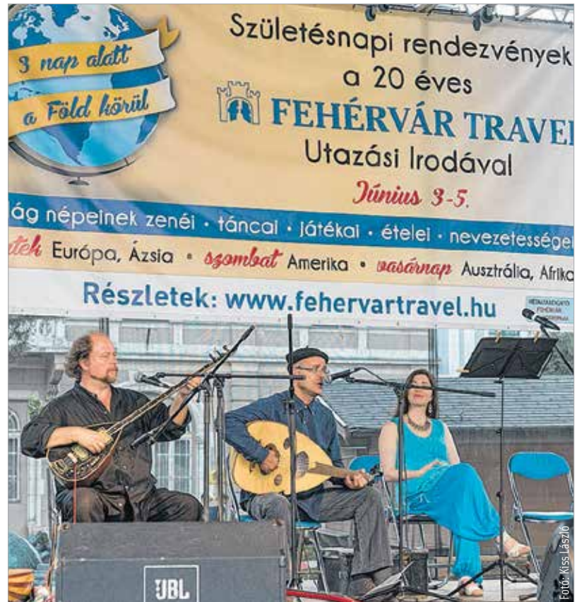
Estéknként zenés programokkal ünnepelt a fehérvári utazási iroda

A gyerekeknek is tartogattak meglepetéseket a szervezők: lehetőség volt kipróbálni a Népek játéka