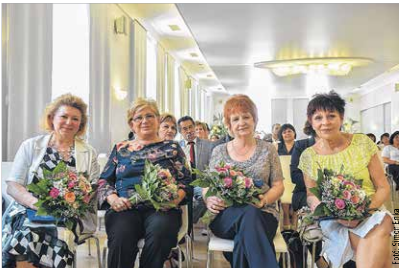
A pedagógusnap alkalmából a nyugdíjba vonuló intézményvezetők vehettek át elismerést

Székesfehérvár polgármestere szerint azt kell megvizsgálni, hogy az oktatási intézmények megújítására miként lehet forrást találni. „A kérdés tehát szerintem nem az állami átvétel, hanem hogy lesznek-e pénzügyi források az iskoláink és az ott folyó szakmai munka megújítására. Amennyiben a mostani átalakítással csak simán átvesszi az állam a működtetést, elvonja az ehhez szükséges forrásokat az önkormányzatoktól, azzal nem oldódnak meg az oktatási infrastruktúrájával kapcsolatos valódi problémák.” – írta blogbejegyzésében Cser-Palkovics András. Az urbanusblog.hu oldalon illetve a polgármester Facebook-oldalán is megtalálható bejegyzésből az is kiderül, hogy Székesfehérvár saját forrásaiból megközelítőleg évente egymilliárd forintot költ az iskolák működtetésére, másik egymilliárd forintot pedig különböző intézményeinek felújítására. A működési források felújításra történő átcsoportosításával nagyságrenddel több pénz állna rendelkezésre. Ez az uniós forrásokkal együtt már pár év alatt is látványos eredményeket hozhatna. Cser-Palkovics András azt szorgalmazza, hogy amit helyben a gazdaság „megtermel”, helyi adó-ban befizet, azt hadd fordítsa az iskoláira a helyi közösséget képviselő önkormányzat.