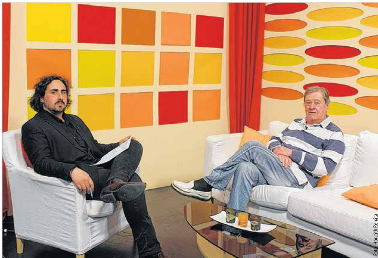
Koós János a Fehérvár Tv-ben elárulta, hogy nagy meglepetéssel készül a fehérváriaknak

Zenészek hosszú évtizedek óta próbálkoznak azzal, hogy olyanok legyenek, mint a Beatles. Ez nem véletlen, mint ahogyan az sem, hogy ez keveseknek sikerül. A „zajt” mindenki meg tudja tanulni. Amikor az autórádióból szólnak a modern zenék, egy idő után bekapcsolom Pavarottit és fellélegzem. Végre zene! Én csak komolyzenét hallgatok. De látok azért most is zseniális palikat. Nagyon szeretem a feketét, utánozhatatlanul tudnak zenélni. Ahogy senki nem tudja úgy eljátszani a magyar nótát, mint egy cigány. Én egy cigány gyerekkel ültem egy padban gimnáziumban. De az annyira szeretett engem, hogy képes