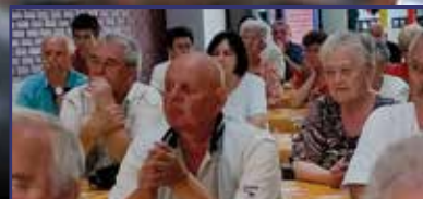
Tizenhárom perc a kórház 3. oldal