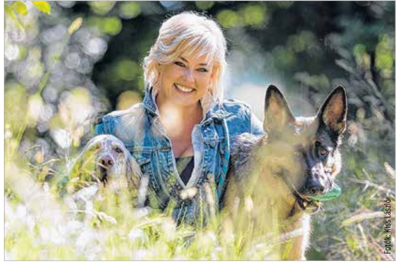
A kutya a világ legjobb stresszoldója