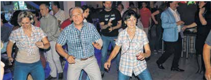
Az úri közönség táncol