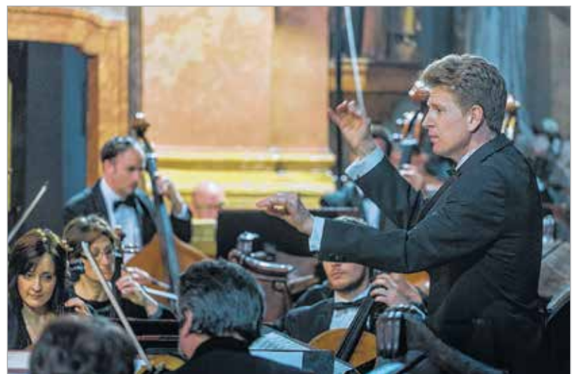
A karnagy nagy ívű pályájának alapja a zene feltétlen tisztelete