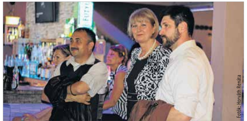
Velünk voltak a rádió állandó vendégei is