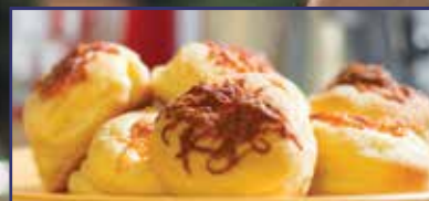
Ilyen a tökéletes pogácsa! 27. oldal