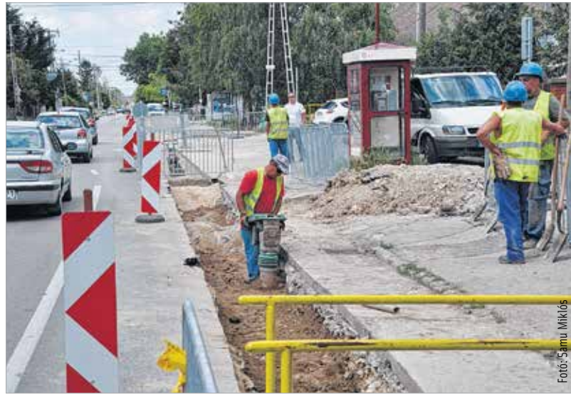
A gázszolgáltatás szüneteléséről az adott munka megkezdése előtt tizenöt nappal értesítik az érintett fogyasztókat

Ezután mennek tovább a Beregszászi úttól a Bártfai utcáig terjedő szakaszra, itt már kisebb forgalmi akadályok lesznek, csak felpályás forgalomkorlátozás várható. Majd a Fiskális út és a Bártfai utca csomópontjától haladnak a Késmárki utcáig, itt is lámpás irányítás lesz. Majd az utolsó szakasz következik a Pozsonyi úti körforgalomig. Ezzel párhuzamosan végzik a Pozsonyi úton a gázvezetékcsere a Videoton Oktatási Központig. A Pozsonyi úton csak egy kisebb szakaszon, az óvoda előtt kell felpá-