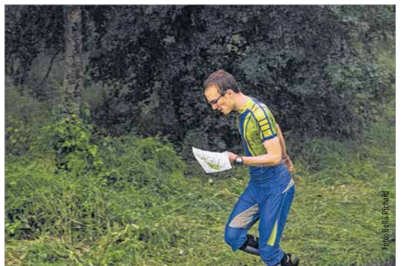
A pálya, a térkép, a futó – minden elázott a szombati viharban