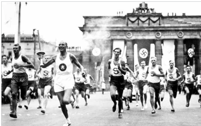
Futás a fáklyával, háttérben a Brandenburgi kapu, a korszak jelképeivel

lovaspólo. A legtöbb versenyszámot (29) atlétikában rendezték, és az olimpiatörténelem egyik legnagyobbja is a stadionban jeleskedett: az amerikai Jesse Owens, egy tízgyermekes család másodszülött fia, aki huszonhárom évesen négy aranyérmét szerzett. Nem az ismeretlenségből érkezett, hiszen 1935 májusában egyetlen napon négy világcúcsot ért el. Fekete sportolónak a náci párt által irányított Németországban mindenkit elhomályosított, jelentőségét a történelmi háttér alapján is ki kell emelni.