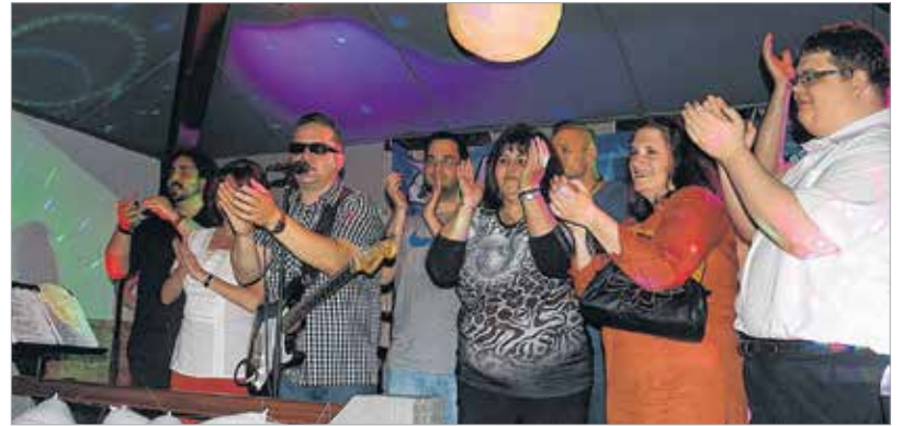
A rádióhallgatókat illeti az igazi taps!